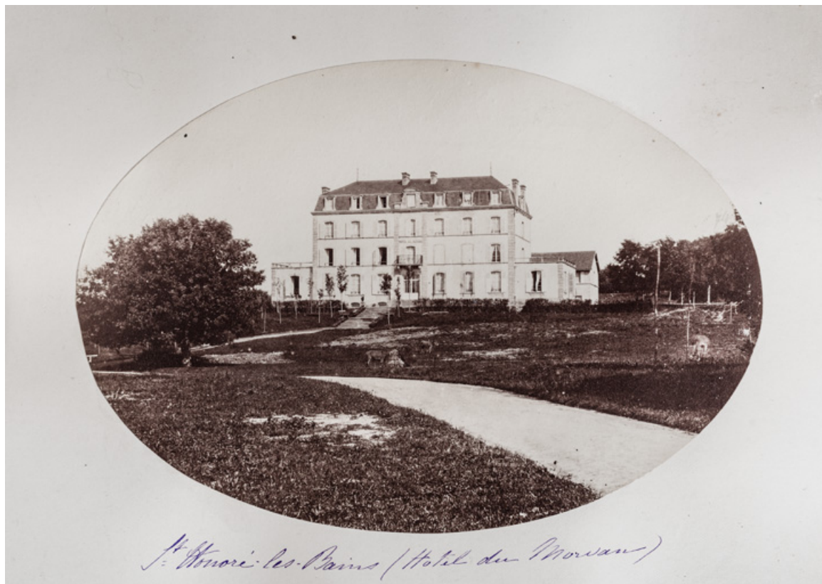
Façade sur le parc avant la construction des pavillons latéraux.

58, Saint-Honoré-les-Bains, 9 avenue Jean Mermoz