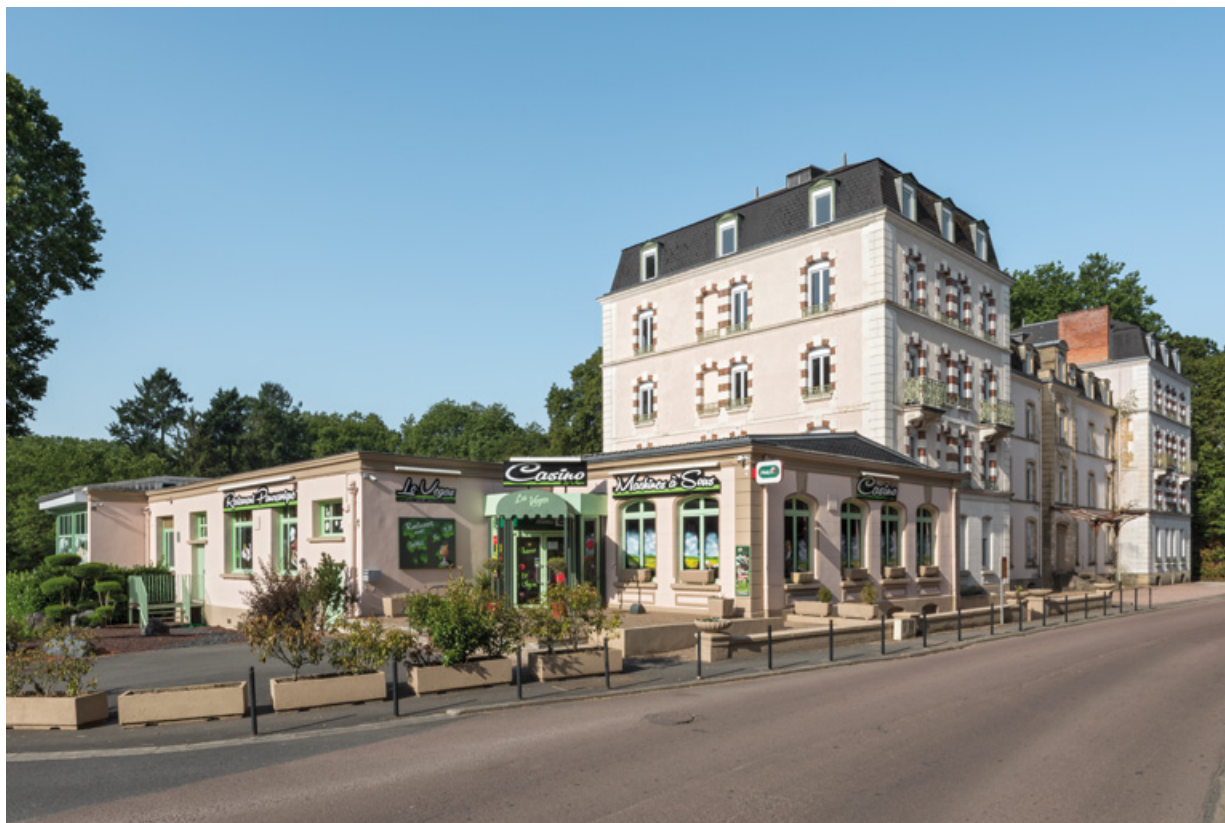
Vue d'ensemble depuis l'avenue Jean Mermoz.

58, Saint-Honoré-les-Bains, 9 avenue Jean Mermoz