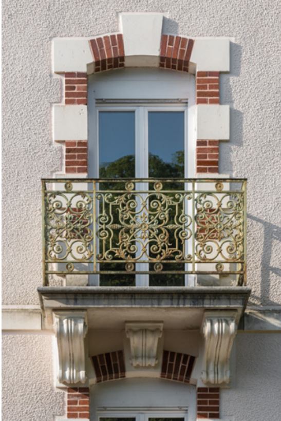
Pavillon occidental, balcon et garde-corps, vue de face. 58, Saint-Honoré-les-Bains, 9 avenue Jean Mermoz