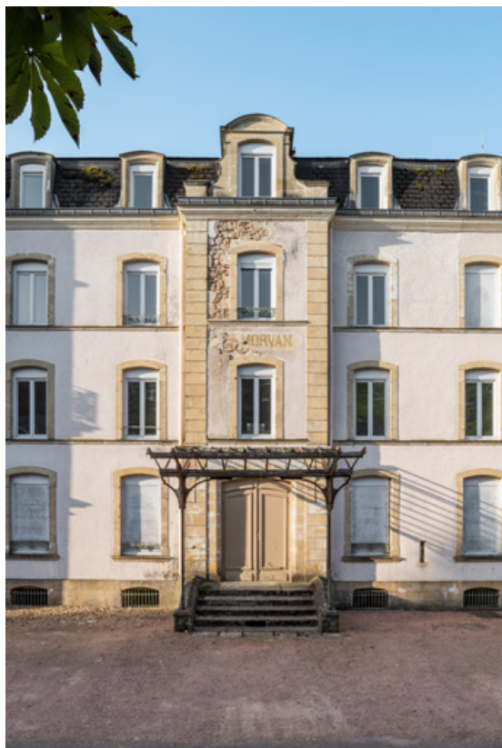
Travée centrale de la façade sur l'avenue Jean Mermoz.

58, Saint-Honoré-les-Bains, 9 avenue Jean Mermoz