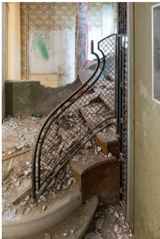
Escalier ouest, détail, rampe d'appui.

58, Saint-Honoré-les-Bains, 9 avenue Jean Mermoz