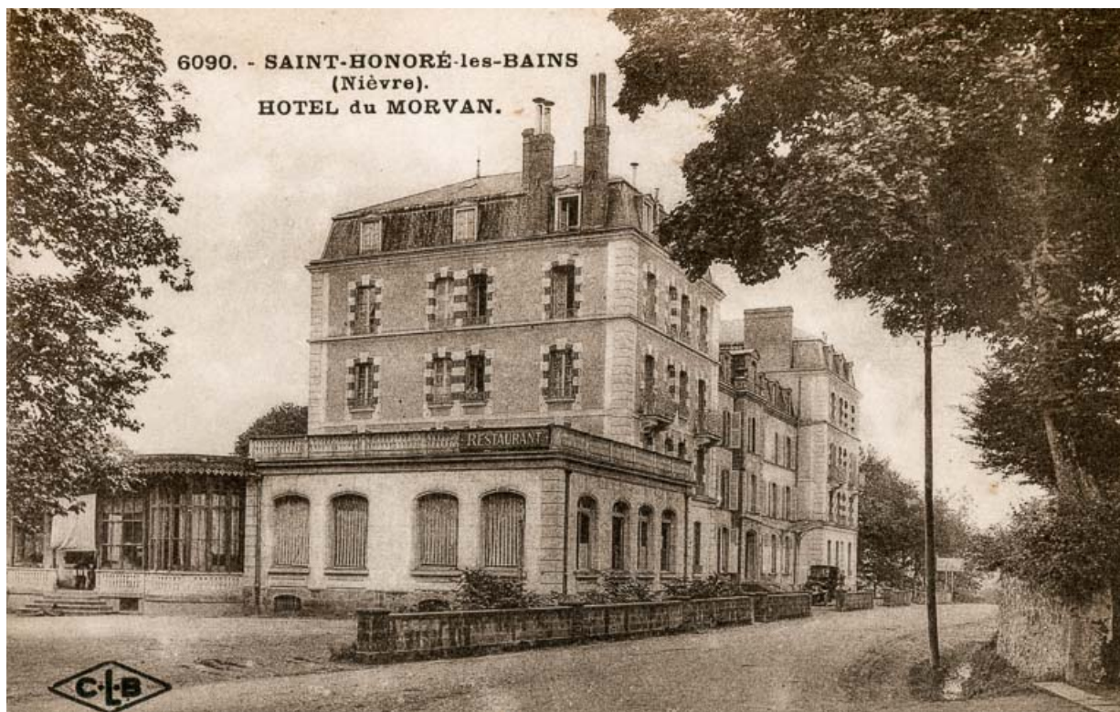
Façade sur l'actuelle avenue Jean Mermoz avant l'agrandissement du restaurant. 58, Saint-Honoré-les-Bains, 9 avenue Jean Mermoz