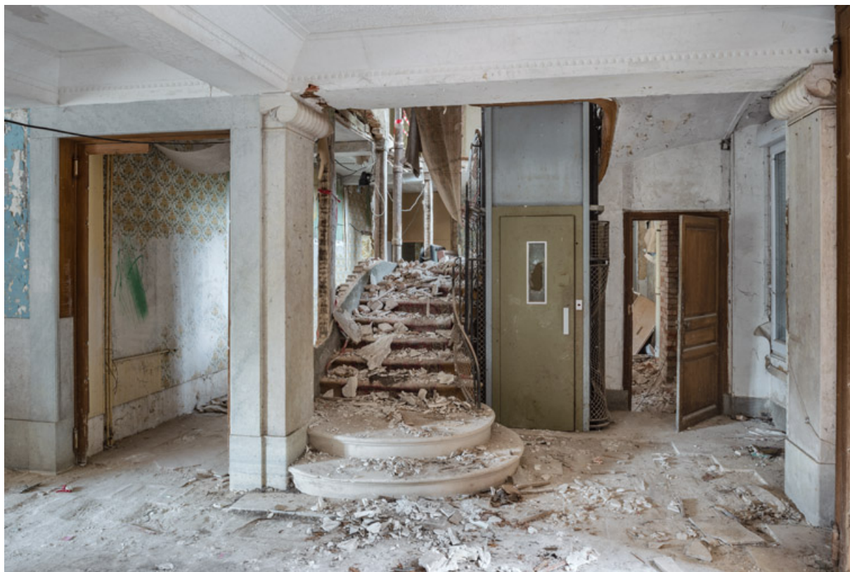
Hall d'entrée au rez-de-chaussée, vue en direction de l'ouest.

58, Saint-Honoré-les-Bains, 9 avenue Jean Mermoz