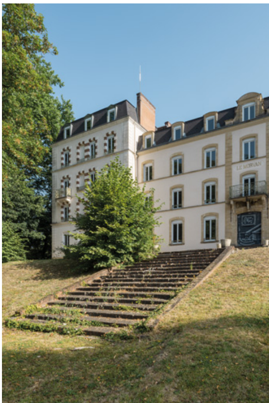
Perron de la façade sur le parc thermal.

58, Saint-Honoré-les-Bains, 9 avenue Jean Mermoz