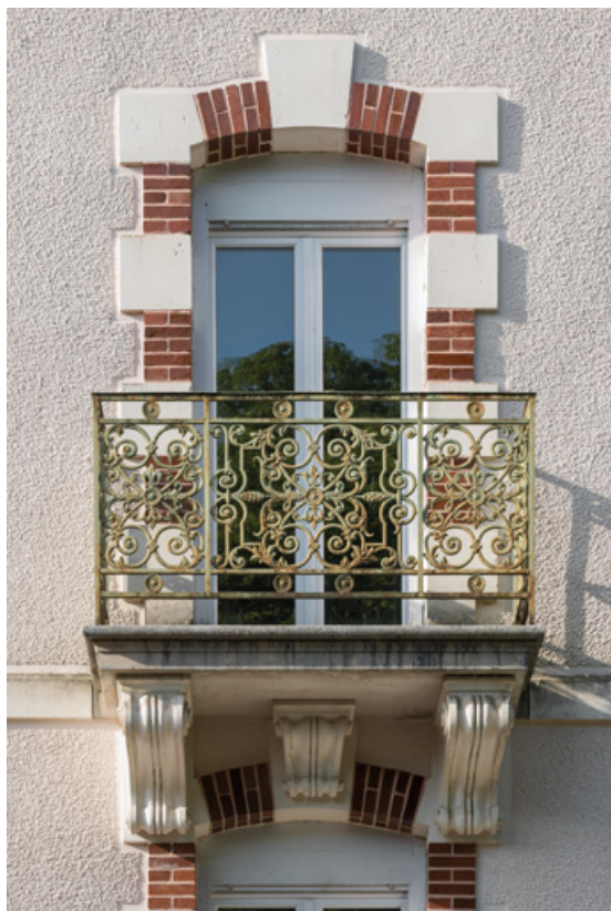
Pavillon occidental, balcon et garde-corps, vue de face.

58, Saint-Honoré-les-Bains, 9 avenue Jean Mermoz