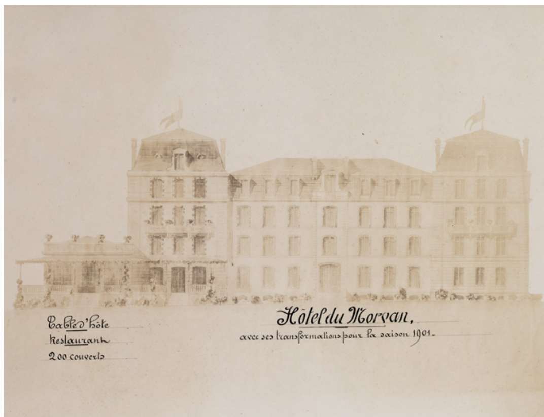
Façade sur le parc après la construction des pavillons latéraux.

58, Saint-Honoré-les-Bains, 9 avenue Jean Mermoz