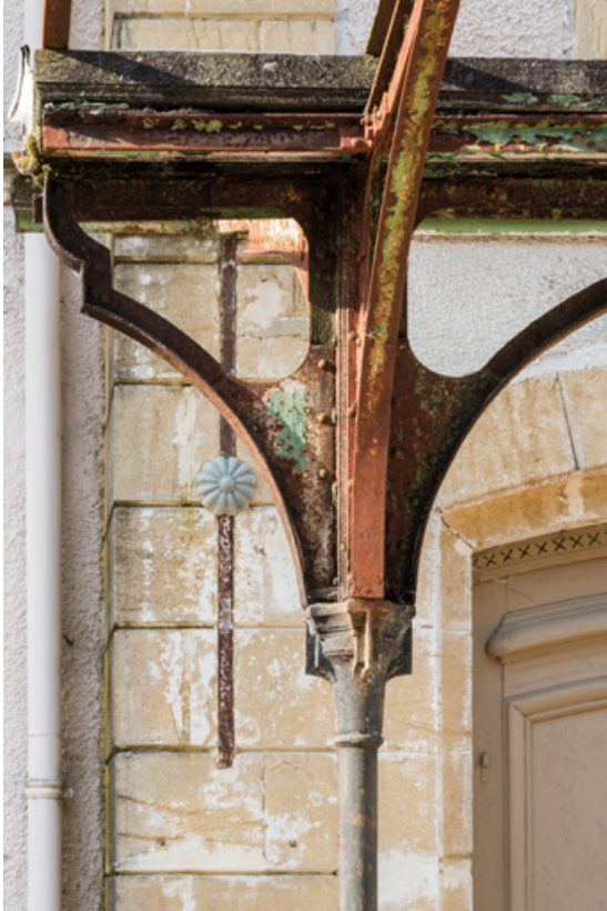
Marquise de la façade sur l'avenue, détail.

58, Saint-Honoré-les-Bains, 9 avenue Jean Mermoz