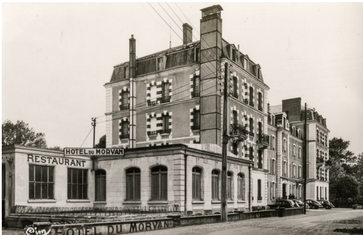
Façade sur l'actuelle avenue Jean Mermoz après l'agrandissement du restaurant. 58, Saint-Honoré-les-Bains, 9 avenue Jean Mermoz