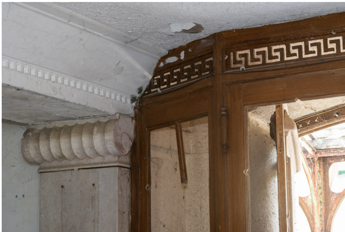
Décor de l'huissierie du sas de l'entrée côté avenue, frise ajourée de grecques.

58, Saint-Honoré-les-Bains, 9 avenue Jean Mermoz