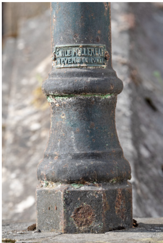
Marquise de la façade sur l'avenue, plaque de firme. 58, Saint-Honoré-les-Bains, 9 avenue Jean Mermoz