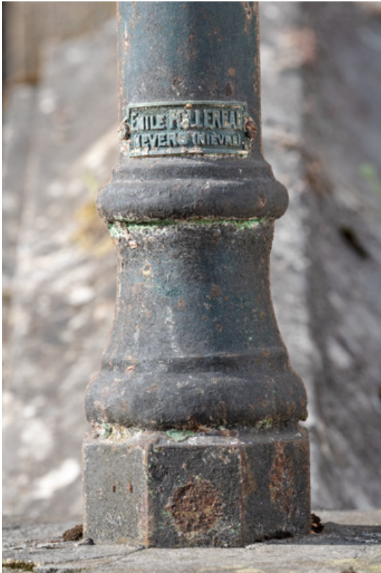
Marquise de la façade sur l'avenue, plaque de firme. 58, Saint-Honoré-les-Bains, 9 avenue Jean Mermoz