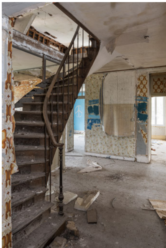
Escalier secondaire conduisant du deuxième au troisième étage du pavillon est. 58, Saint-Honoré-les-Bains, 9 avenue Jean Mermoz