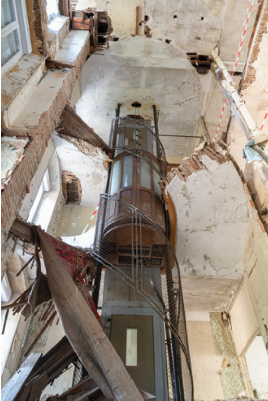
Ascenseur de l'escalier ouest, vue d'ensemble après l'effondrement des planchers. 58, Saint-Honoré-les-Bains, 9 avenue Jean Mermoz