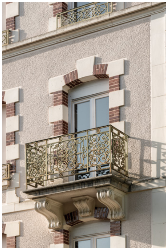
Pavillon occidental, balcon et garde-corps, vue de trois-quarts.

58, Saint-Honoré-les-Bains, 9 avenue Jean Mermoz