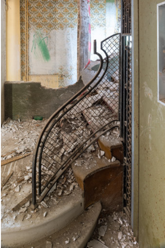
Escalier ouest, détail, rampe d'appui.

58, Saint-Honoré-les-Bains, 9 avenue Jean Mermoz