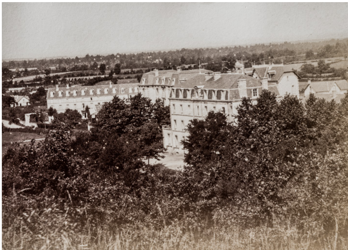
Situation de l'hôtel avec l'Hôtel Bellevue et la Villa Vaux-Martin, vue depuis les Garennes en 1883.

58, Saint-Honoré-les-Bains, 9 avenue Jean Mermoz