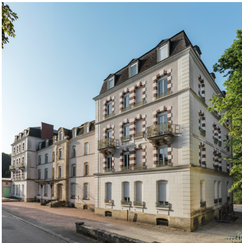
Façade sur l'avenue Jean Mermoz, vue depuis l'ouest.

58, Saint-Honoré-les-Bains, 9 avenue Jean Mermoz