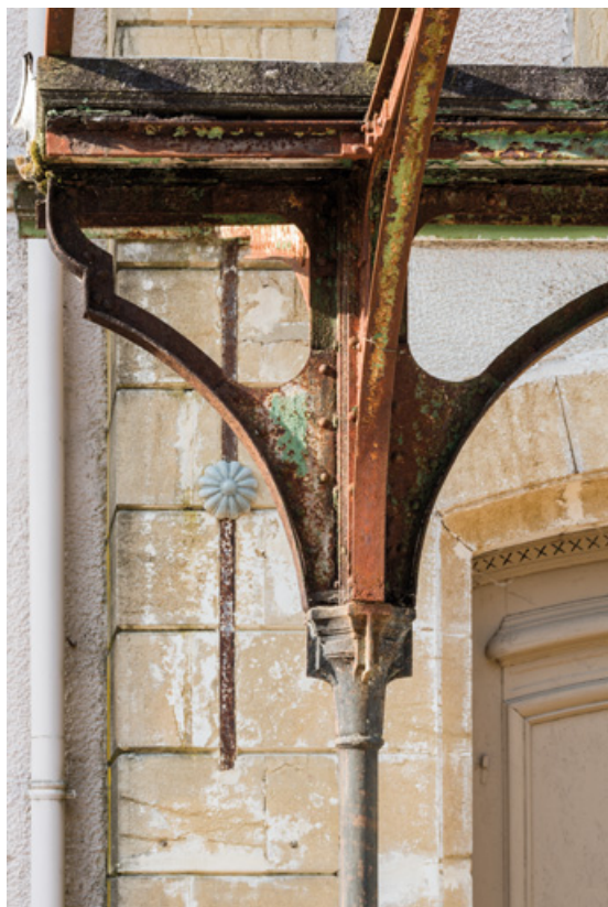
Marquise de la façade sur l'avenue, détail.

58, Saint-Honoré-les-Bains, 9 avenue Jean Mermoz