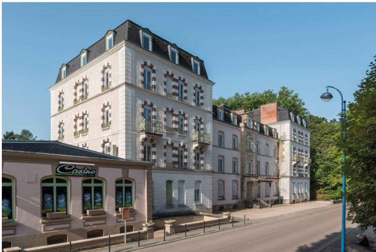
Façade sur l'avenue Jean Mermoz, vue depuis l'est.

58, Saint-Honoré-les-Bains, 9 avenue Jean Mermoz