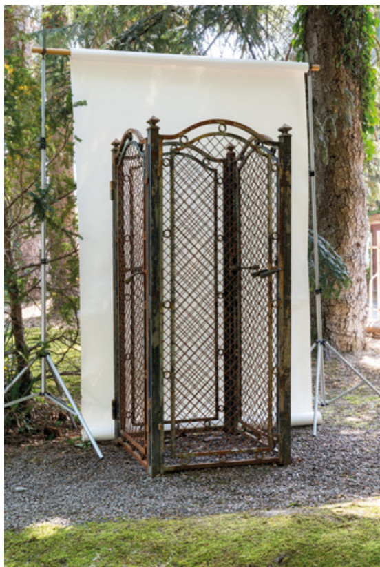
Vantaux de l'ascenseur de l'escalier ouest de l'Hôtel Le Morvan, dans le jardin de la Villa Les Romains. 58, Saint-Honoré-les-Bains, 9 avenue Jean Mermoz