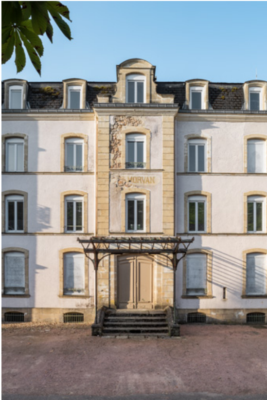
Travée centrale de la façade sur l'avenue Jean Mermoz.

58, Saint-Honoré-les-Bains, 9 avenue Jean Mermoz