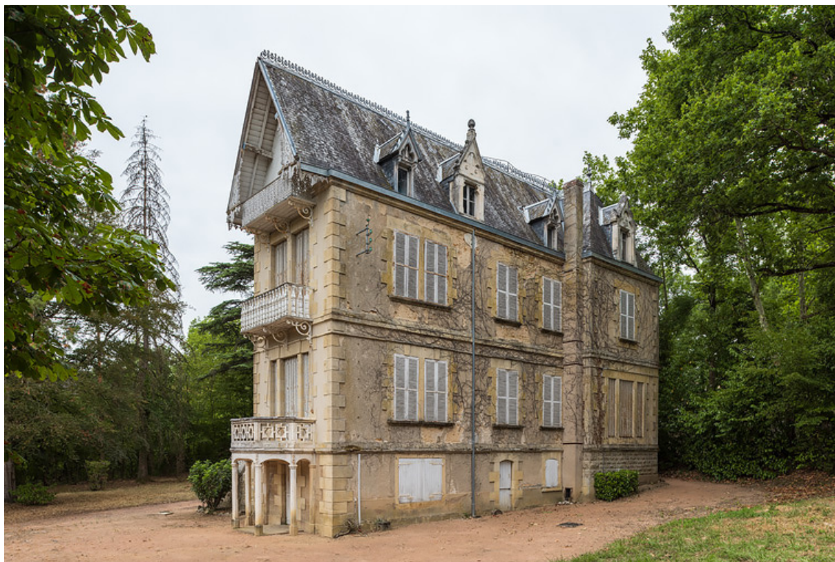
Façade sur le jardin du corps oriental.

58, Saint-Honoré-les-Bains, 8 avenue Jean Mermoz