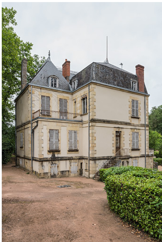
Élévation sud-ouest, vue depuis l'ouest.

58, Saint-Honoré-les-Bains, 8 avenue Jean Mermoz