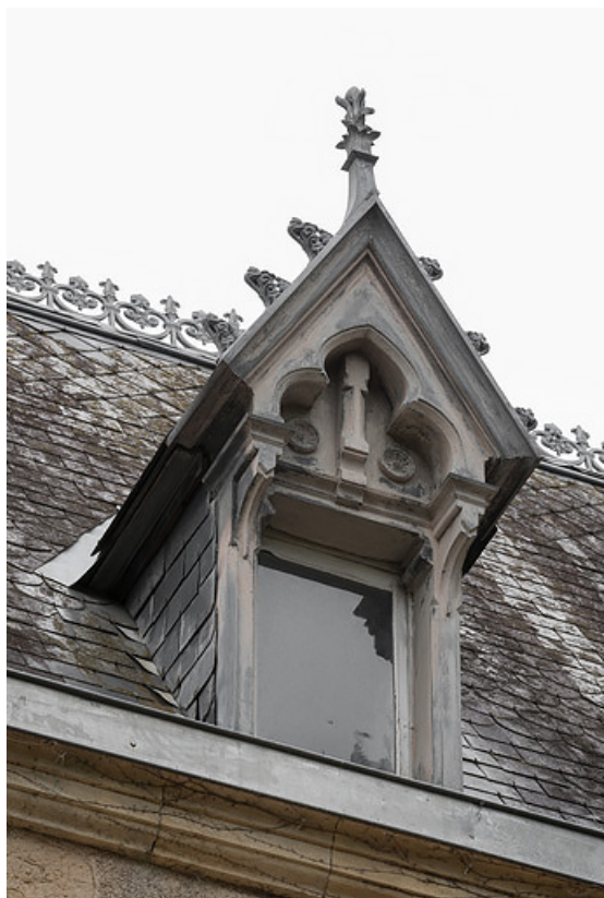
Lucarne (troisième type) du corps oriental.

58, Saint-Honoré-les-Bains, 8 avenue Jean Mermoz