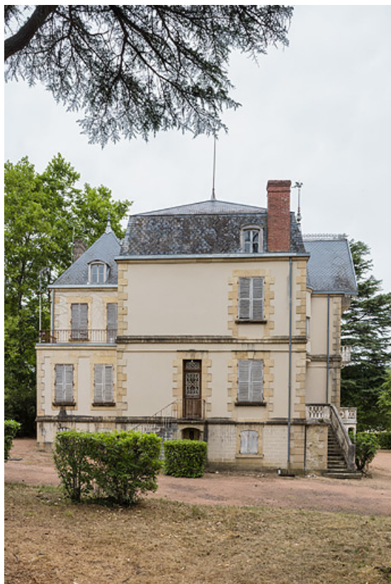
Élévation sud-ouest, vue depuis le sud-ouest.

58, Saint-Honoré-les-Bains, 8 avenue Jean Mermoz