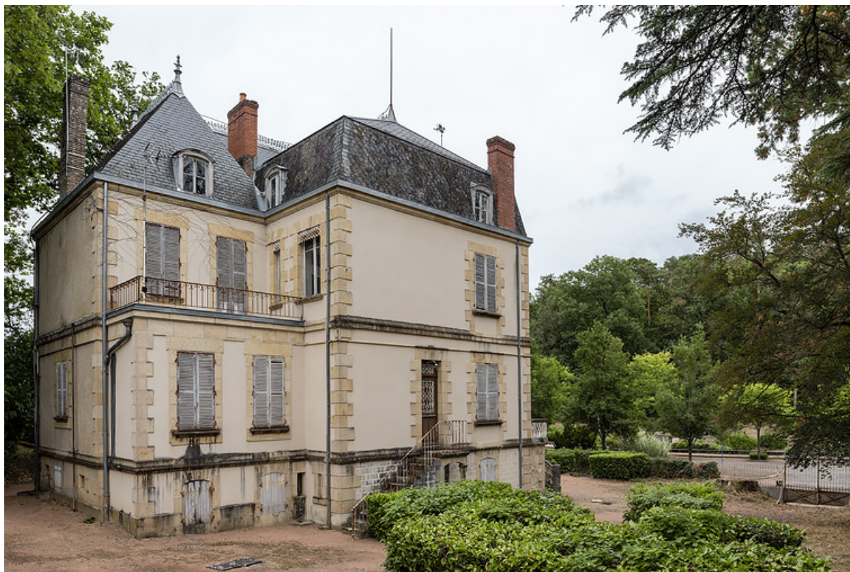
Élévation sud-ouest, vue depuis l'ouest.

58, Saint-Honoré-les-Bains, 8 avenue Jean Mermoz