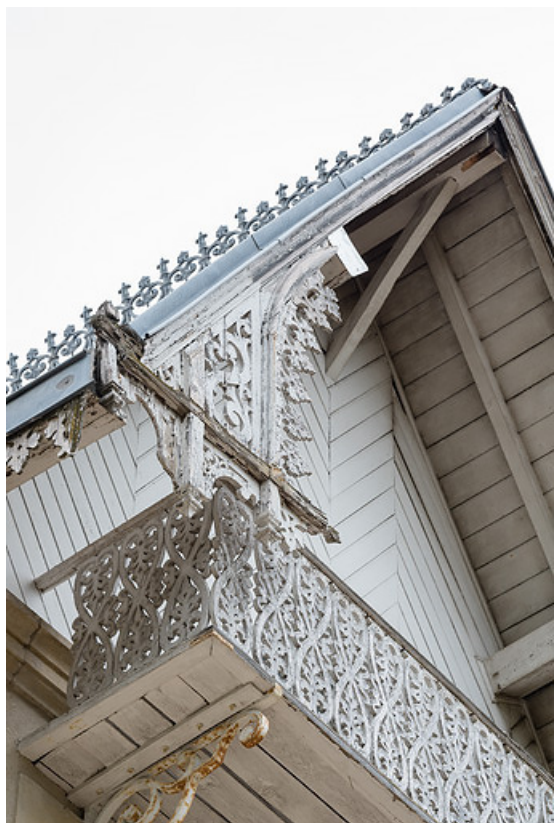
Lambrequins et garde-corps du balcon en bois ajouré.

58, Saint-Honoré-les-Bains, 8 avenue Jean Mermoz