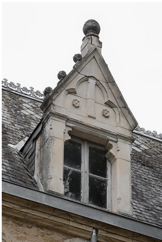
Lucarne (deuxième type) du corps oriental.

58, Saint-Honoré-les-Bains, 8 avenue Jean Mermoz