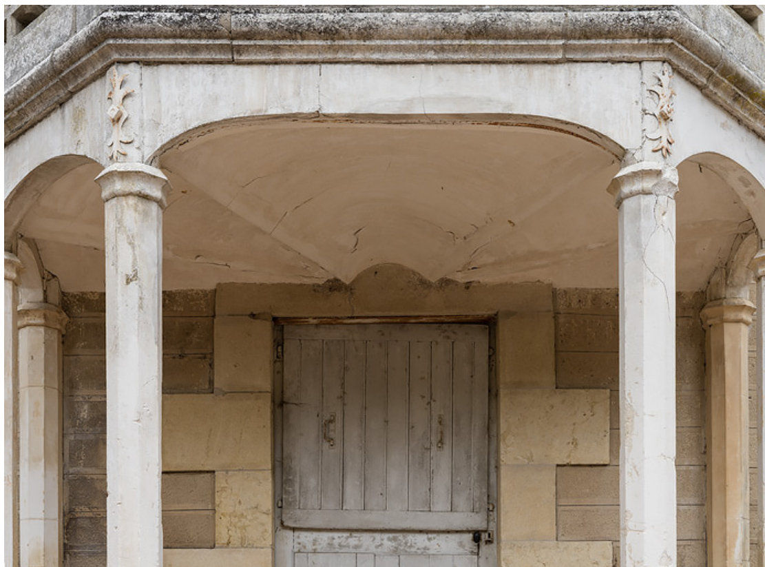
Balcon du rez-de-chaussée surélevé reposant sur une voûte en éventail armée.

58, Saint-Honoré-les-Bains, 8 avenue Jean Mermoz