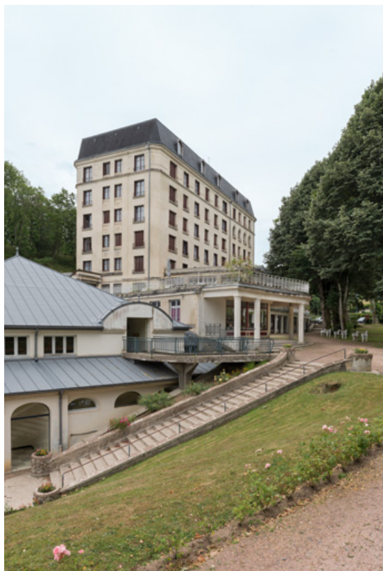
Façade sur le parc après la transformation de la toiture.

58, Saint-Honoré-les-Bains, 16 rue Joseph Duriaux