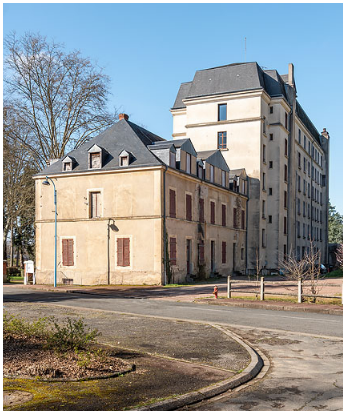
Façade postérieure, vue depuis la rue, avec l'Hôtel des Bains (à gauche).

58, Saint-Honoré-les-Bains, 16 rue Joseph Duriaux