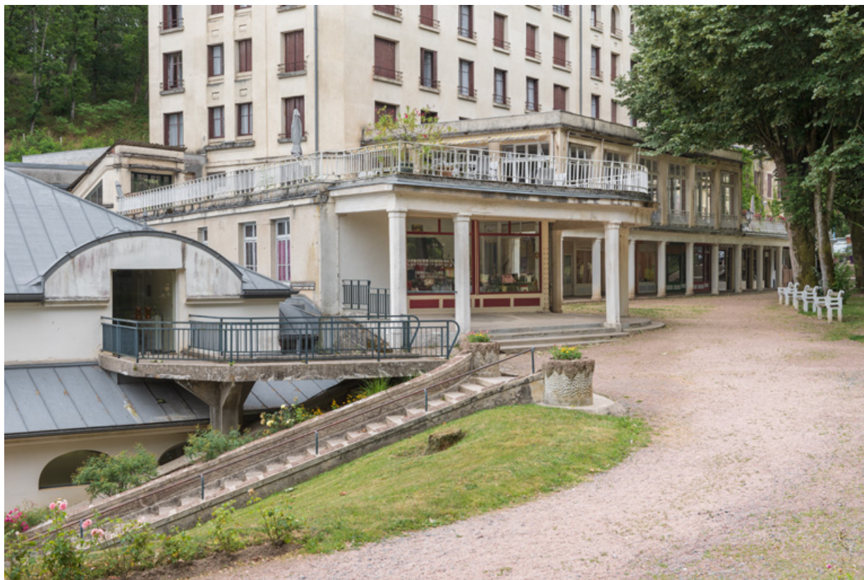
Portique de l'étage de soubassement et rampe descendant à l'établissement thermal.

58, Saint-Honoré-les-Bains, 16 rue Joseph Duriaux