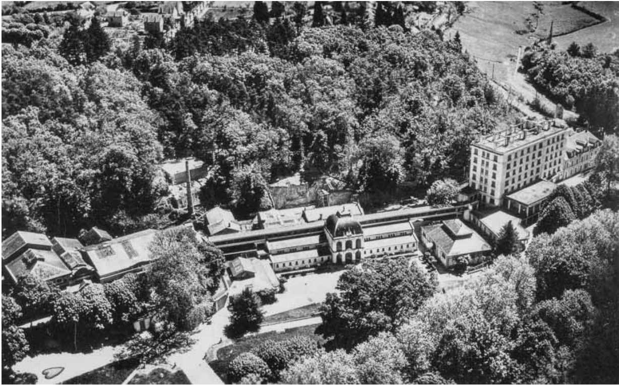
Vue aérienne vers 1955.

58, Saint-Honoré-les-Bains avenue du Docteur Segard