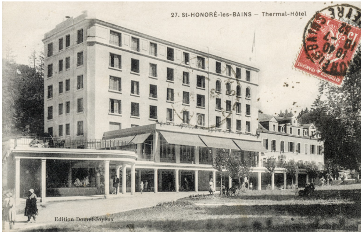
Façade sur le parc avant la transformation de la toiture.

58, Saint-Honoré-les-Bains, 16 rue Joseph Duriaux