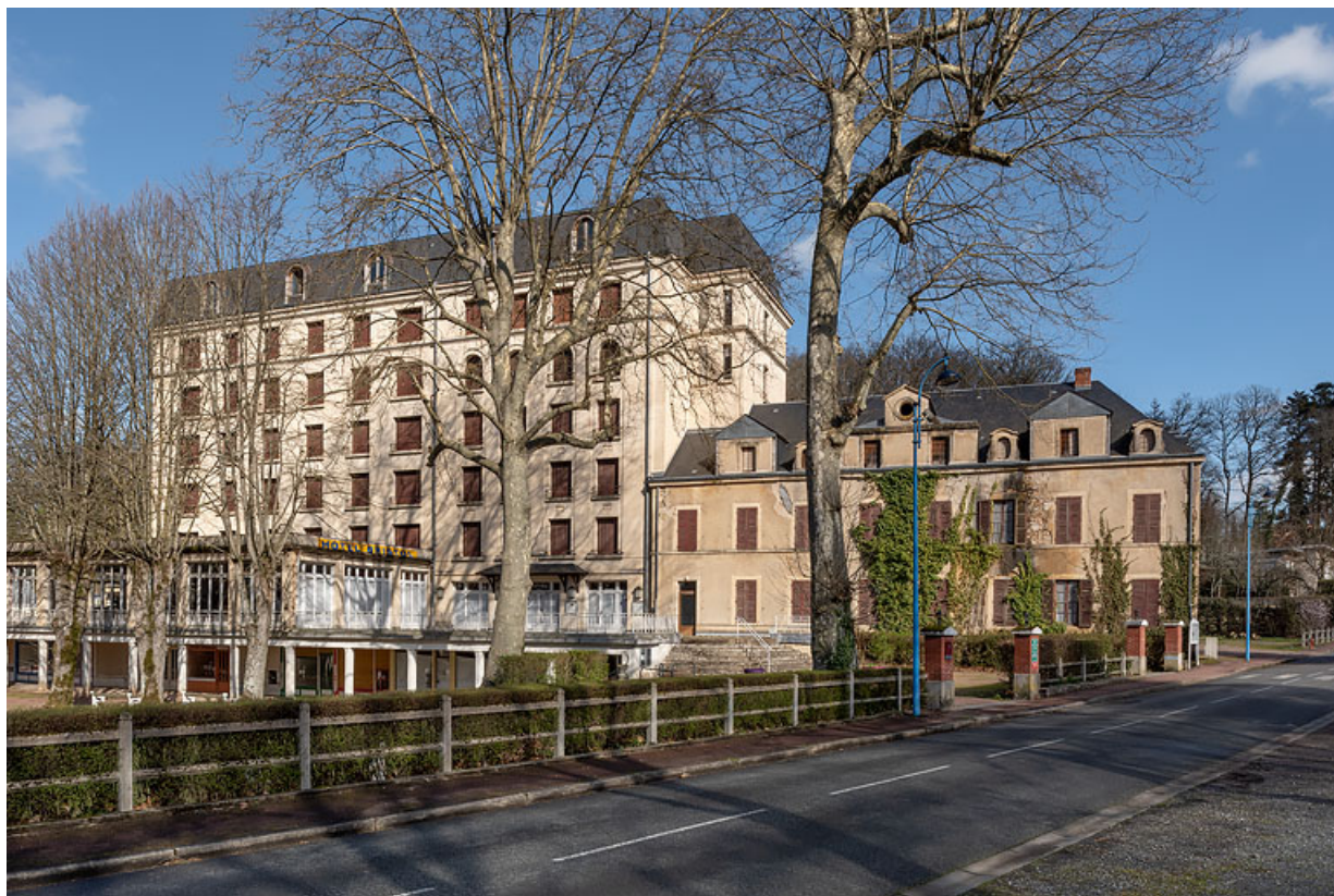
Façade antérieure, vue depuis la rue, avec l'Hôtel des Bains (à droite).

58, Saint-Honoré-les-Bains, 16 rue Joseph Duriaux