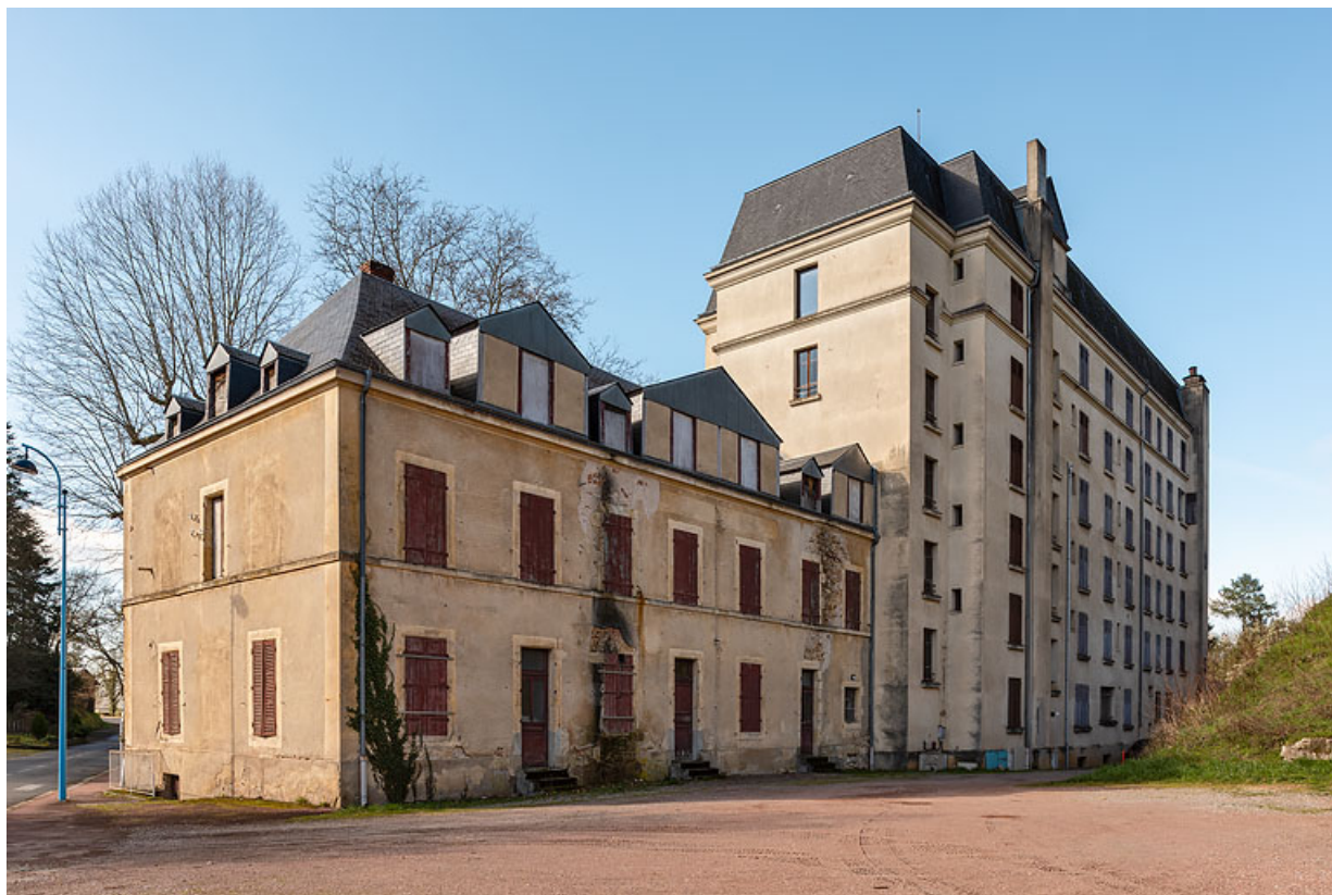
Façade postérieure, vue depuis la rue, avec l'Hôtel des Bains (à gauche).

58, Saint-Honoré-les-Bains, 16 rue Joseph Duriaux