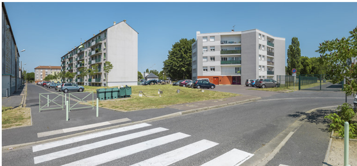
Bâtiment E, SIDEN et X depuis la place Pierre et Marie Curie. 58, Cosne-Cours-sur-Loire, 6 place Pierre et Marie Curie