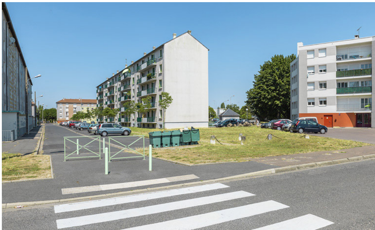
Bâtiment SIDEN, façades postérieure ouest et latérale sud. 58, Cosne-Cours-sur-Loire allée Antoine de Saint-Exupéry