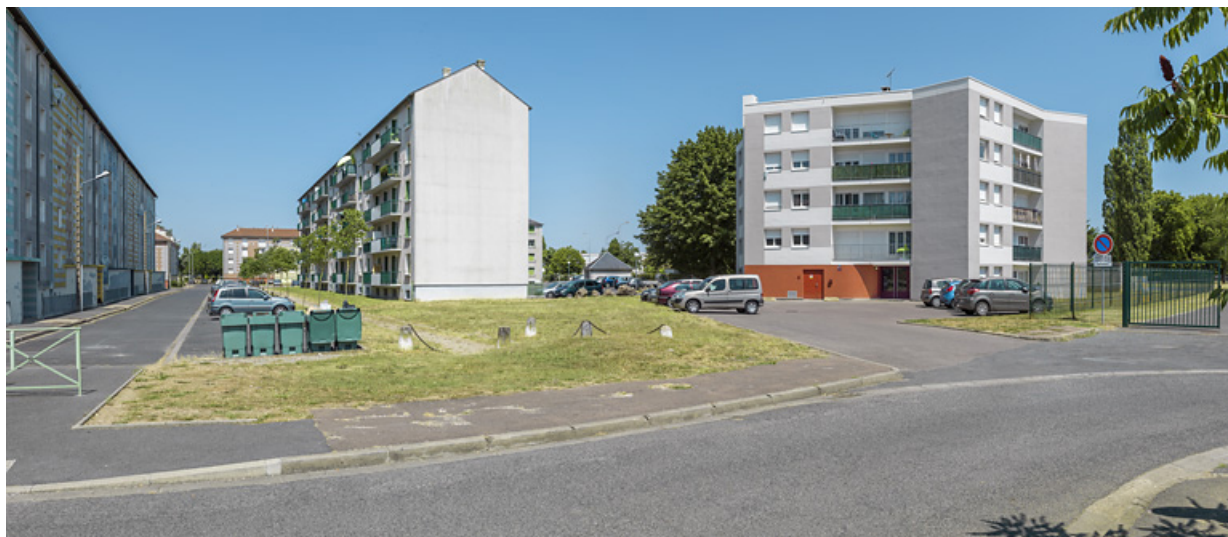
Bâtiment E, SIDEN et X depuis la place Pierre et Marie Curie.

58, Cosne-Cours-sur-Loire, 6 place Pierre et Marie Curie