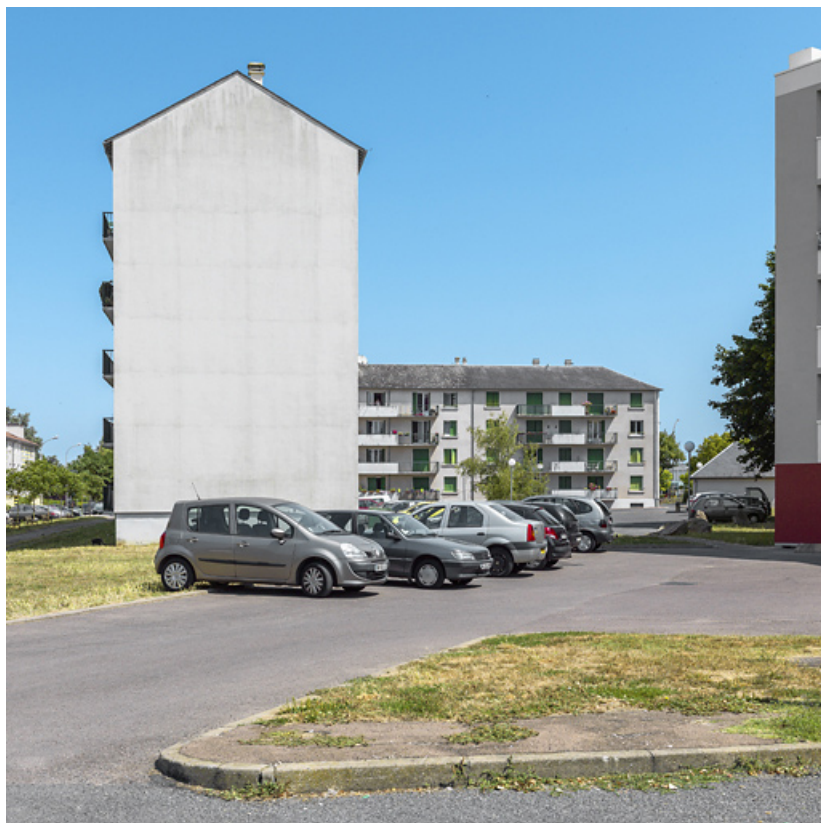
Bâtiment SIDEN, façade latérale sud et façade postérieure sud. 58, Cosne-Cours-sur-Loire allée Antoine de Saint-Exupéry