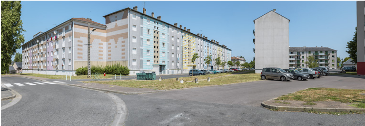
Bâtiment F, E et SIDEN depuis la place Pierre et Marie Curie.

58, Cosne-Cours-sur-Loire avenue de Verdun