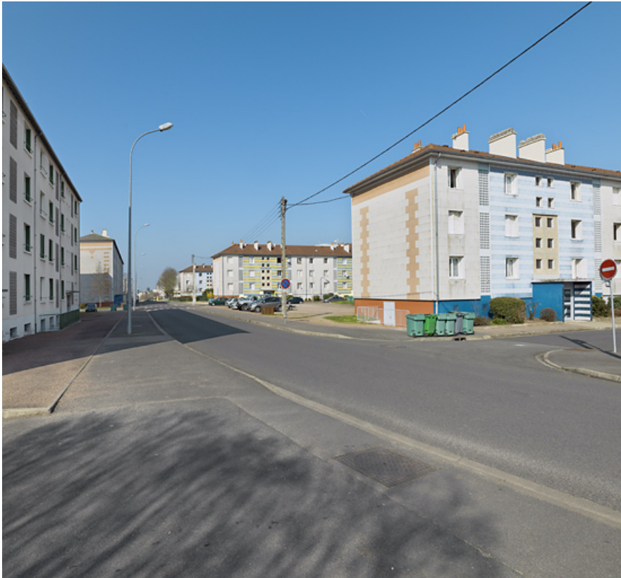
Vue générale depuis le nord de l'avenue de la Paix en direction de l'ouest. 58, Cosne-Cours-sur-Loire avenue de Verdun