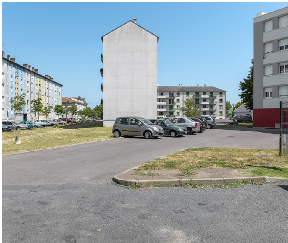
Bâtiment SIDEN, façade latérale sud et façade postérieure sud.

58, Cosne-Cours-sur-Loire avenue de Verdun