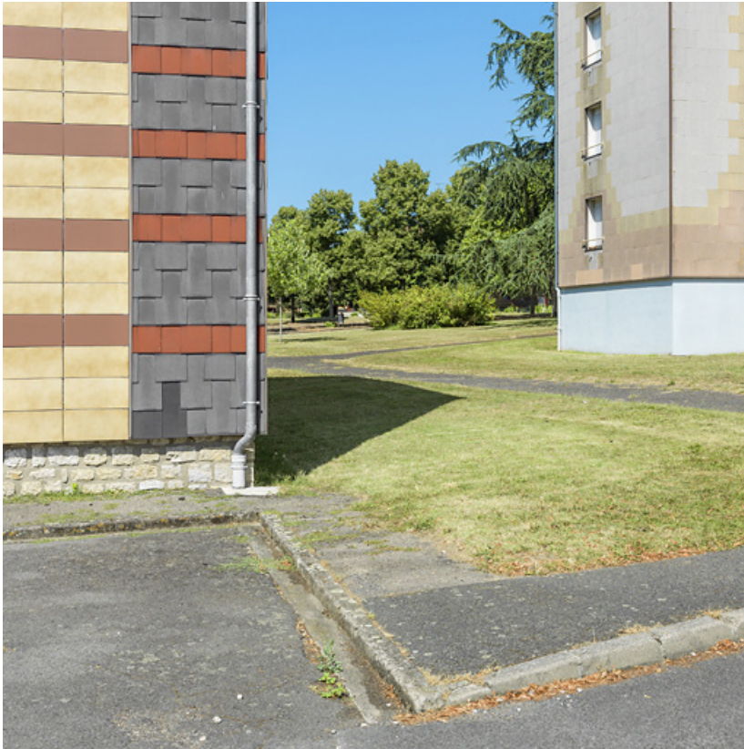
Vue sur le parc de la cité Binot, entre les bâtiments Binot-A et Million-1.

58, Cosne-Cours-sur-Loire avenue de Verdun