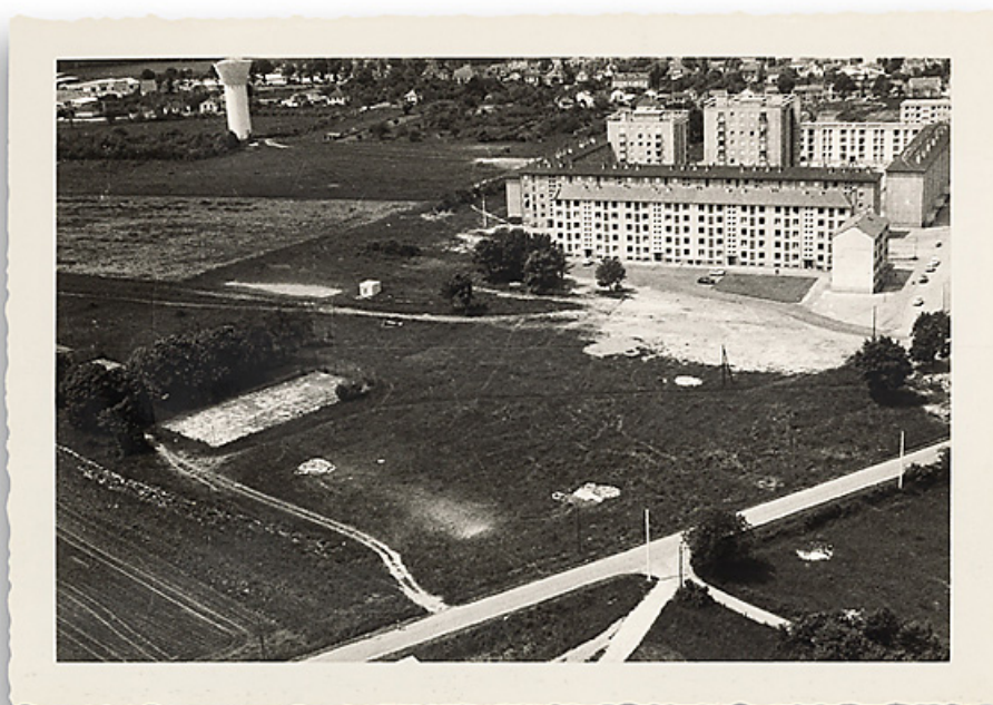
Vue aérienne du quartier Saint-Laurent en construction. Photographie ancienne, s.d., [1970-1971].

58, Cosne-Cours-sur-Loire avenue de Verdun