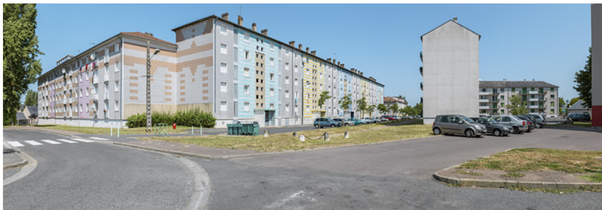
Bâtiment F, E et SIDEN depuis la place Pierre et Marie Curie.

58, Cosne-Cours-sur-Loire avenue de Verdun