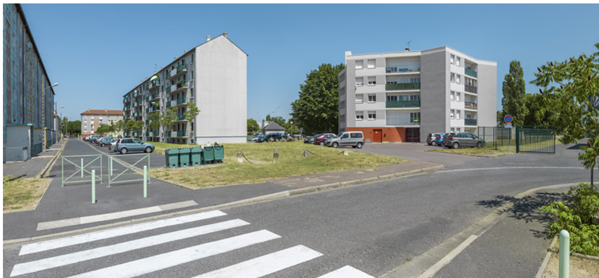
Bâtiment E, SIDEN et X depuis la place Pierre et Marie Curie.

58, Cosne-Cours-sur-Loire avenue de Verdun