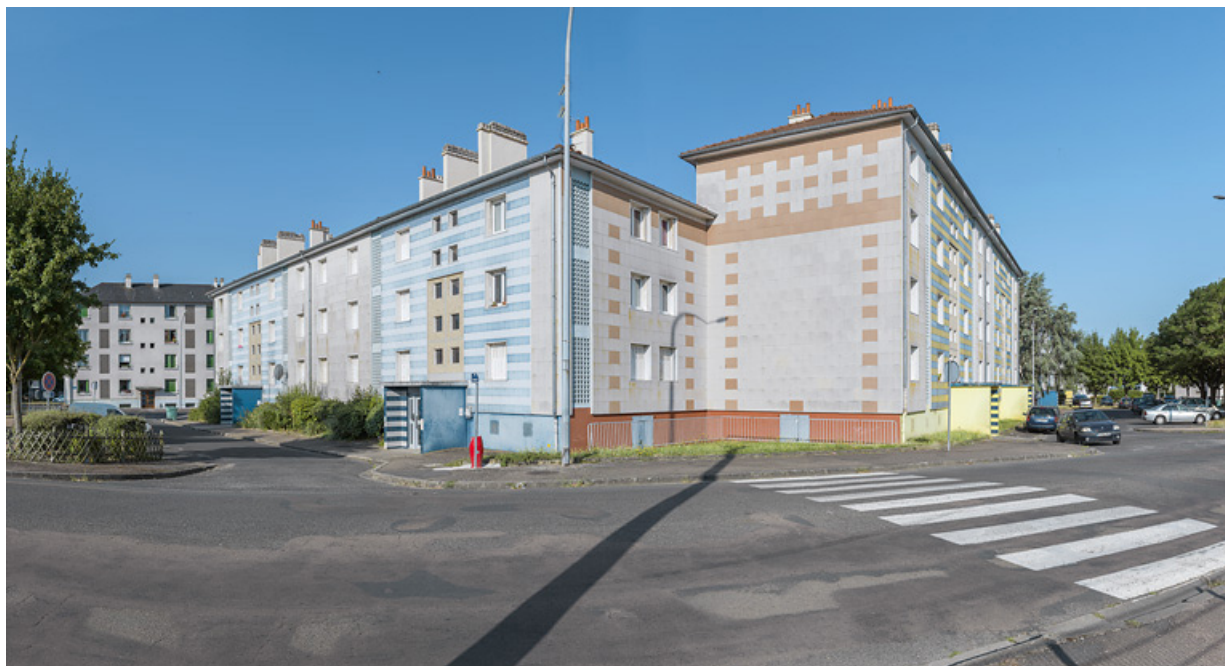
Bâtiments A et B, façades antérieures et latérales.

58, Cosne-Cours-sur-Loire avenue de Verdun