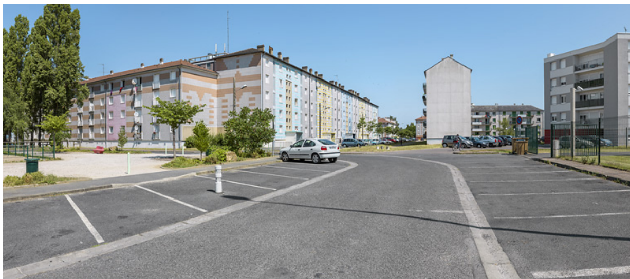
Vue générale depuis la place Pierre et Marie Curie.

58, Cosne-Cours-sur-Loire avenue de Verdun