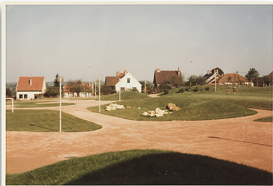
Aménagement du parc Schweitzer. Photographie ancienne, 1982. (Archives municipales Cosne-Cours-sur-Loire, 202W683 - 2Fi50) 58, Cosne-Cours-sur-Loire avenue de Verdun