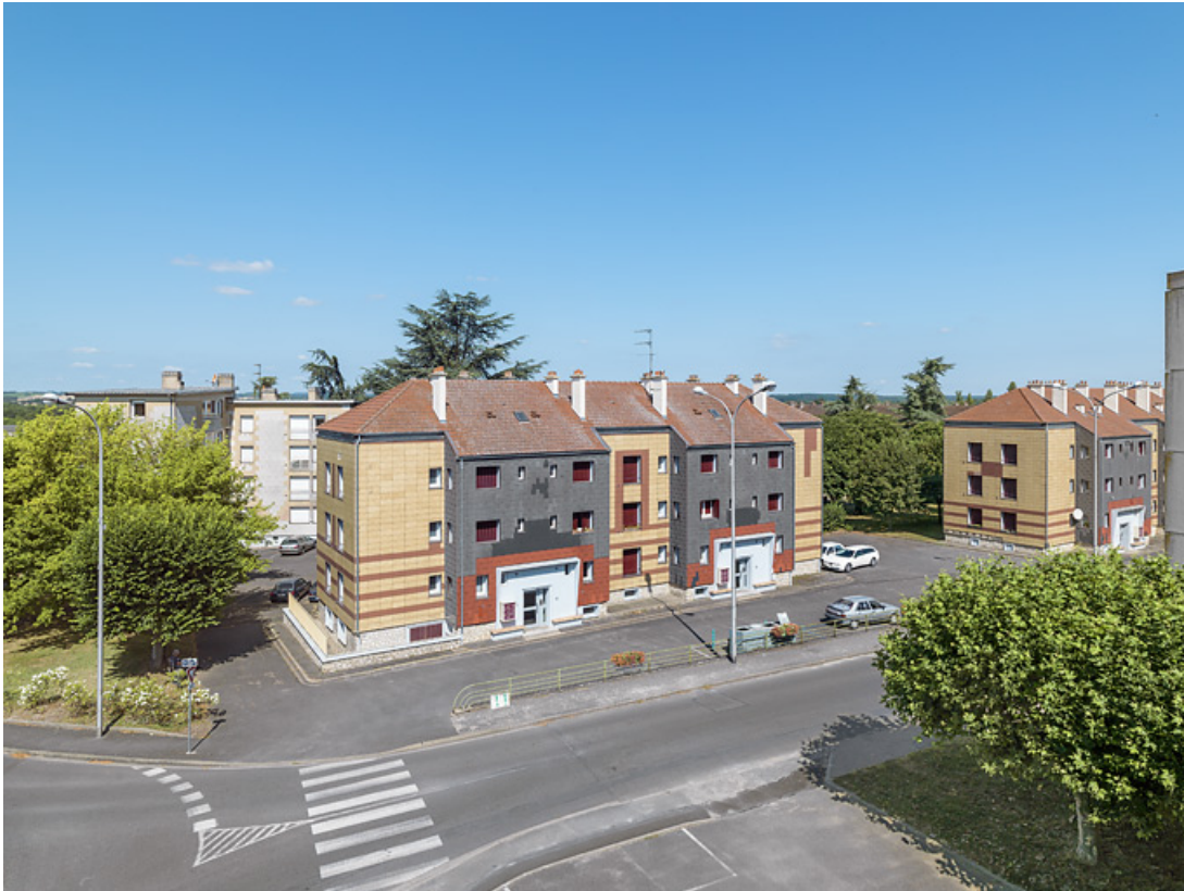
Bâtiment Binot-D, vue en situation.

58, Cosne-Cours-sur-Loire avenue de Verdun