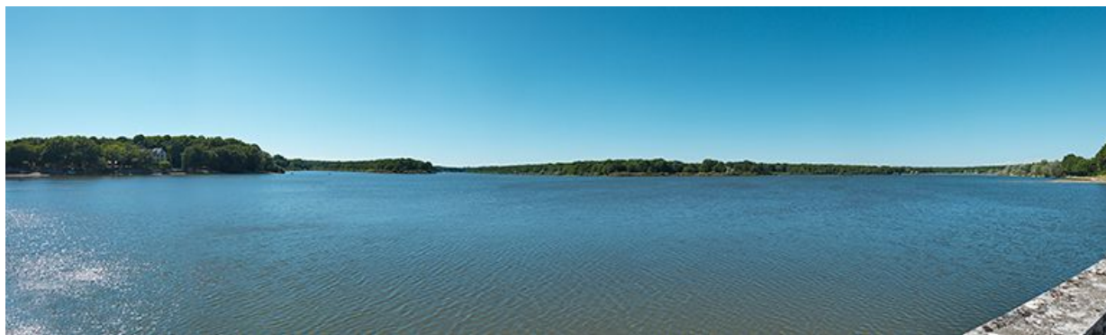
Vue d'ensemble de l'étang de Vaux depuis la digue le séparant de celui de Baye.

58, La Collancelle, lieudit : bief de partage