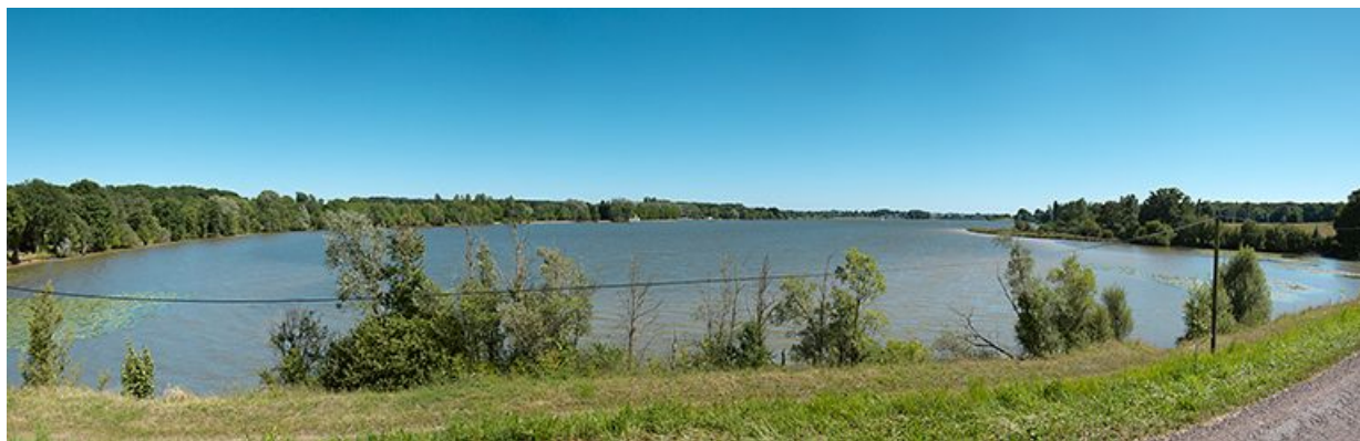
Vue d'ensemble de l'étang de Baye depuis la digue le séparant de celui de Vaux.