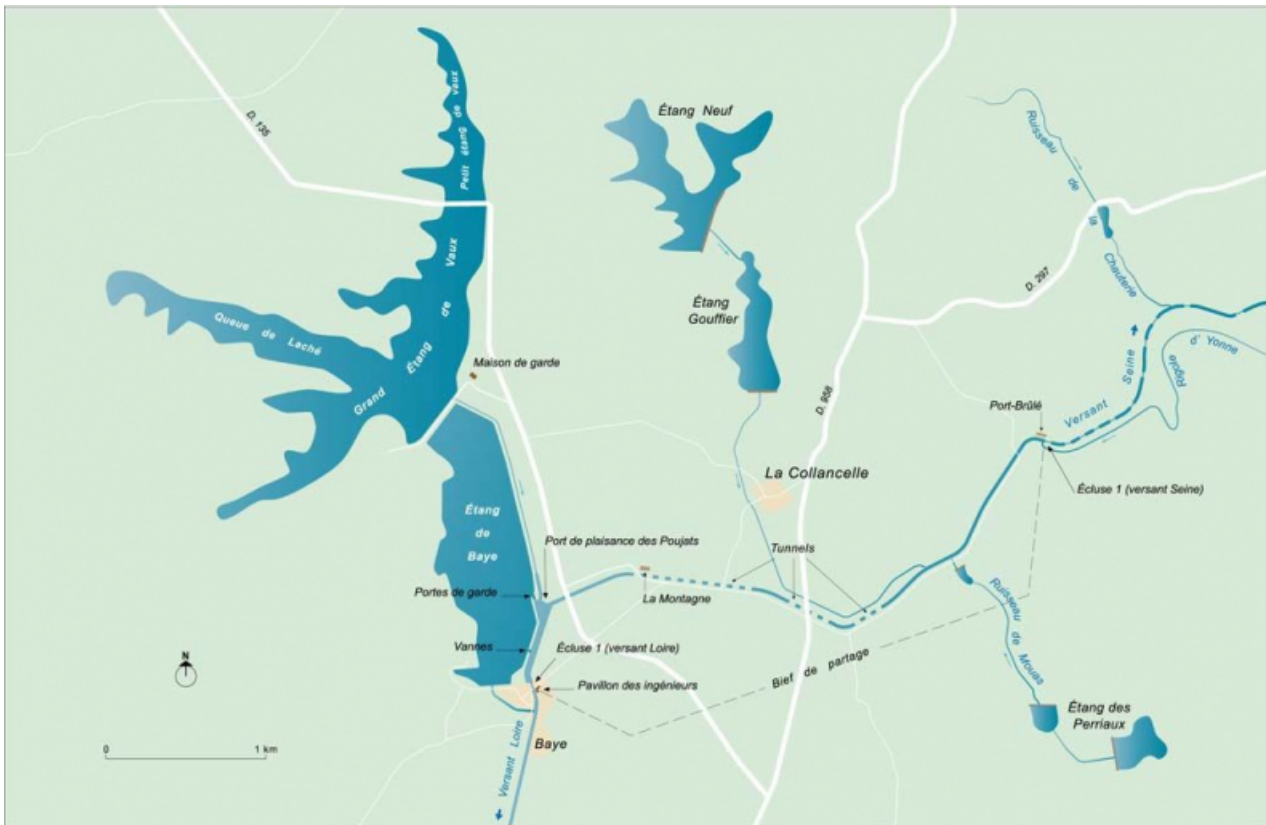
Carte schématique du bief de partage et des étangs-réservoirs qui l'alimentent.

58, La Collancelle, lieudit : bief de partage