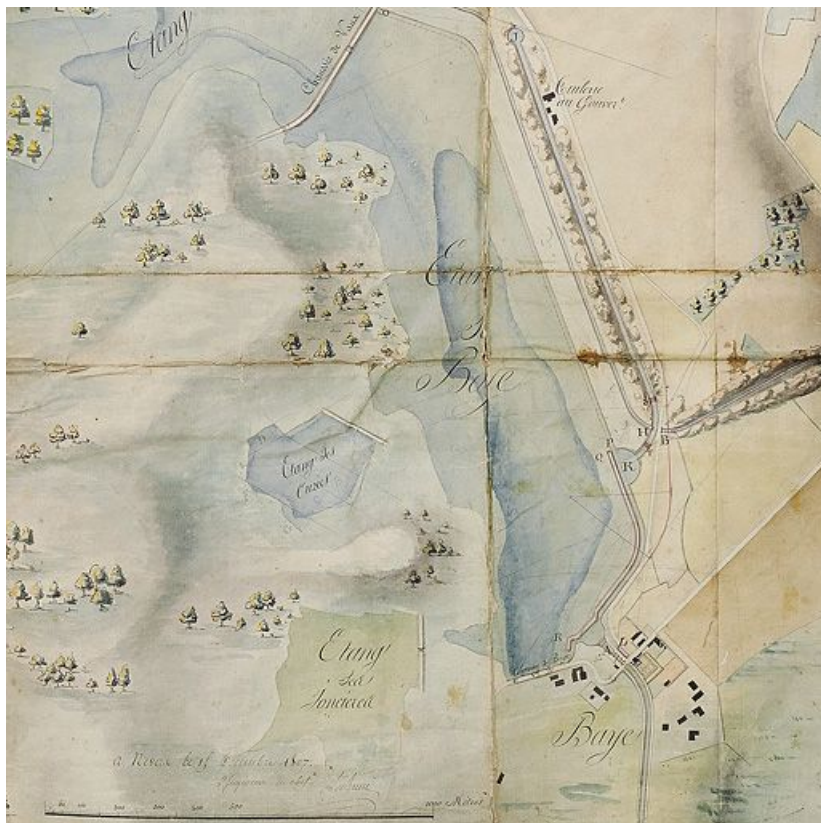
"Carte topographique des différents étangs destinés à former le réservoir du point de partage du Canal du Nivernais" : détail de l'étang de Baye. (Plan aquarellé ; 127 x 103 cm, Archives VNF-direction territoriale Centre-Bourgogne ; subdivision de Corbigny) 58, Bazolles, lieudit : bief de partage