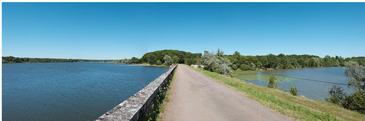
Vue d'ensemble des étangs de Baye et de Vaux depuis la digue les séparant.

58, La Collancelle, lieudit : bief de partage