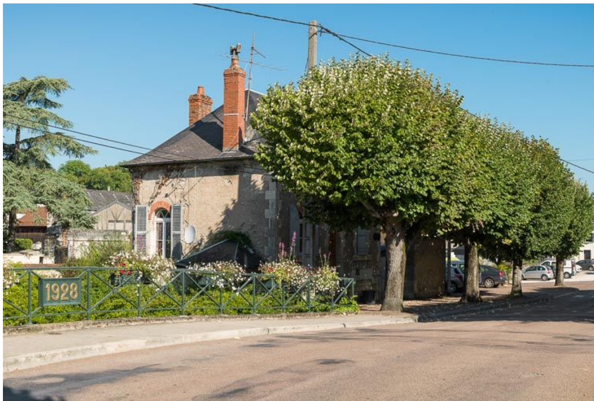
La maison de garde, vue de 3/4 et prise depuis le pont sur le Beuvron.

58, Clamecy, lieudit : bief 47 bis du versant Seine