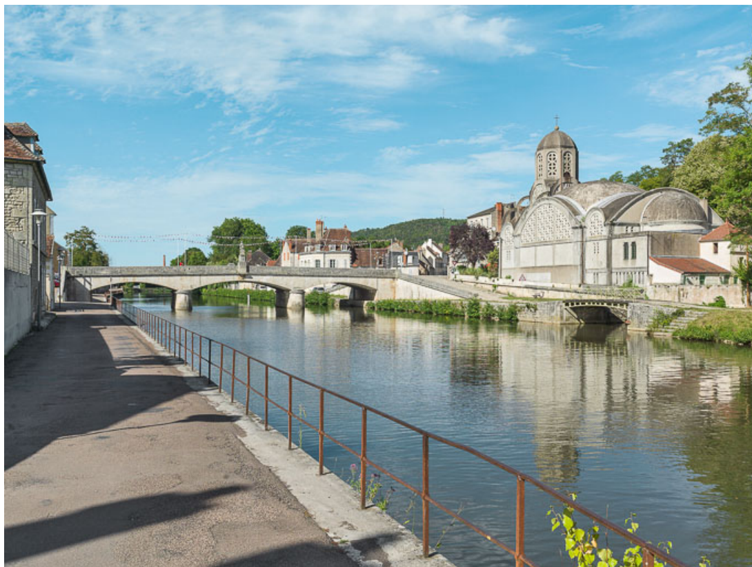
Vue du pont et de l'église Notre-Dame-de-Bethléem.

58, Clamecy, lieudit : bief 47 bis du versant Seine