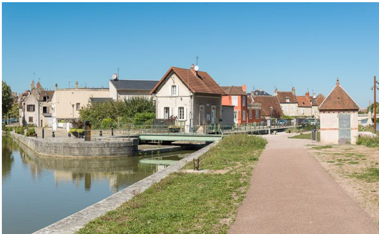
Vue d'ensemble du site, pris d'amont. Au premier plan, le pont mobile (IA58000966). 58, Clamecy, lieudit : bief 47 du versant Seine

N° de l'illustration : 20135800460NUC4AQ