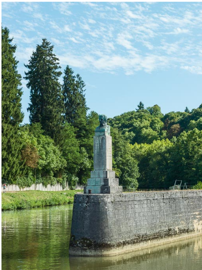
Vue du buste de Jean Rouvet, inventeur des flottages du bois, à l'entrée du pertuis. 58, Clamecy, lieudit : bief 47 du versant Seine