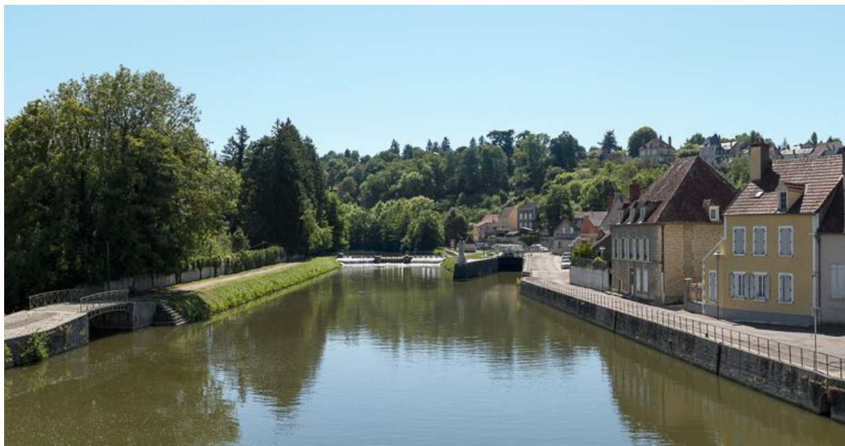
Le site d'écluse et le pertuis dans l'Yonne, vus d'aval. A gauche, passerelle en métal enjambant une prise d'eau dans l'Yonne. 58, Clamecy, lieudit : bief 47 du versant Seine

N° de l'illustration : 20135800457NUC4AQ