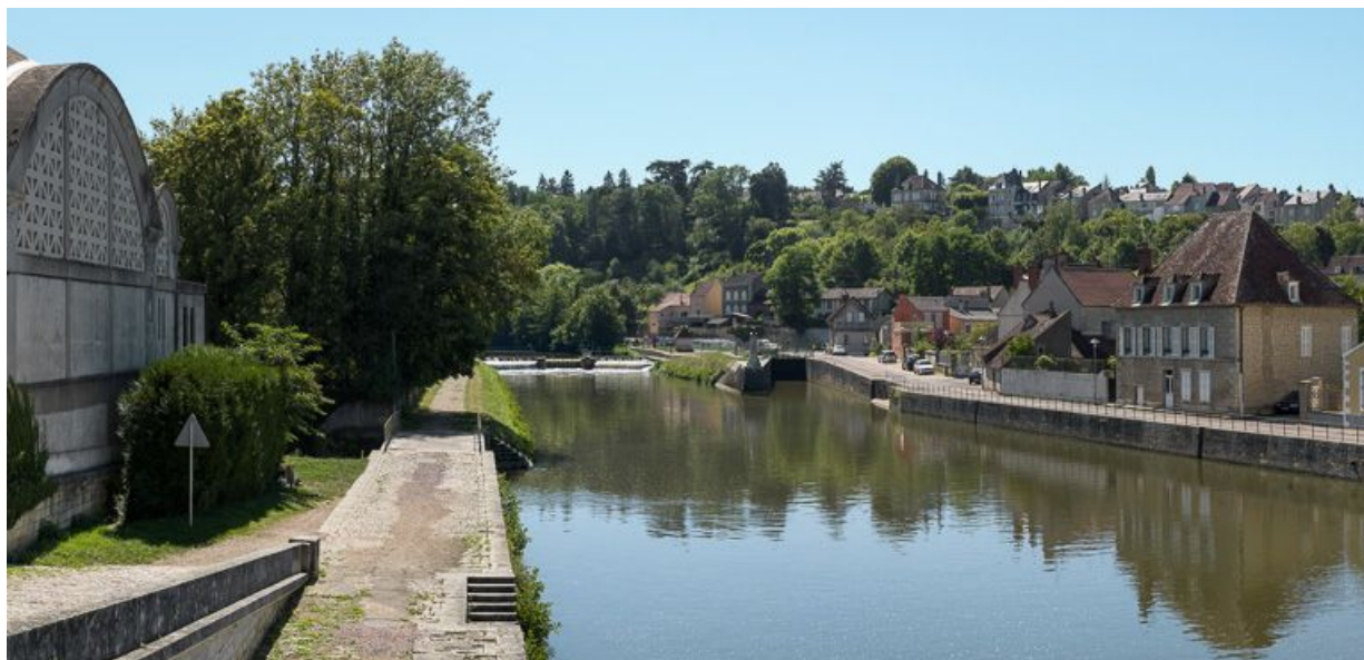
Le site d'écluse et le pertuis dans l'Yonne, vus d'aval. A gauche, on aperçoit Notre-Dame de Bethléem (IA58000661). A droite, la ville de Clamecy.

58, Clamecy, lieudit : bief 47 du versant Seine