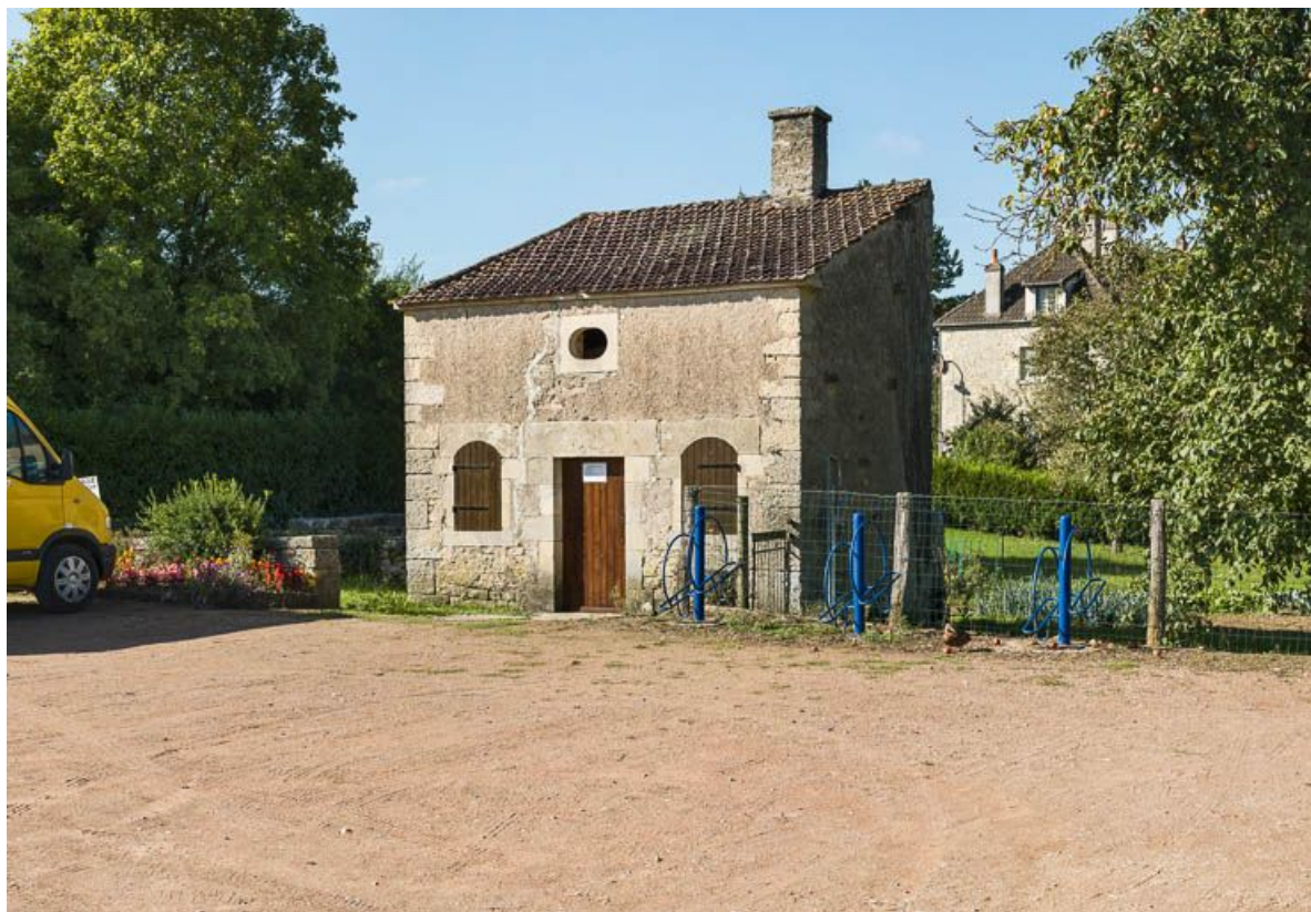
L'abri des ouvriers : vue de 3/4.

58, Chevroches, lieudit : bief 45 du versant Seine