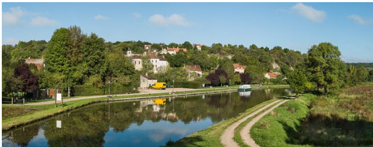
Vue d'ensemble du port pris d'amont.

N° de l'illustration : 20135800451NUC4AQ