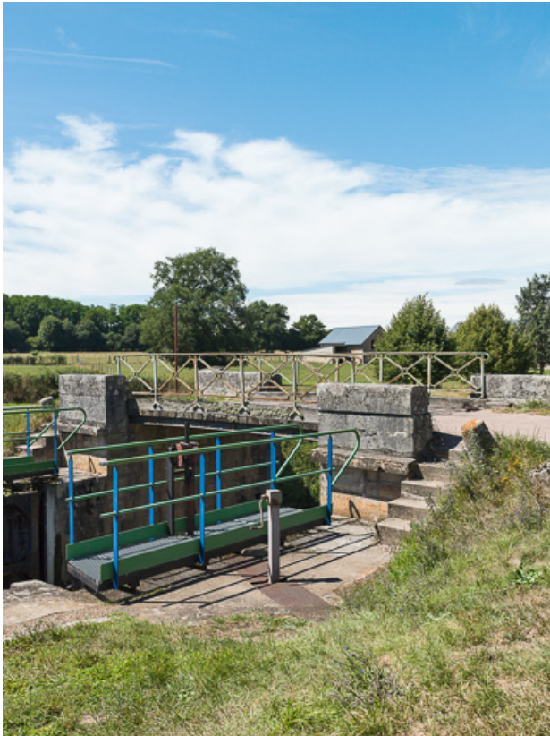
Vue rapprochée du pont et des escaliers.

58, Dirol, lieudit : bief 33 du versant Seine