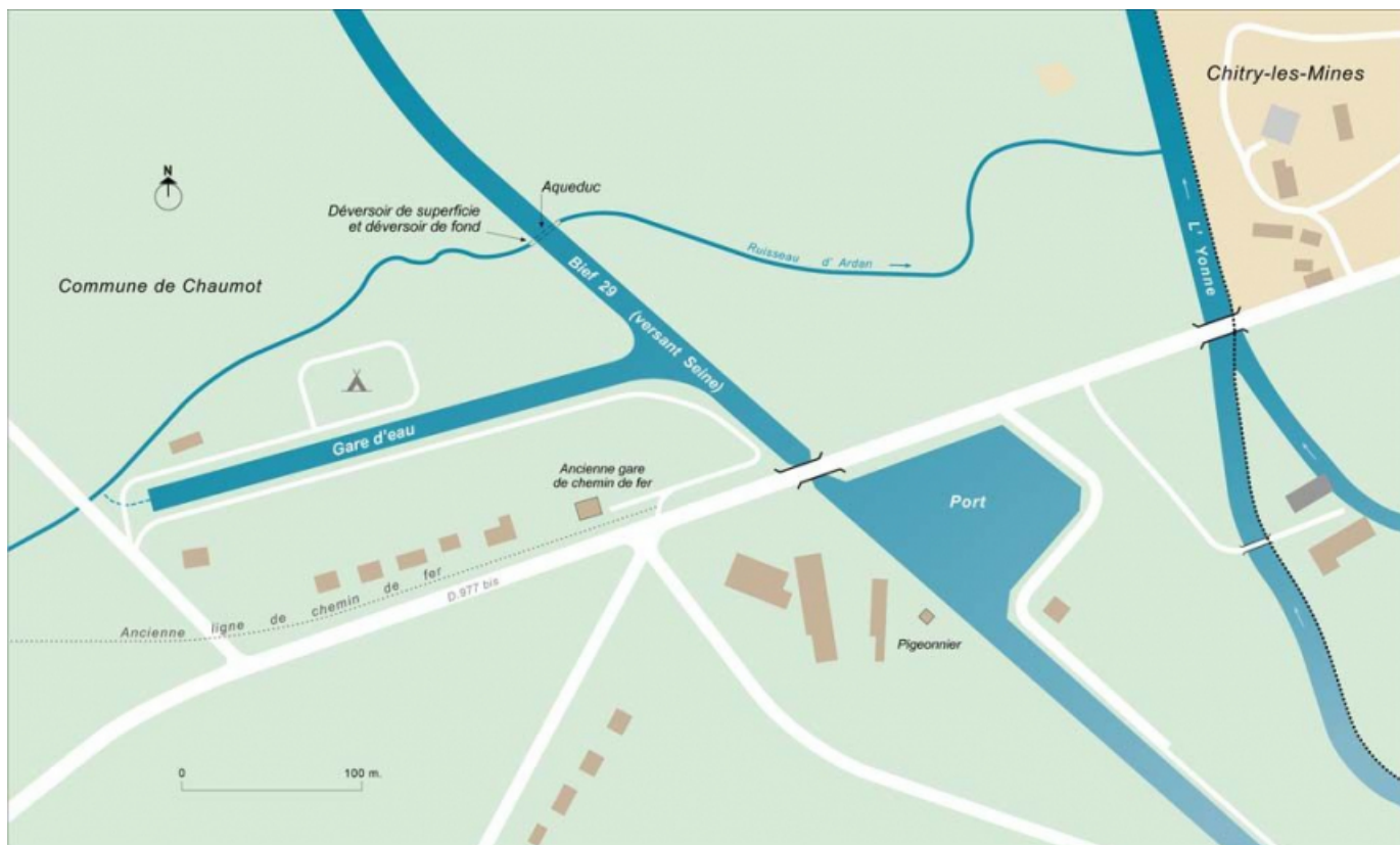
Carte schématique du port et de la gare d'eau.

58, Chaumot, lieudit : bief 29 du versant Seine