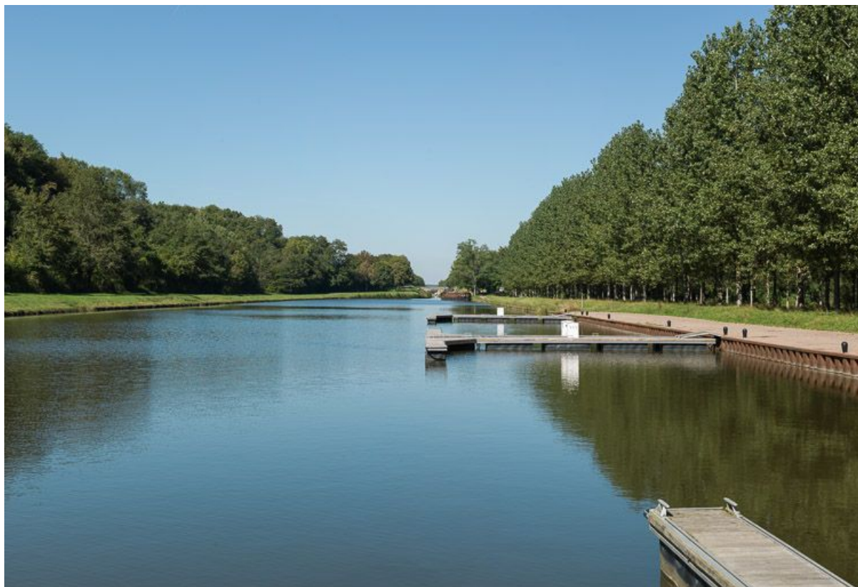
Vue d'ensemble du port avec ses appontements. En arrière-plan, la tranchée de la Chaise.

58, Corbigny, lieudit : bief 25 du versant Seine