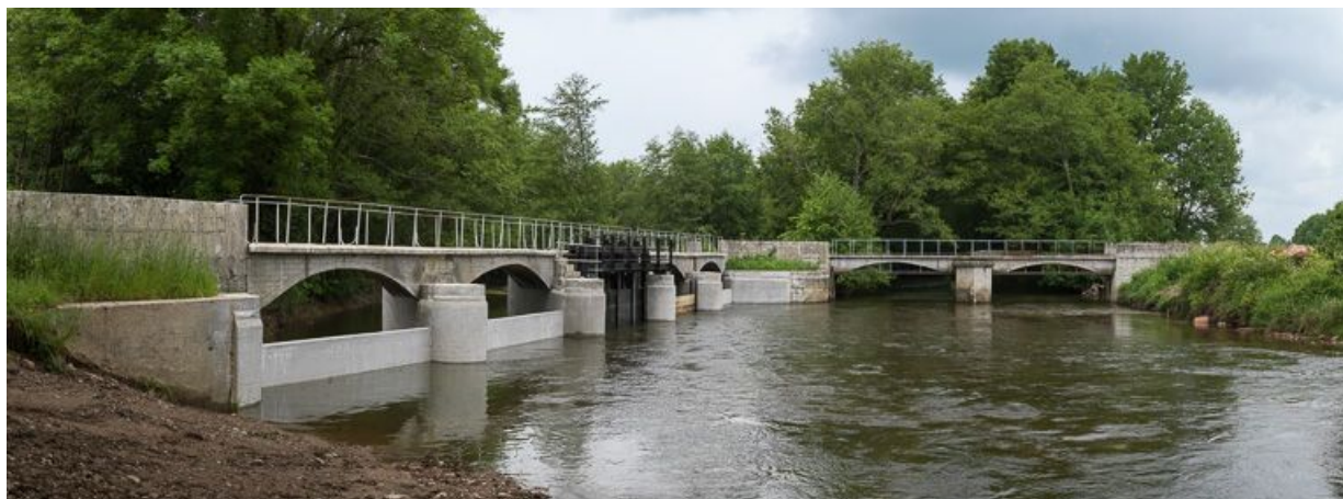
Barrage de prise d'eau sur l'Yonne.

N° de l'illustration : 20135800420NUC4AQ