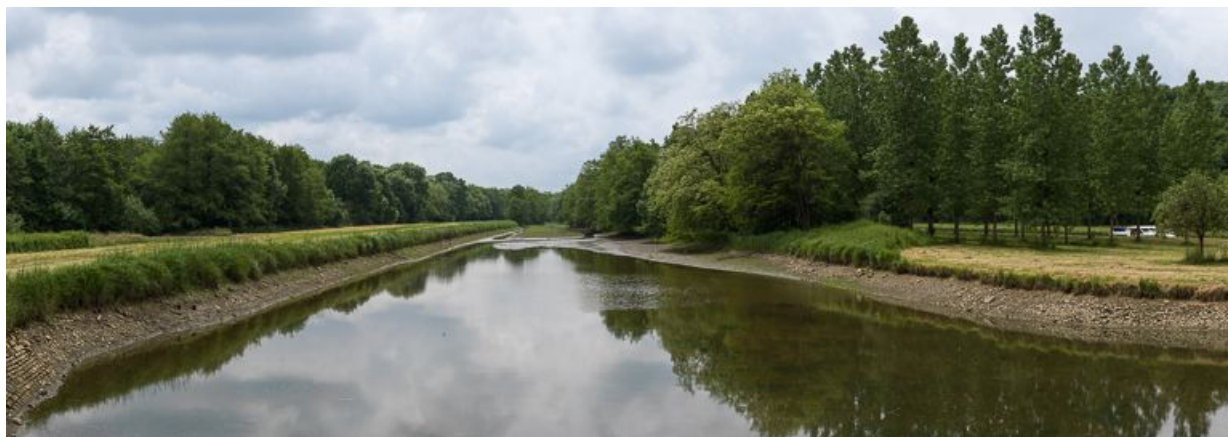
Vue d'ensemble de la rigole prise depuis le déversoir de fond.

N° de l'illustration : 20135800422NUC4AQ