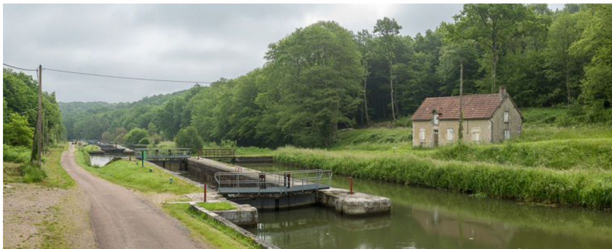
Vue de l'écluse avec le déversoir de superficie à droite, l'ensemble pris d'amont.

58, La Collancelle, lieudit : bief 02 du versant Seine