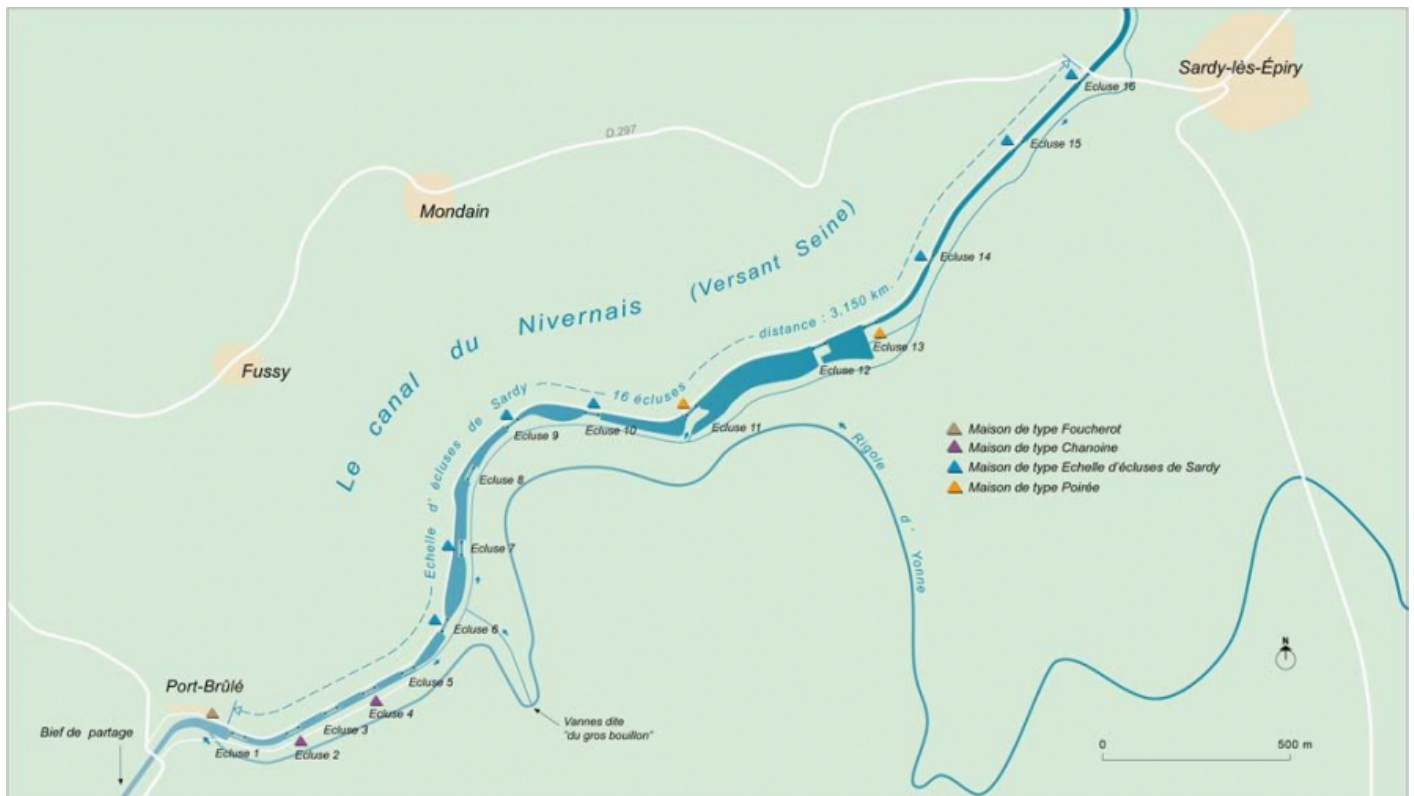
Carte schématique de l'échelle d'écluses de Sardy. 58, Sardy-lès-Épiry, lieudit : Port-Brûlé