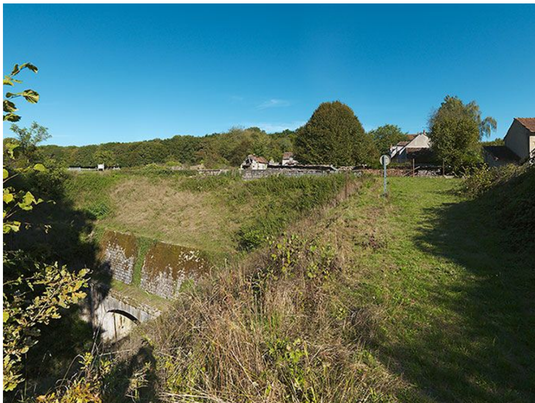
Entrée du tunnel de La Collancelle avec en arrière-plan les bâtiments destinés au service du canal. 58, La Collancelle, lieudit : bief de partage