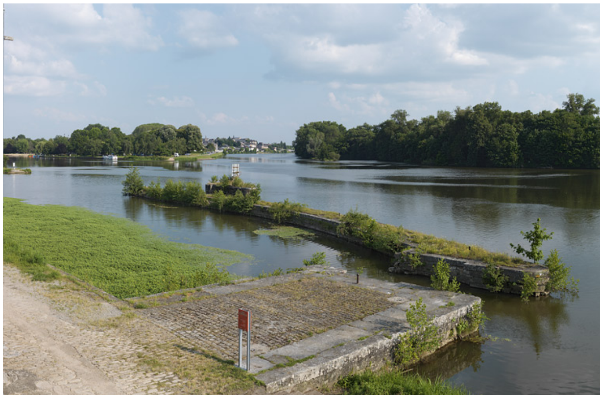
Le quai et le pertuis en maçonnerie de moellon devant le maison. En arrière-plan, la ville de Decize. 58, Decize, lieudit : bief 35 du versant Loire