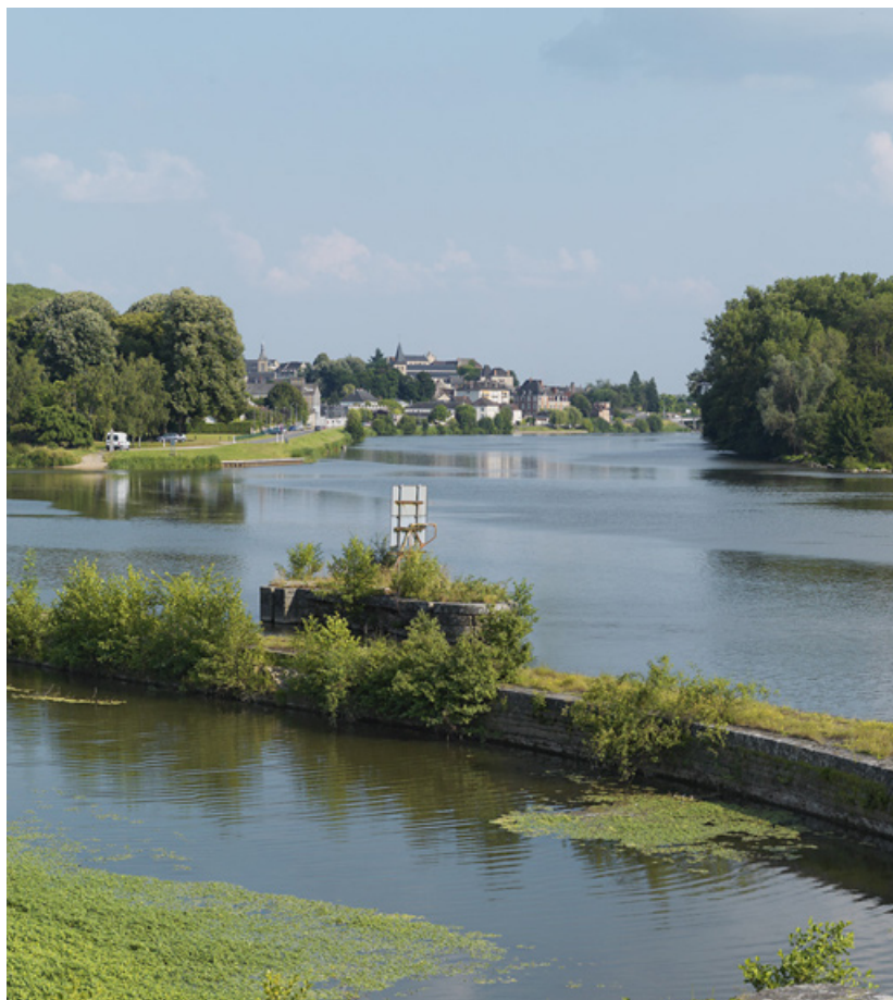
Vue générale avec au premier plan, le site d'écluse ; à gauche, la maison de garde, le port et le château. 58, Decize, lieudit : bief 35 du versant Loire