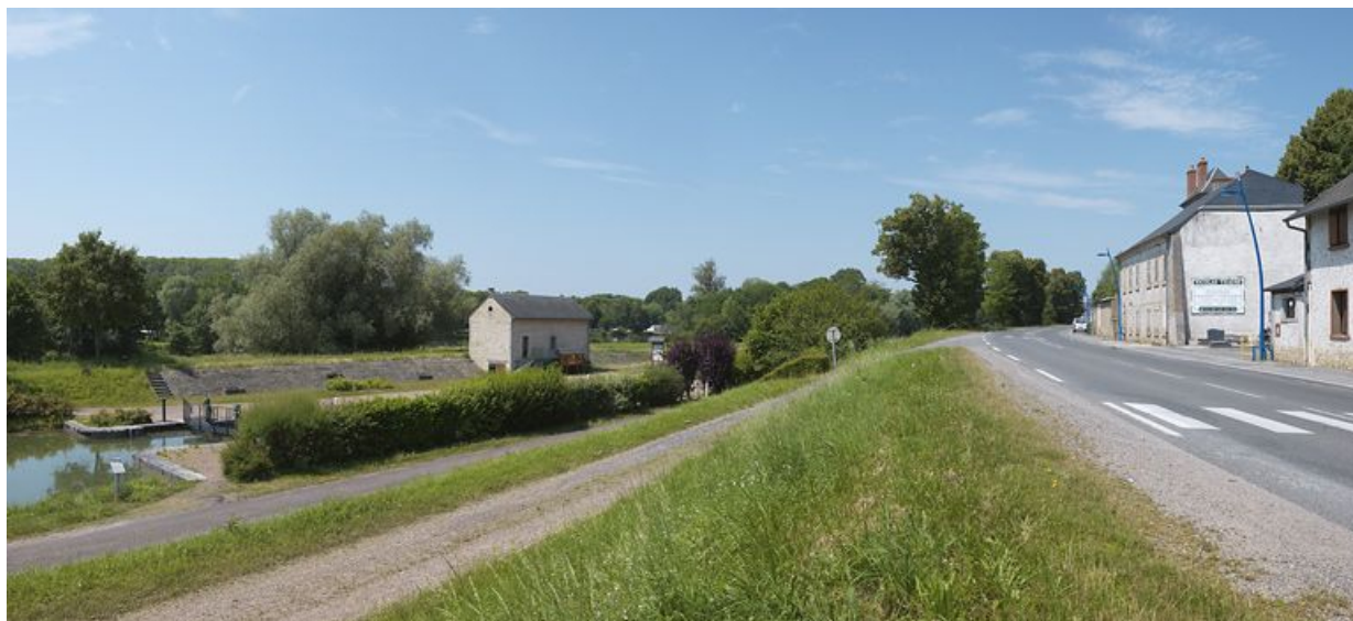
Vue d'ensemble du site avec de gauche à droite : le sas, le magasin (rive gauche) et la maison éclusière de l'autre côté de la route. 58, Saint-Léger-des-Vignes, lieudit : bief 35 du versant Loire