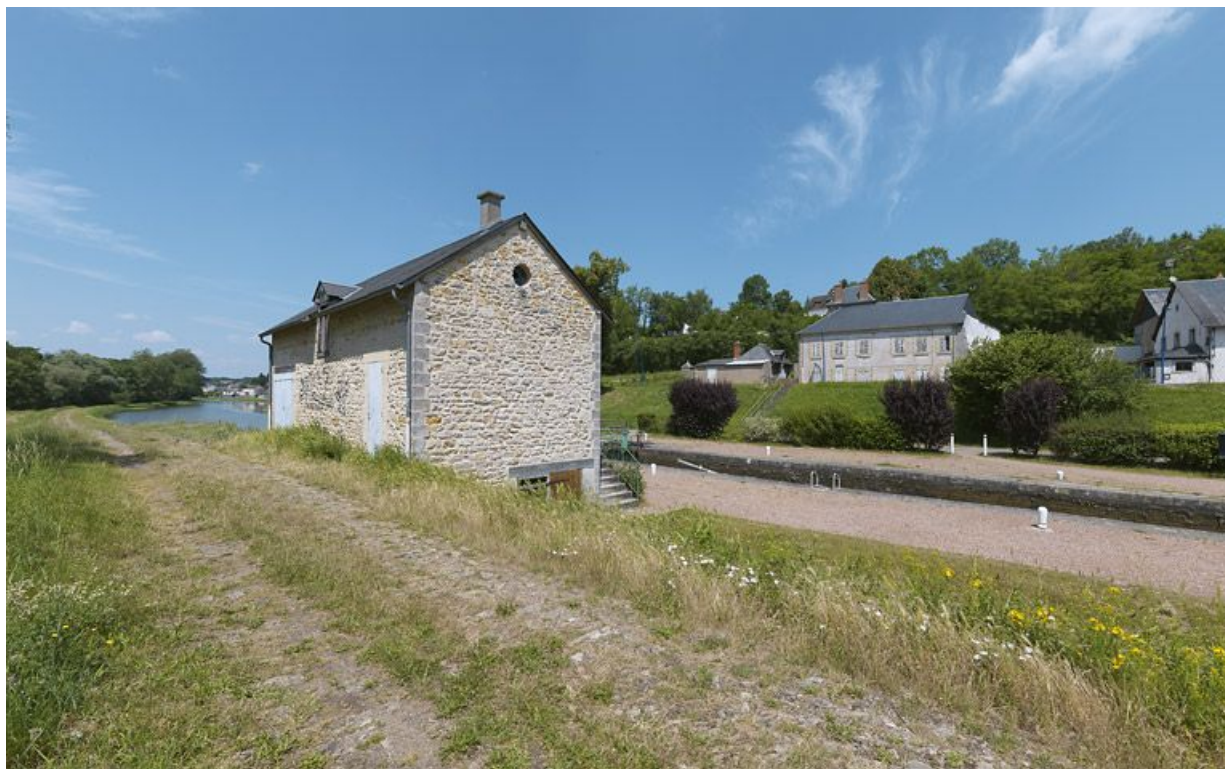
Le site d'écluse : au premier plan, le magasin (rive gauche) et en arrière-plan, la maison éclusière de l'autre côté de la route. 58, Saint-Léger-des-Vignes, lieudit : bief 35 du versant Loire