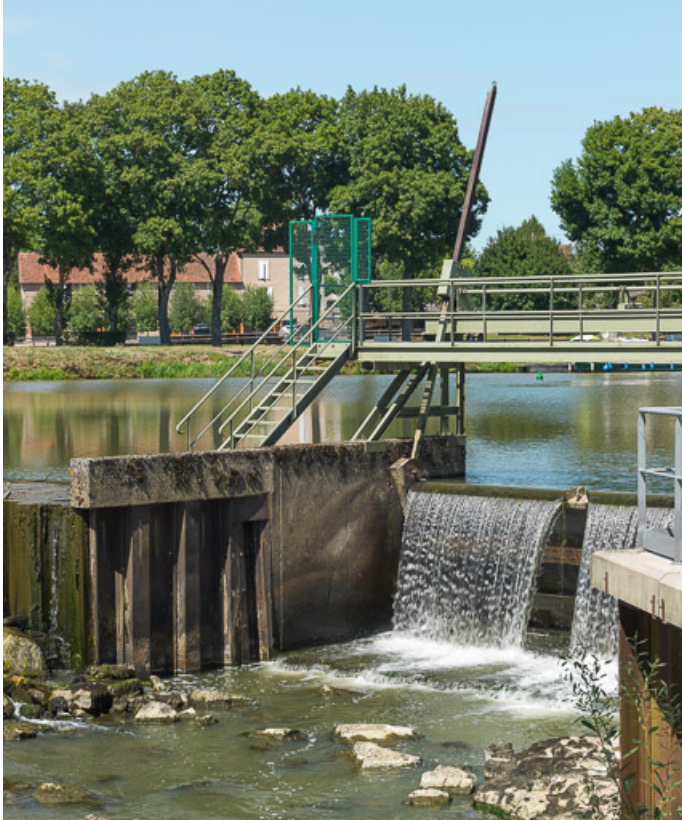
Vue du déversoir.

58, Cercy-la-Tour, lieudit : bief 31 du versant Loire