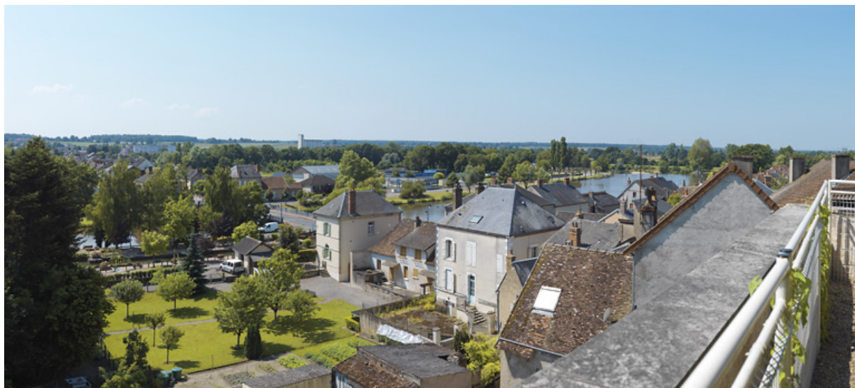
Le village de Cercy-la-Tour, à l'arrière plan, le port de Cercy-la-Tour.

58, Cercy-la-Tour, lieu-dit : bief 30 du versant Loire