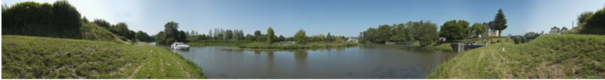
Panorama du port. A droite le barrage et le site d'écluse.

58, Limanton, lieudit : bief 25 du versant Loire