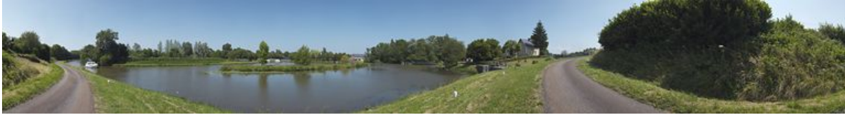
Panorama du port. A droite le barrage et le site d'écluse.

58, Limanton, lieudit : bief 25 du versant Loire