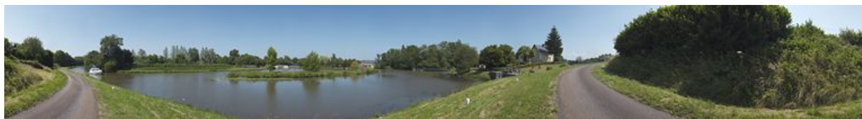
Panorama du port. A droite le barrage et le site d'écluse.

58, Limanton, lieudit : bief 25 du versant Loire