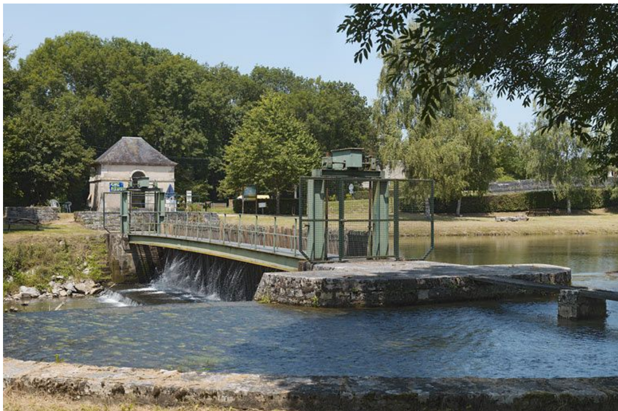
Vue d'ensemble du barrage. Au premier plan, le déversoir et au fond, la maison du barragiste.

58, Biches, lieudit : bief 22 du versant Loire