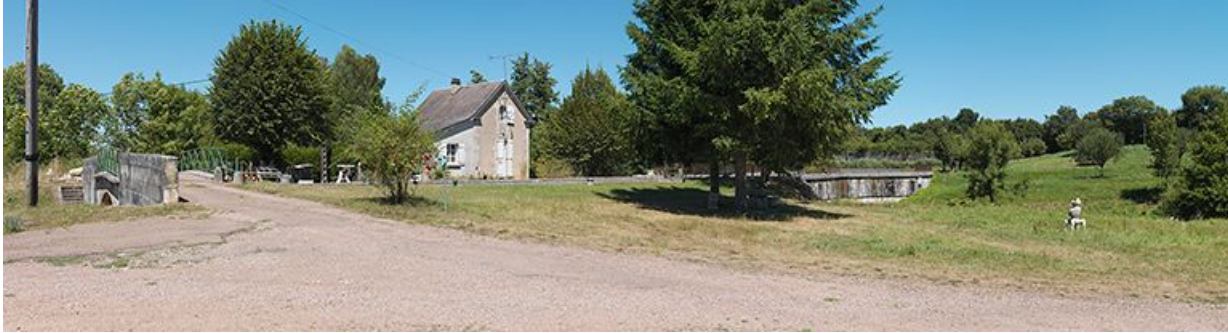
Panorama du site d'écluse avec de gauche à droite : le pont sur écluse, la maison éclusière et le pont canal. 58, Châtillon-en-Bazois, lieudit : bief 13 du versant Loire

N° de l'illustration : 20135800190NUC4AQ