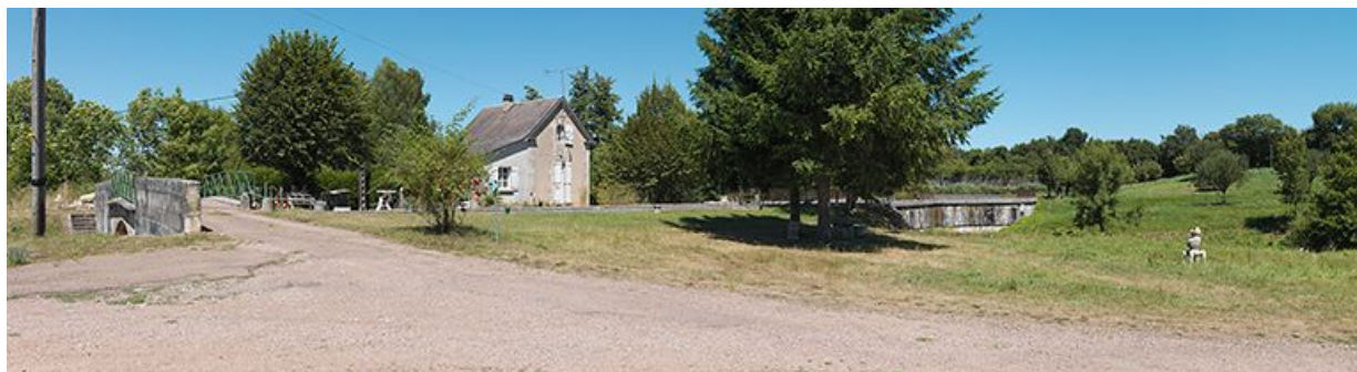
Panorama du site d'écluse avec de gauche à droite : le pont sur écluse, la maison éclusière et le pont canal. 58, Châtillon-en-Bazois, lieudit : bief 13 du versant Loire

N° de l'illustration : 20135800190NUC4AQ