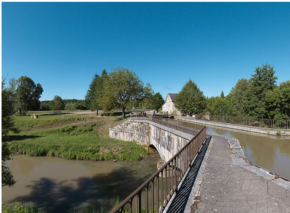
Vue d'ensemble du pont canal.