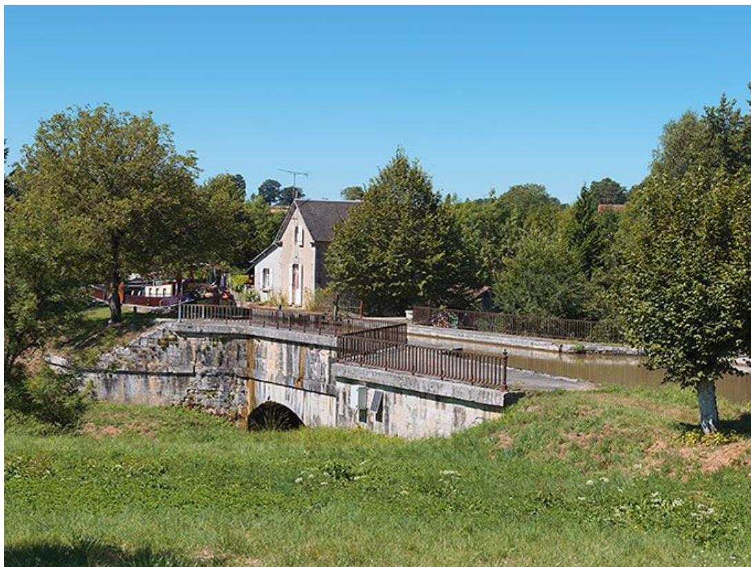
Le pont canal de Mingot. En arrière-plan, la maison éclusière du site de l'écluse 13 du versant Loire. 58, Châtillon-en-Bazois, lieudit : bief 13 du versant Loire