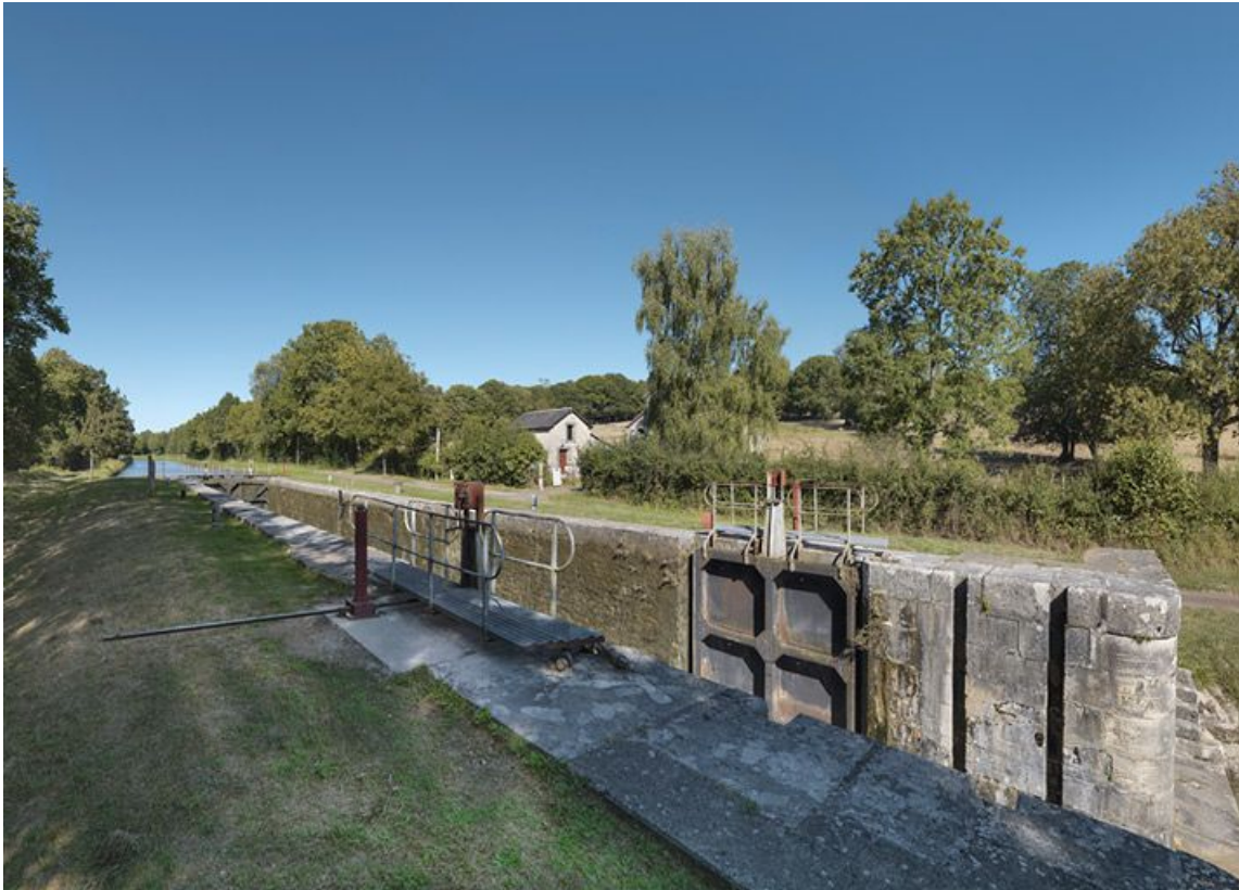
Le sas d'écluse au premier plan et la maison éclésièr en arrière-plan.

58, Mont-et-Marré, lieudit : bief 11 du versant Loire