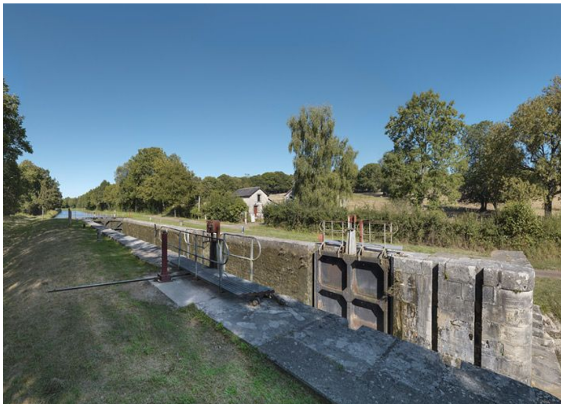
Le sas d'écluse au premier plan et la maison éclusière en arrière-plan.

58, Mont-et-Marré, lieudit : bief 11 du versant Loire