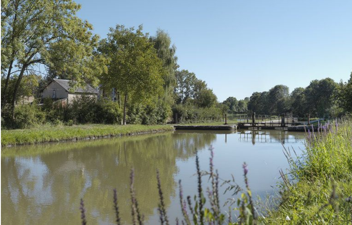
Le site d'écluse, d'amont. La maison éclusière à gauche.

58, Mont-et-Marré, lieudit : bief 11 du versant Loire