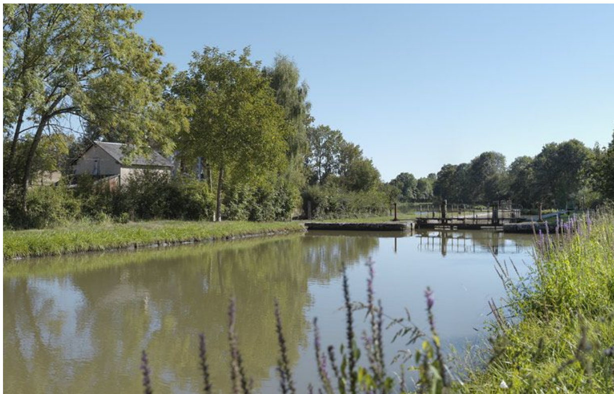
Le site d'écluse, d'amont. La maison éclusière à gauche.

58, Mont-et-Marré, lieudit : bief 11 du versant Loire