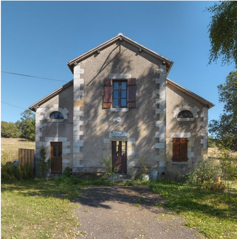
La maison, vue de face.

58, Mont-et-Marré, lieudit : bief 11 du versant Loire