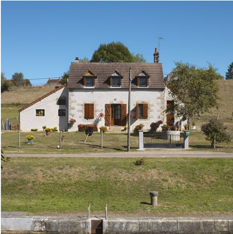
La maison éclusière, de face.

58, Mont-et-Marré, lieudit : bief 10 du versant Loire