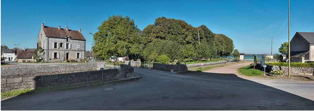
Vue d'ensemble avec à gauche, la maison éclusière.

58, Bazolles, lieudit : bief 01 du versant Loire