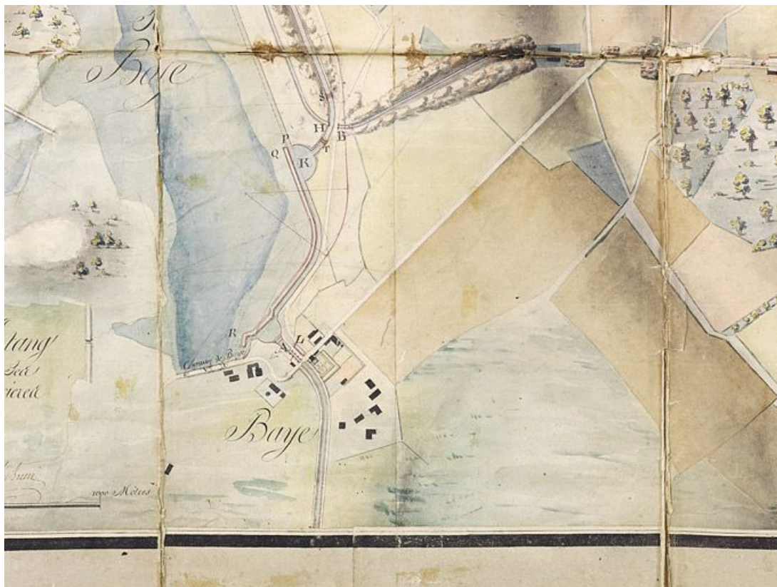
"Carte topographique des différents étangs destinés à former le réservoir du point de partage du Canal du Nivernais" : détail du site de l'écluse, dite de Baye. (Plan aquarellé ; 127 x 103 cm, Archives VNF-direction territoriale Centre-Bourgogne ; subdivision de Corbigny)

58, Bazolles, lieudit : bief 01 du versant Loire