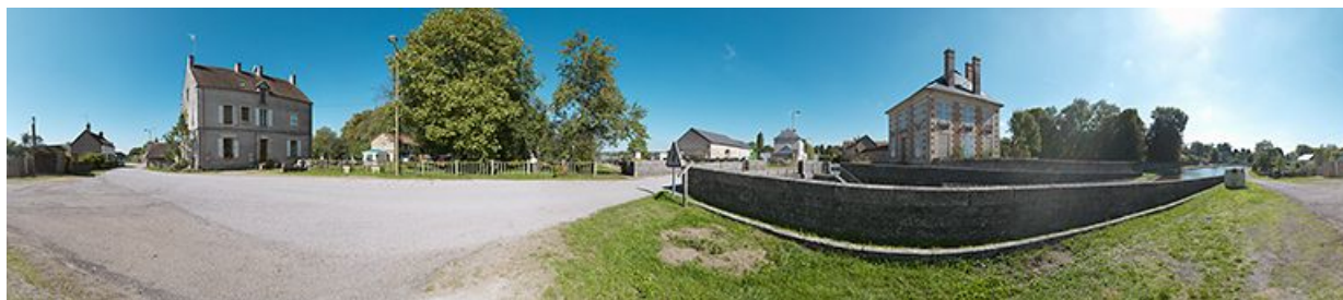
Panoramique avec de gauche à droite : la maison éclusière, le site d'écluse, le pont sur écluse et la maison des ingénieurs. 58, Bazolles, lieudit : bief 01 du versant Loire

N° de l'illustration : 20135800025NUC4AQ