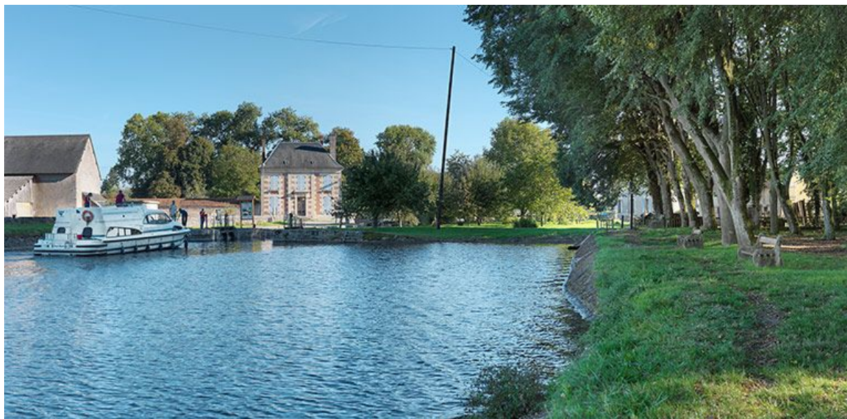
Site d'écluse au premier plan. Derrière, la maison des ingénieurs.

58, Bazolles, lieudit : bief 01 du versant Loire