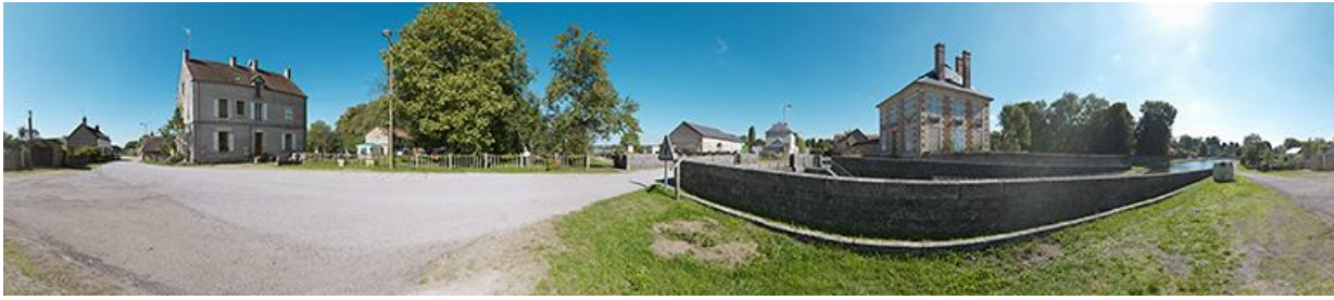
Panoramique avec de gauche à droite : la maison éclusière, le site d'écluse, le pont sur écluse et la maison des ingénieurs. 58, Bazolles, lieudit : bief 01 du versant Loire

N° de l'illustration : 20135800025NUC4AQ