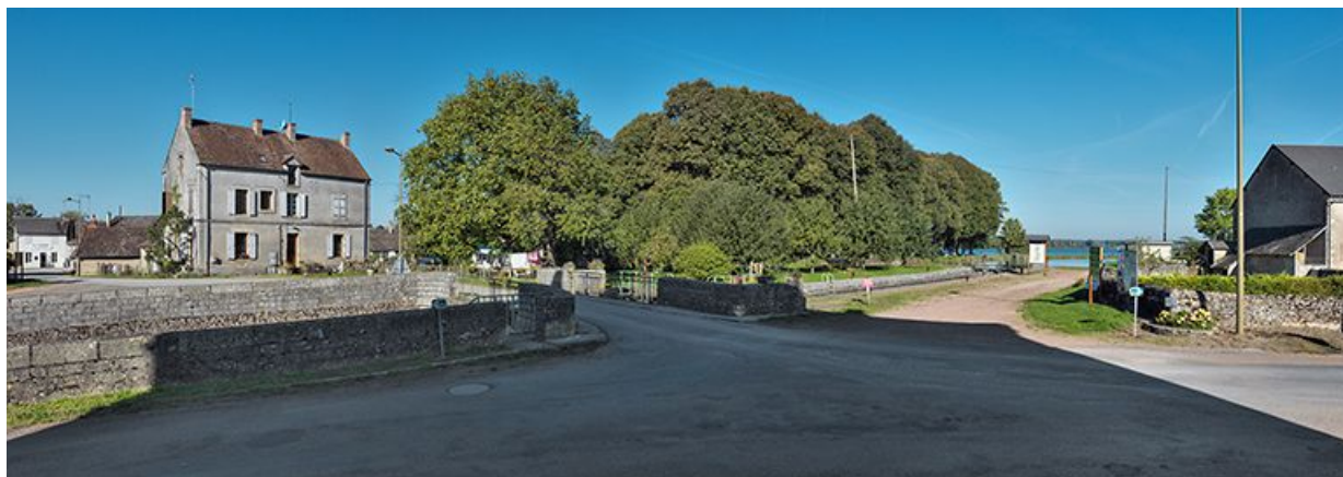
Vue d'ensemble avec à gauche, la maison éclusière.

58, Bazolles, lieudit : bief 01 du versant Loire