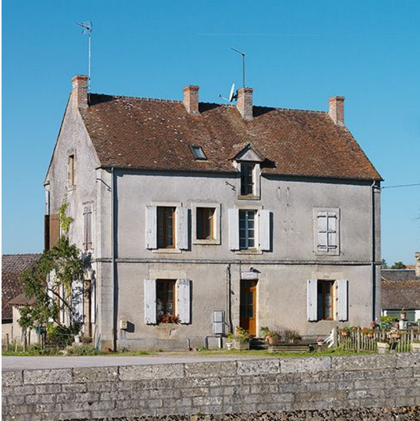
La maison éclusière de face.

58, Bazolles, lieudit : bief 01 du versant Loire