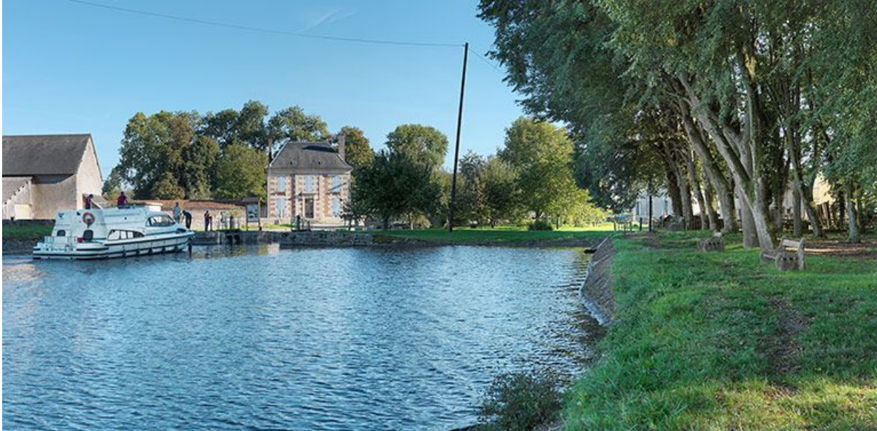
Site d'écluse au premier plan. Derrière, la maison des ingénieurs.

58, Bazolles, lieudit : bief 01 du versant Loire