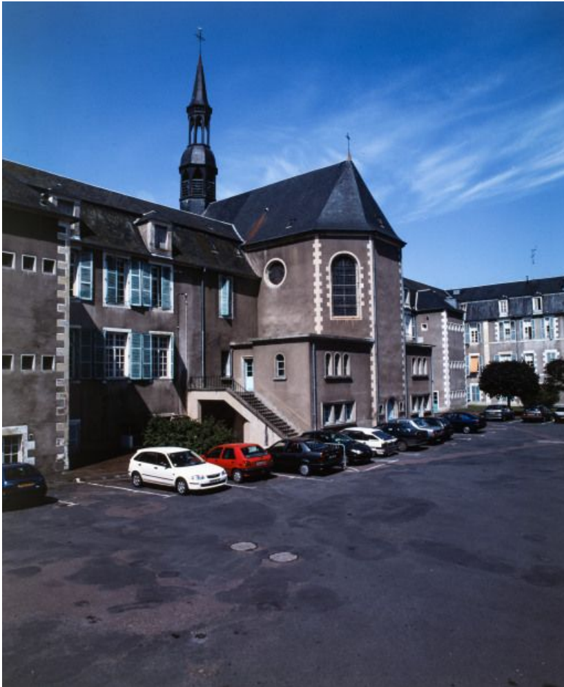
Façade postérieure : chevet de la chapelle.