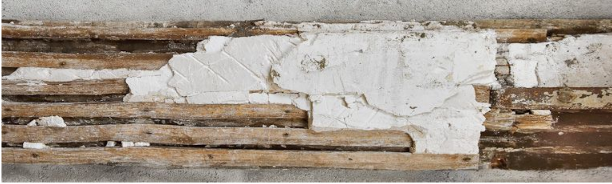
Détail de mise en oeuvre : lattis.