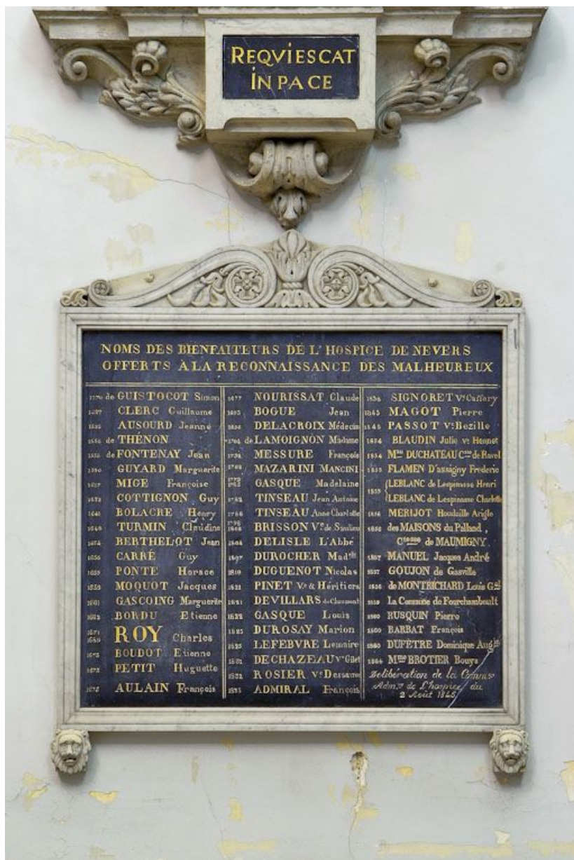
Chapelle : plaque commémorative avec les noms des bienfaiteurs de l'hôpital général. 58, Nevers Colbert