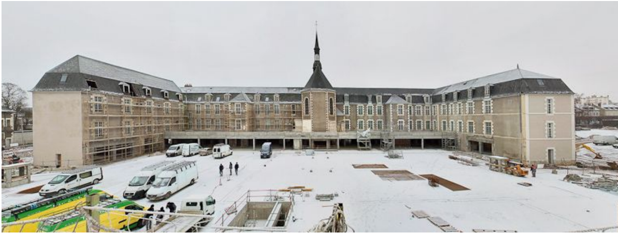
Façade antérieure de l'ancien hôpital général. 58, Nevers Colbert

N° de l'illustration : 20105800005NUC2AQ