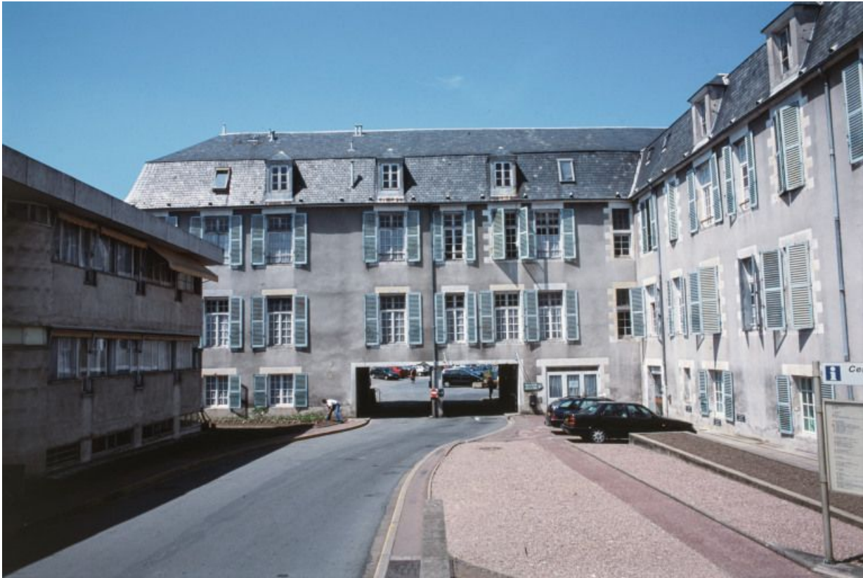
Façade postérieure du corps central et aile en retour. 58, Nevers Colbert