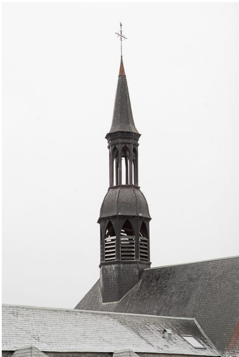
Flèche de la chapelle.