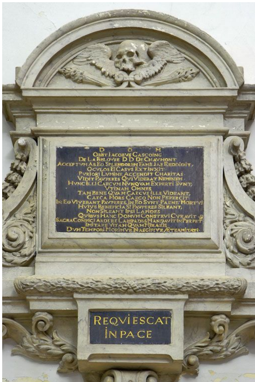
Chapelle : plaque funéraire.