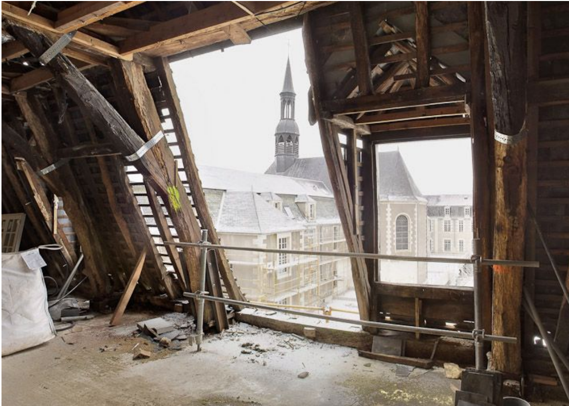
Les combles de l'aile Sud de l'ancien hôpital général : vue sur la chapelle. 58, Nevers Colbert

N° de l'illustration : 20105800006NUC4AQ