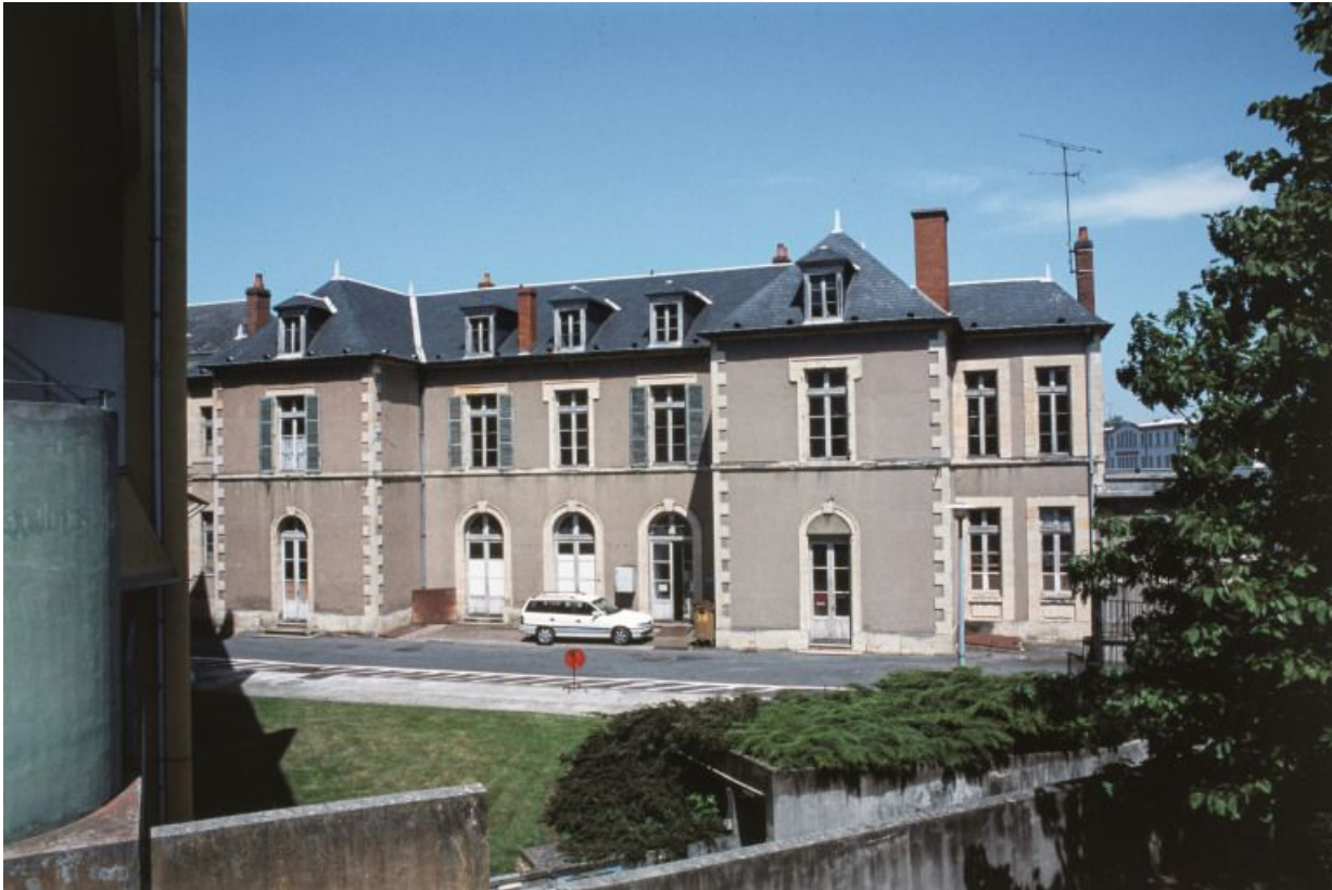
Bâtiment de biologie, façade antérieure. 58, Nevers Colbert