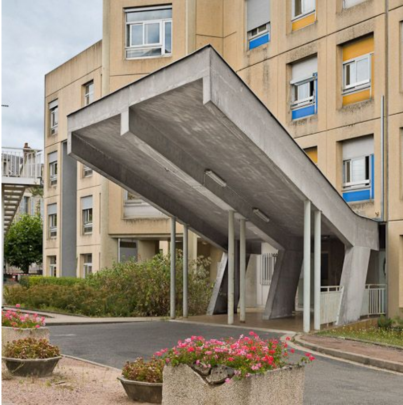
Bâtiment Maternité-Gynécologie (Gérontologie au moment de la prise de vue) : détail de l'auvent de la façade antérieure. 58, Nevers Colbert