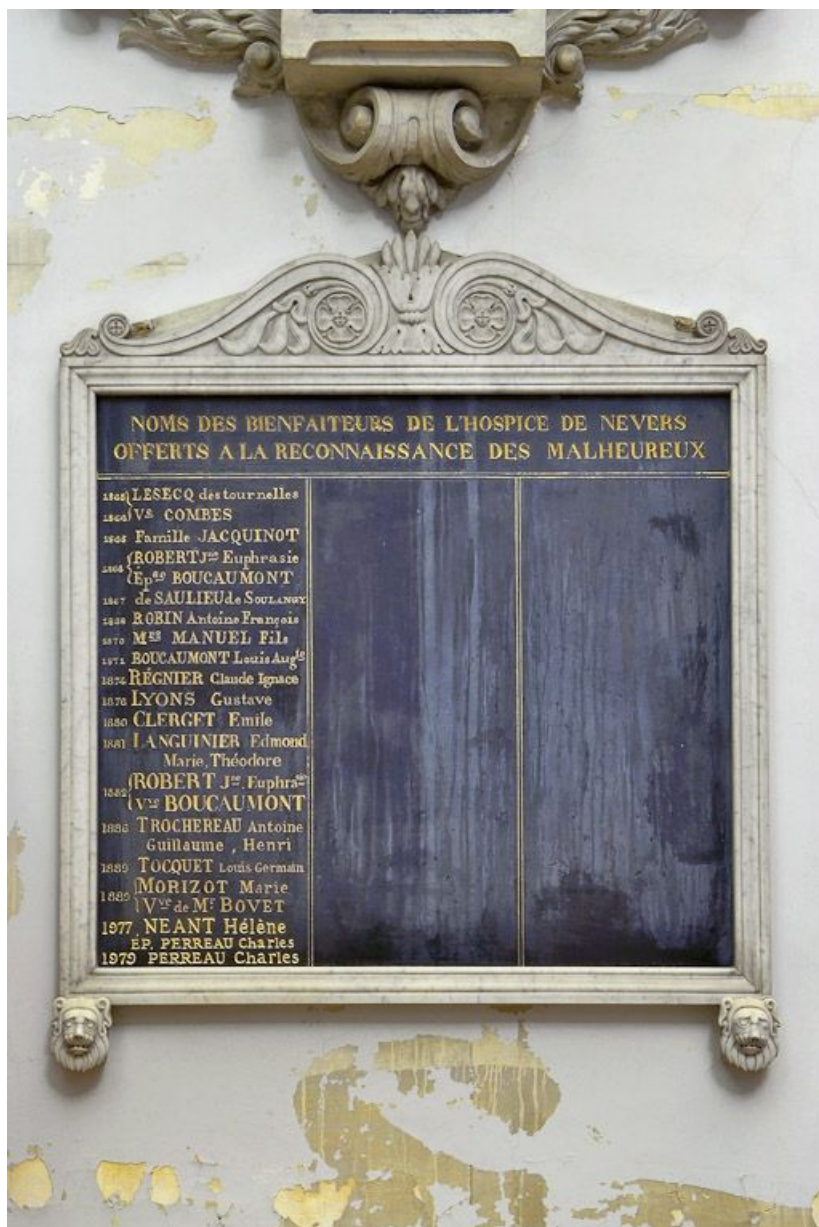
Chapelle : plaque commémorative des bienfaiteurs de l'hôpital. 58, Nevers Colbert