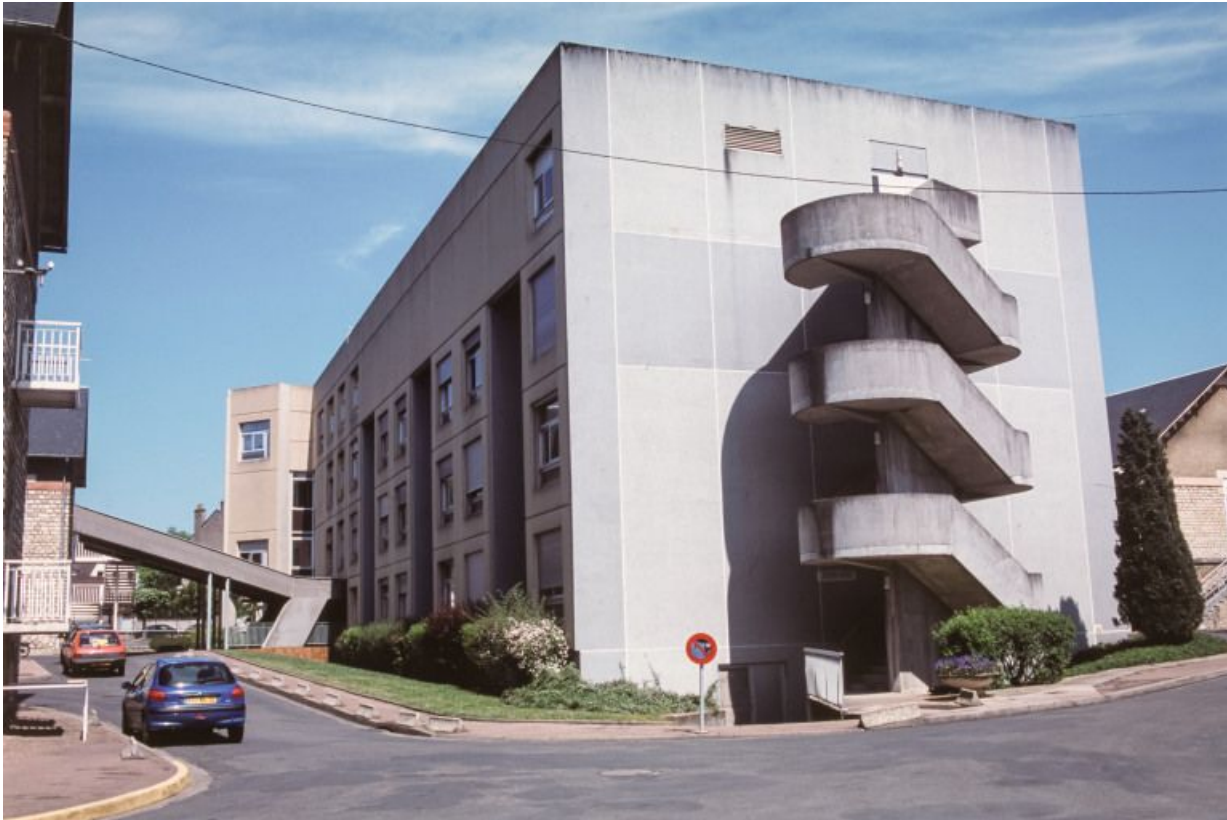
Maternité, élévation latérale.