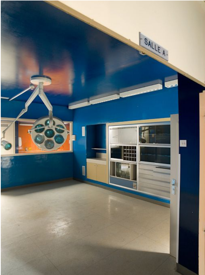
Bâtiment Maternité-Gynécologie (Gérontologie au moment de la prise de vue) : ancienne salle d'accouchement. 58, Nevers Colbert