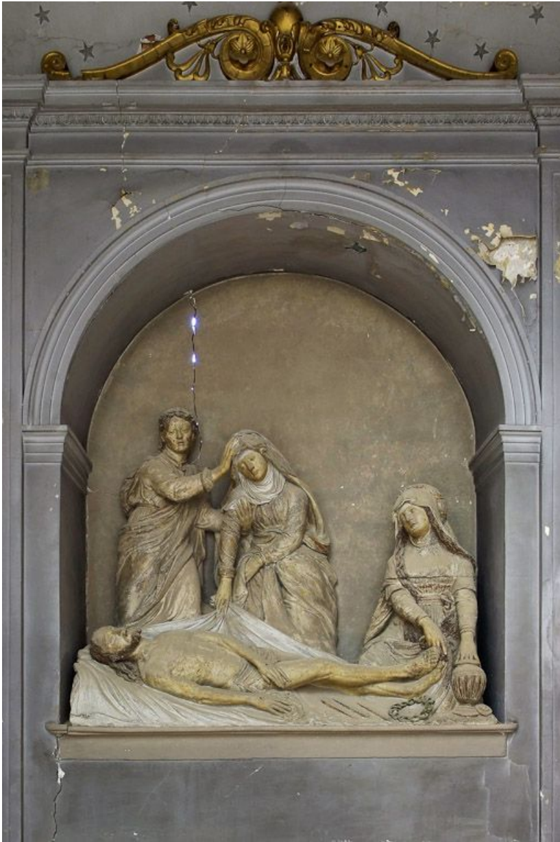
Chapelle : enfeu avec piéta.