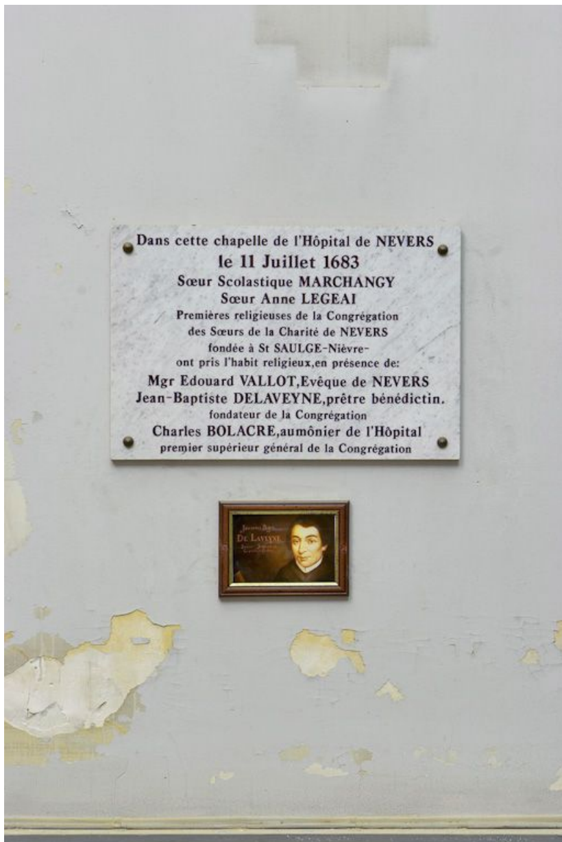
Chapelle : plaque commémorant l'arrivée des soeurs hospitalières à l'hôpital général. 58, Nevers Colbert