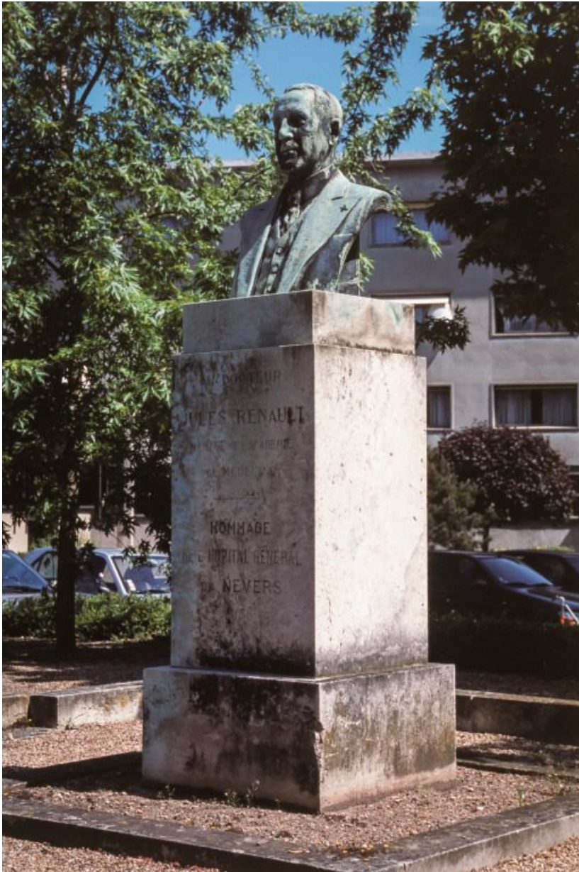
Buste du docteur Jules Renault, vue d'ensemble du monument. 58, Nevers Colbert