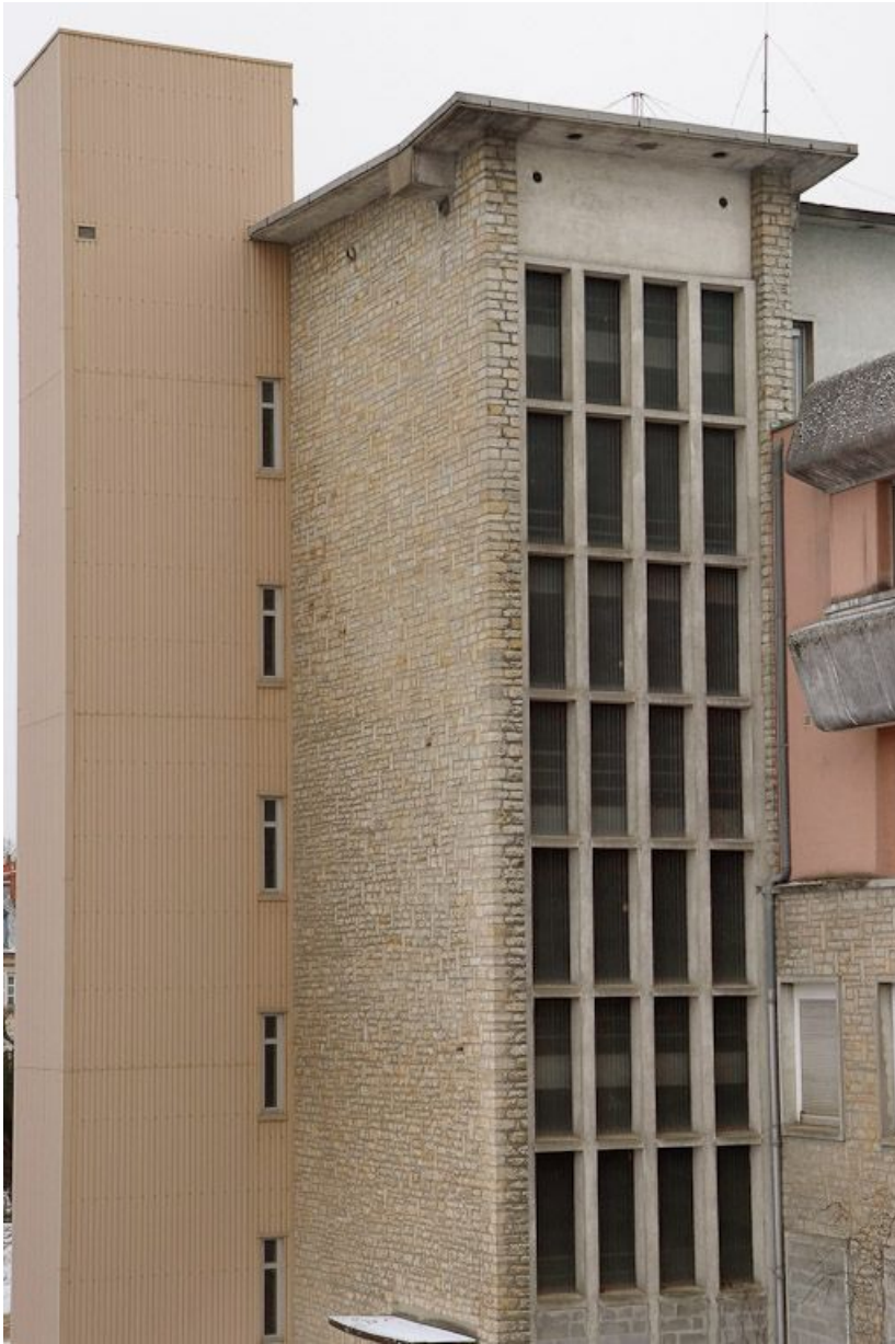
Aile postérieure du Bâtiment Inconnu (service de radiologie) : détail d'une cage d'escalier. 58, Nevers Colbert