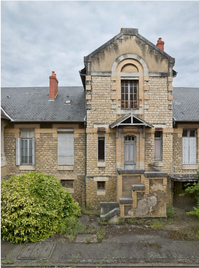
Pavillon Bricheteau (pédiatrie) : détail de la travée centrale. 58, Nevers Colbert