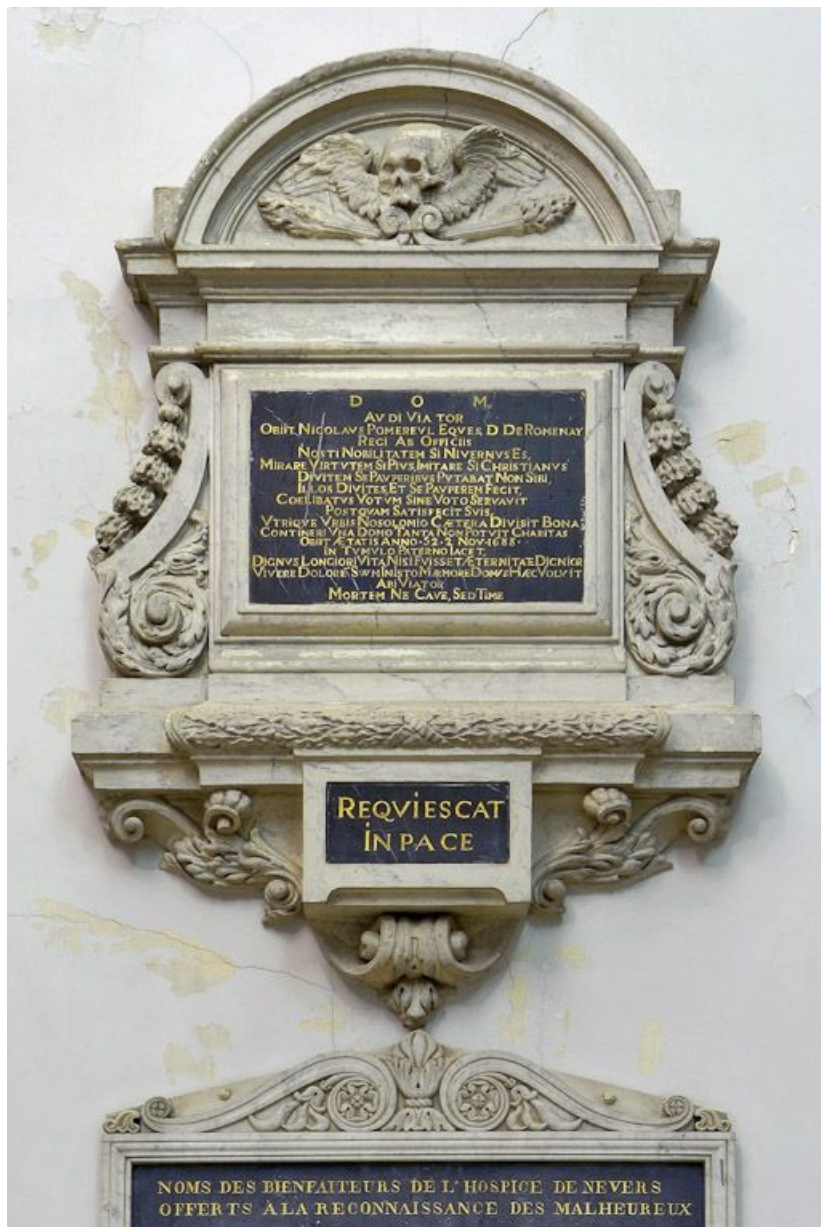
Chapelle : plaque funéraire.