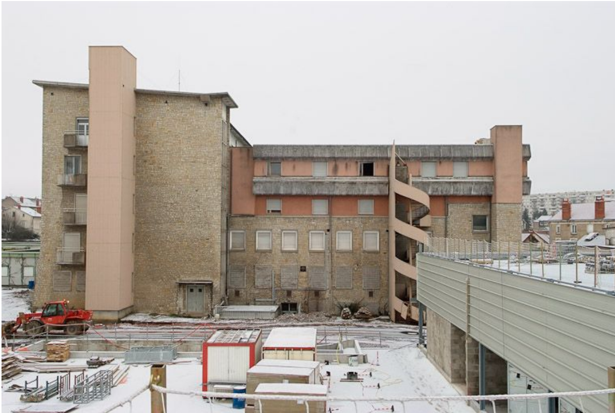
Aile postérieure du Bâtiment Inconnu (service de radiologie) : vue vers le Nord. 58, Nevers Colbert