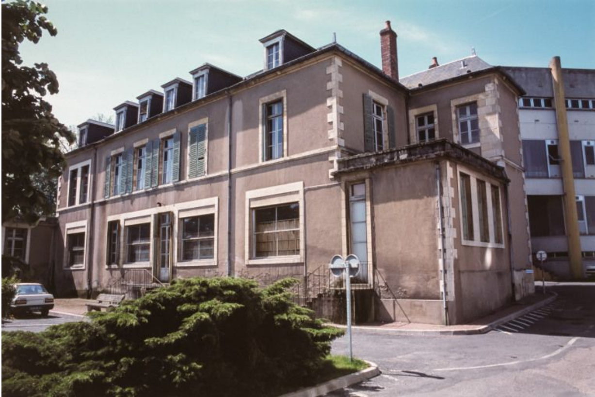
Bâtiment de biologie, façade postérieure. 58, Nevers Colbert