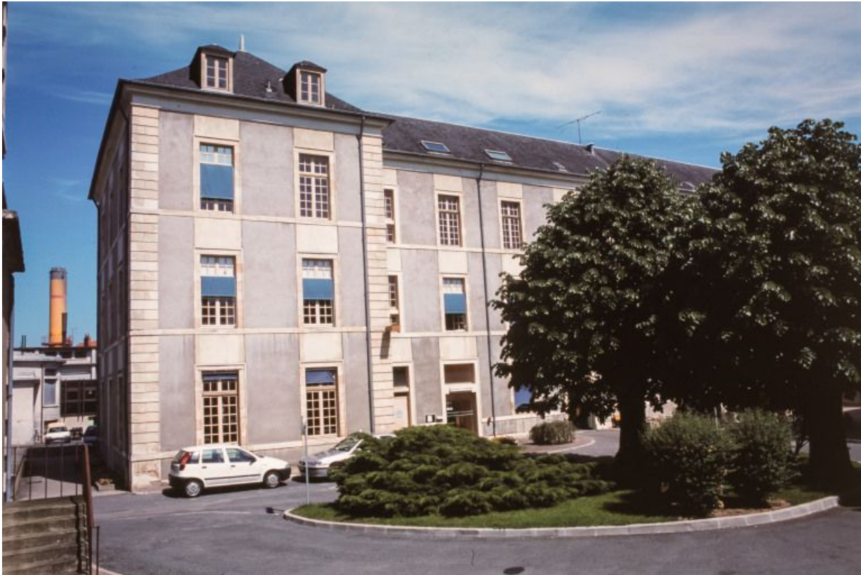
Bâtiment de l'hospice.