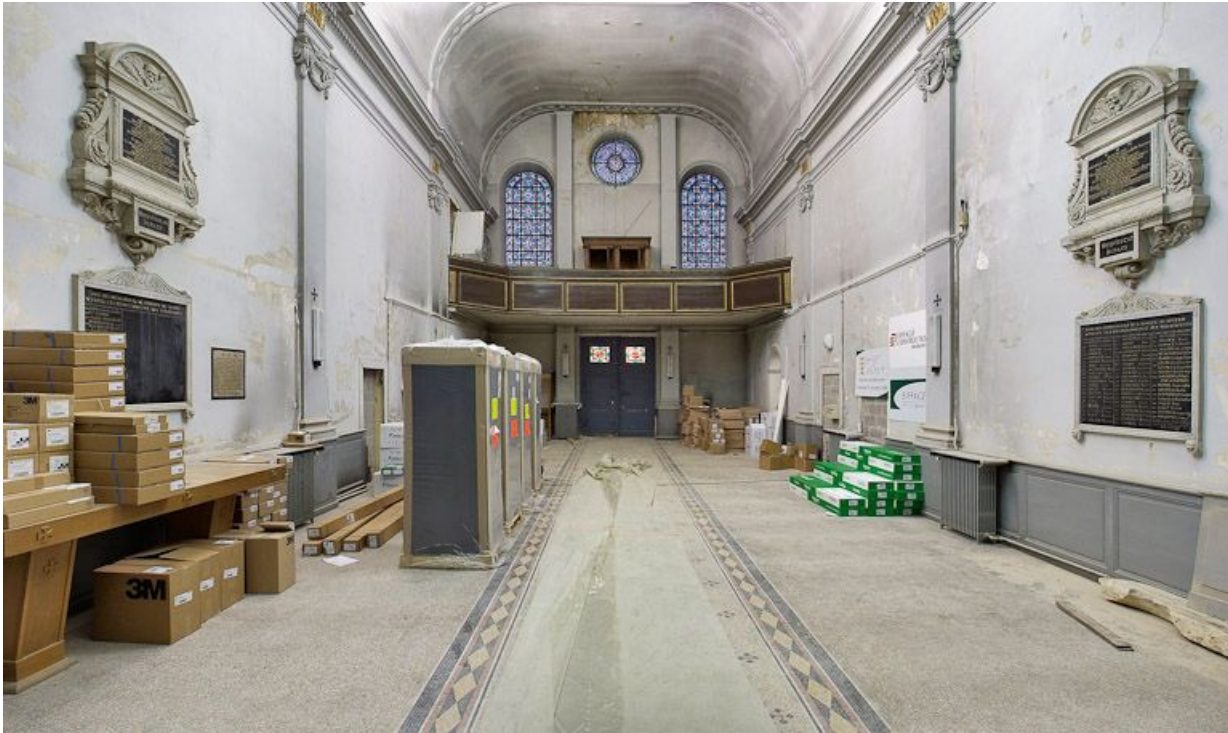
Vue intérieure de l'ancienne chapelle.