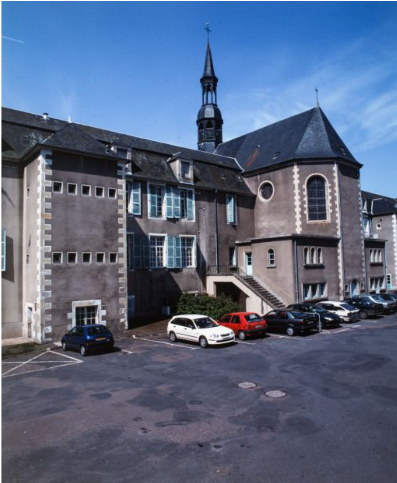
Façade postérieure : chevet de la chapelle.