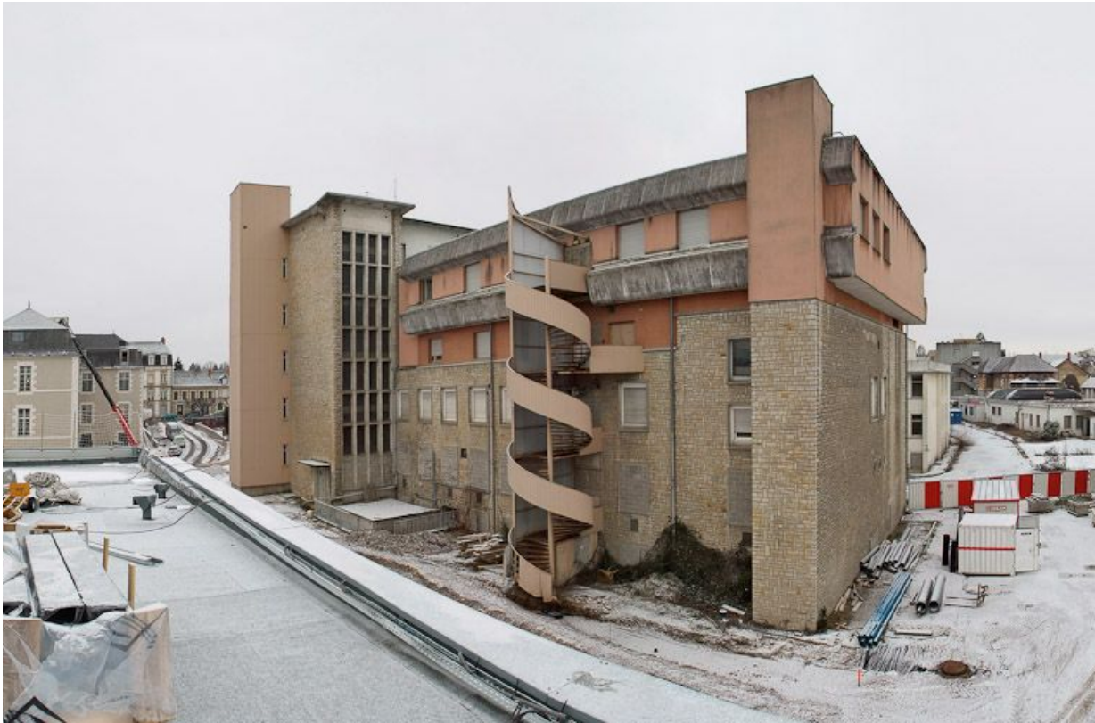
Aile postérieure du Bâtiment Inconnu (service de radiologie) : vue vers le Nord-Ouest. 58, Nevers Colbert

N° de l'illustration : 20105800029NUC4AQ