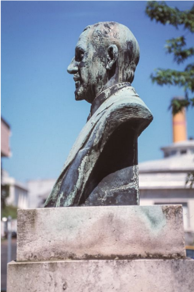
Buste du docteur Jules Renault, vue de profil.