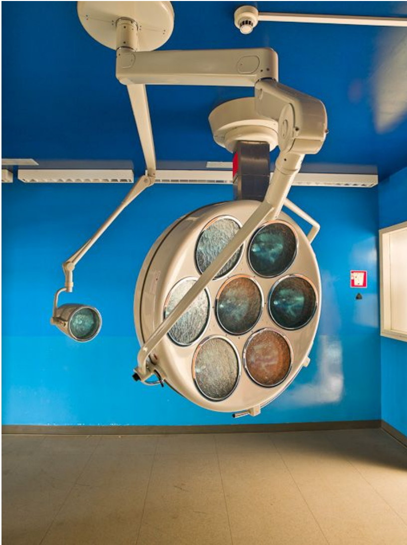
Bâtiment Maternité-Gynécologie (Gérontologie au moment de la prise de vue) : ancienne salle d'accouchement, scyalitique. 58, Nevers Colbert