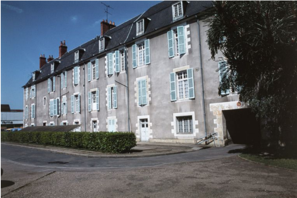
Aile en retour sur la façade postérieure.