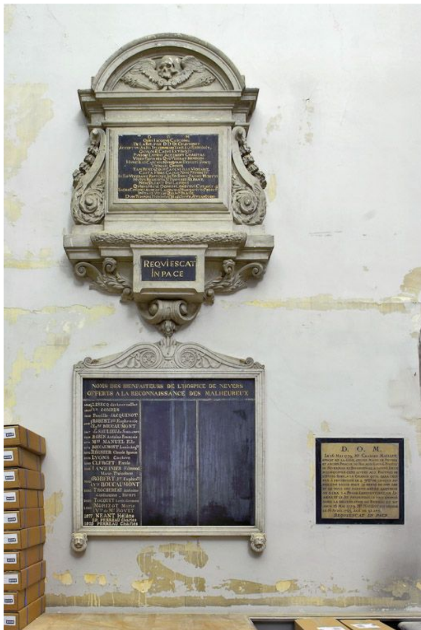
Chapelle : ensemble de trois plaques sur le mur Sud. 58, Nevers Colbert