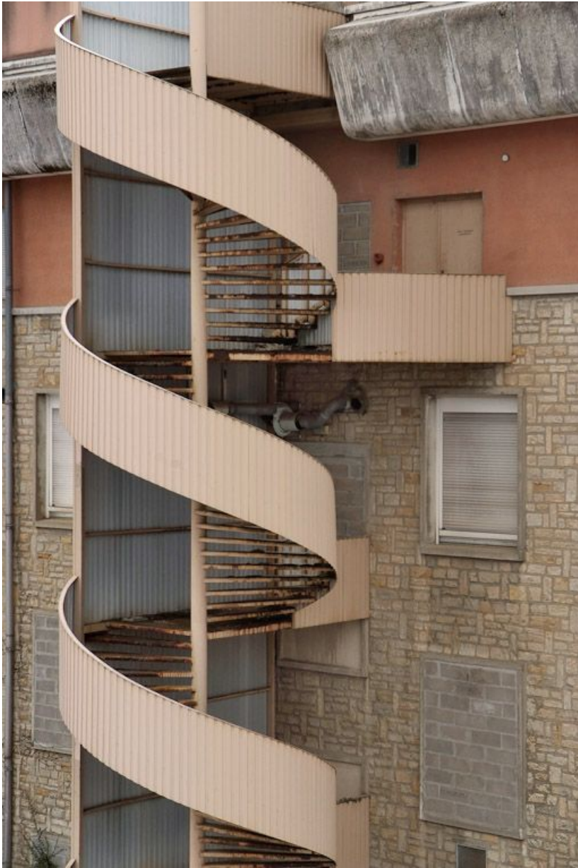
Aile postérieure du Bâtiment Inconnu (service de radiologie) : détail d'une cage d'escalier. 58, Nevers Colbert