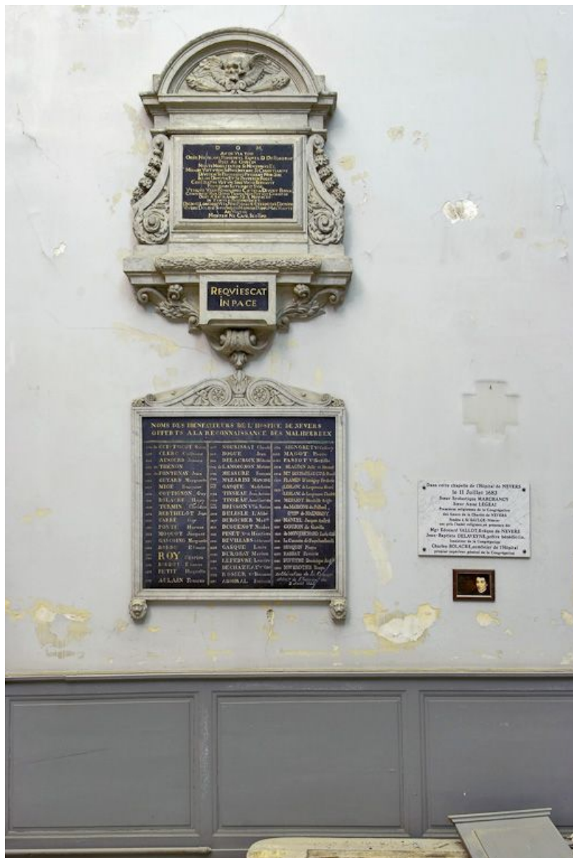
Chapelle : ensemble de trois plaques commémorant les bienfaiteurs de l'hôpital sur le mur Nord. 58, Nevers Colbert