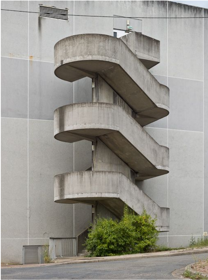
Bâtiment Maternité-Gynécologie (Gérontologie au moment de la prise de vue) : détail de l'escalier extérieur du pignon Sud. 58, Nevers Colbert