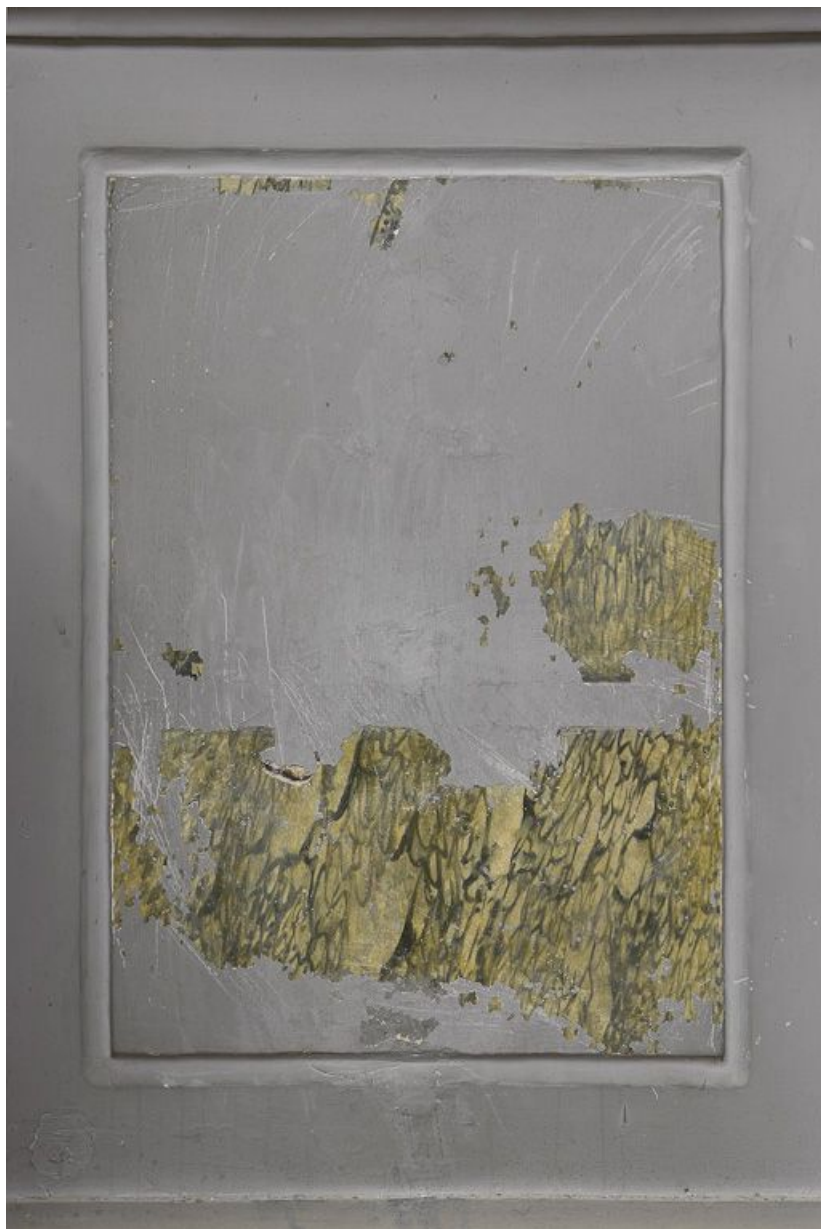
Chapelle : enduits peints successifs.