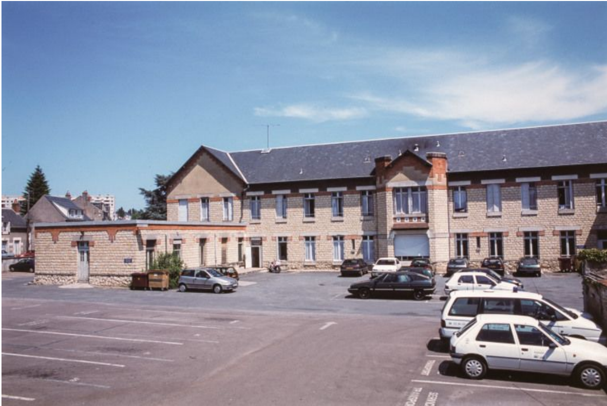
Service pédiatrique, façade.