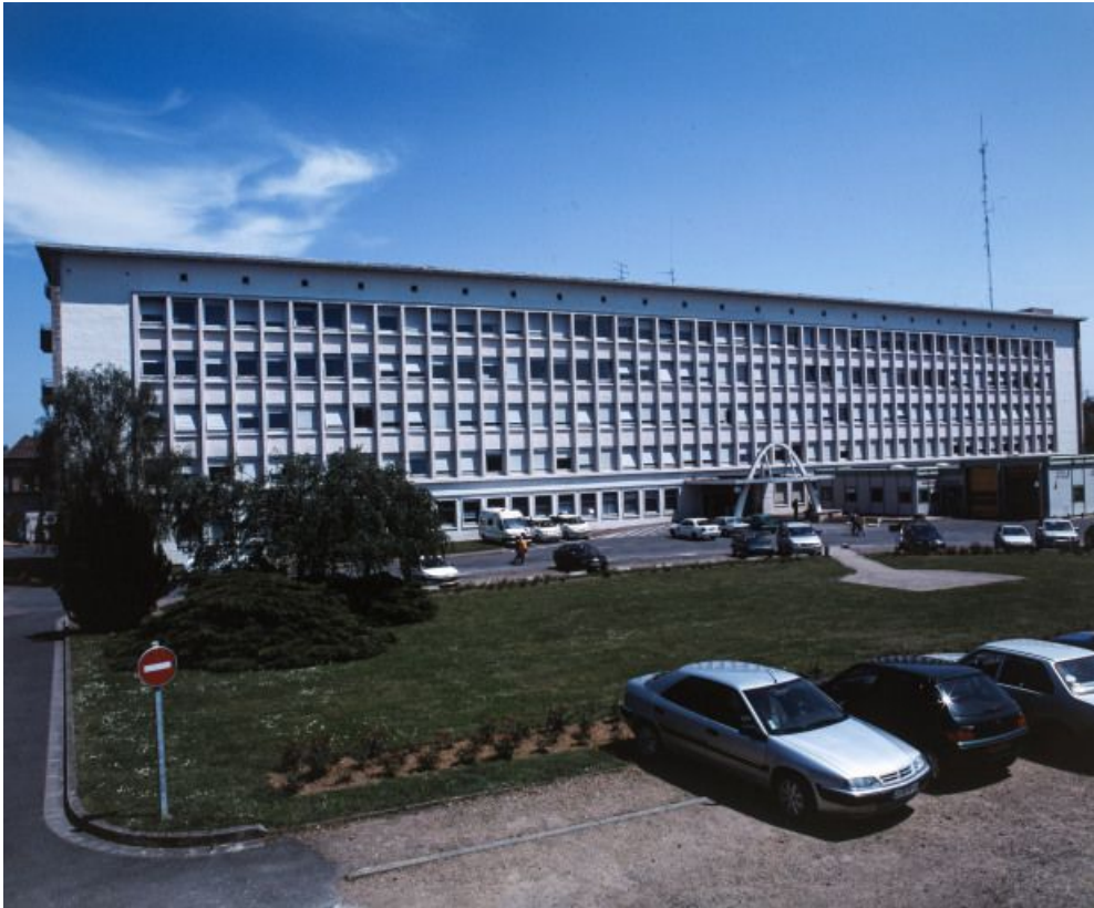
Bâtiment de chirurgie, façade antérieure. 58, Nevers Colbert