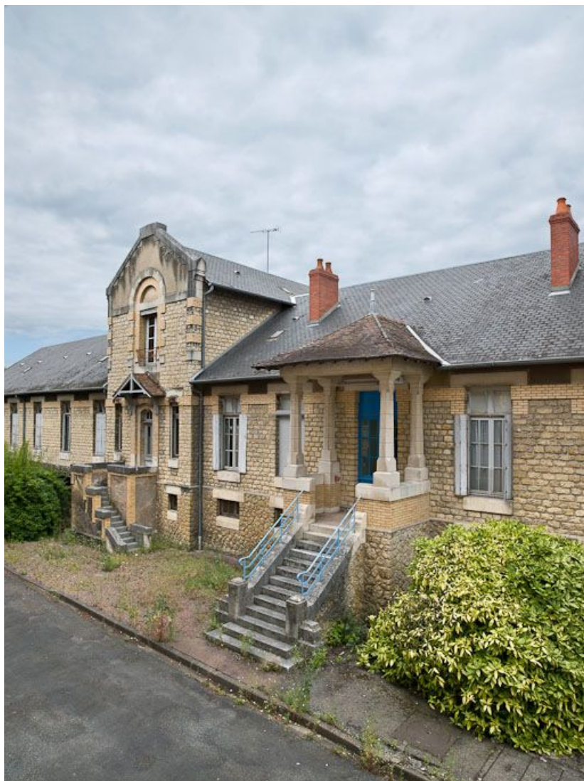
Pavillon Bricheteau (pédiatrie) : façade antérieure.