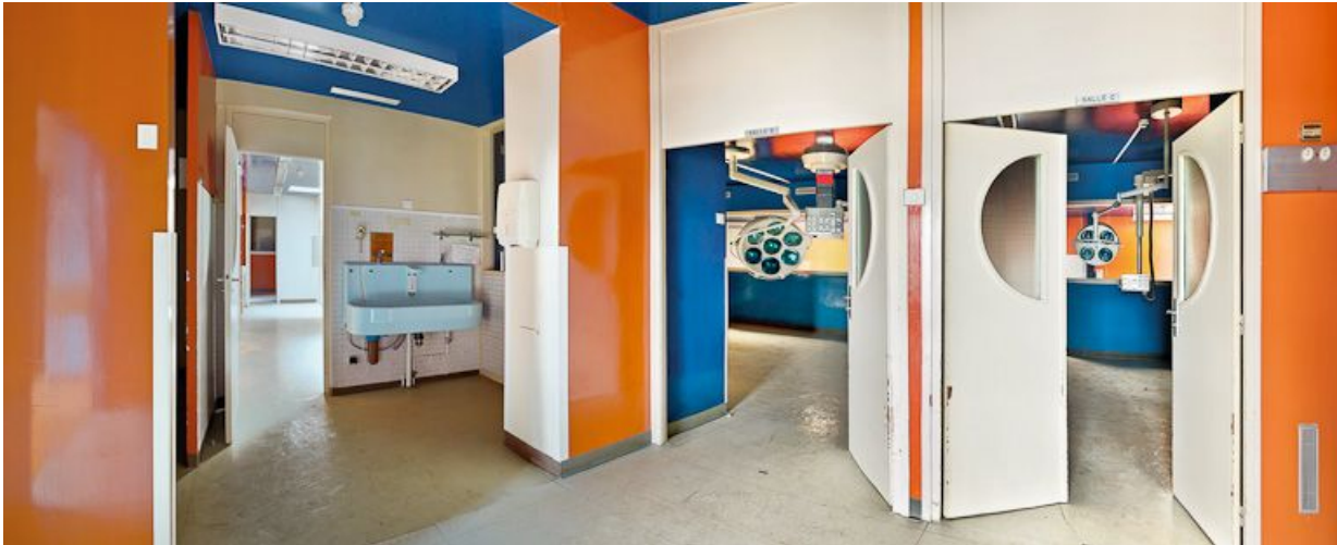
Bâtiment Maternité-Gynécologie (Gérontologie au moment de la prise de vue) : ancienne salle d'accouchement. 58, Nevers Colbert

N° de l'illustration : 20105800042NUC2AQ