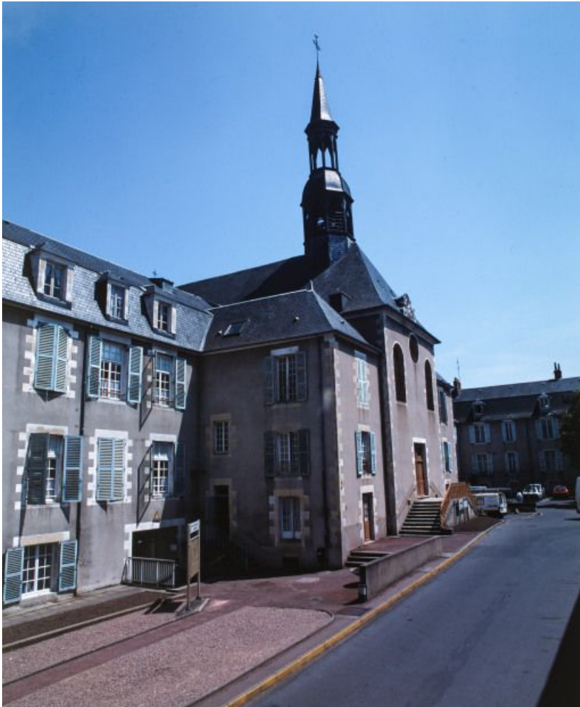
Façade antérieure de la chapelle.