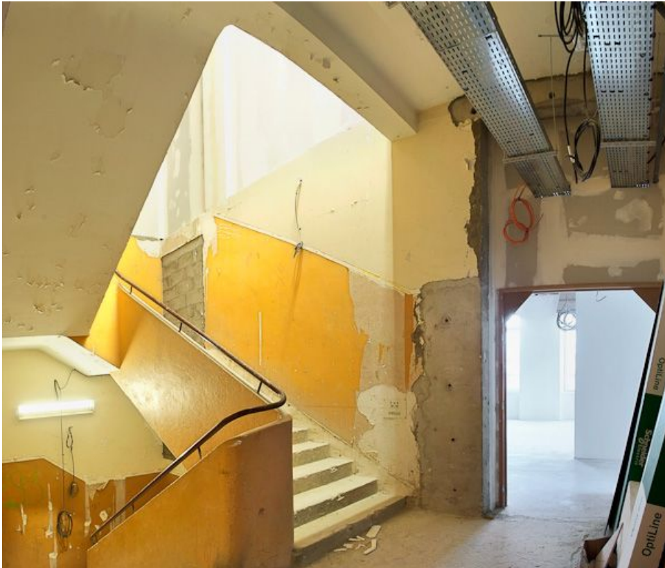
Cage d'escalier moderne.