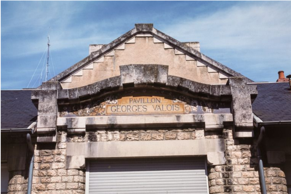
Service d'ophtalmologie (pavillon Georges Valois), détail. 58, Nevers Colbert