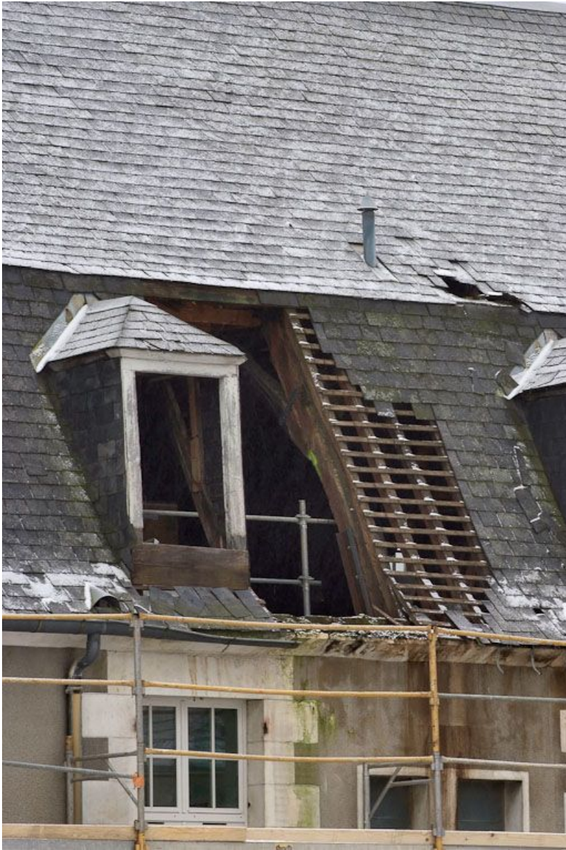
Détail de la couverture : un brisis et une lucarne.