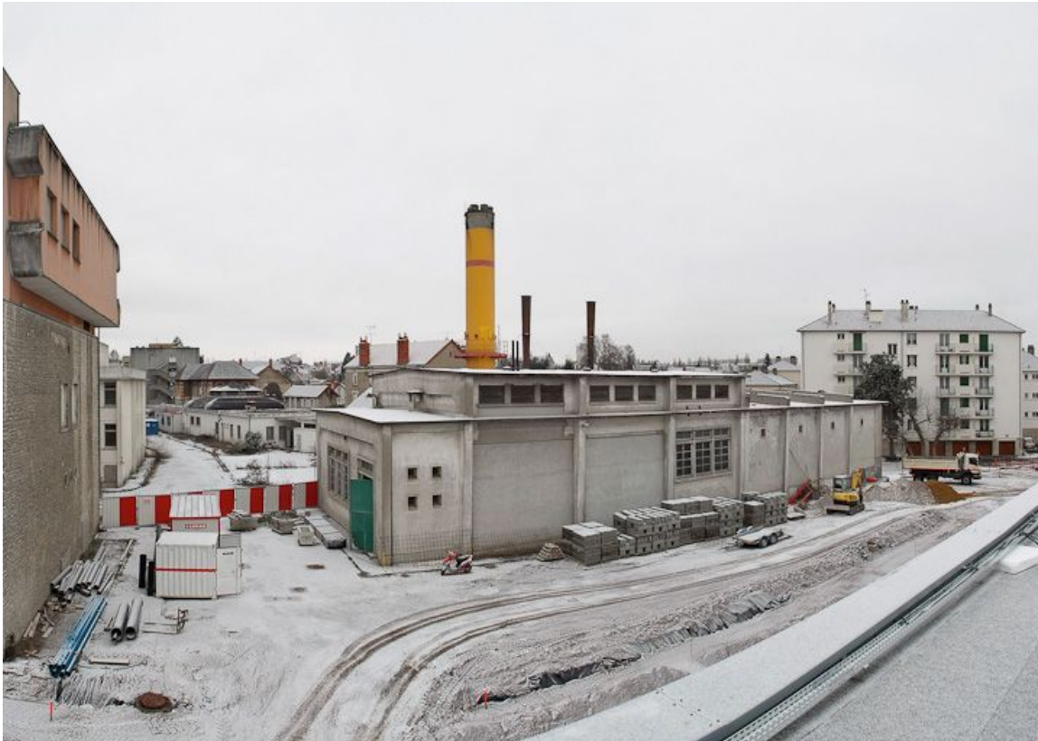
Vue d'ensemble vers le Nord-Est du bâtiment de la chaufferie. 58, Nevers Colbert

N° de l'illustration : 20105800032NUC4AQ