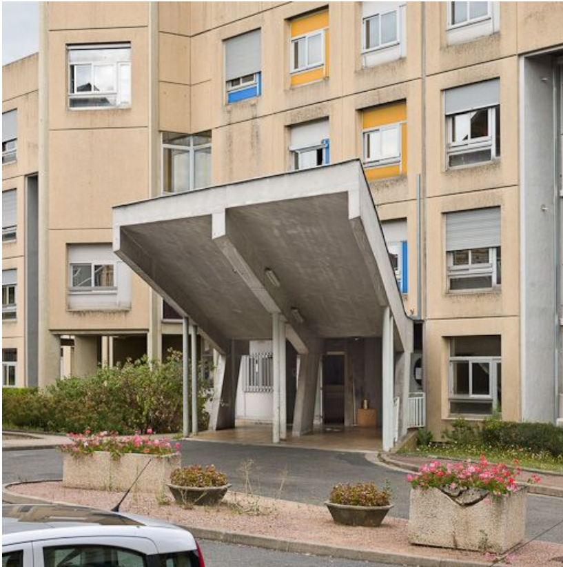
Bâtiment Maternité-Gynécologie (Gérontologie au moment de la prise de vue) : détail de l'auvent de la façade antérieure. 58, Nevers Colbert