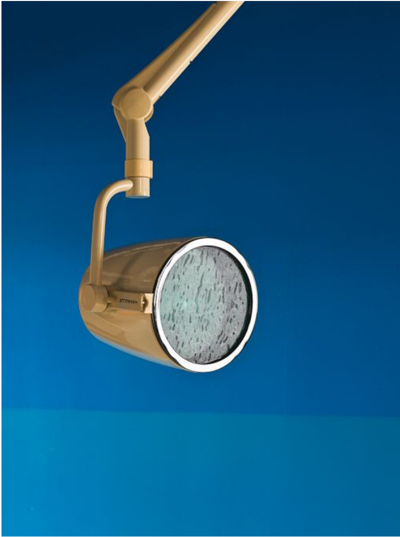
Bâtiment Maternité-Gynécologie (Gérontologie au moment de la prise de vue) : ancienne salle d'accouchement, projecteur. 58, Nevers Colbert