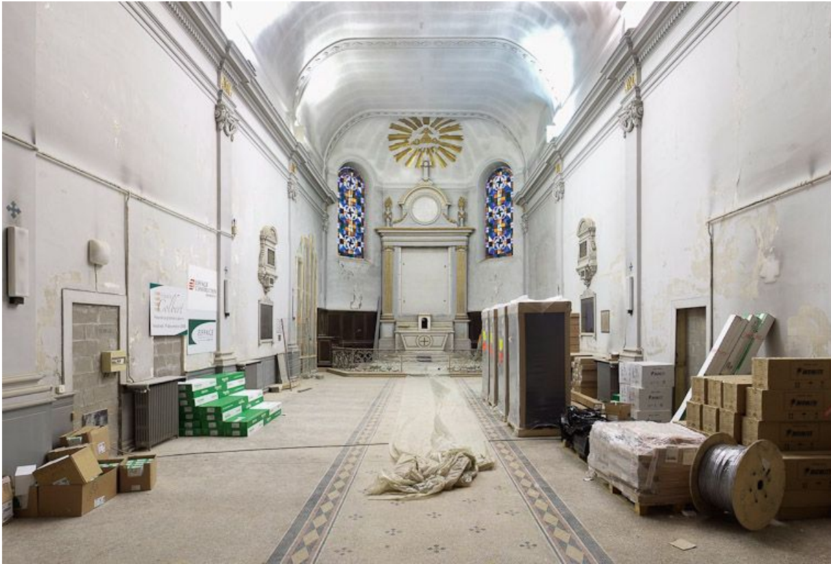
Vue intérieure de l'ancienne chapelle.