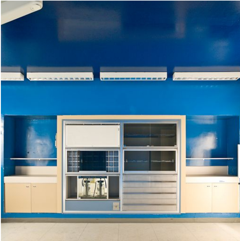
Bâtiment Maternité-Gynécologie (Gérontologie au moment de la prise de vue) : ancienne salle d'accouchement, rangements. 58, Nevers Colbert