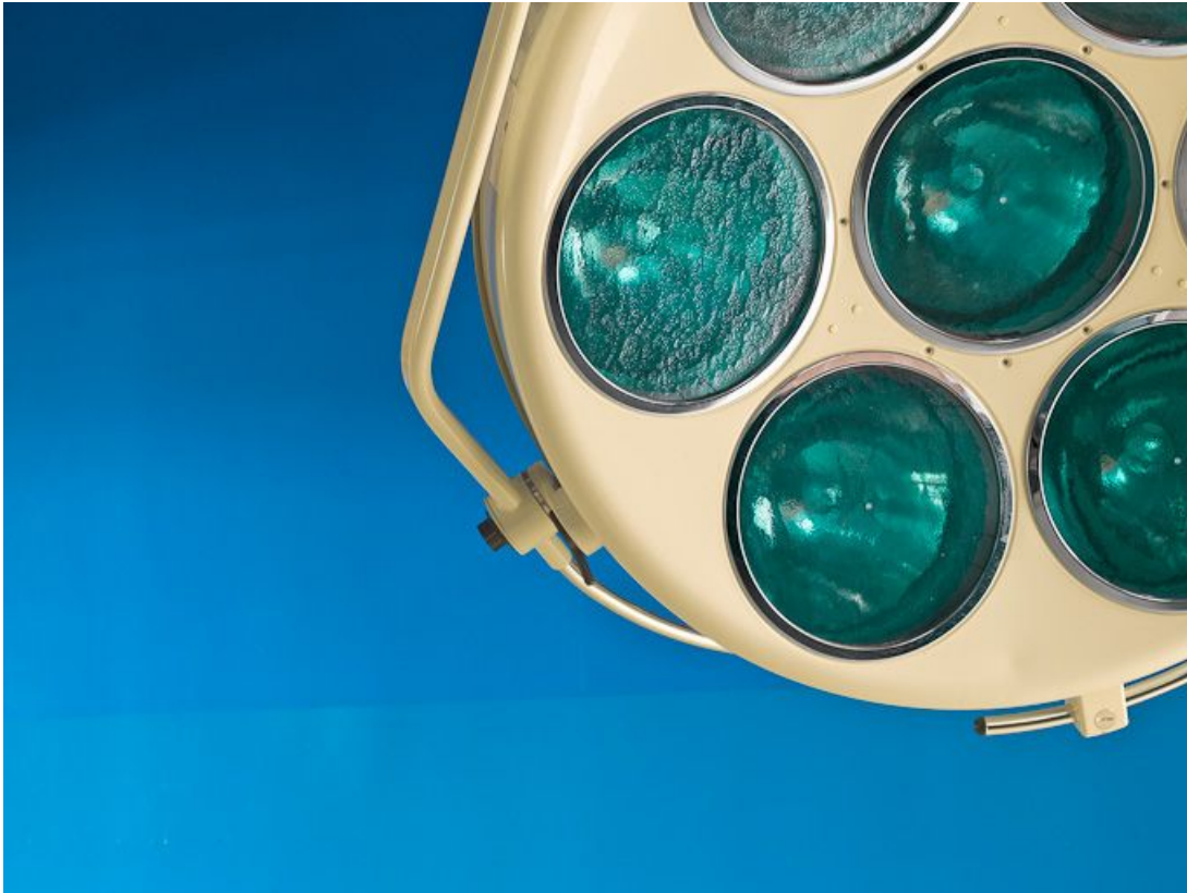
Bâtiment Maternité-Gynécologie (Gérontologie au moment de la prise de vue) : ancienne salle d'accouchement, scyalitique. 58, Nevers Colbert