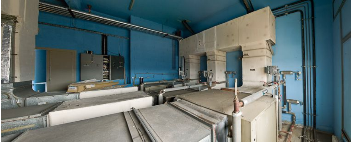
Bâtiment Maternité-Gynécologie (Gérontologie au moment de la prise de vue) : vue de la climatisation.