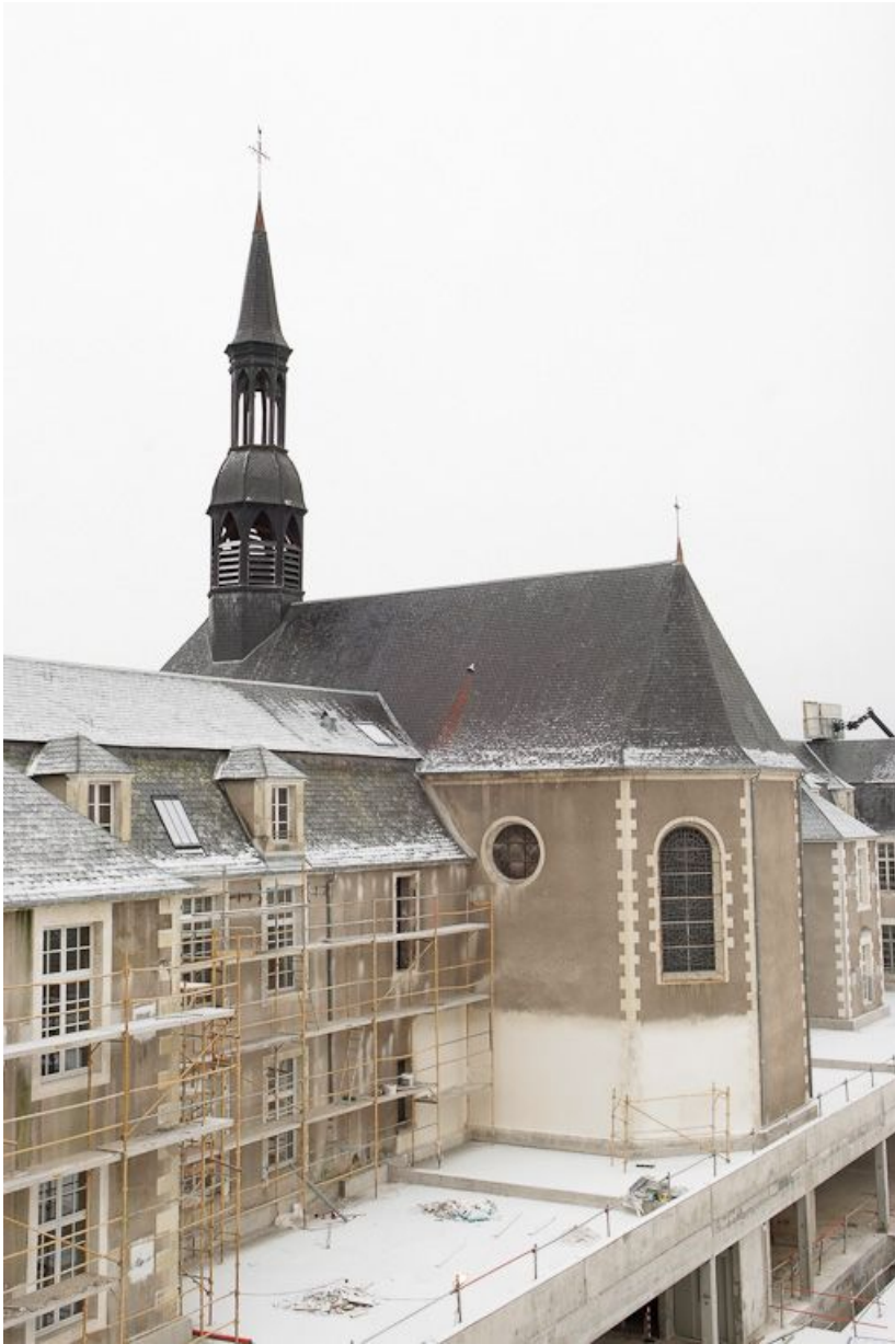
Vue sur la chapelle, vers le Nord, pendant le chantier. 58, Nevers Colbert