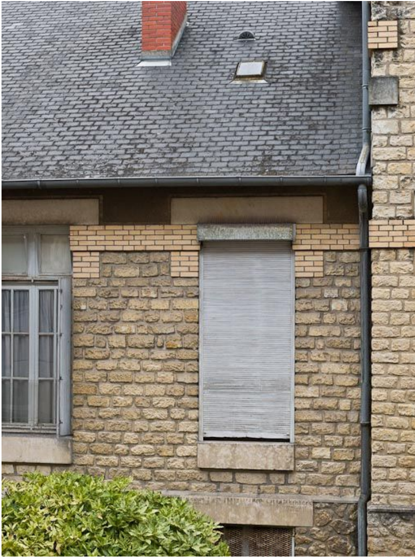
Pavillon Bricheteau (pédiatrie) : détail de la mise en oeuvre. 58, Nevers Colbert