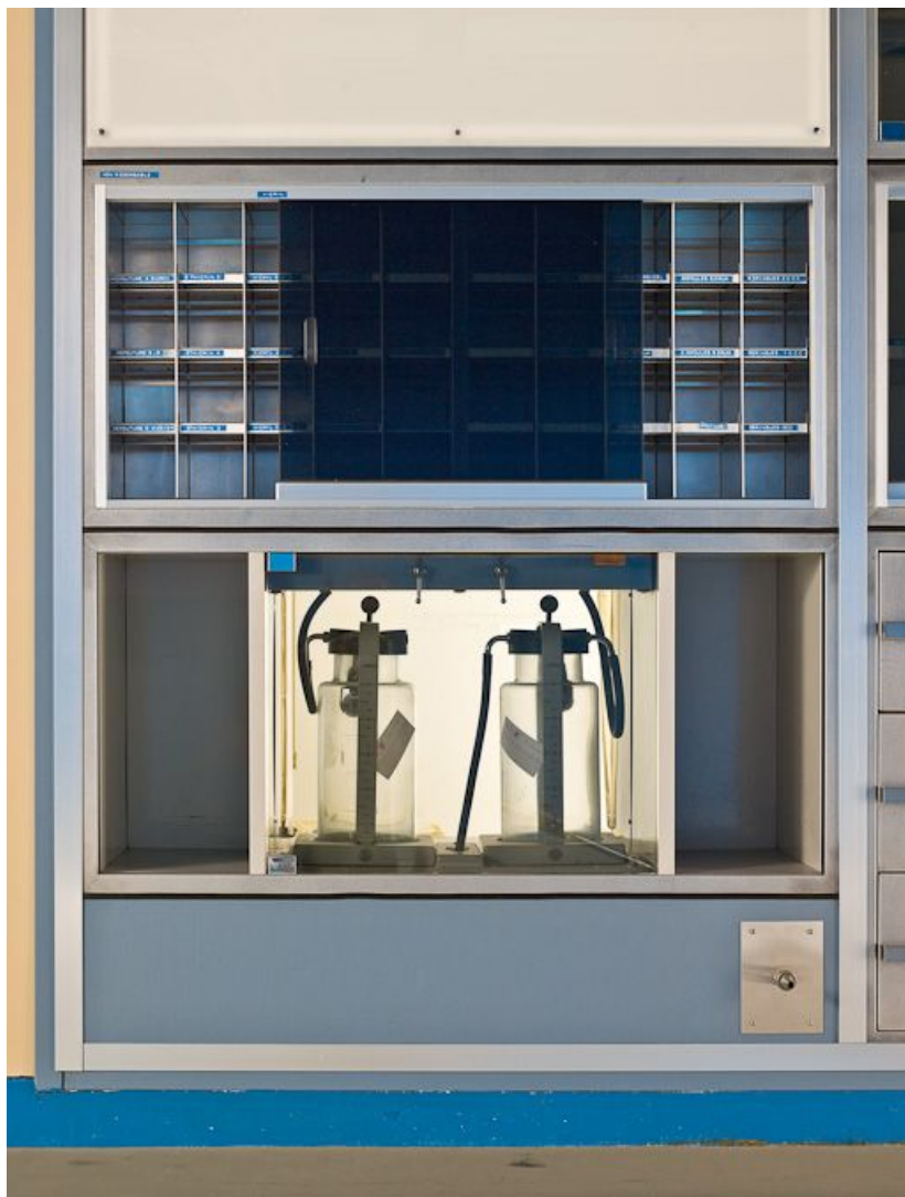
Bâtiment Maternité-Gynécologie (Gérontologie au moment de la prise de vue) : ancienne salle d'accouchement, pompe à vide. 58, Nevers Colbert