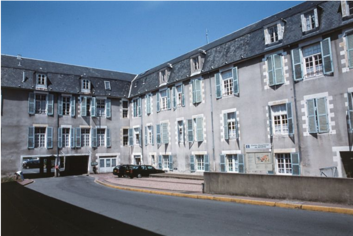
Façade postérieure, partie gauche.