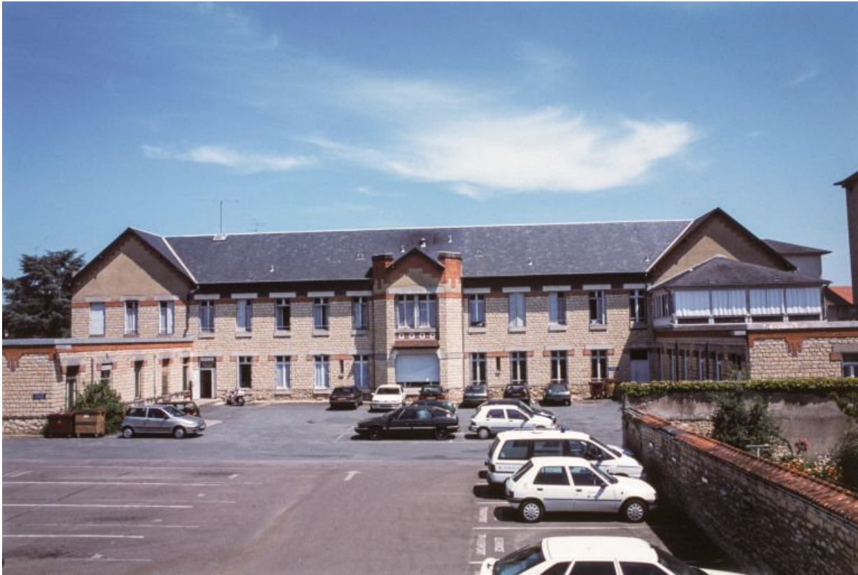
Service pédiatrique, façade. 58, Nevers Colbert