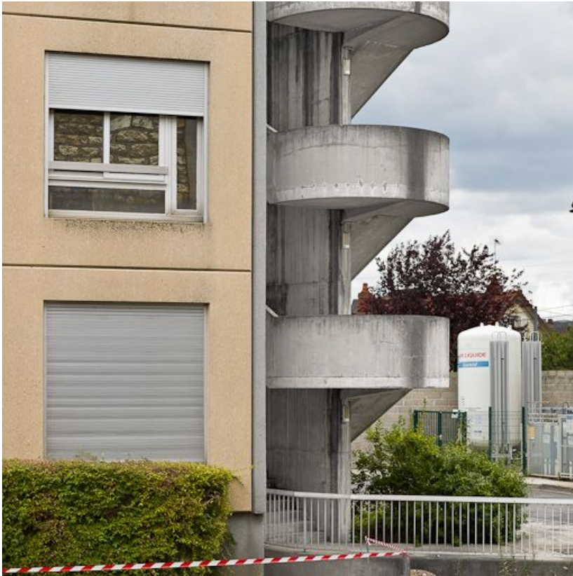
Bâtiment Maternité-Gynécologie (Gérontologie au moment de la prise de vue) : détail de l'escalier extérieur du pignon Sud. 58, Nevers Colbert