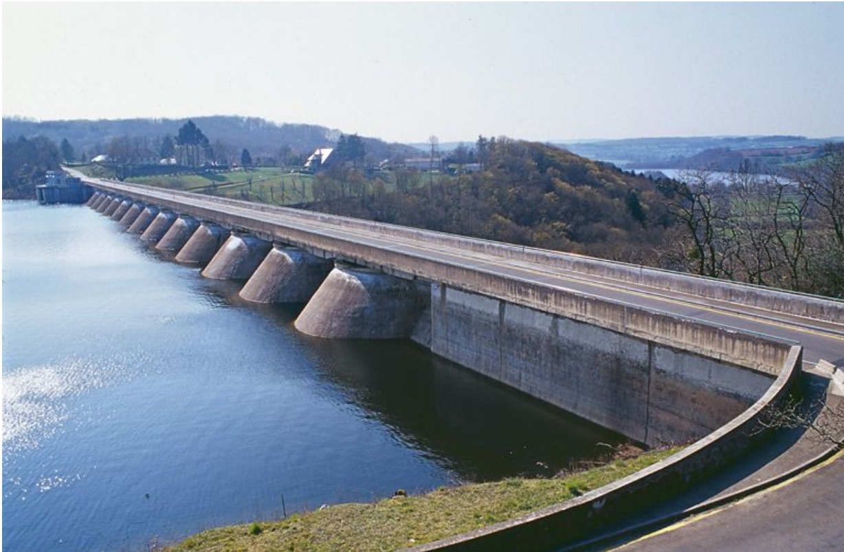
Le barrage, vue d'amont. En arrière-plan, on peut voir le bassin de compensation.