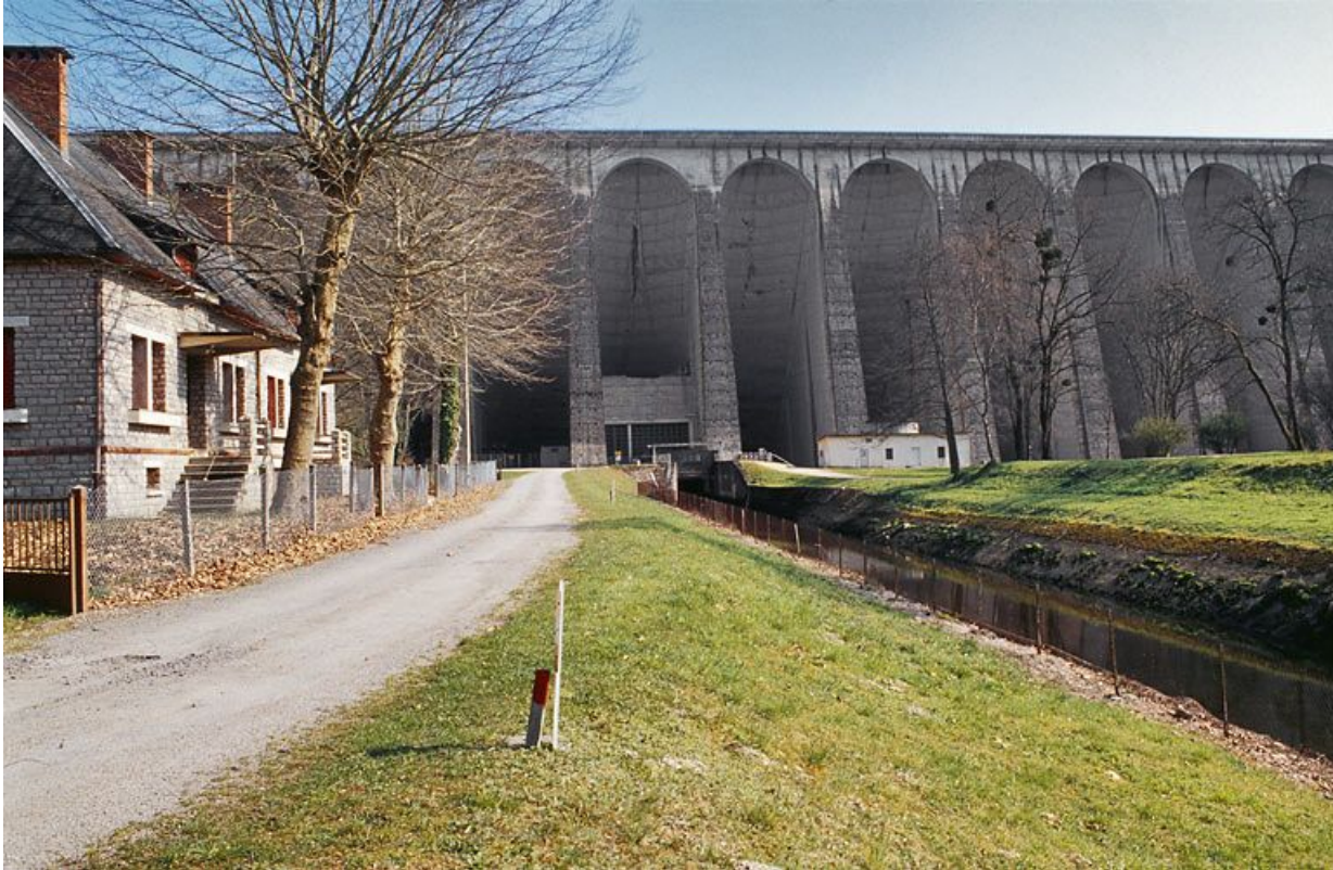
Vue d'aval : maisons et bureaux.