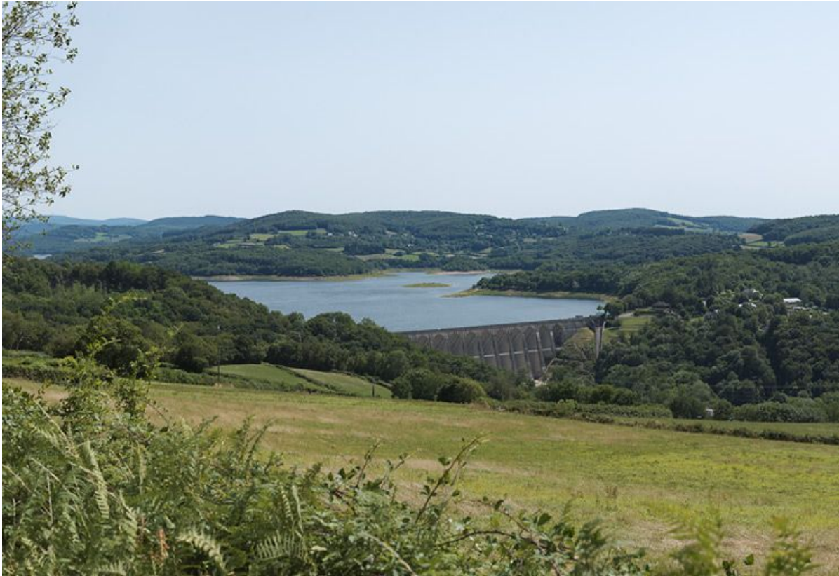
Vue de l'ensemble du barrage et du réservoir de Pannecière.