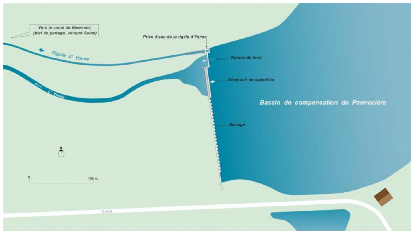
Carte schématique du bassin de compensation et de la prise d'eau de la rigole d'Yonne.