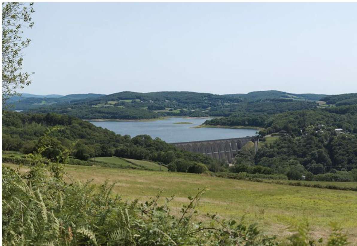
Vue de l'ensemble du barrage et du réservoir de Pannecière.