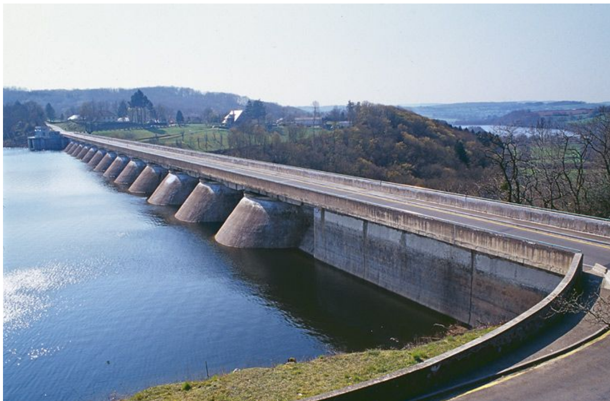
Le barrage, vue d'amont. En arrière-plan, on peut voir le bassin de compensation.