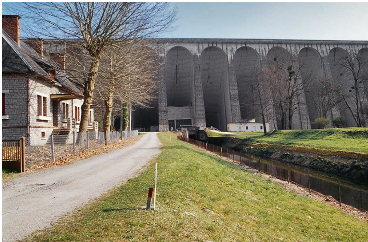
Vue d'aval : maisons et bureaux.