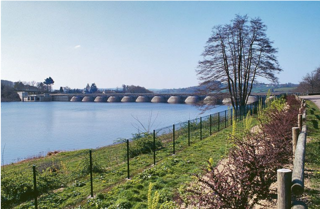
Le barrage, vue d'ensemble d'amont.