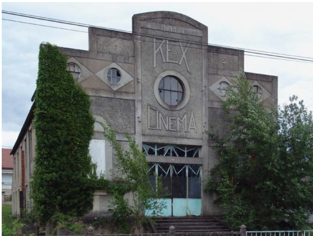
Elévation principale, en 2005.