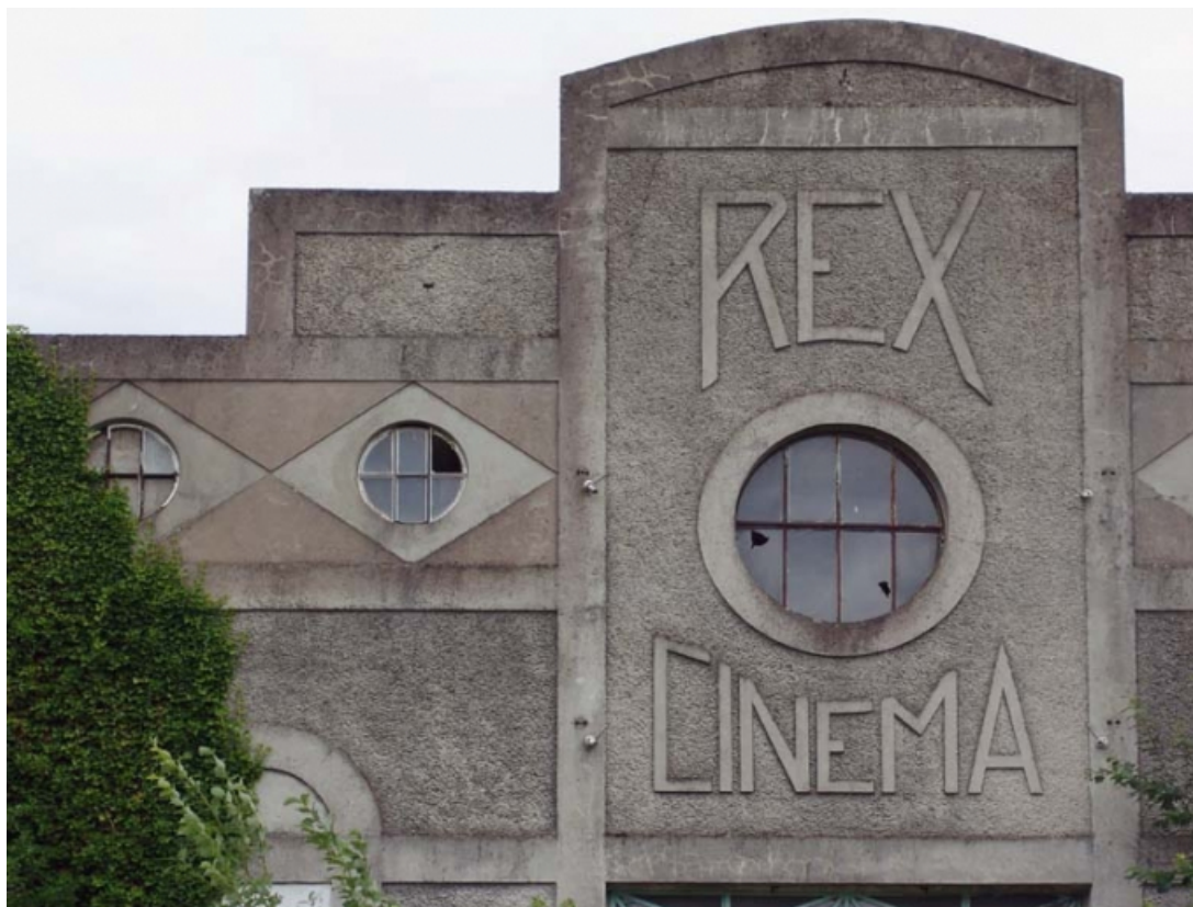
Elévation principale, en 2005 : décor en partie haute.