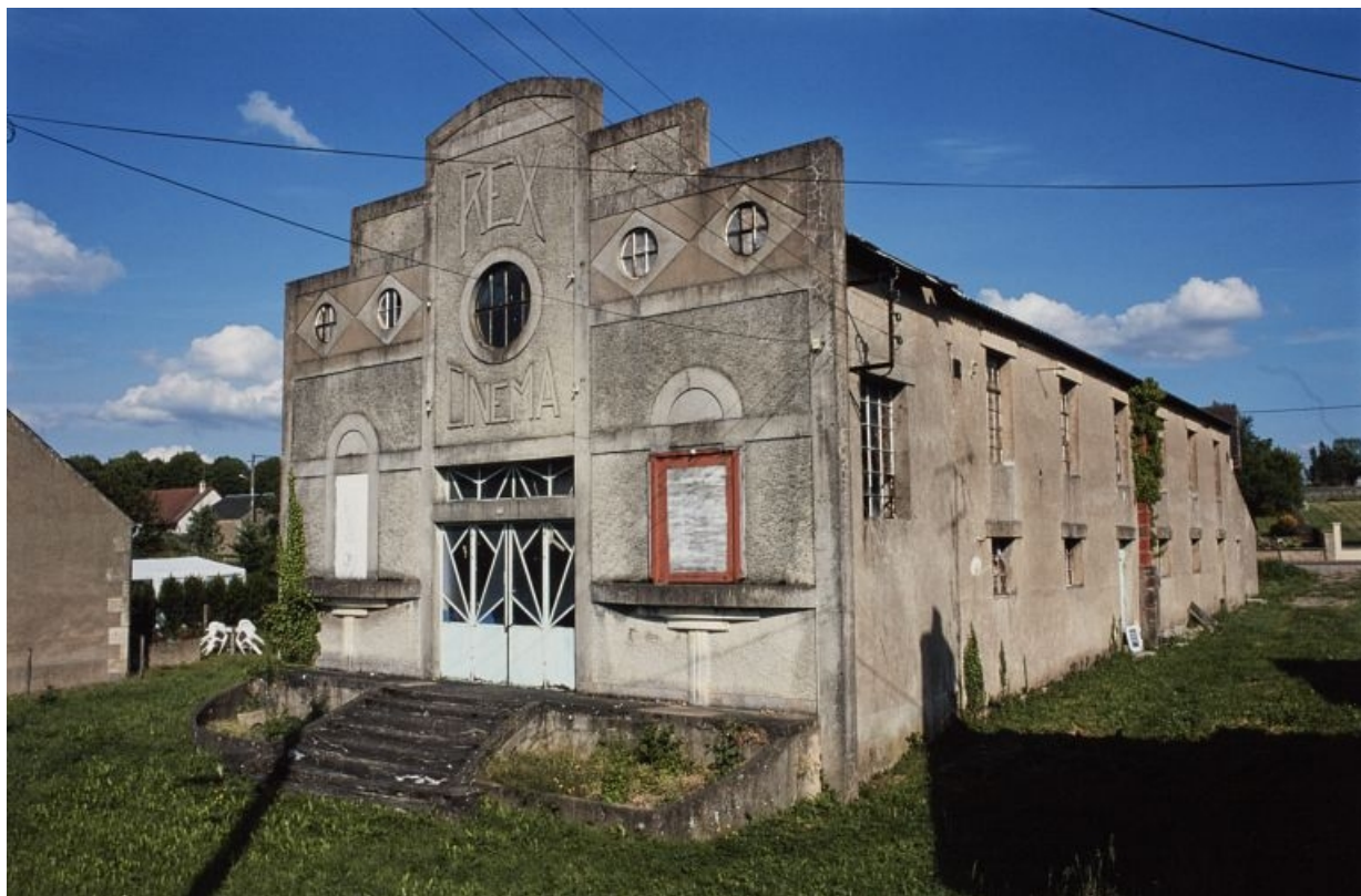
Élévation principale et latérale droite (en 2000), vue de trois-quarts. 58, Guérigny, 13 rue Masson