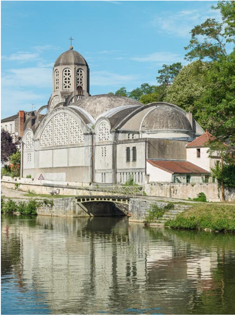
Vue d'ensemble depuis le canal du Nivernais.