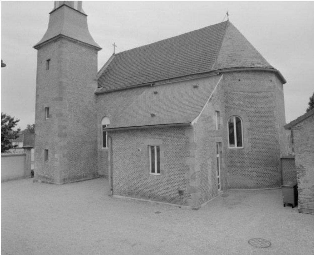
Vue d'ensemble du bâtiment, façade latérale droite.