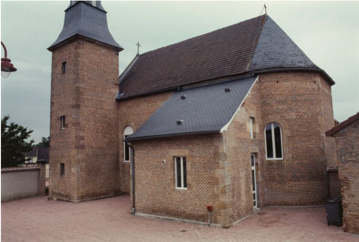
Vue d'ensemble du bâtiment, façade latérale droite.