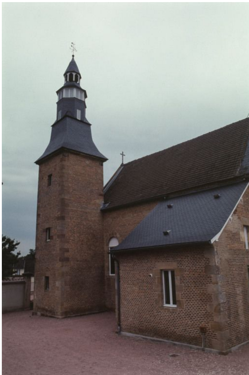
Vue d'ensemble du bâtiment, façade latérale droite.