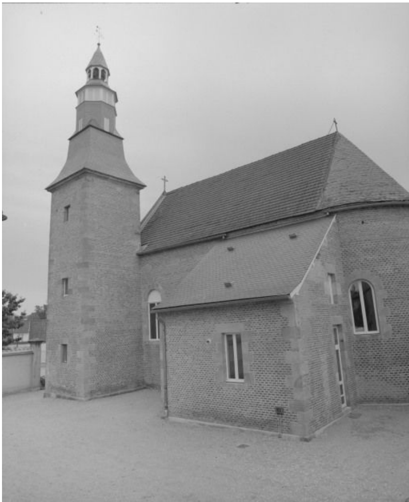
Vue d'ensemble du bâtiment, façade latérale droite.