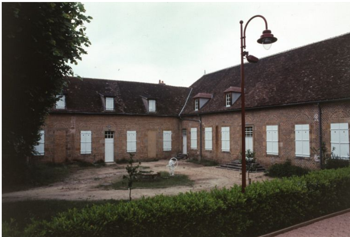
Vue d'ensemble du bâtiment : ancienne salle des malades et cour.