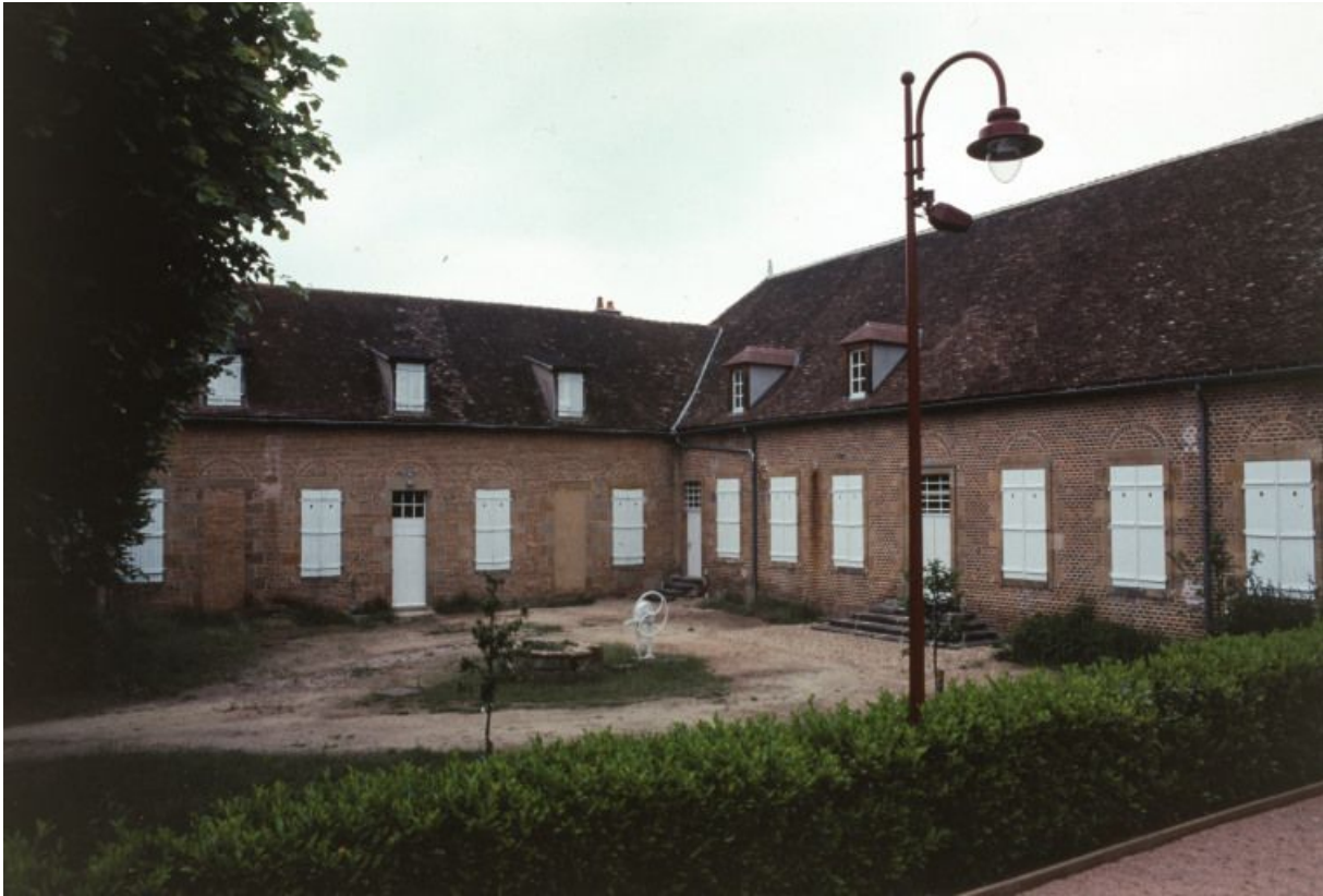
Vue d'ensemble du bâtiment : ancienne salle des malades et cour.