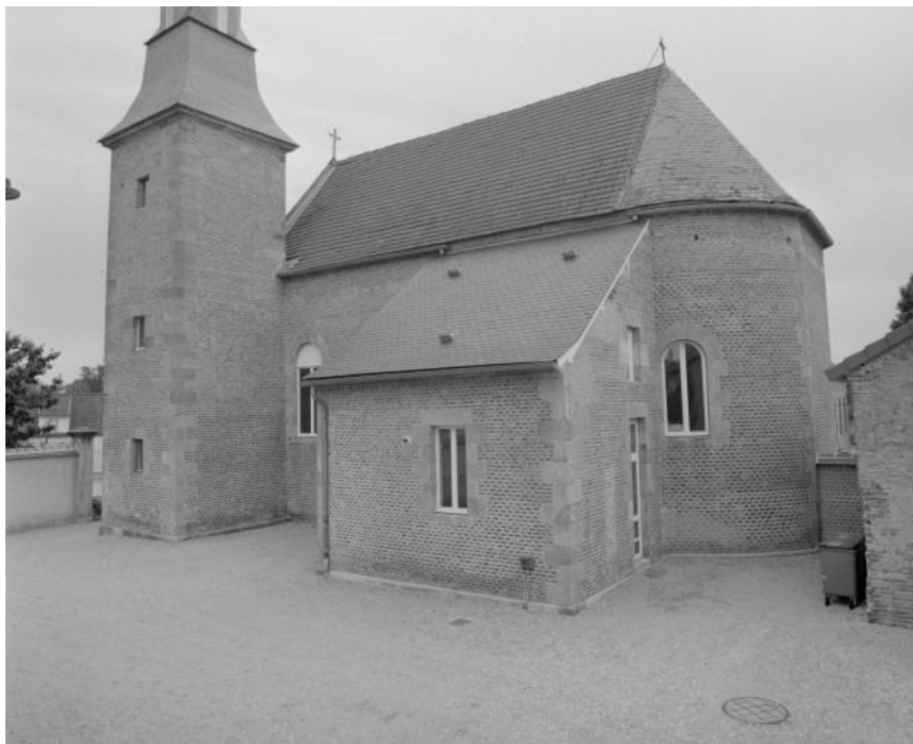
Vue d'ensemble du bâtiment, façade latérale droite.