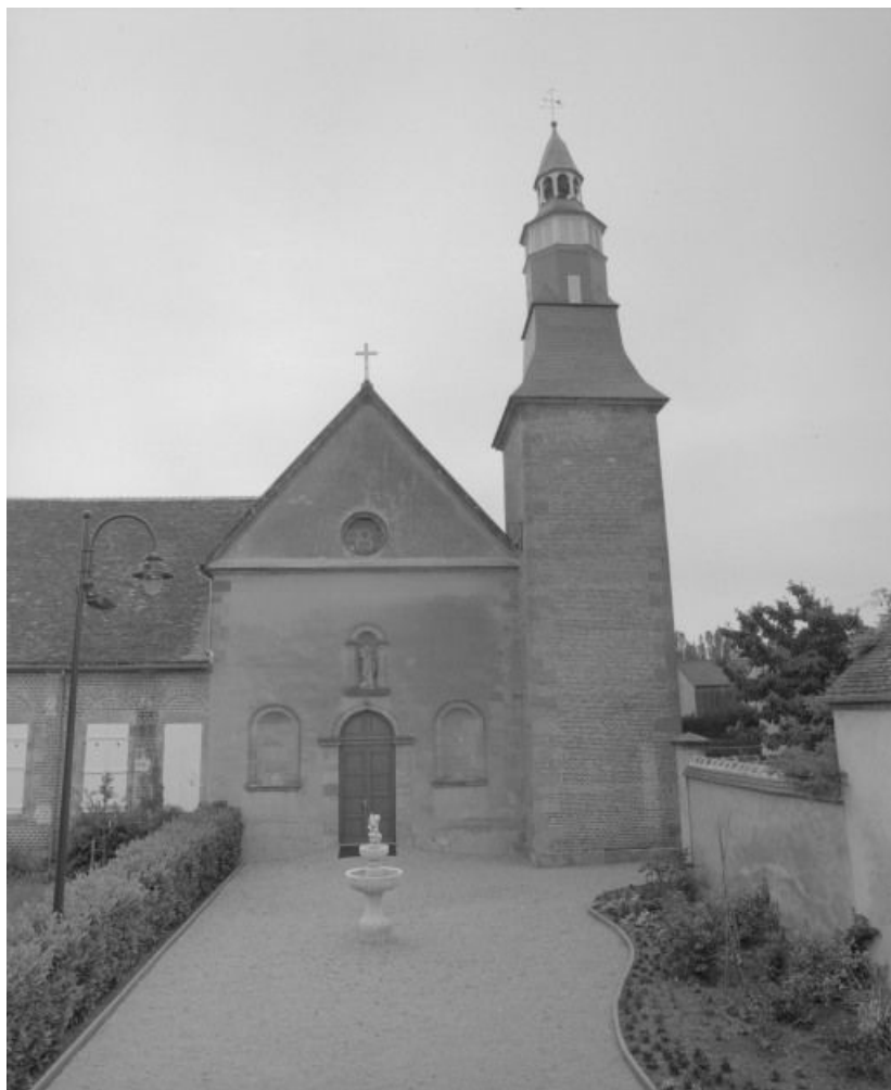
Vue d'ensemble de la façade antérieure du bâtiment.