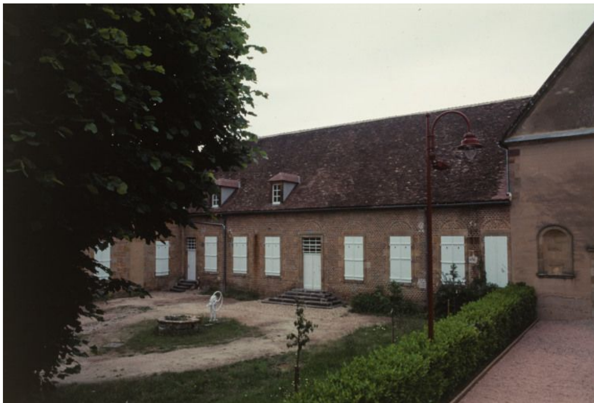
Vue d'ensemble du bâtiment : ancienne salle des malades et cour.