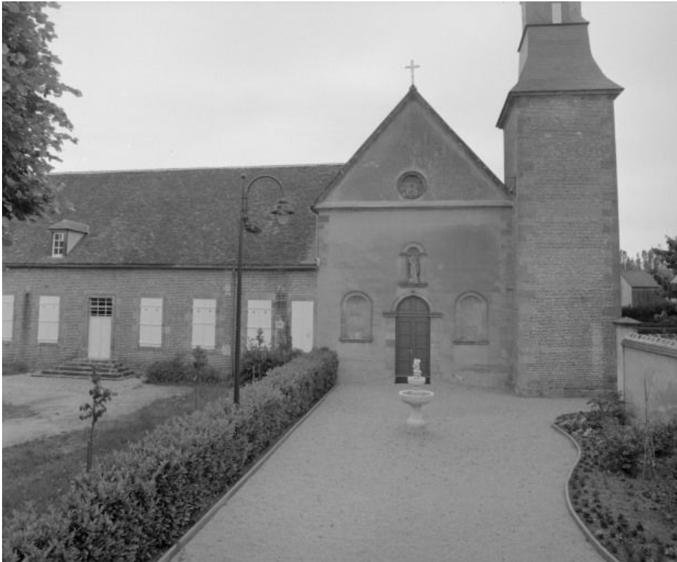
Vue d'ensemble de la façade antérieure du bâtiment.