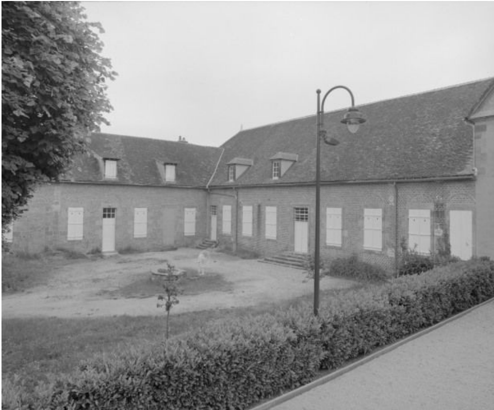
Vue d'ensemble du bâtiment : ancienne salle des malades et cour.