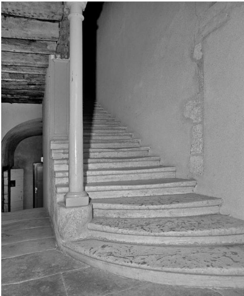
Vue de l'escalier du cloître.