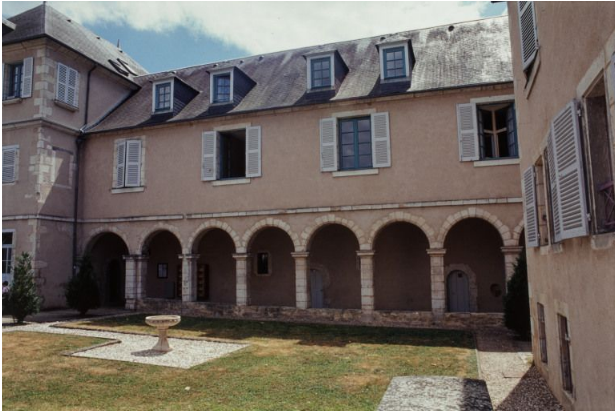
Vue d'ensemble du cloître.