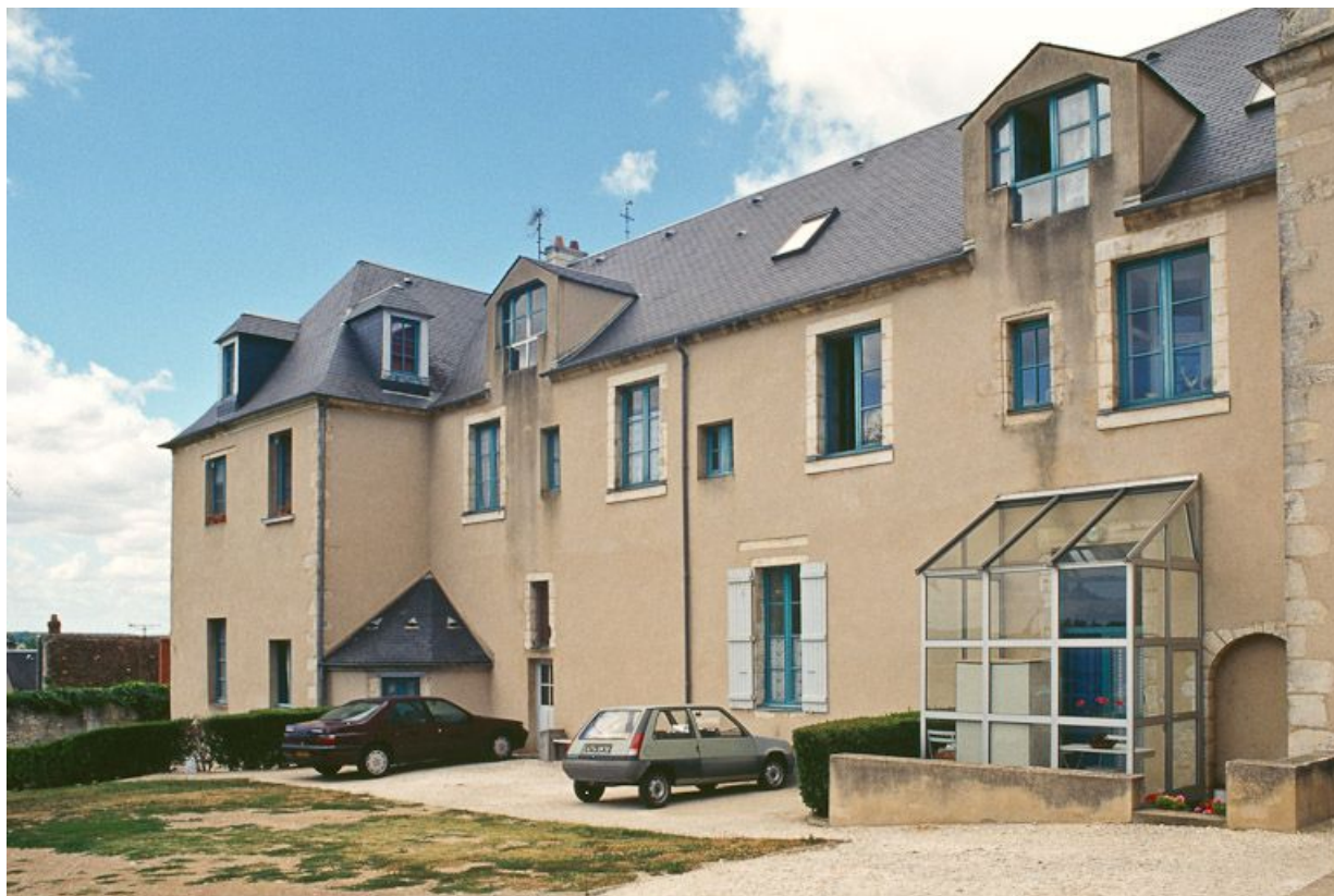
Vue du bâtiment principal, façade postérieure.