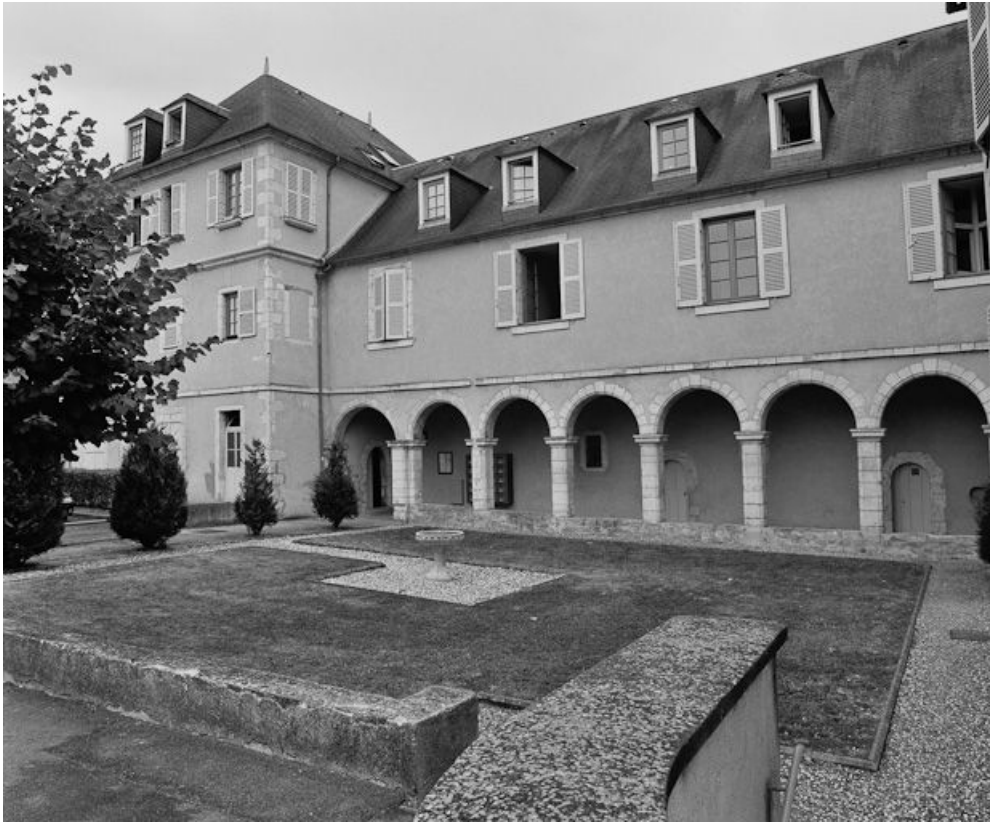
Vue du cloître.