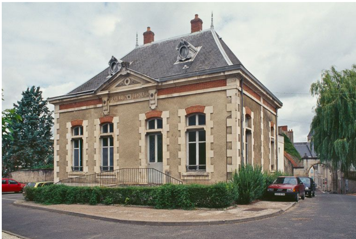
Vue d'ensemble du pavillon Lerasle. 58, La Charité-sur-Loire rue du Collège