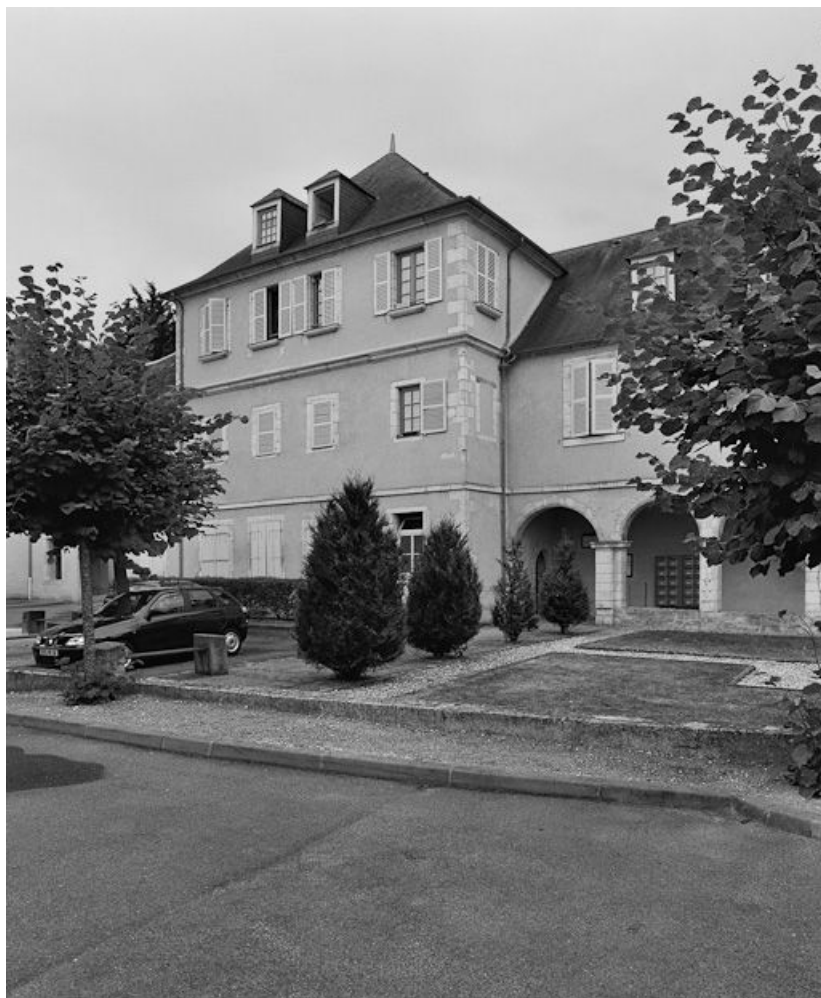
Vue du bâtiment à gauche du cloître.