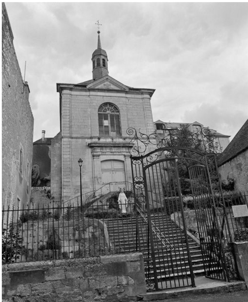
Vue d'ensemble de l'entrée de l'hôtel-Dieu.