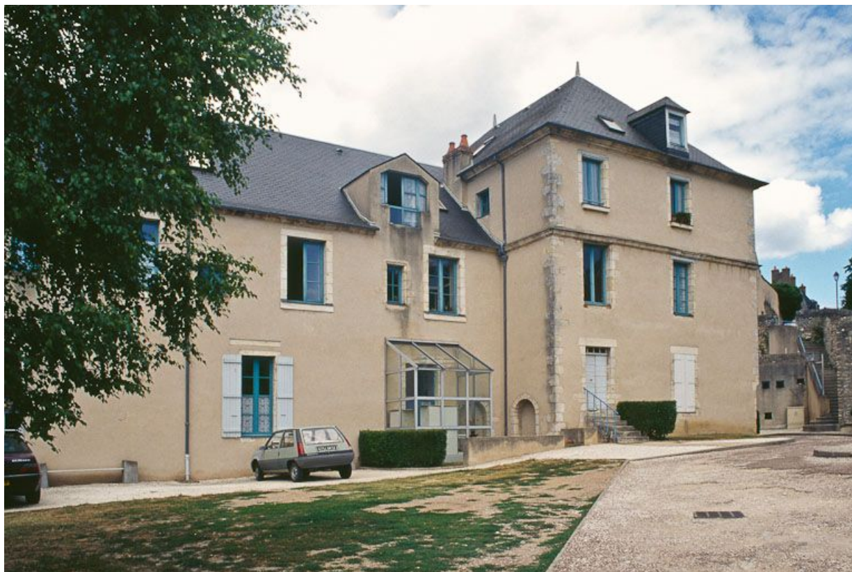
Vue du bâtiment principal, façade postérieure.