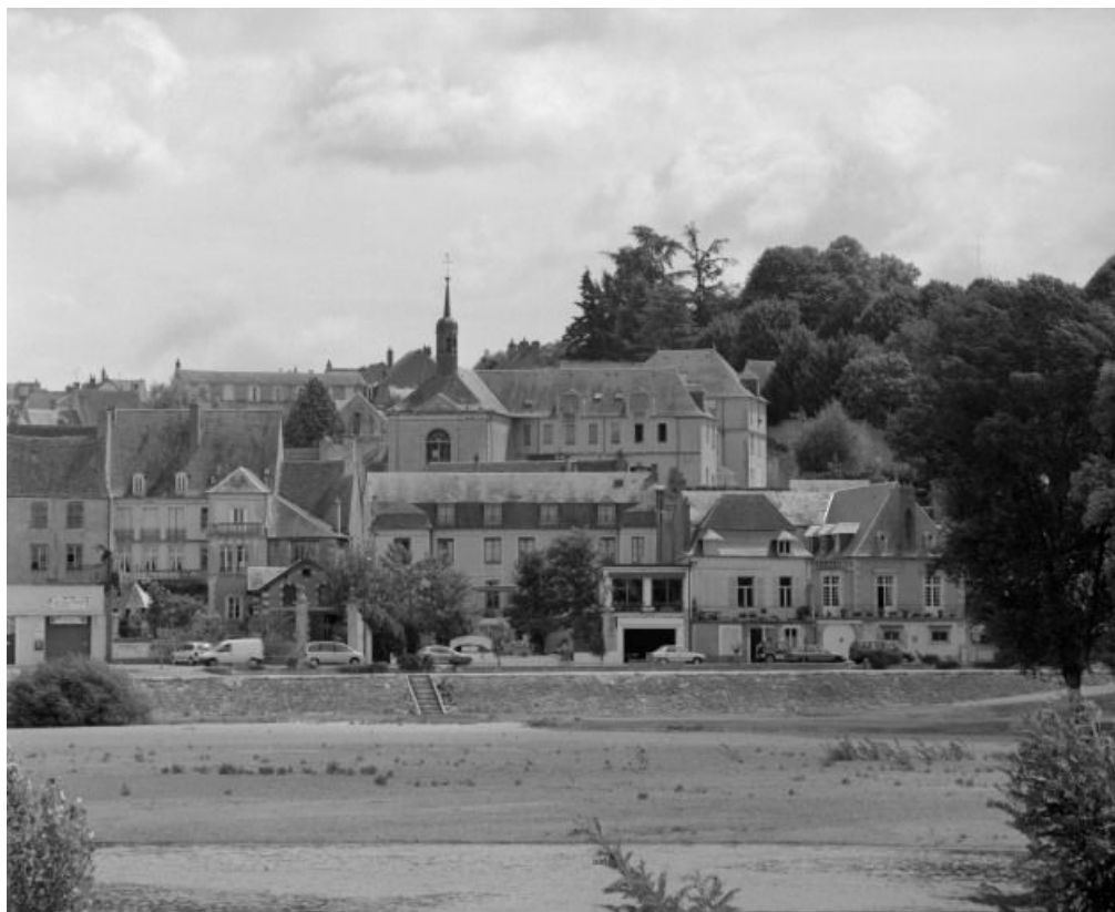
Vue d'ensemble, depuis le bord de la Loire.