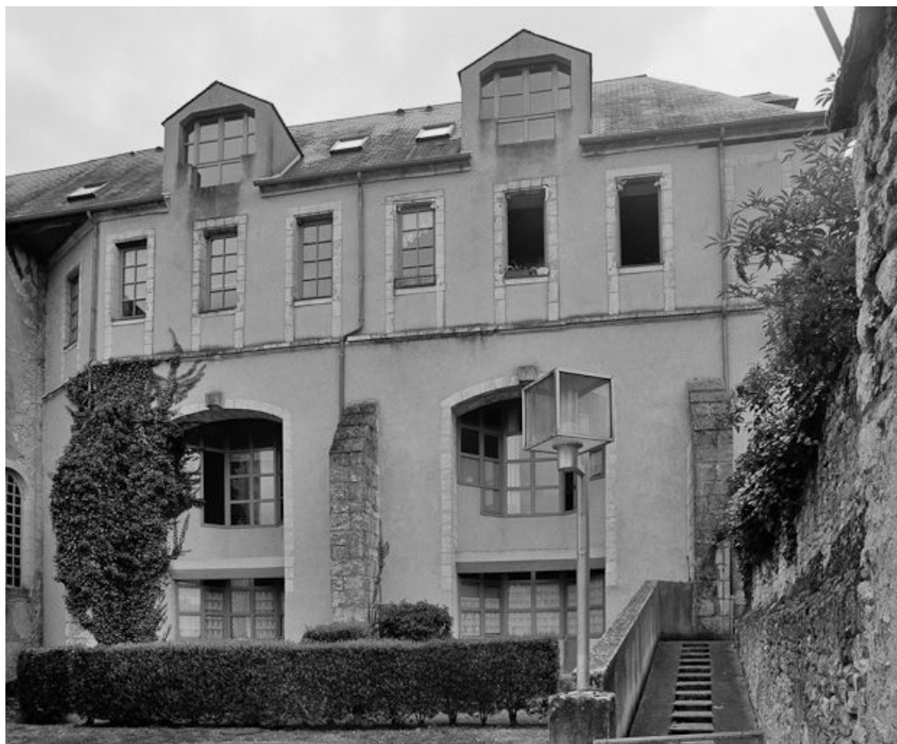
Vue du bâtiment à droite du cloître.