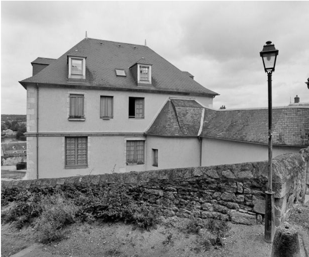
Vue du bâtiment à gauche du cloître.