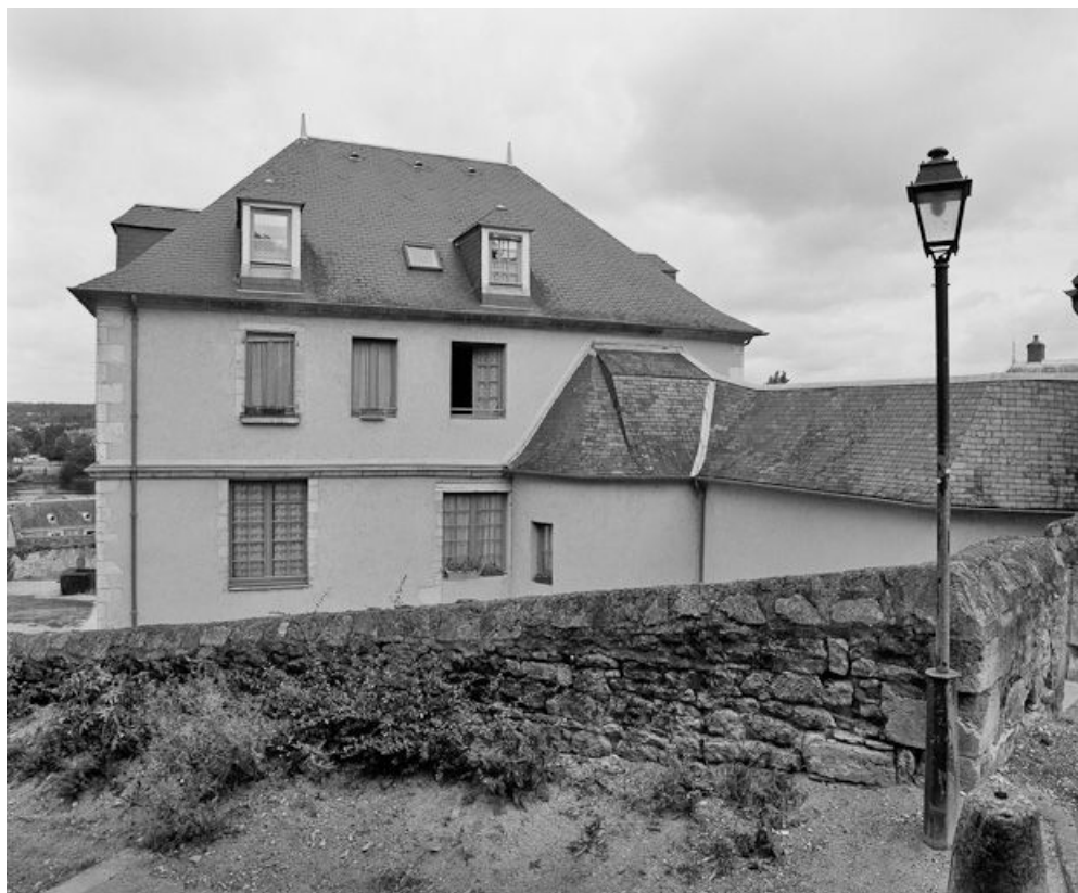
Vue du bâtiment à gauche du cloître.