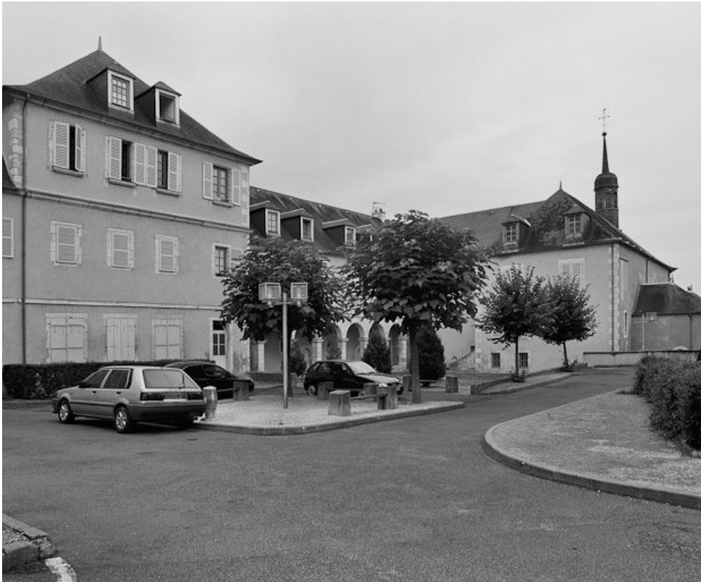
Vue d'ensemble du bâtiment, avec le cloître.