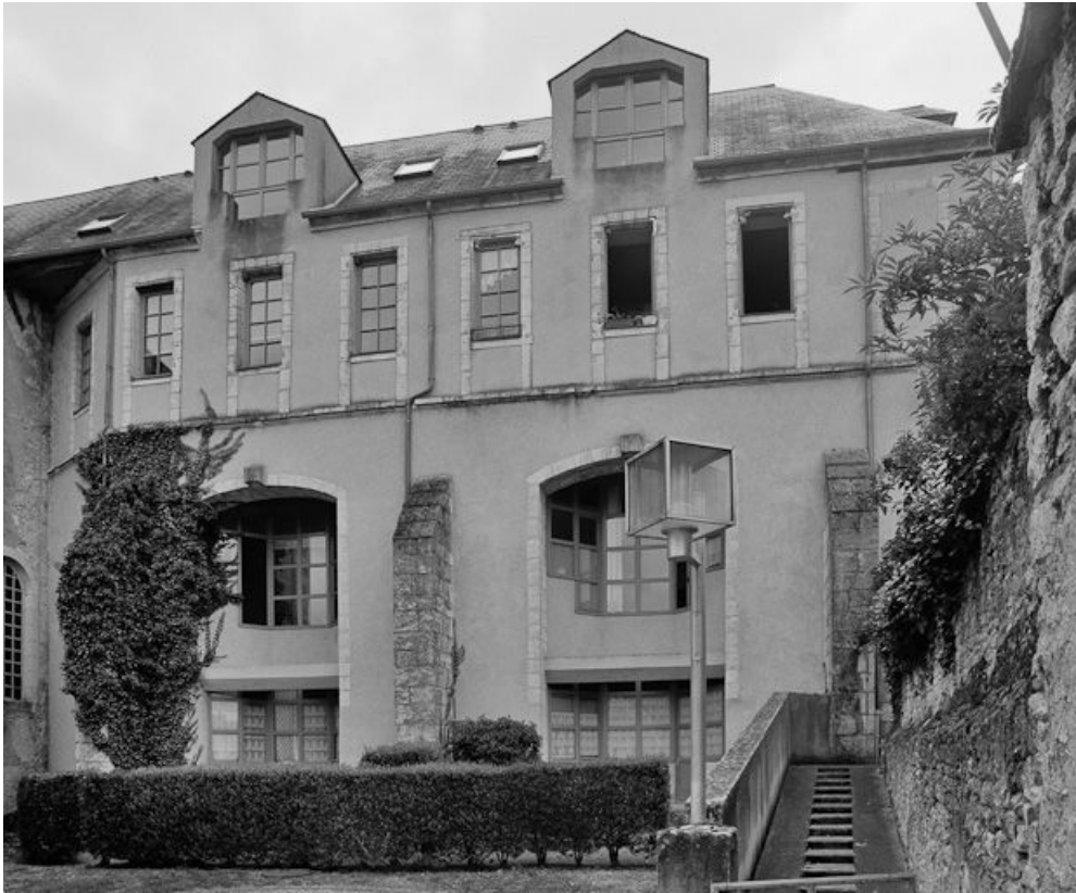
Vue du bâtiment à droite du cloître.