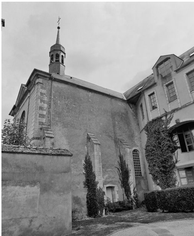
Vue de la façade droite de la chapelle de l'hôtel-Dieu.