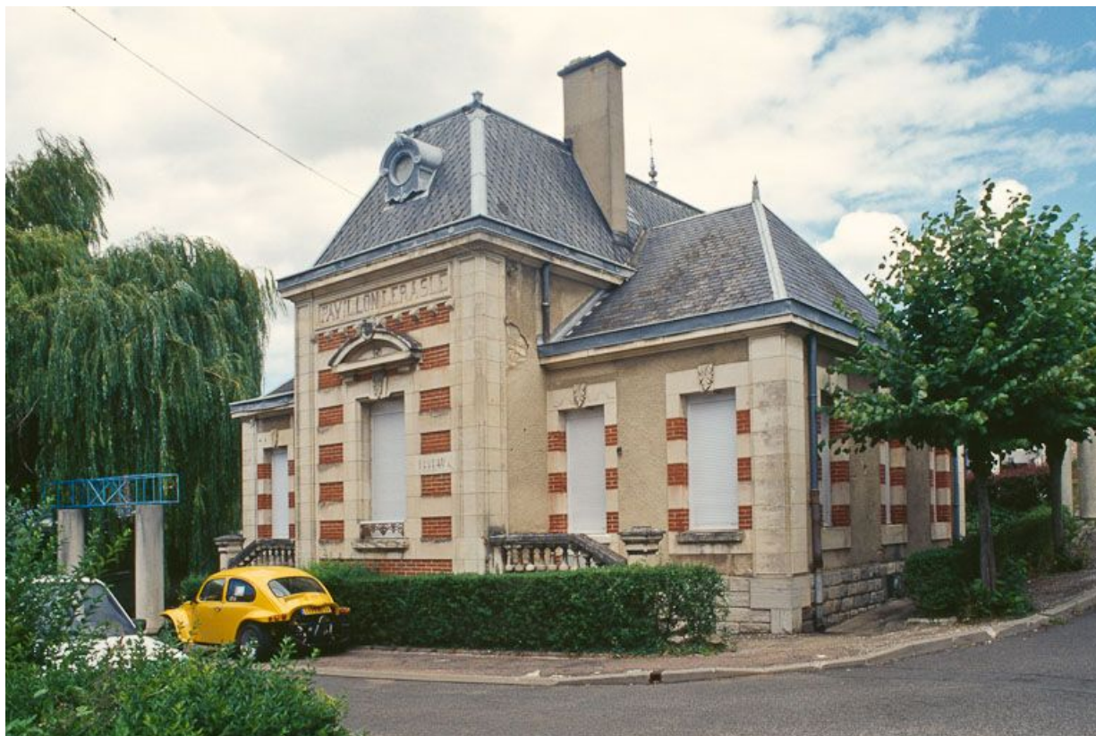
Vue d'ensemble du pavillon Regnard. 58, La Charité-sur-Loire rue du Collège