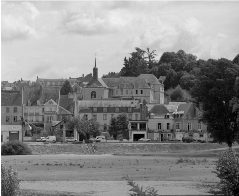
Vue d'ensemble, depuis le bord de la Loire.