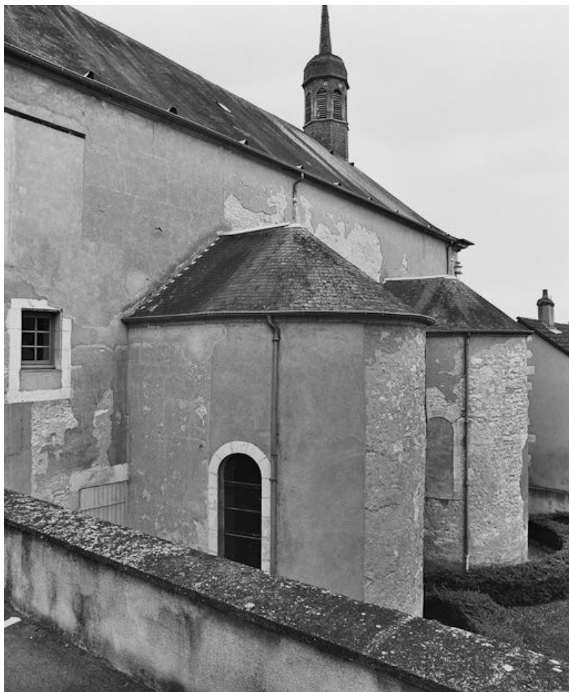
Vue de la façade gauche de la chapelle de l'hôtel-Dieu.