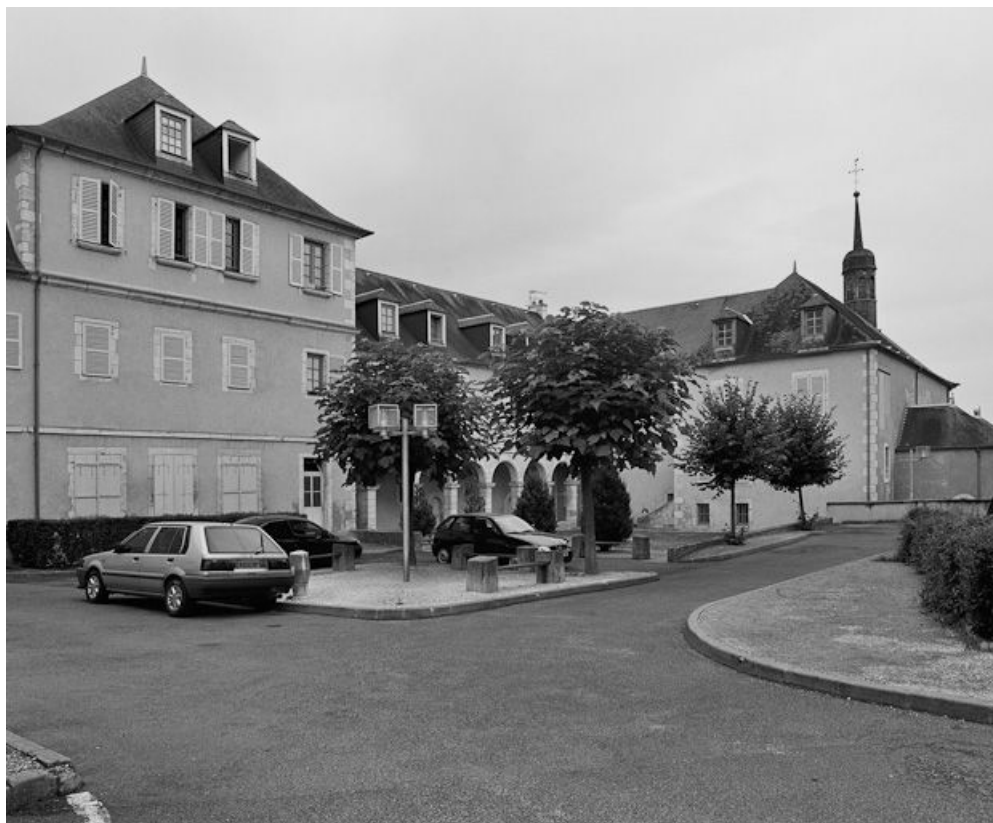
Vue d'ensemble du bâtiment, avec le cloître.