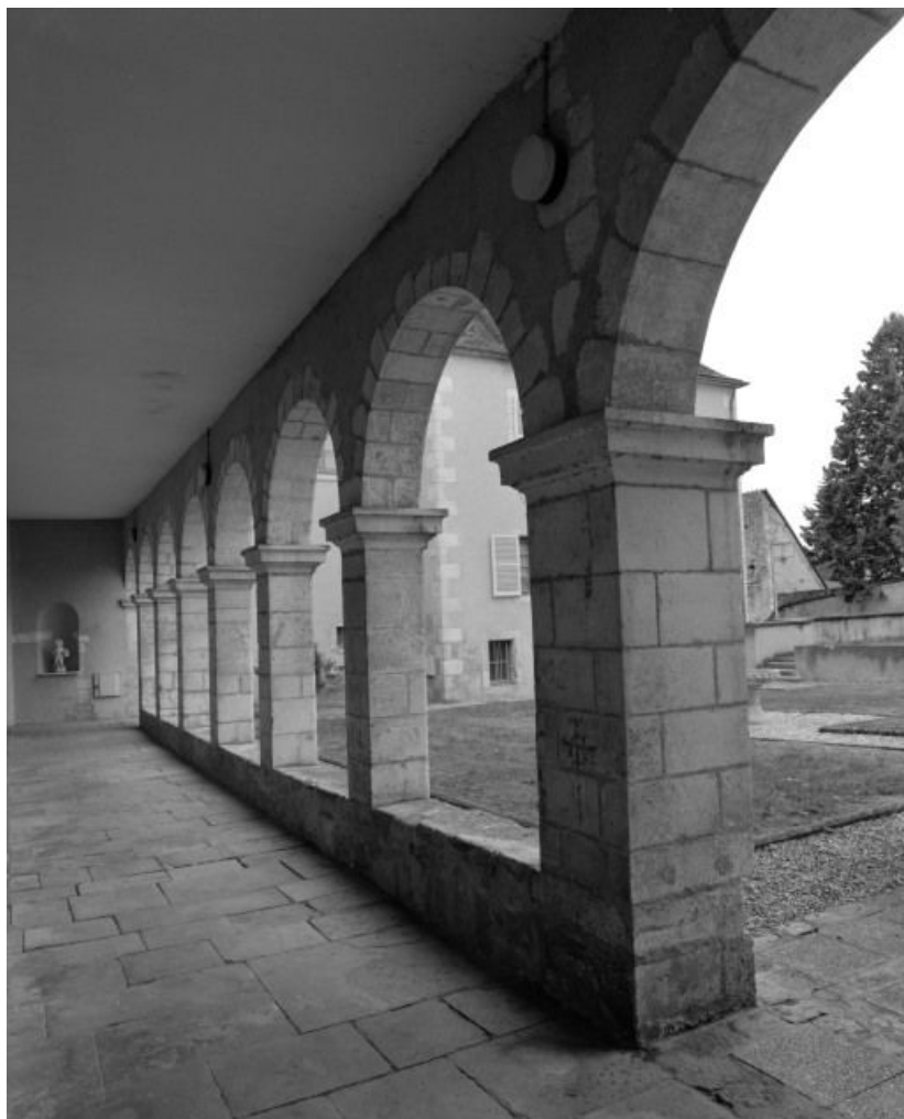
Vue de l'intérieur du cloître.