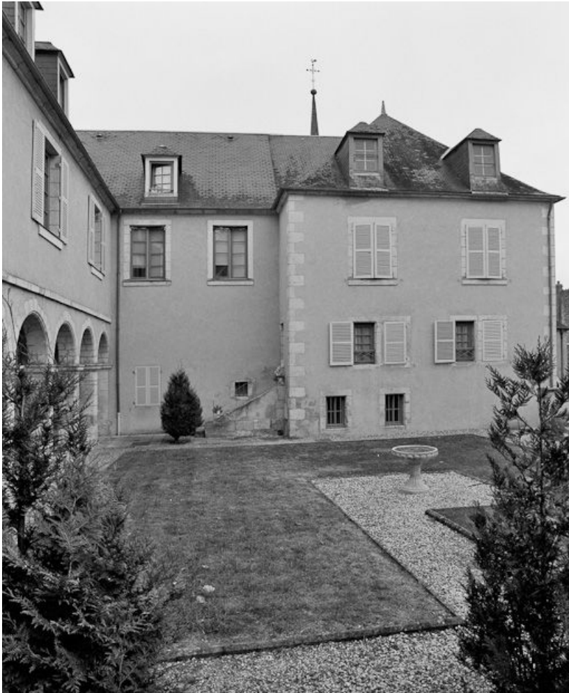
Elévation sur la cour d'honneur de l'aile ouest du bâtiment principal.