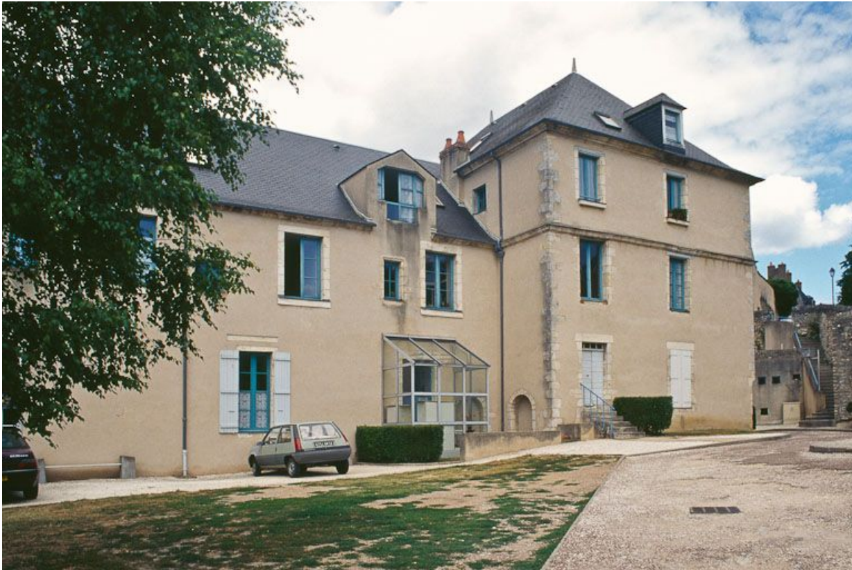
Vue du bâtiment principal, façade postérieure.