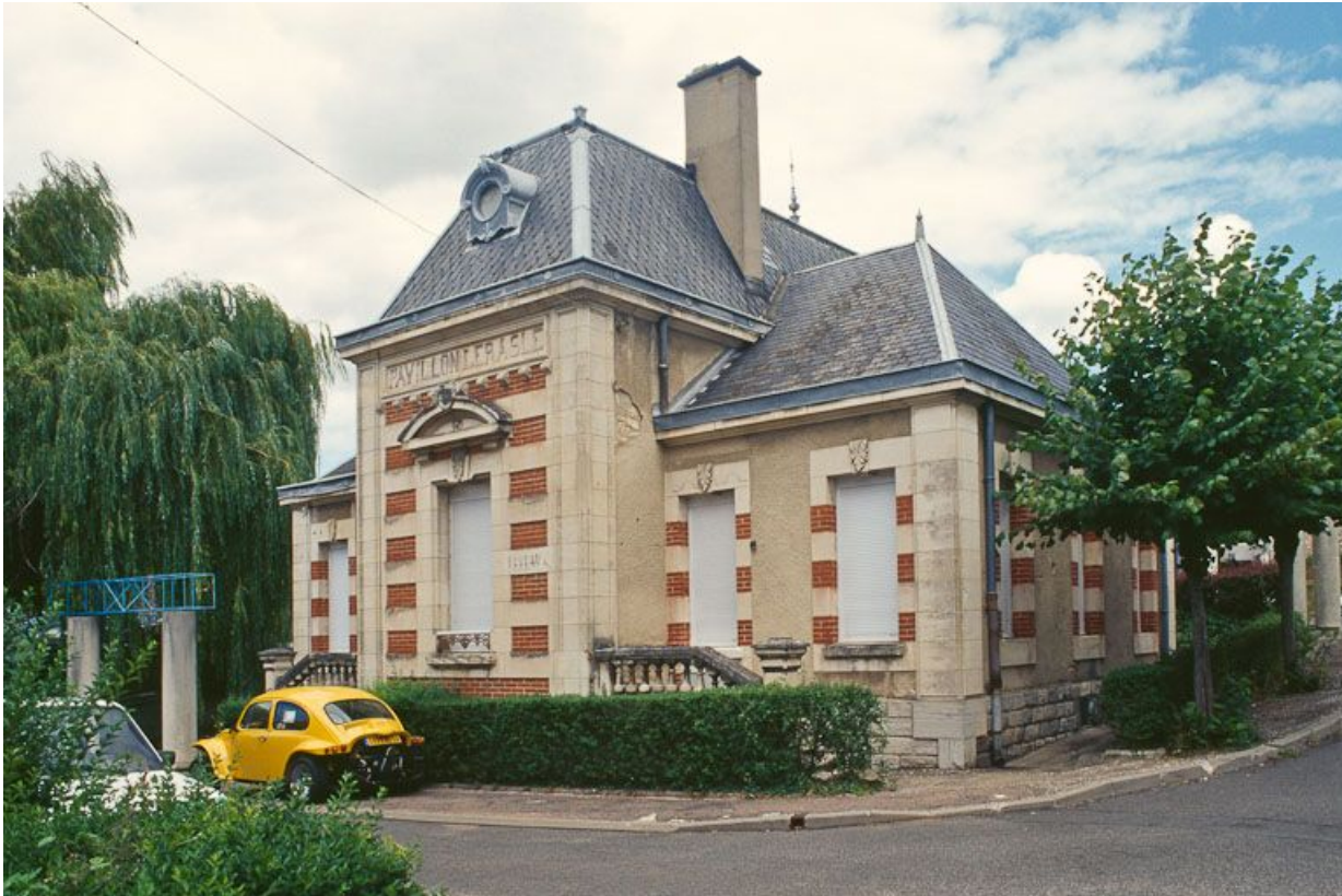
Vue d'ensemble du pavillon Regnard. 58, La Charité-sur-Loire rue du Collège