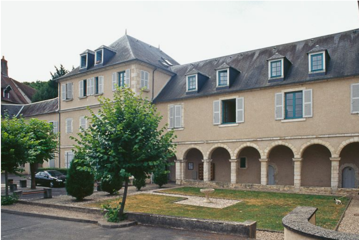
Vue d'ensemble du cloître.