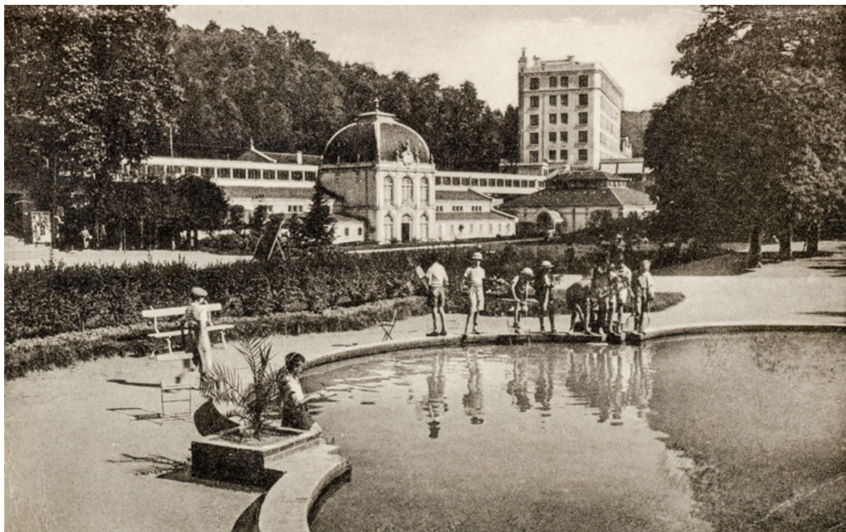
Grand bassin, état au début des années 1950.

58, Saint-Honoré-les-Bains allée de la Chapelle