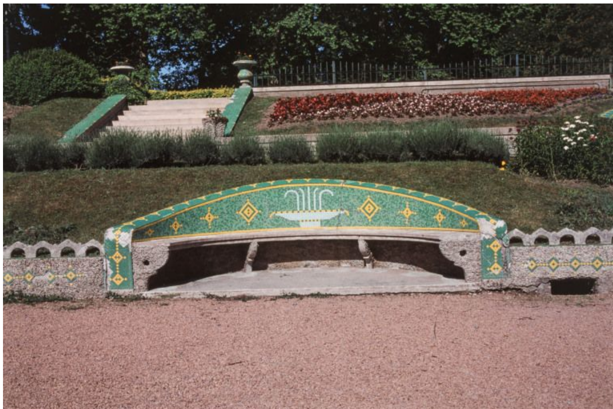
Parc thermal : vue d'ensemble d'un banc courbe.

58, Saint-Honoré-les-Bains allée de la Chapelle