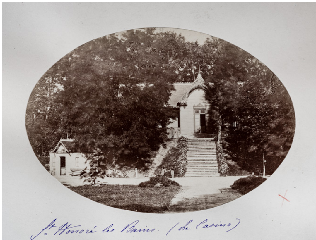
Casino et théâtre, façade principale, vue depuis l'ouest. 58, Saint-Honoré-les-Bains rue du Docteur Segard