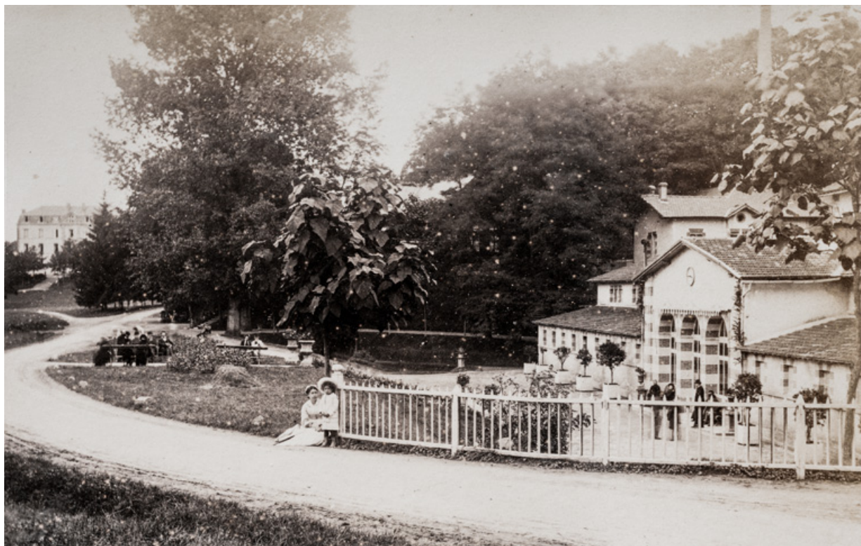
Vue du parc devant l'établissement thermal en 1883.

58, Saint-Honoré-les-Bains allée de la Chapelle