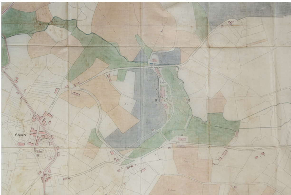
Plan du parc thermal en 1875.

58, Saint-Honoré-les-Bains allée de la Chapelle