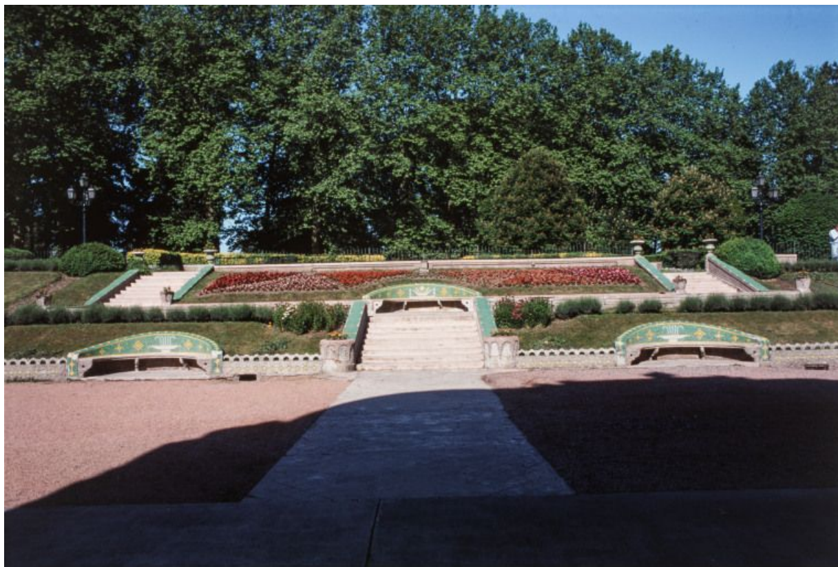
Parc thermal : vue d'ensemble de trois bancs courbes

58, Saint-Honoré-les-Bains allée de la Chapelle