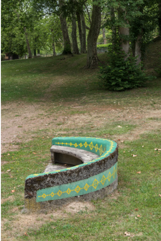
Banc de jardin près de l'Hôtel Le Morvan.

58, Saint-Honoré-les-Bains allée de la Chapelle