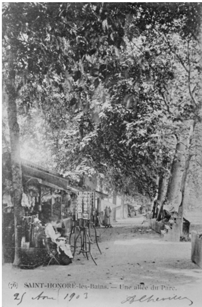
Allée bordée de baraques de commerçants. 58, Saint-Honoré-les-Bains allée de la Chapelle