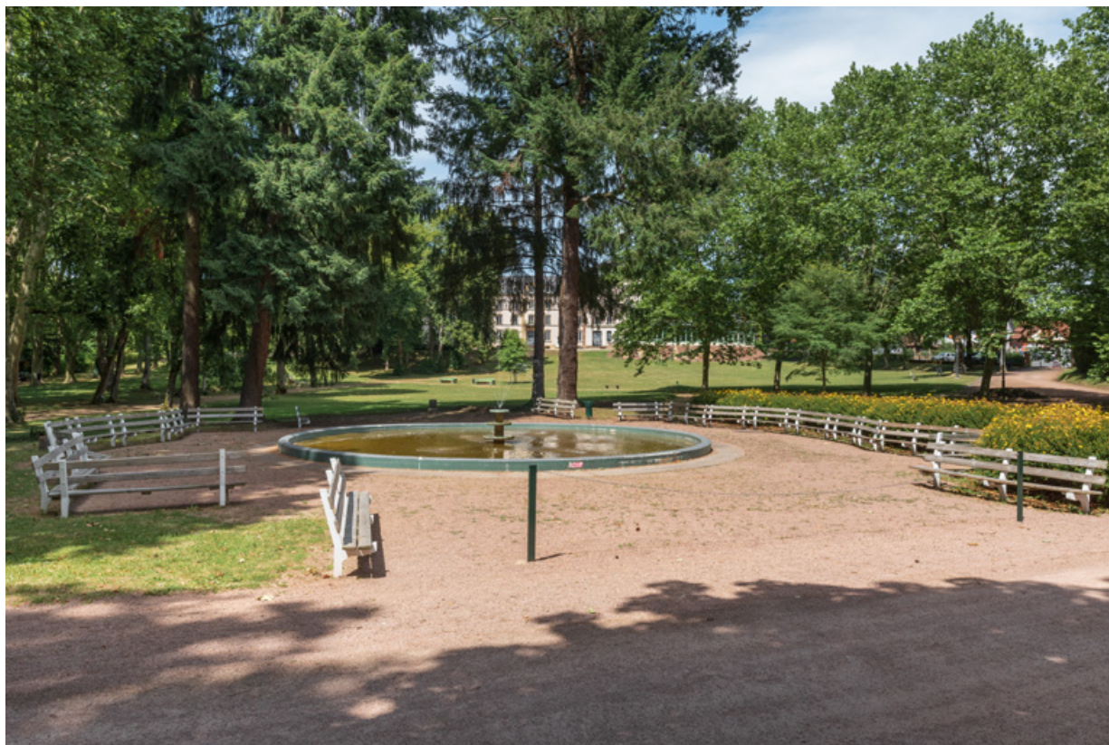
Grand bassin, état à la fin des années 2010. 58, Saint-Honoré-les-Bains allée de la Chapelle