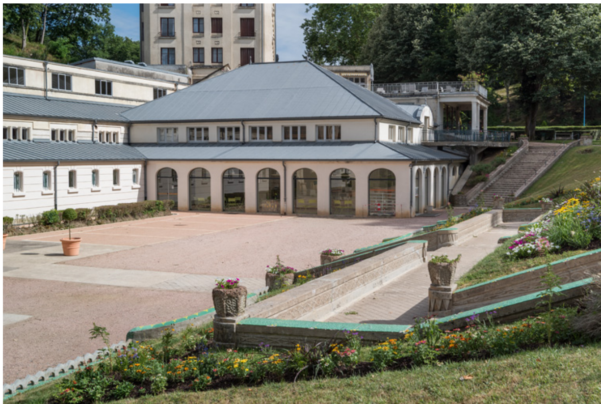
Escalier extérieur devant l'établissement thermal, vue d'ensemble depuis le parc.

58, Saint-Honoré-les-Bains allée de la Chapelle