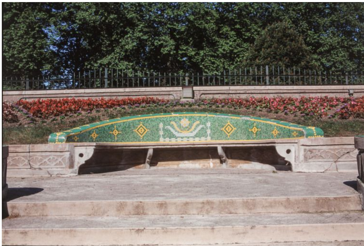
Parc thermal : vue d'un banc courbe.

58, Saint-Honoré-les-Bains allée de la Chapelle