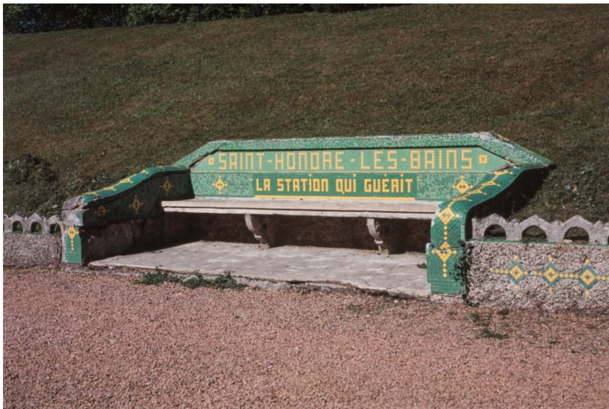
Parc thermal : vue d'un banc droit.

58, Saint-Honoré-les-Bains allée de la Chapelle