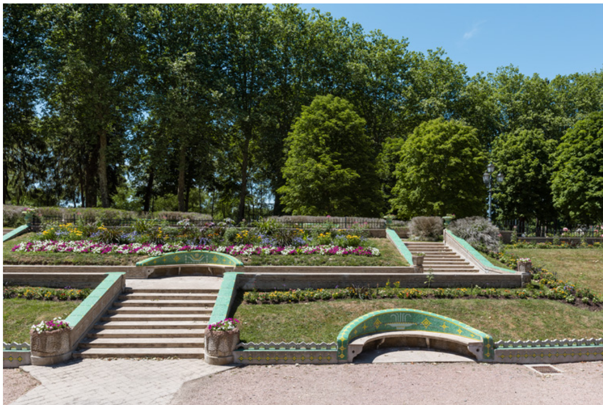
Escalier extérieur devant l'établissement thermal, vue de la partie nord.

58, Saint-Honoré-les-Bains allée de la Chapelle