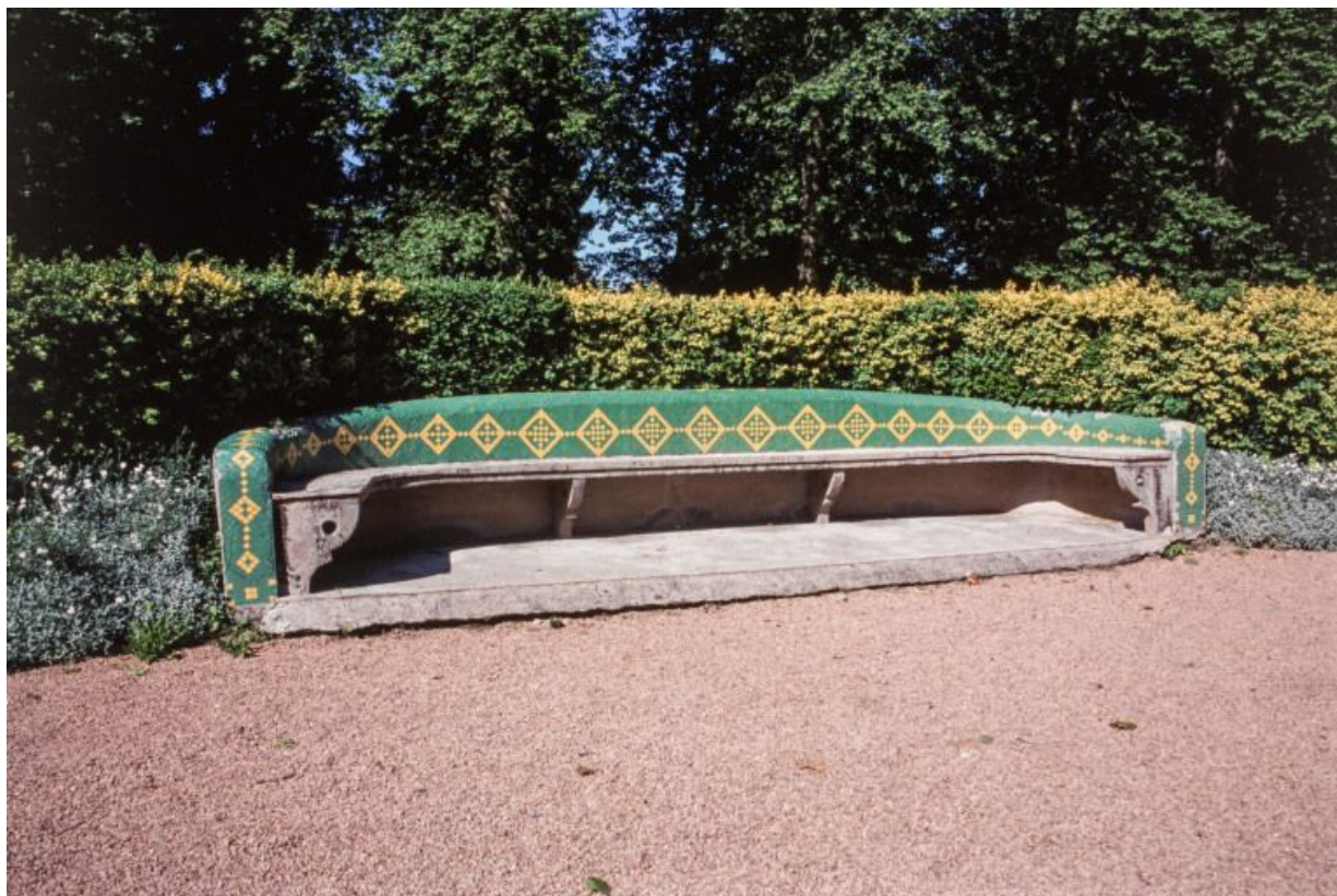
Parc thermal : vue de trois-quart gauche d'un banc courbe.

58, Saint-Honoré-les-Bains allée de la Chapelle