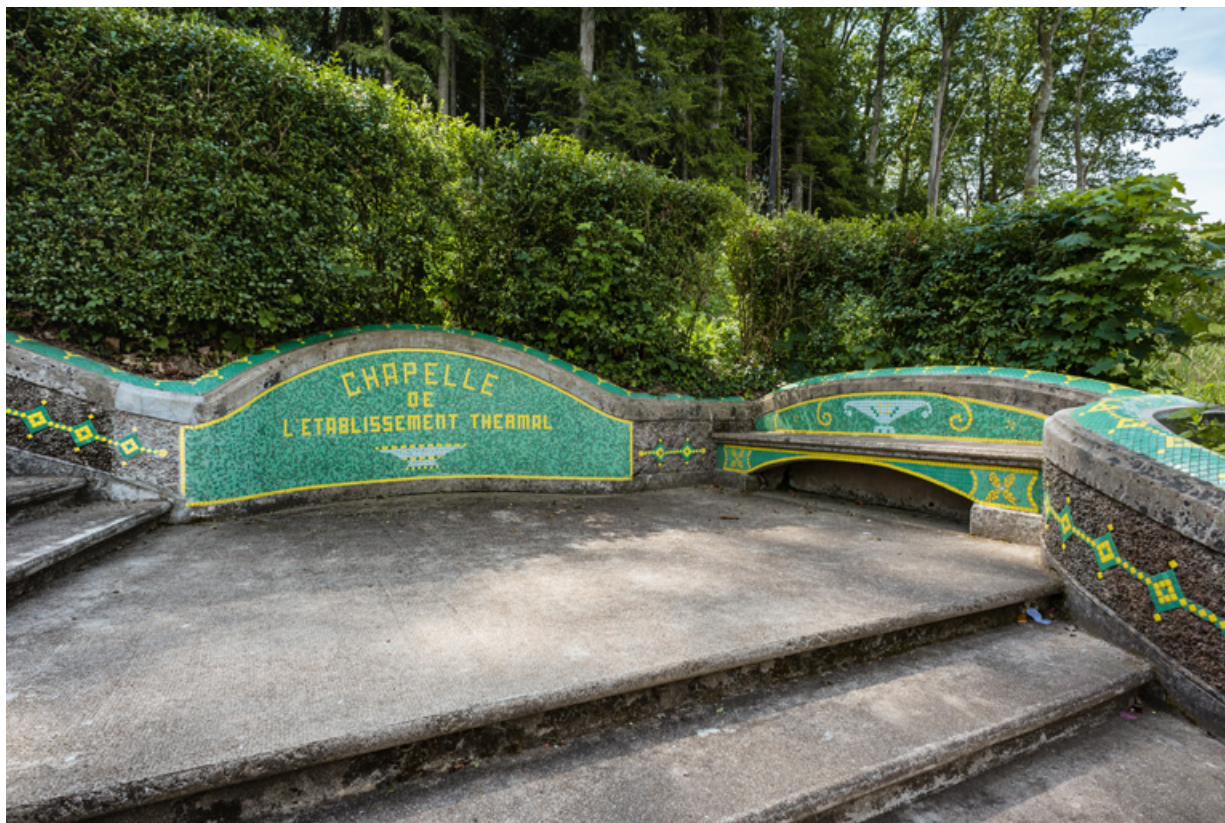
Escalier extérieur conduisant à la chapelle du parc, repos.

58, Saint-Honoré-les-Bains allée de la Chapelle