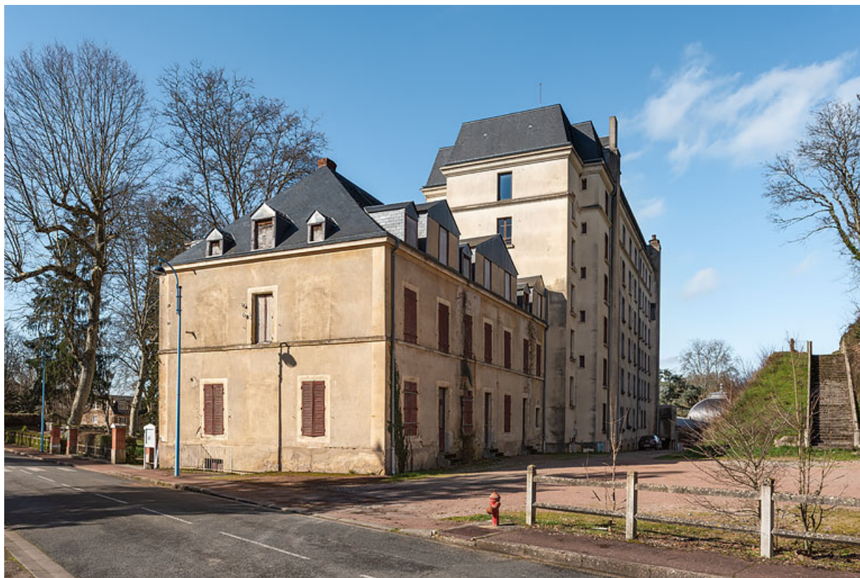
Hôtel des Bains et Hôtel Bristol Thermal, escalier d'accès aux Garences.

58, Saint-Honoré-les-Bains allée de la Chapelle