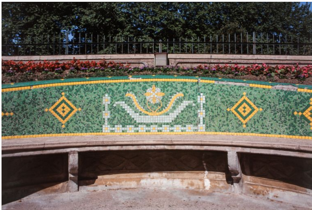
Parc thermal : détail du dossier d'un banc courbe

58, Saint-Honoré-les-Bains allée de la Chapelle