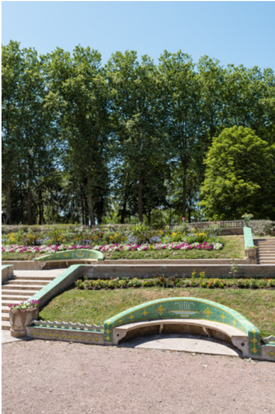
Escalier extérieur devant l'établissement thermal, banc du niveau inférieur. 58, Saint-Honoré-les-Bains allée de la Chapelle