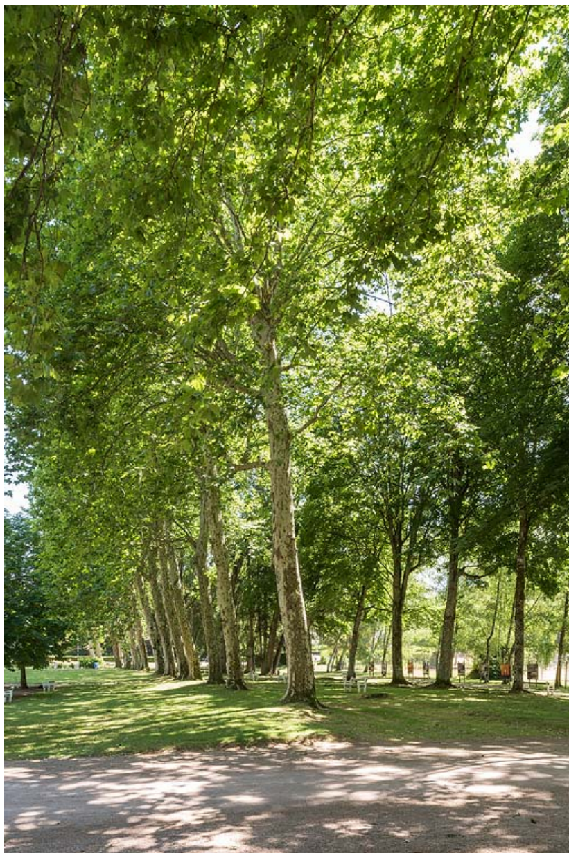
Allée des tennis, vue en direction du sud.

58, Saint-Honoré-les-Bains allée de la Chapelle