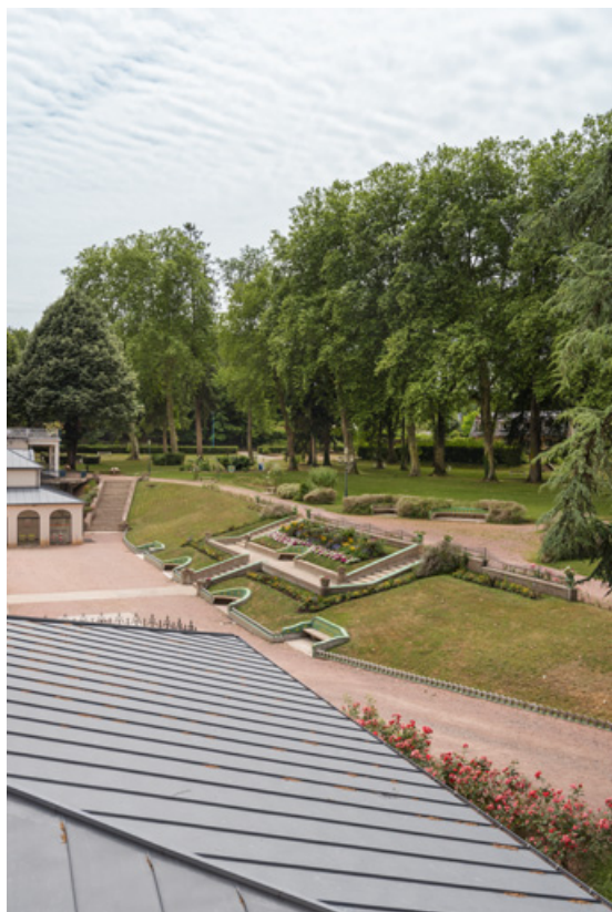
Escalier extérieur devant l'établissement thermal, vue d'ensemble depuis la terrasse du casino. 58, Saint-Honoré-les-Bains allée de la Chapelle