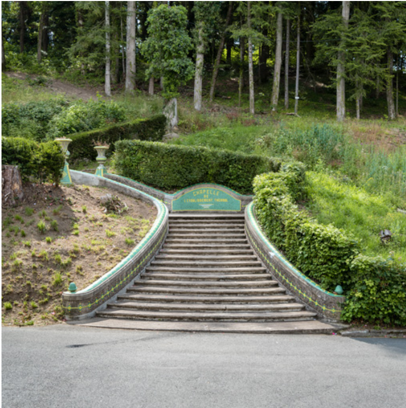
Escalier extérieur conduisant à la chapelle du parc. 58, Saint-Honoré-les-Bains allée de la Chapelle