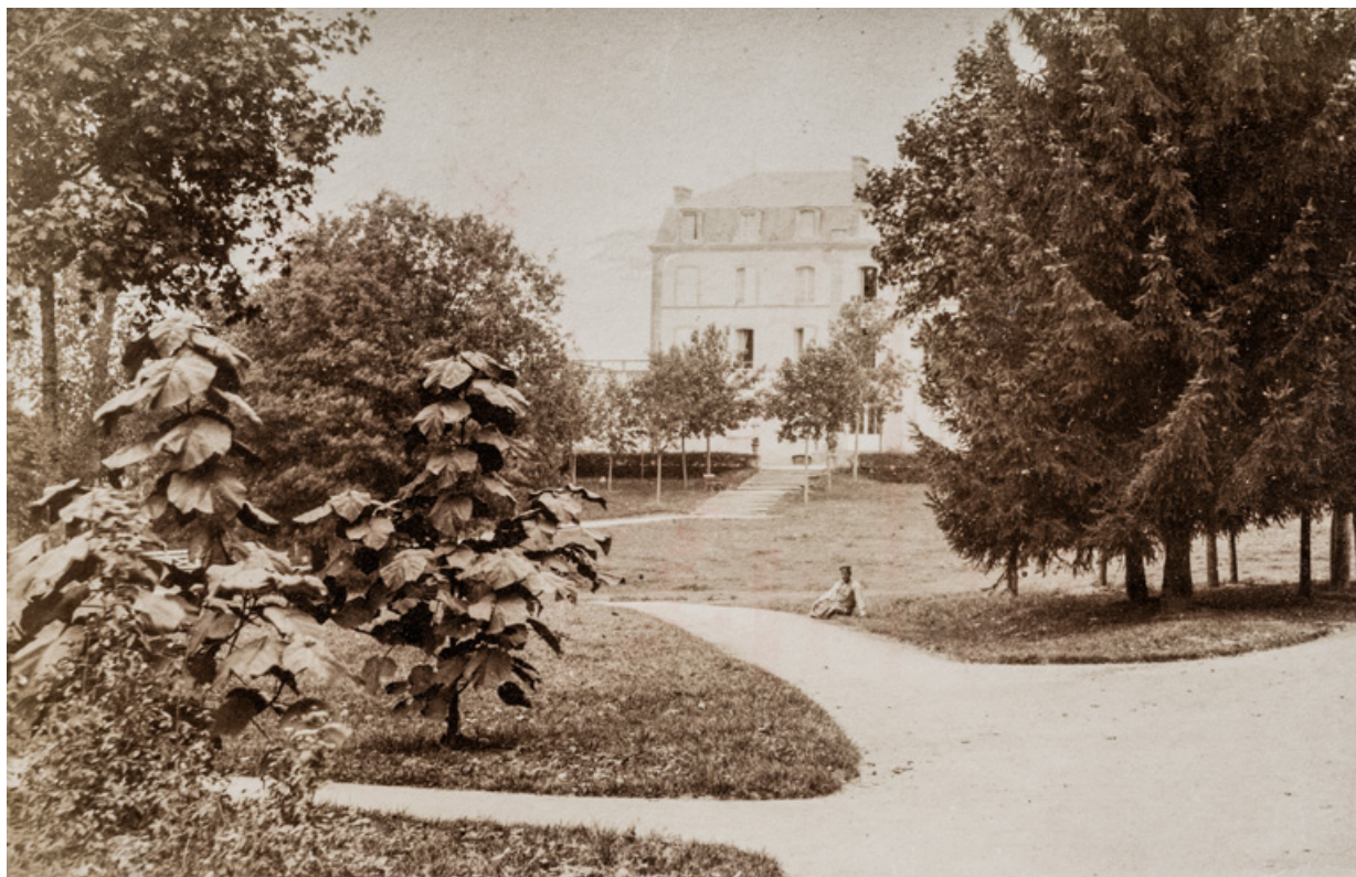
Allées du parc en direction de l'Hôtel Le Morvan.

58, Saint-Honoré-les-Bains allée de la Chapelle