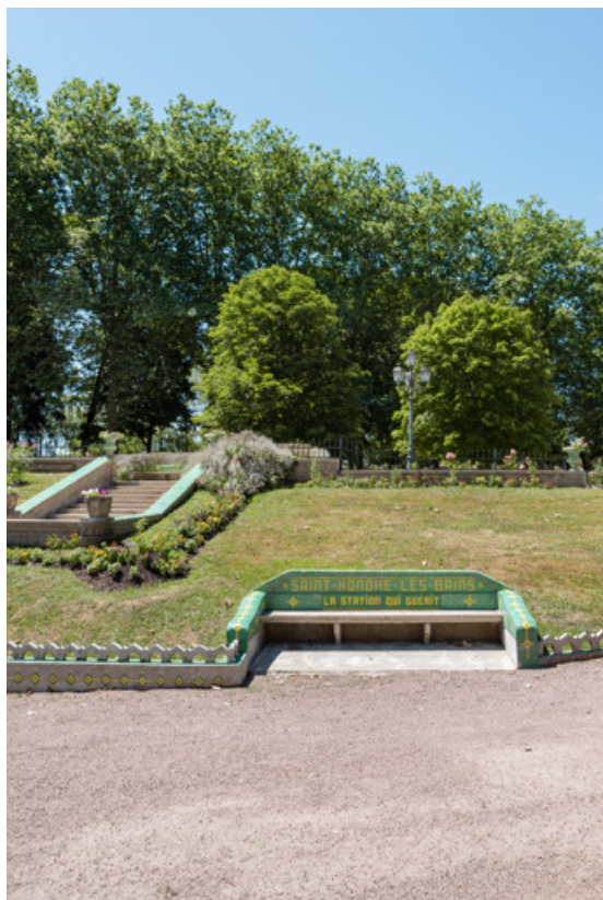
Escalier extérieur devant l'établissement thermal, banc du niveau inférieur.

58, Saint-Honoré-les-Bains allée de la Chapelle