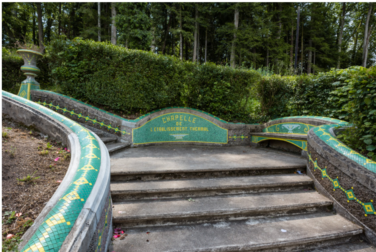
Escalier extérieur conduisant à la chapelle du parc, repos.

58, Saint-Honoré-les-Bains allée de la Chapelle