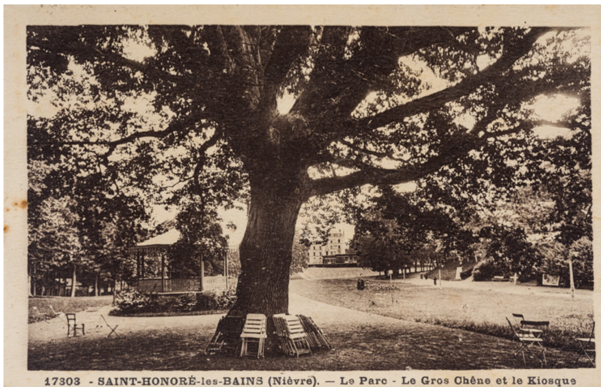
17303 - SAINT-HONORÉ-les-BAINS (Nièvre). — Le Parc - Le Gros Chêne et le Kiosque