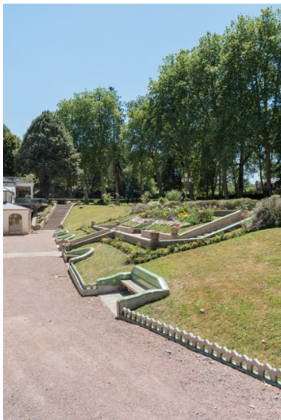
Escalier extérieur devant l'établissement thermal, vue d'ensemble depuis le nord. 58, Saint-Honoré-les-Bains allée de la Chapelle