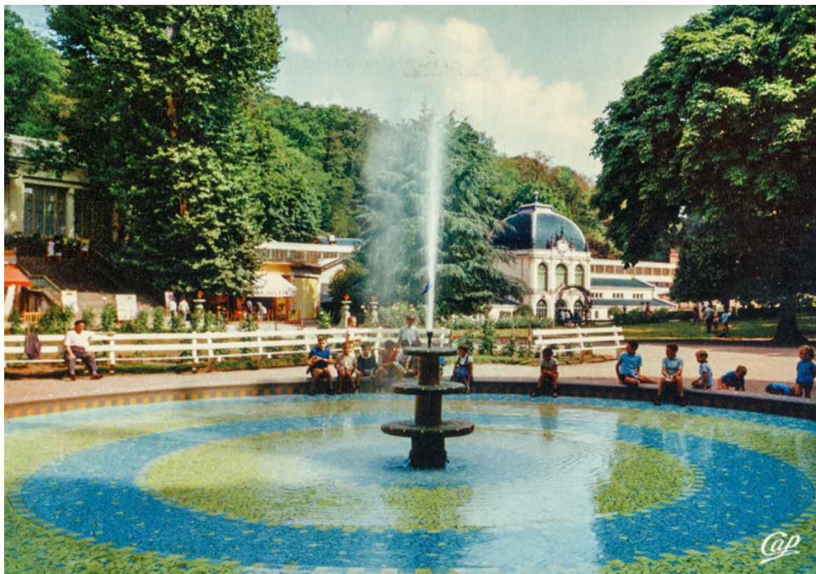
Grand bassin, état à la fin des années 1960. 58, Saint-Honoré-les-Bains allée de la Chapelle