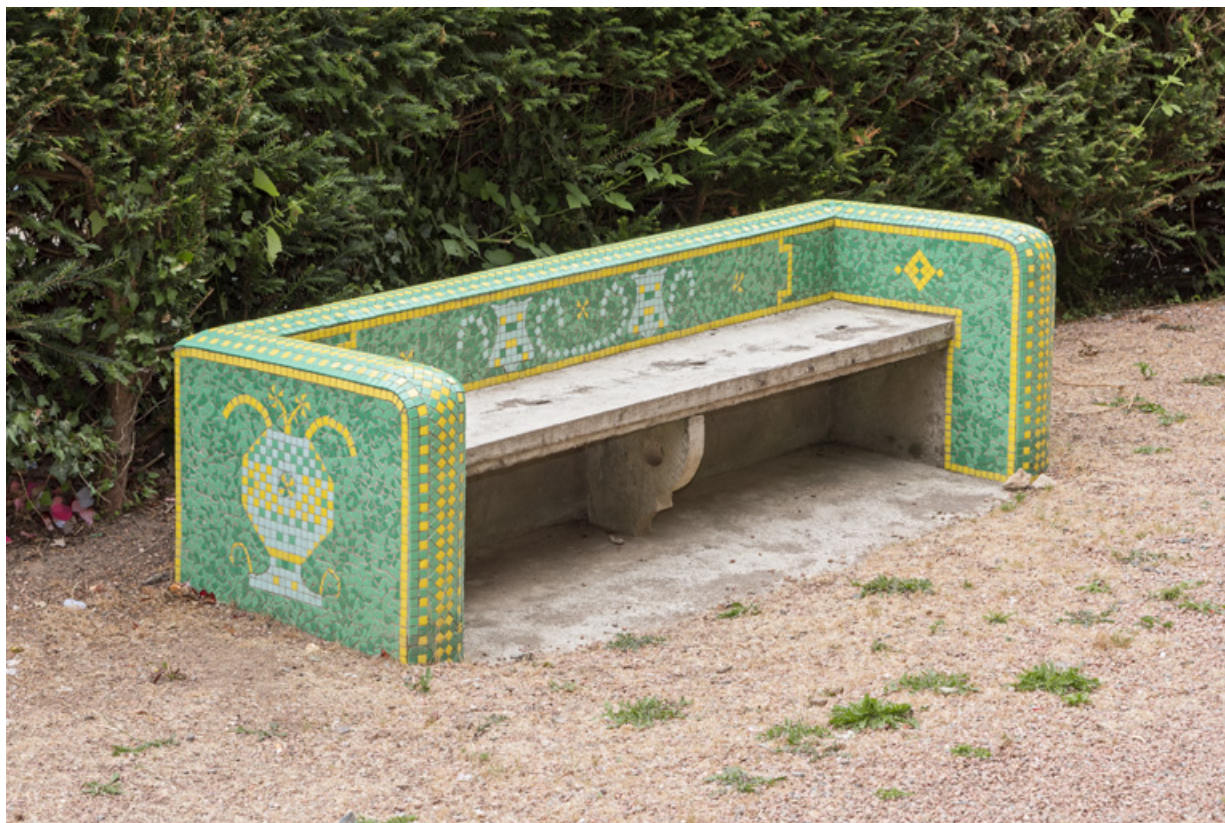
Banc de jardin près de la chapelle du parc. 58, Saint-Honoré-les-Bains allée de la Chapelle