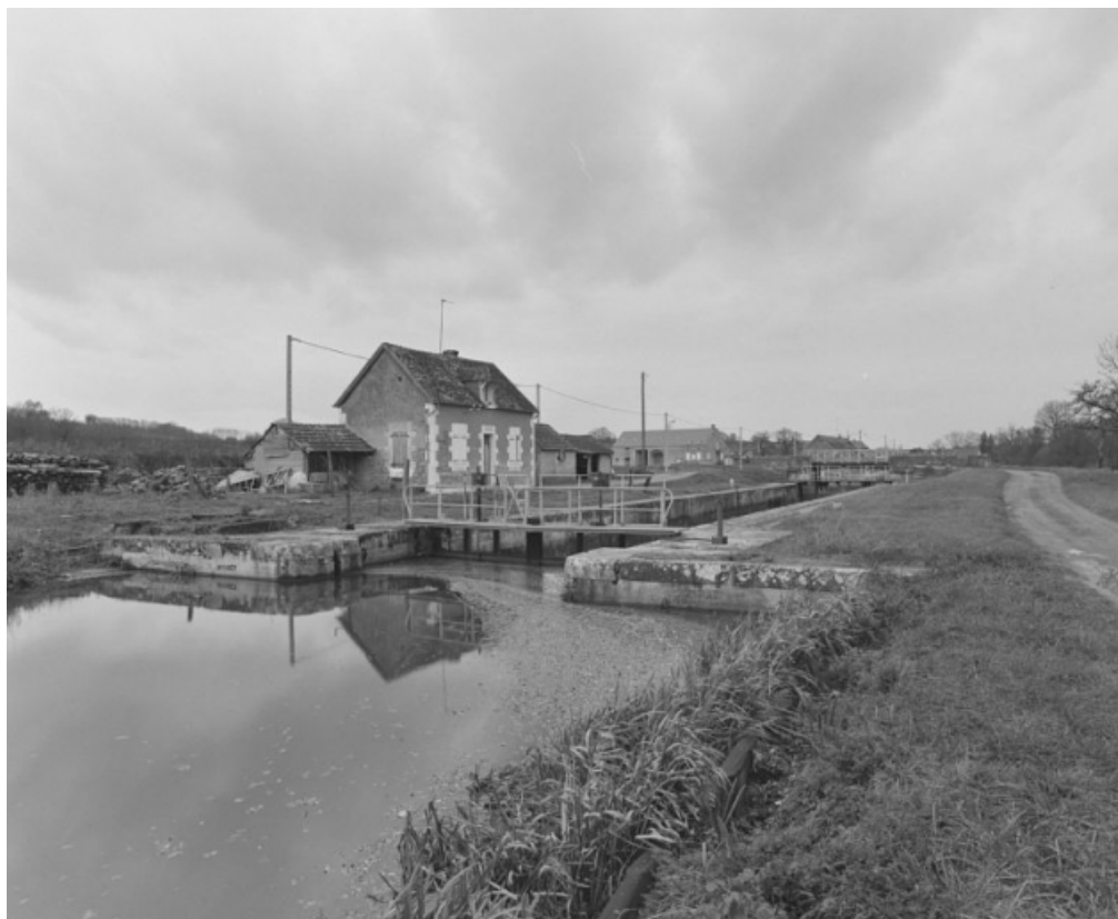
L'écluse n°33, dite de Mont : vue d'ensemble prise de l'amont. 58, Dirol