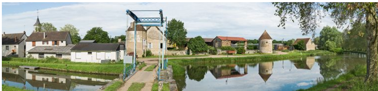
Au premier plan, le pont. Au fond la ferme et la scierie de Dirol (IA5800921). 58, Dirol

N° de l'illustration : 20135800441NUC4AQ