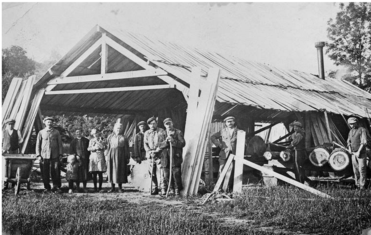
La scierie Beldigot à Asnois, en 1927. Photographie ancienne (collection particulière Christophe Deniaux). 58, Asnois

La scierie Beldigot à Asnois, en 1927. Photographie ancienne (collection particulière Christophe Deniaux). Collection particulière.