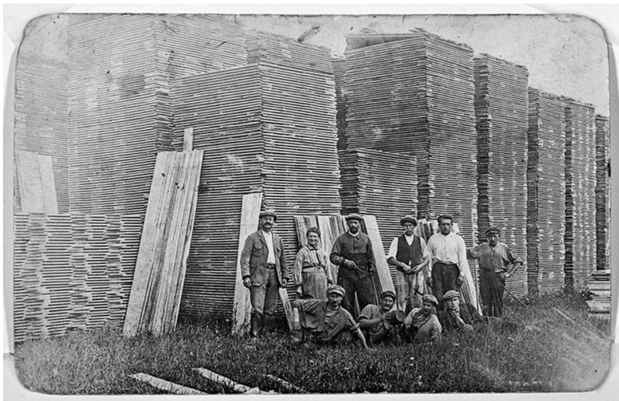
La scierie Beldigot à Asnois, au bord du canal. Photographie ancienne. 58, Asnois

La scierie Beldigot à Asnois, au bord du canal. Photographie ancienne.