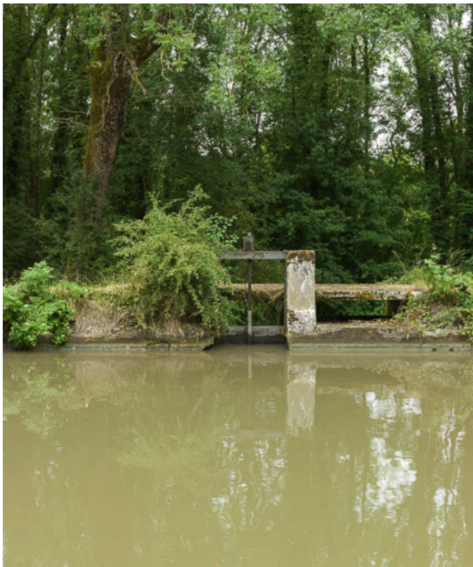
Vue de l'ensemble hydraulique.