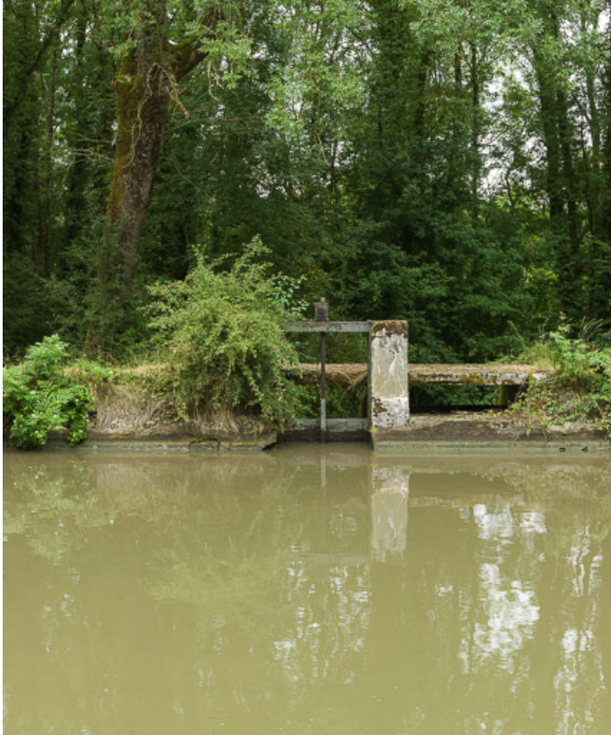
Vue de l'ensemble hydraulique.