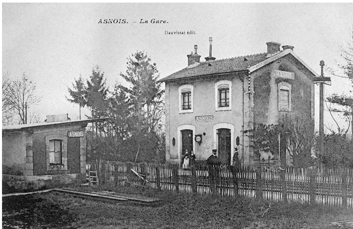
La gare. Carte postale ancienne, Dauvissat édit. 58, Asnois

La gare. Carte postale ancienne, Dauvissat édit..