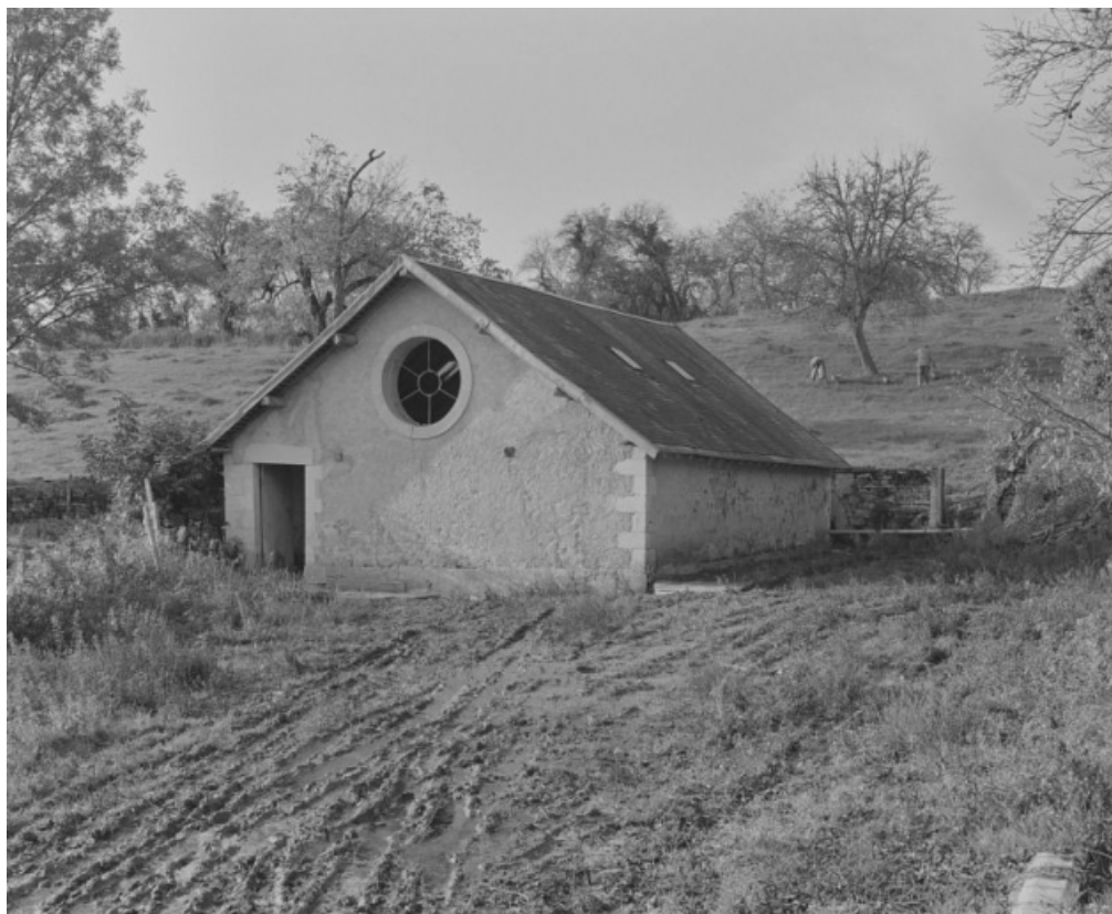
Le lavoir. 58, Asnois