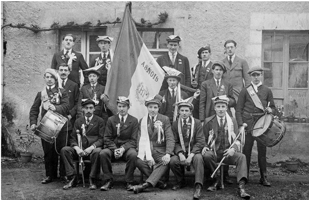
La fanfare d'Asnois, en 1929. Photographie ancienne.