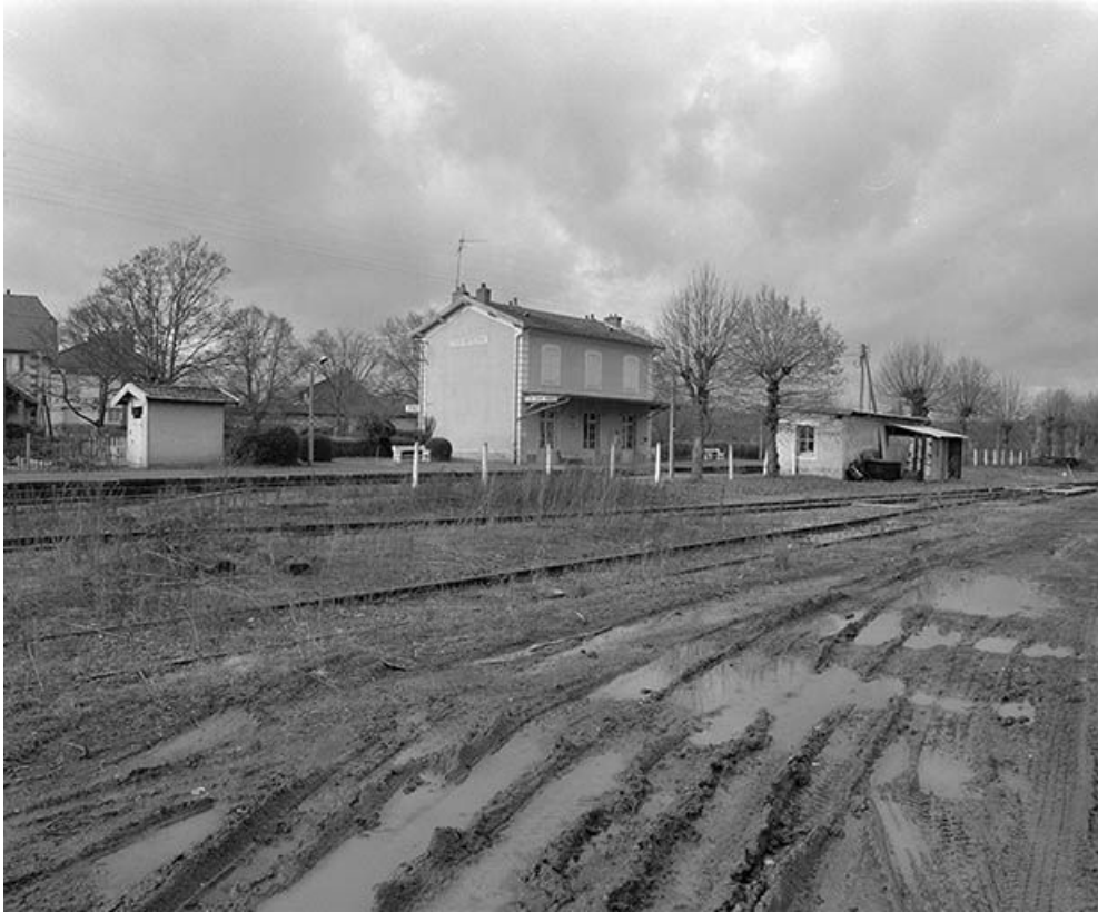
Le bâtiment de la gare et l'abri des voyageurs. Vue d'ensemble prise du sud

58, Tannay C. D. 119, lieudit : Quartier de la Gare