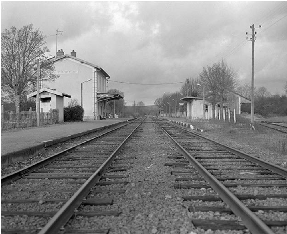
Vue d'ensemble prise depuis le passage à niveau

58, Tannay C. D. 119, lieudit : Quartier de la Gare