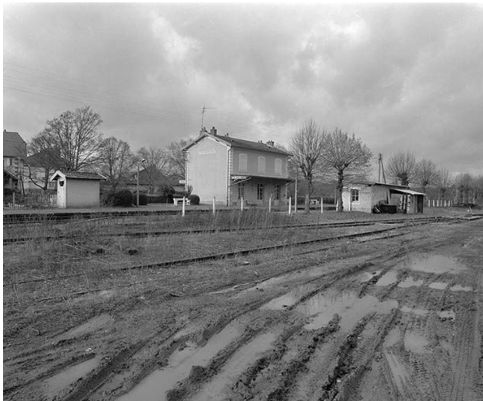
Le bâtiment de la gare et l'abri des voyageurs. Vue d'ensemble prise du sud 58, Tannay C. D. 119, lieudit : Quartier de la Gare