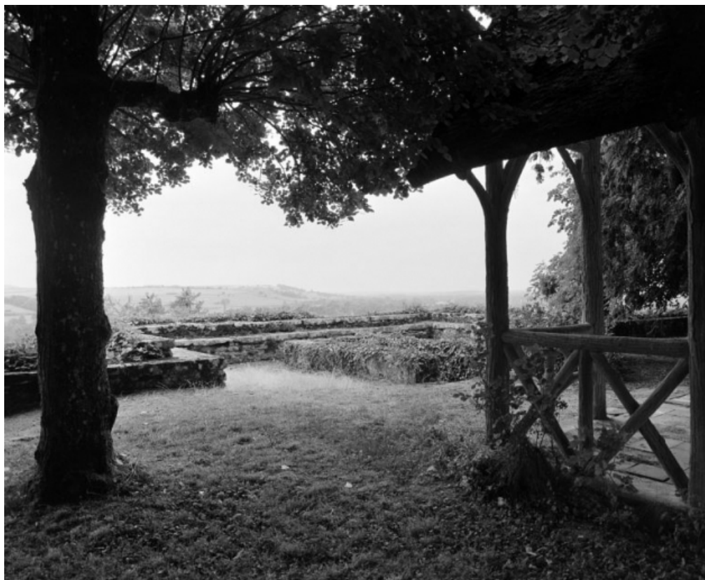
Le kiosque et l'escalier d'accès à la terrasse inférieure.