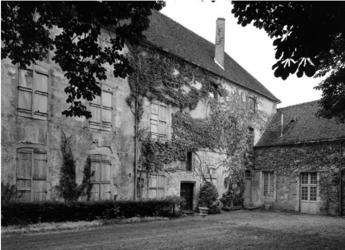
Bâtiment est. Façade prise du nord-est.