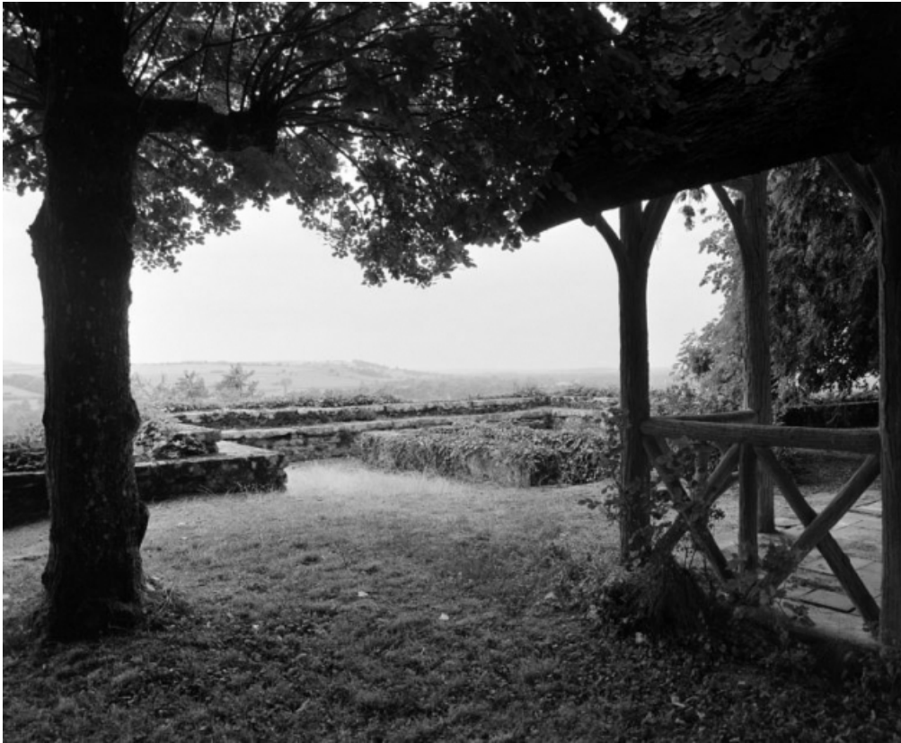
Le kiosque et l'escalier d'accès à la terrasse inférieure.