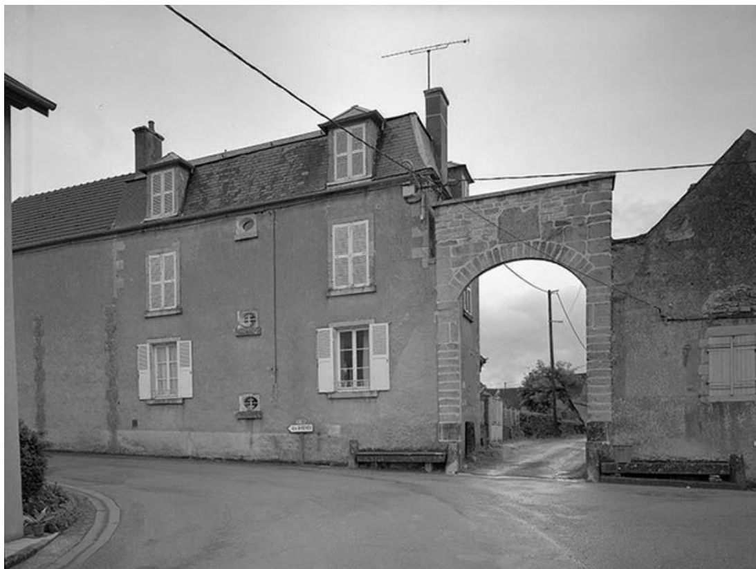
Portail d'accès à la basse-cour