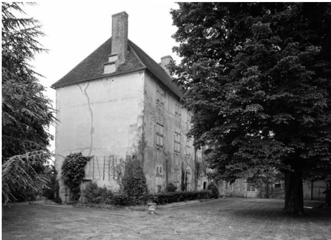
Bâtiment est. Vue d'ensemble.