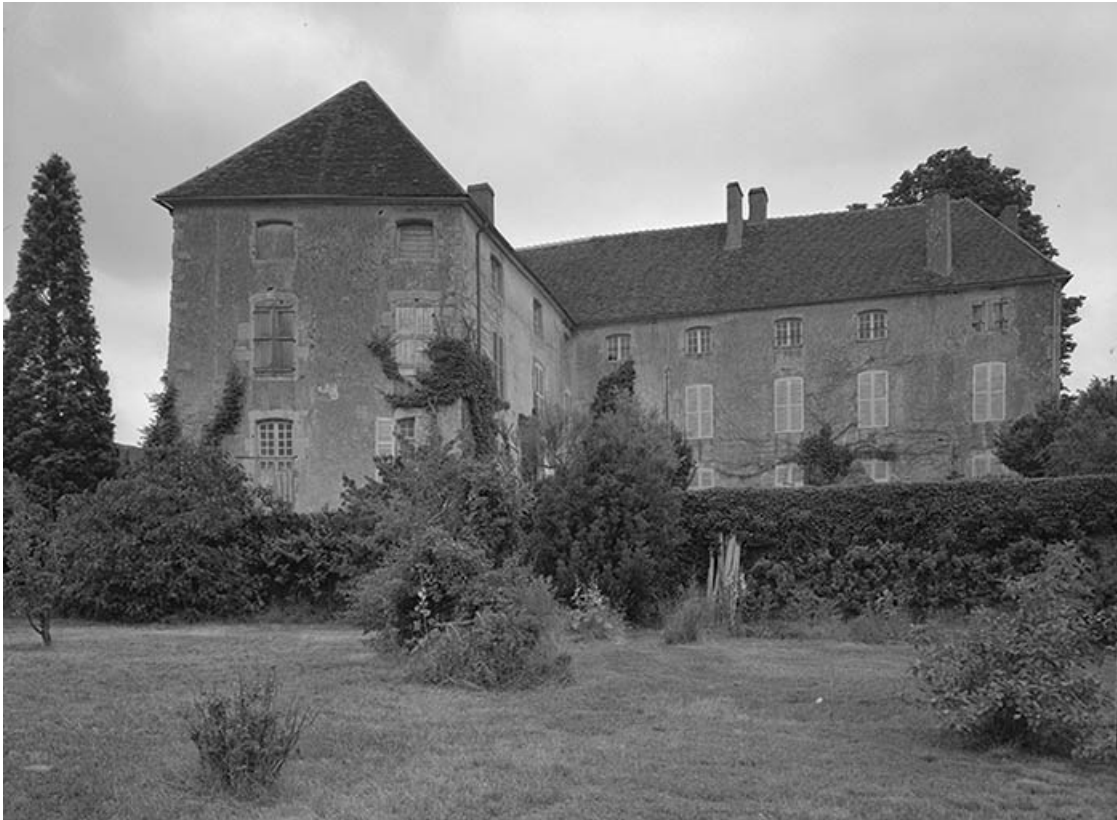
Le château. 58, Asnois