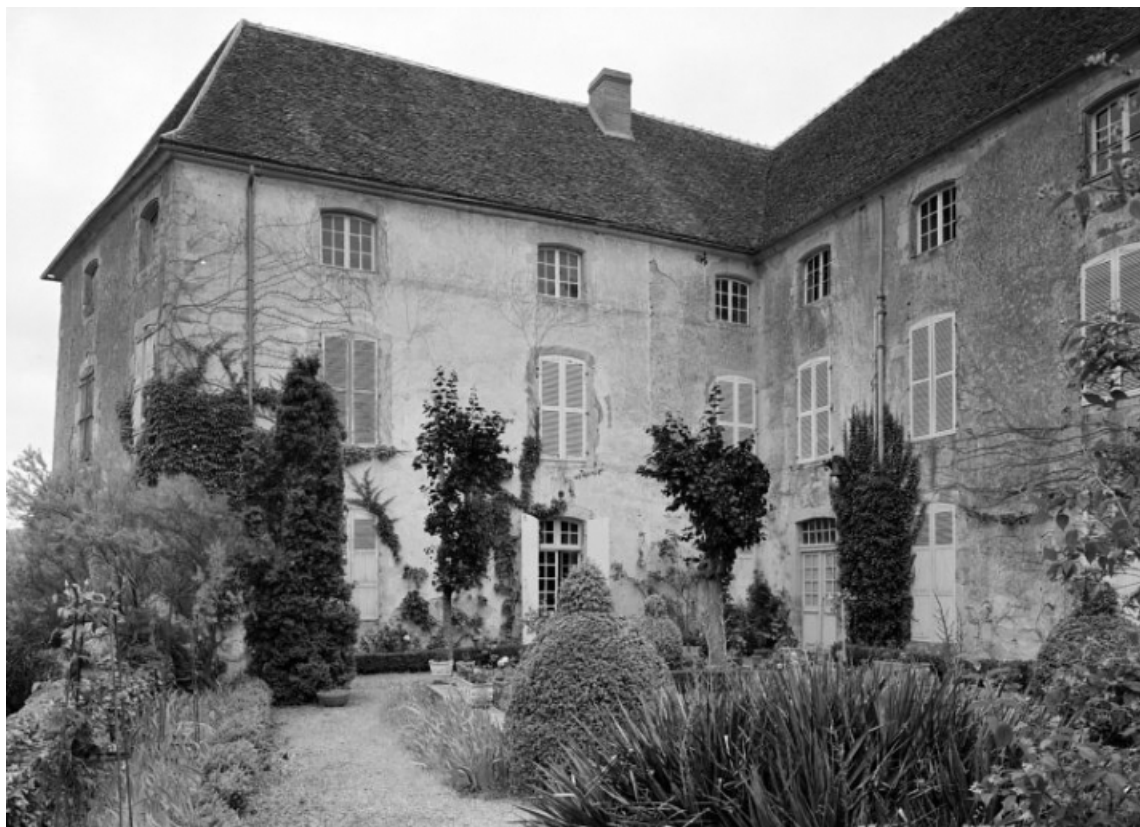
Vue prise du sud, depuis la terrasse supérieure.