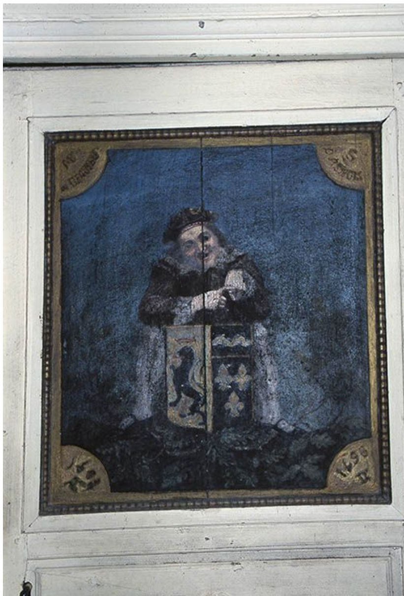
L'arcade d'entrée de la cage du grand escalier. Détail du couronnement. 58, Asnois rue du Château