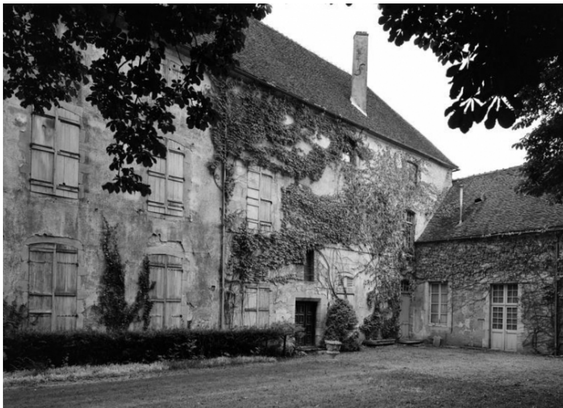
Bâtiment est. Façade prise du nord-est.