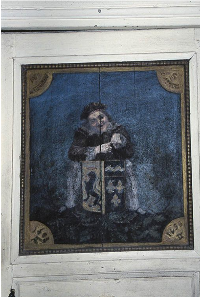
L'arcade d'entrée de la cage du grand escalier. Détail du couronnement. 58, Asnois rue du Château