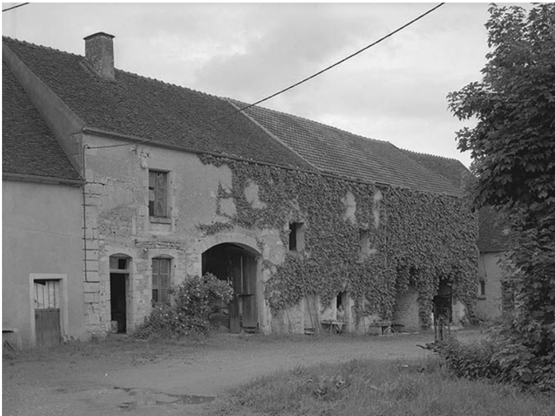
Ancienne ferme du château. Vue d'ensemble