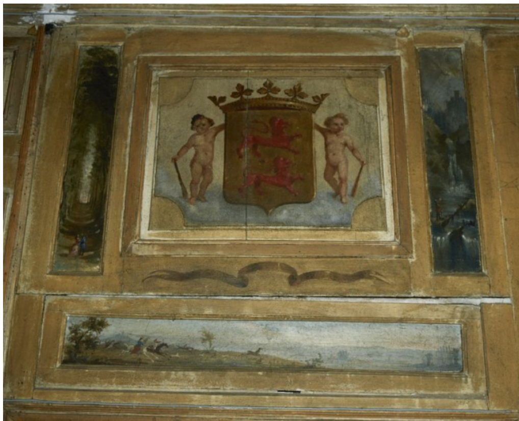
Décor peint d'un dessus de porte : armoiries tenues par deux putti et paysages. 58, Asnois rue du Château