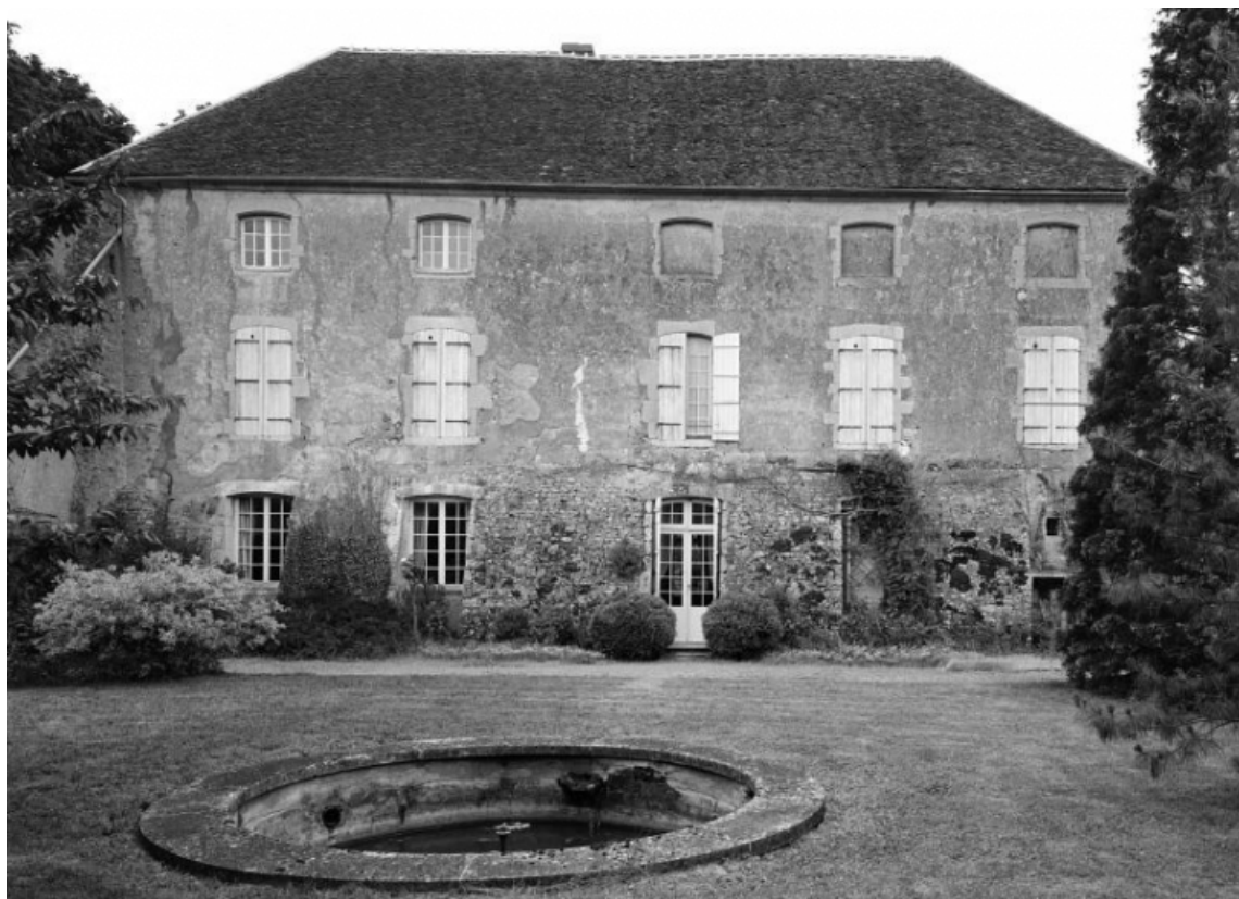
Bâtiment sud-ouest. Élévation antérieure.