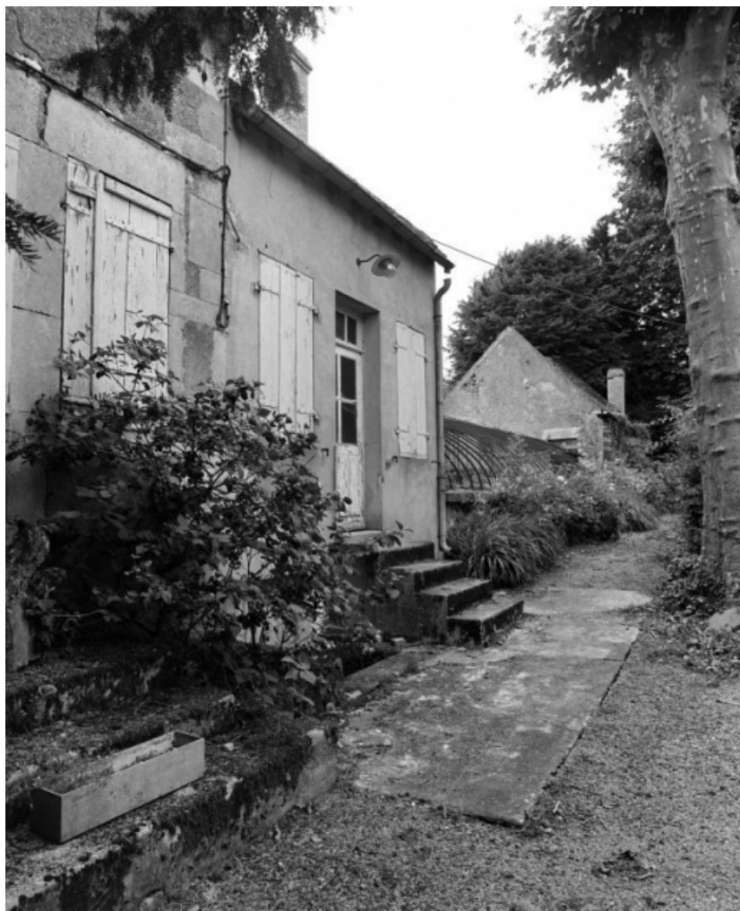
Logis annexe, serre adossée et chambre à four.