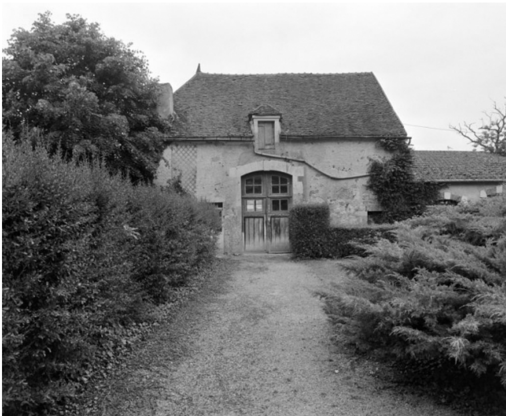
La remise et les écuries.