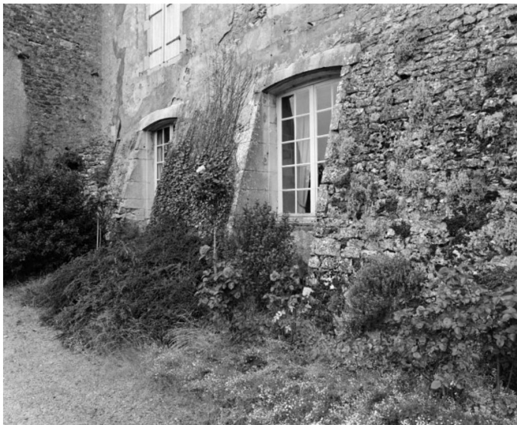
Bâtiment sud-ouest. Elévation antérieure, détail.