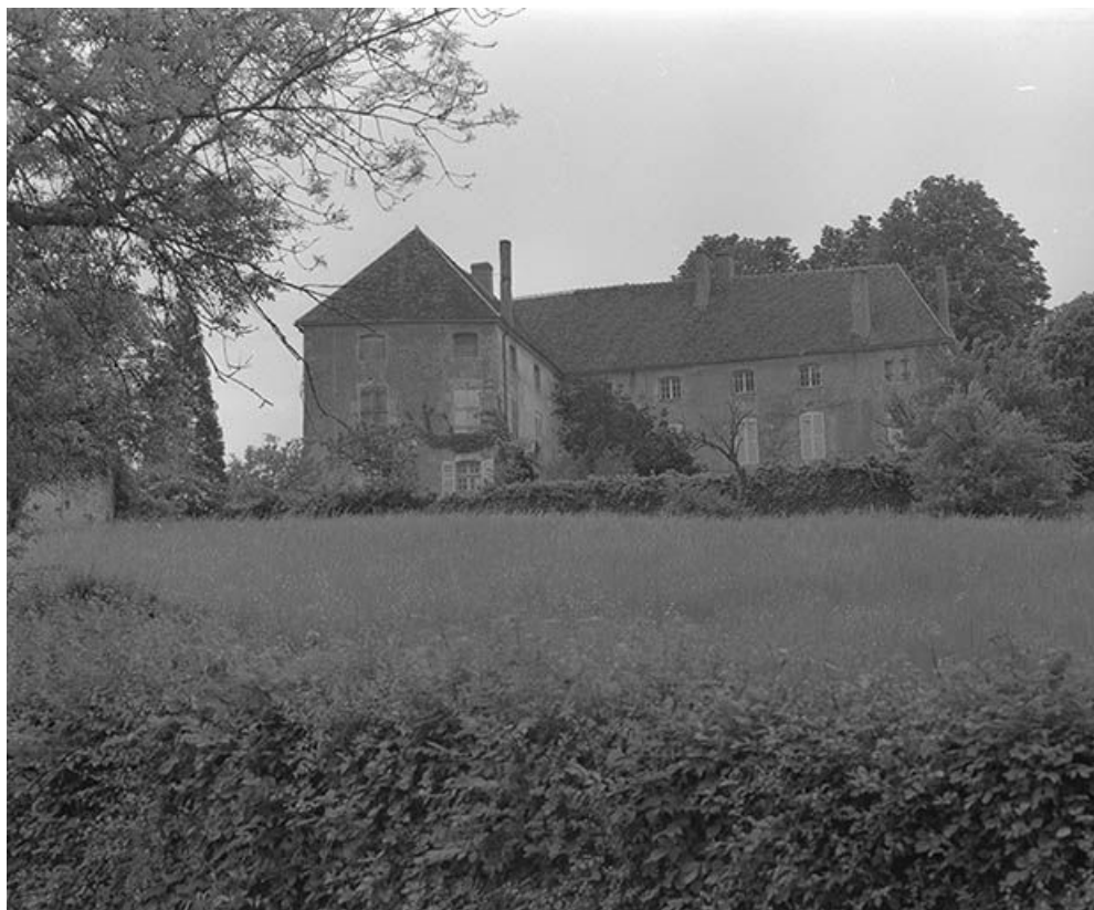
Vue d'ensemble des élévations postérieures