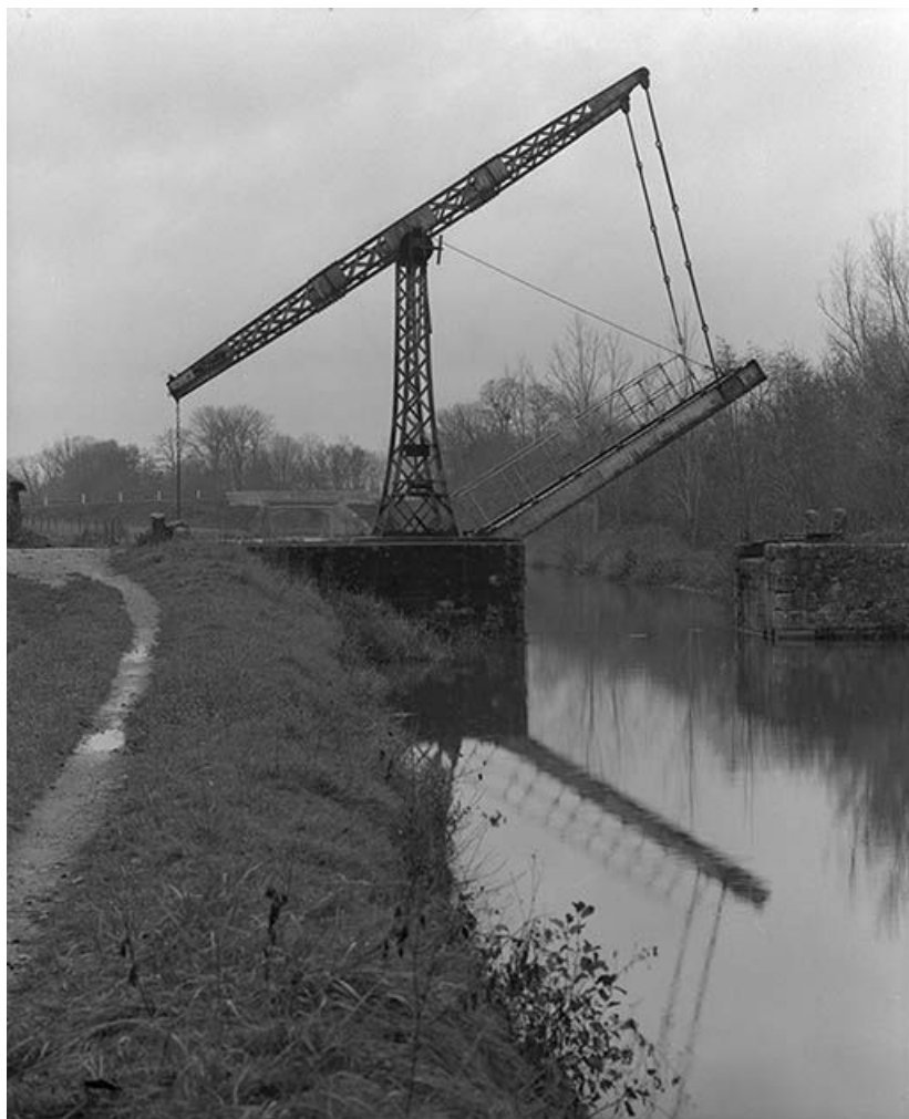
Vue d'ensemble prise du sud, depuis le chemin de halage. Tablier levé.

58, Saint-Didier, lieudit : Quartier de la Gare