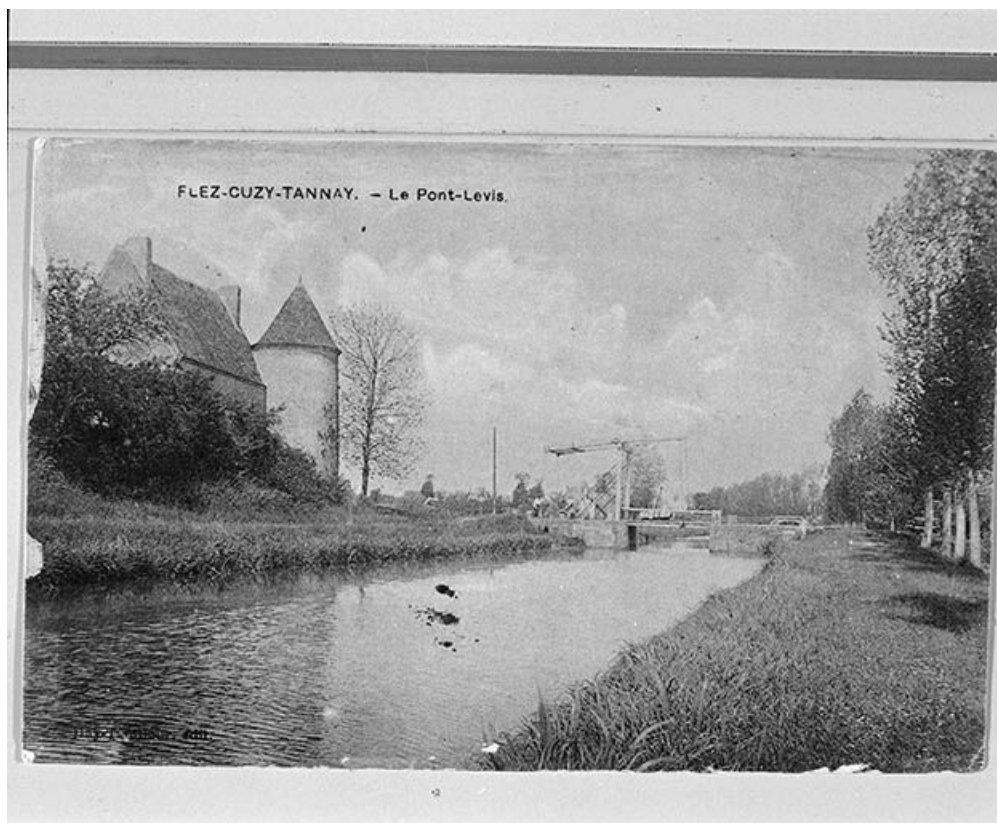
Vue d'ensemble prise du chemin de contre-halage. Carte postale ancienne. 58, Saint-Didier, lieudit : Quartier de la Gare