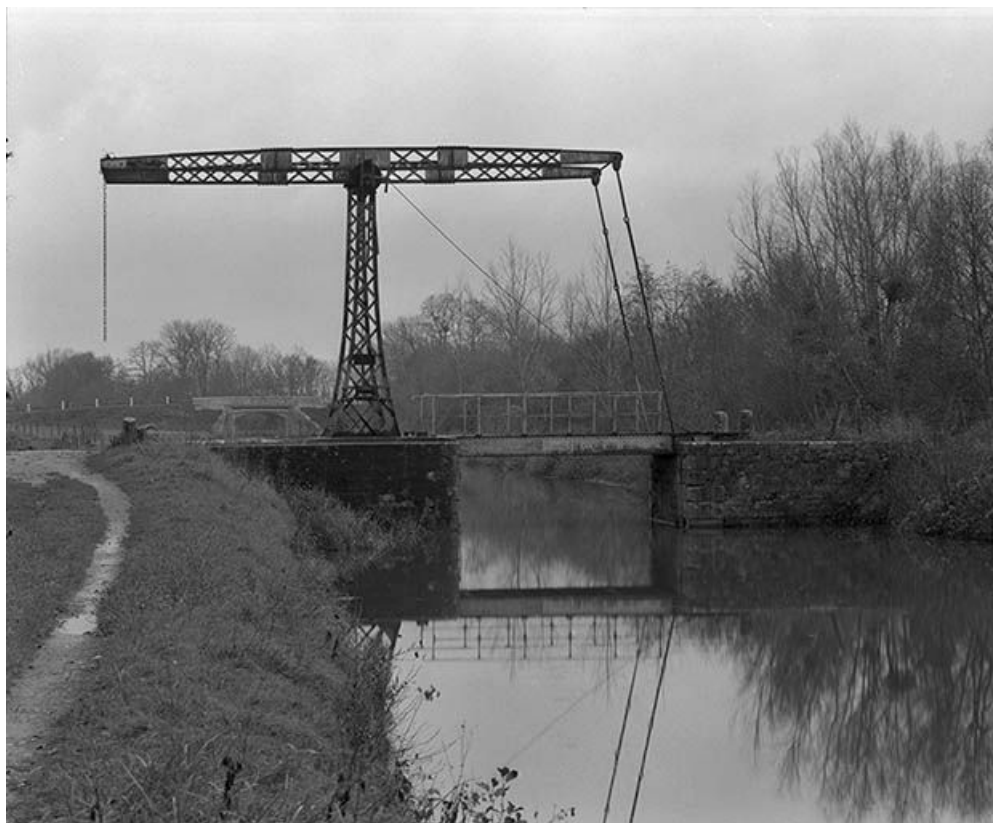
Vue d'ensemble prise du sud, depuis le chemin de halage.

58, Saint-Didier, lieudit : Quartier de la Gare