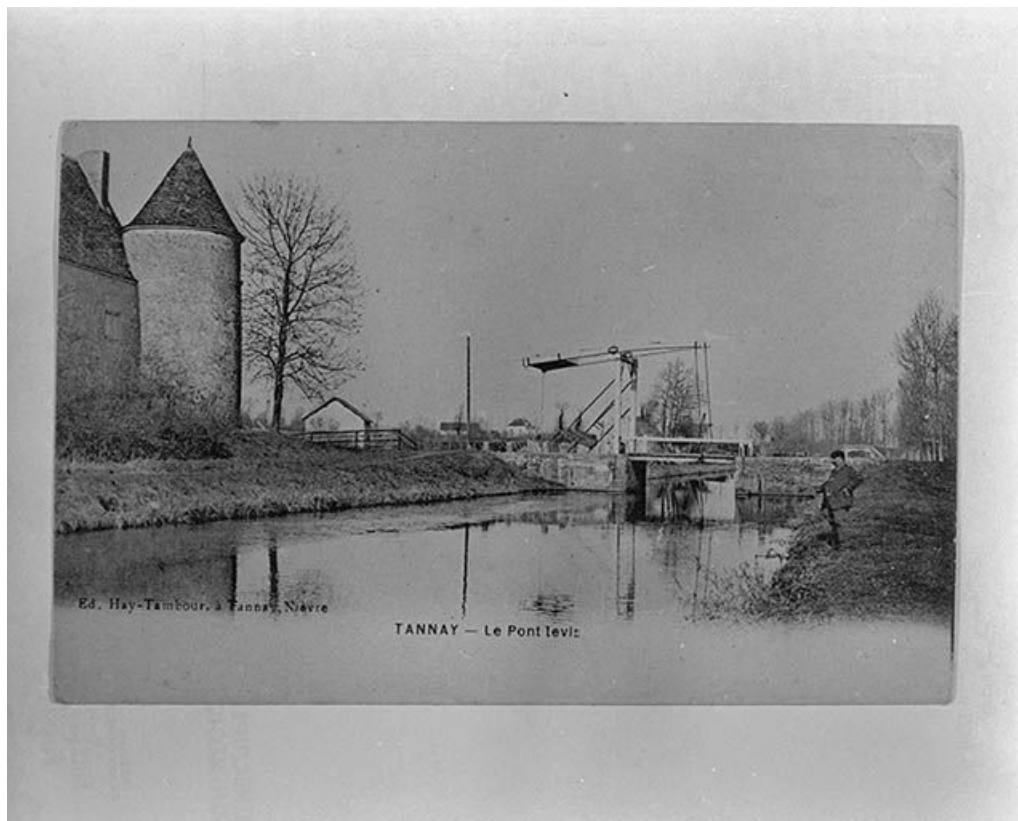
Vue d'ensemble prise du chemin de contre-halage. Carte postale ancienne, édit. H. Tambour, Clamecy. 58, Saint-Didier, lieudit : Quartier de la Gare