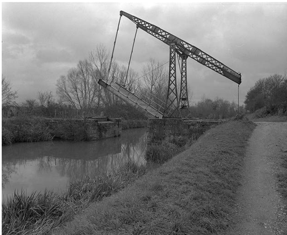
Vue d'ensemble prise du nord, depuis le chemin de halage. Tablier levé.

58, Saint-Didier, lieudit : Quartier de la Gare