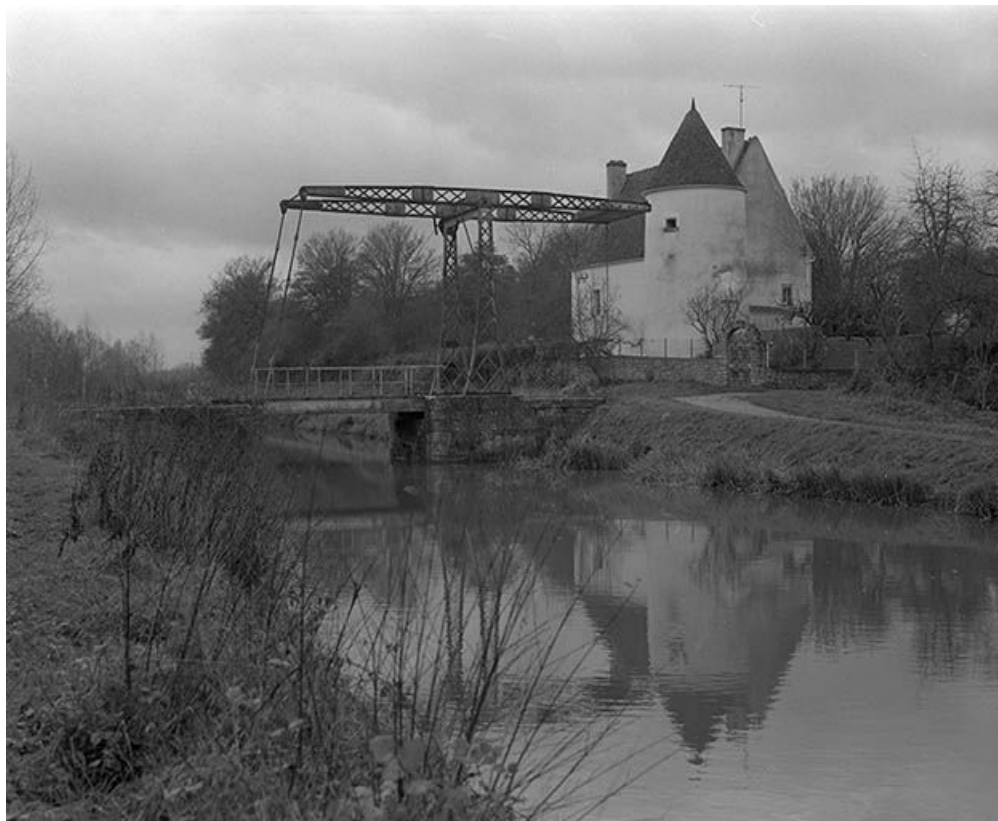
Vue d'ensemble prise du nord, depuis le chemin de contre-halage.

58, Saint-Didier, lieudit : Quartier de la Gare