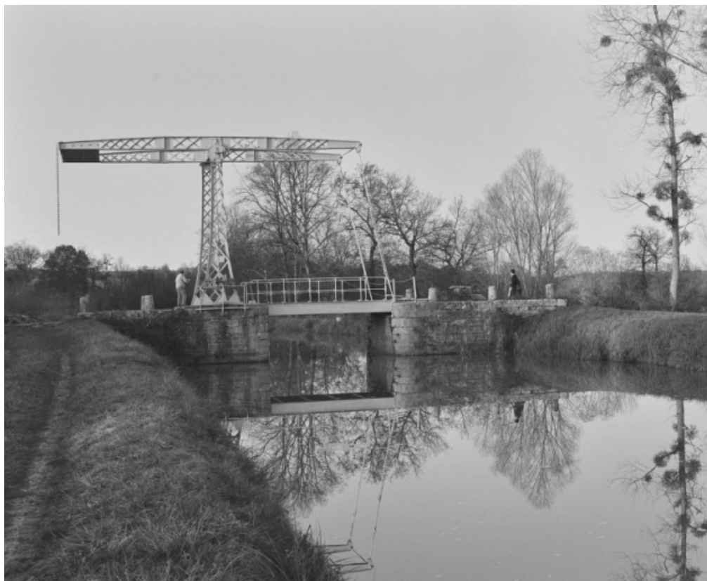
Vue d'ensemble prise du sud.