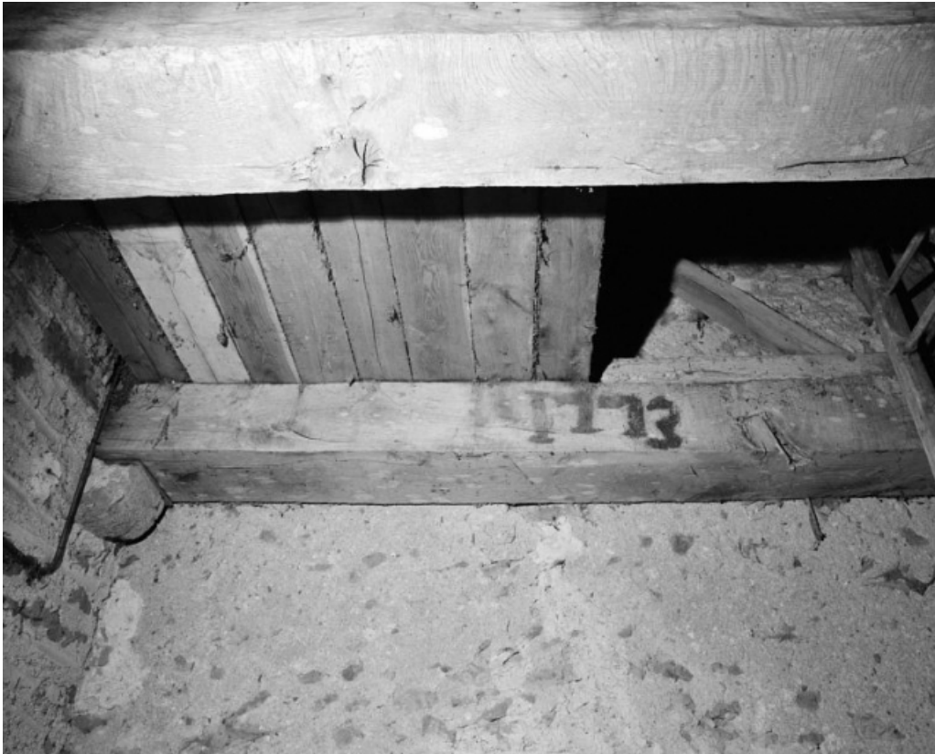
Clocher, poutres supportant le beffroi.