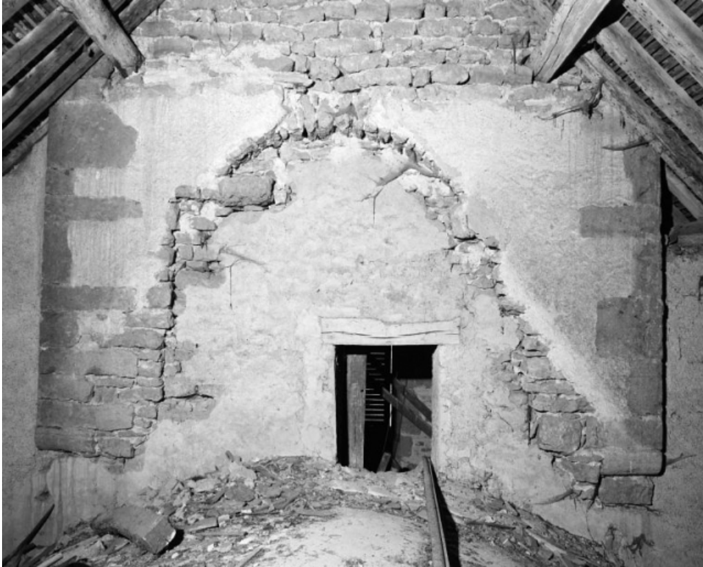
Clocher, mur postérieur, vue prise du comble de la nef.