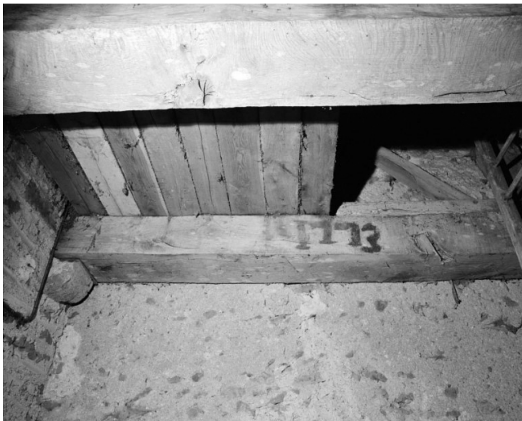
Clocher, poutres supportant le beffroi.