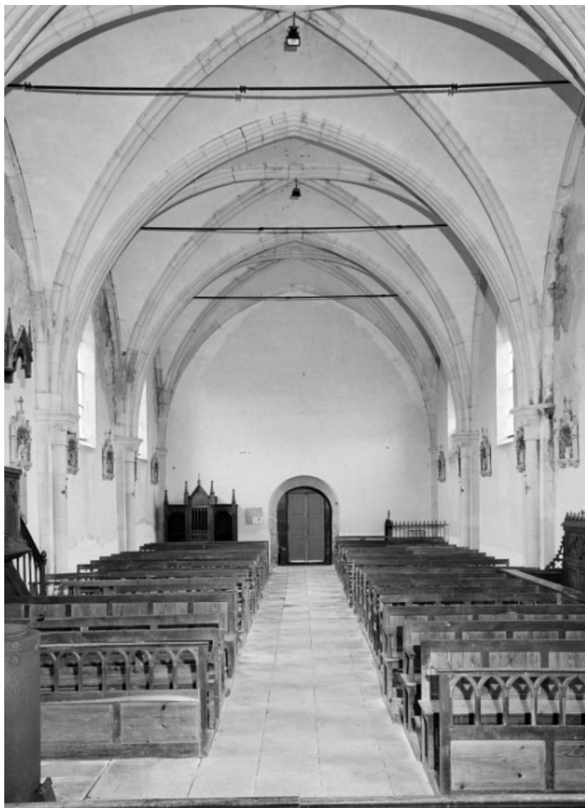
Vue intérieure prise du choeur.