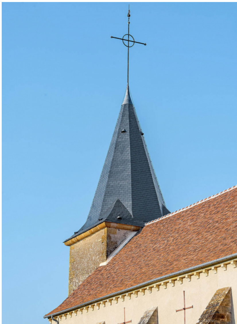
Détail de la couverture en tuiles plates restaurée et du clocher.