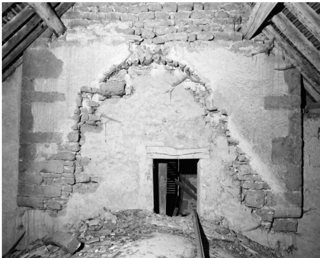
Clocher, mur postérieur, vue prise du comble de la nef. 58, Ruages V.C. 1