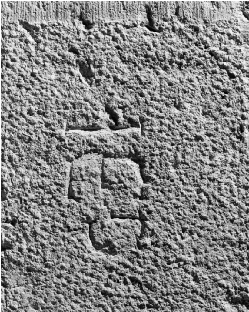
Clocher, 2e niveau : marque de tacheron sur la fenêtre droite.