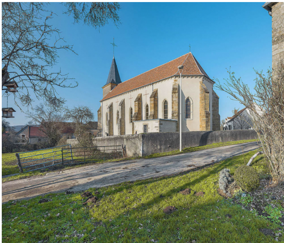
Vue d'ensemble de trois-quarts : chevet et élévation droite.