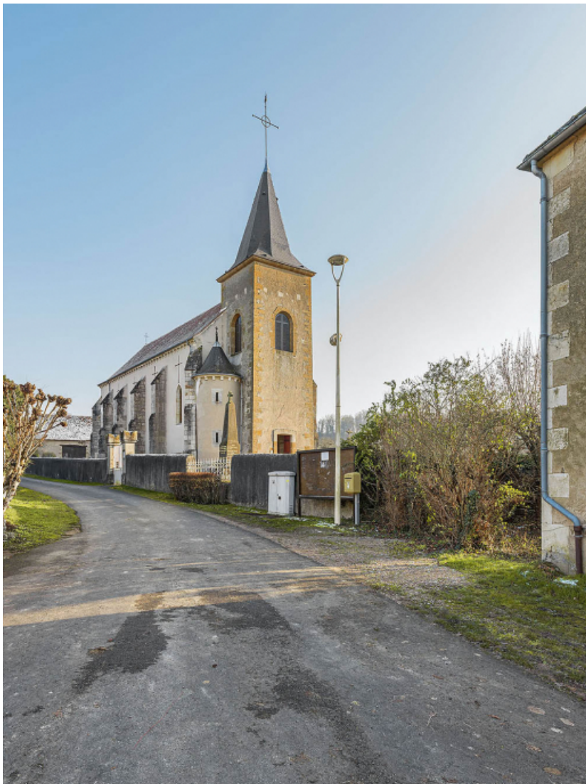
Vue d'ensemble de l'église.