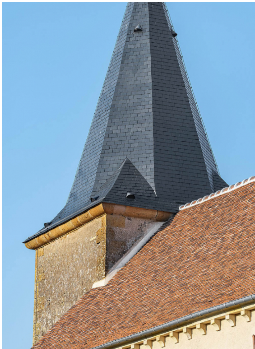
Détail de la couverture en tuiles plates refaite.