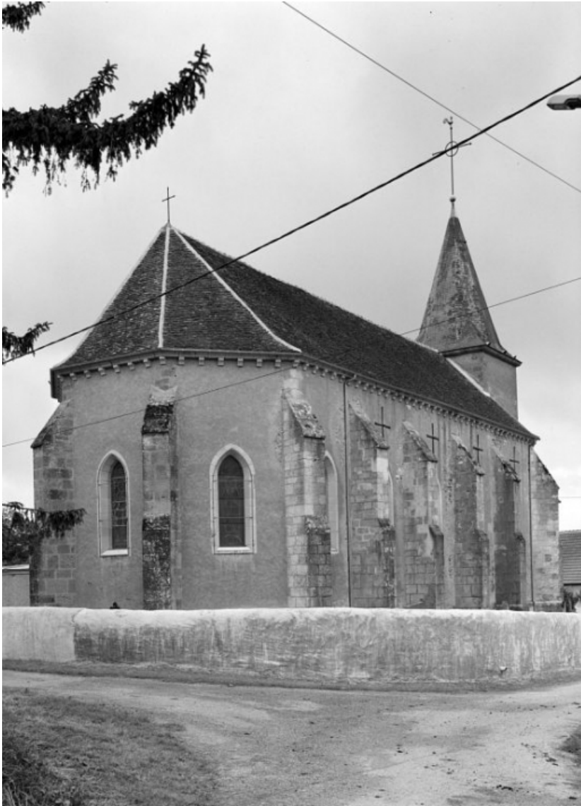
Elévation gauche et abside