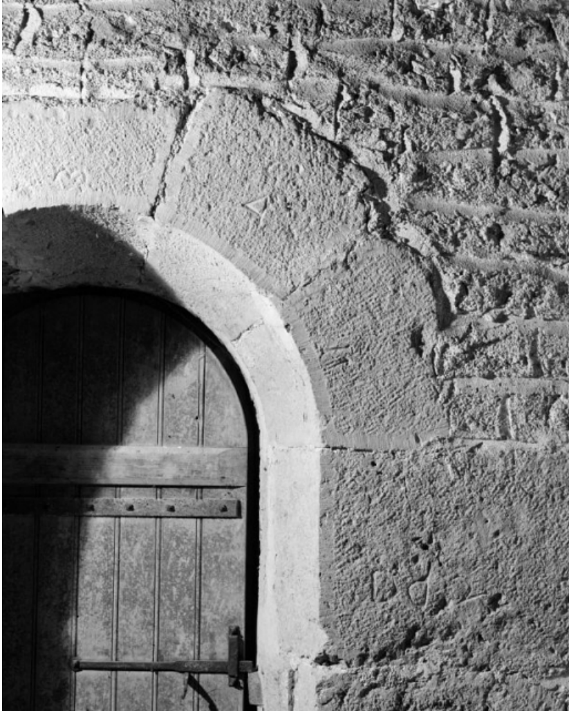
Clocher, 2e niveau : détail de la fenêtre gauche (transformée en porte). 58, Ruages V.C. 1