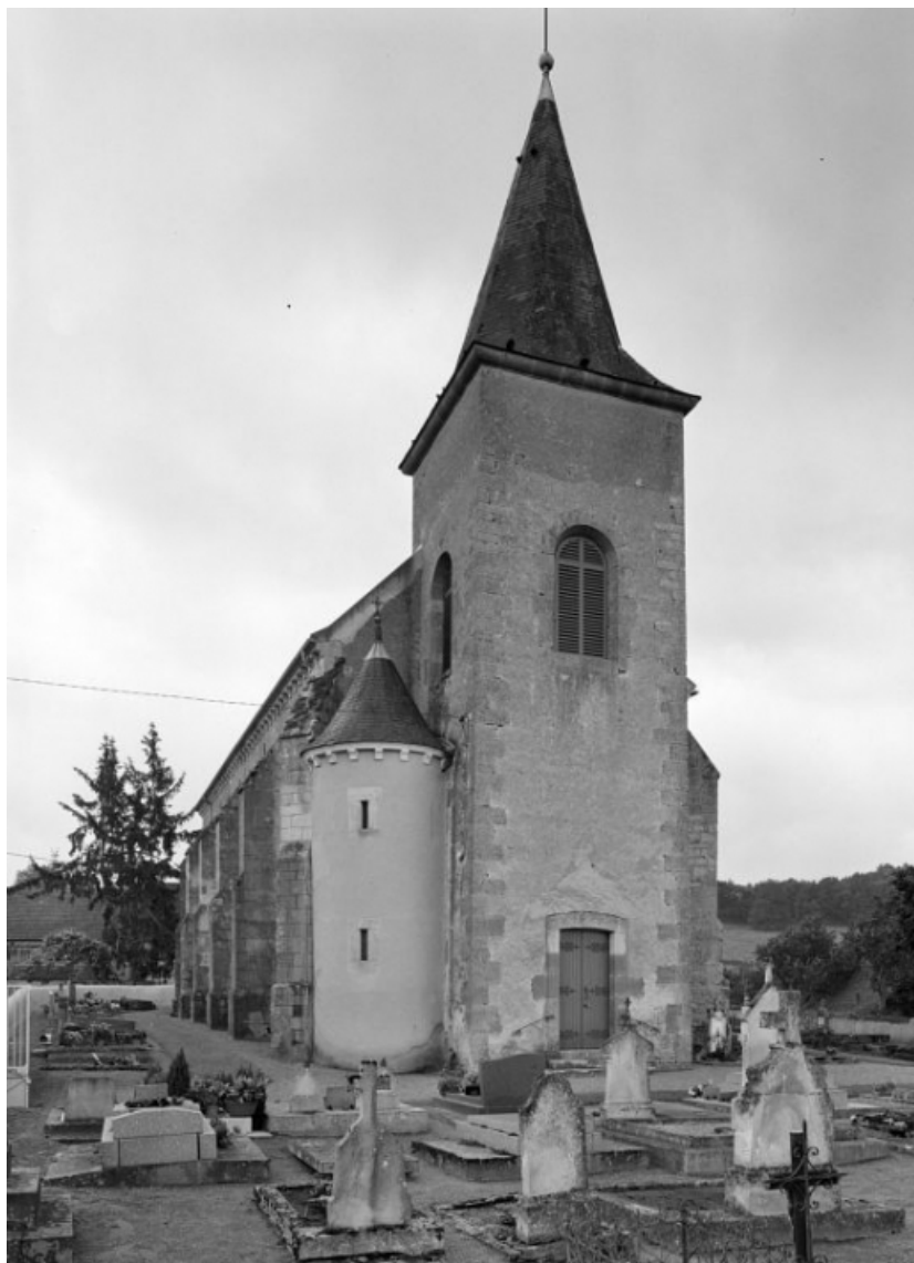
Vue d'ensemble. 58, Ruages V.C. 1