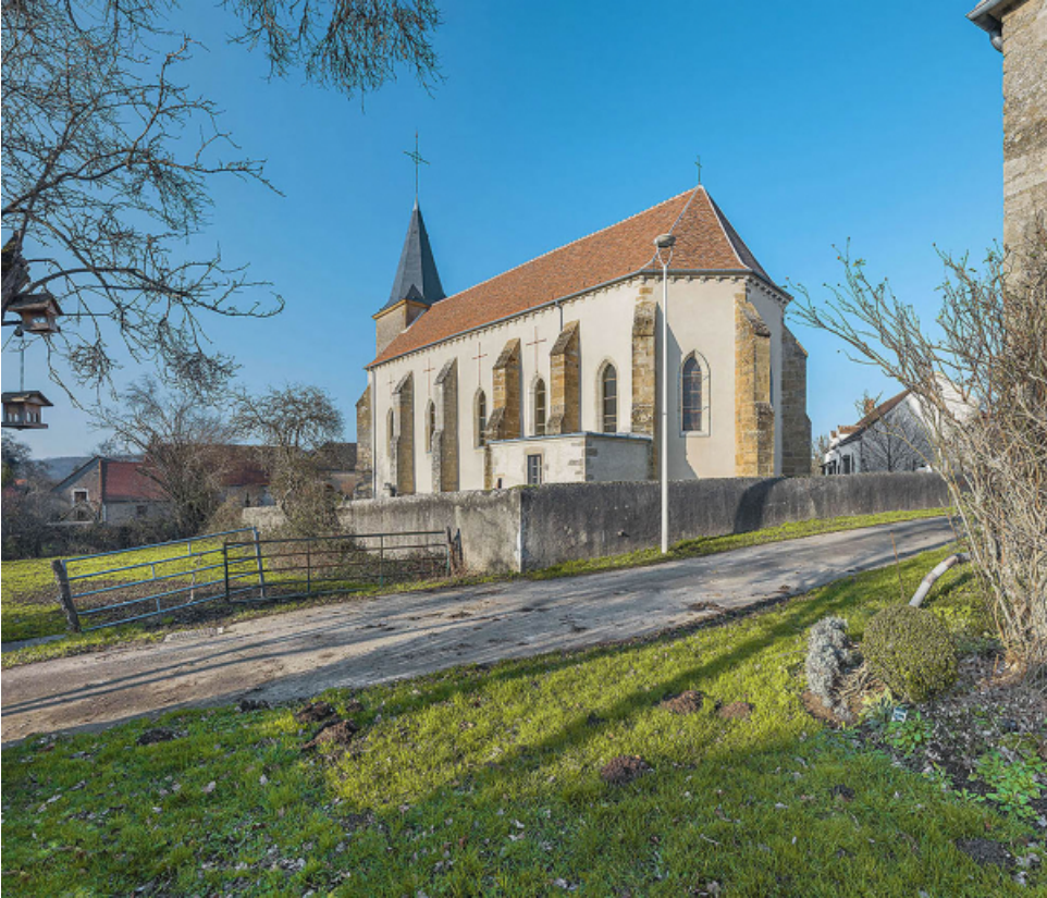
Vue d'ensemble de trois-quarts : chevet et élévation droite.