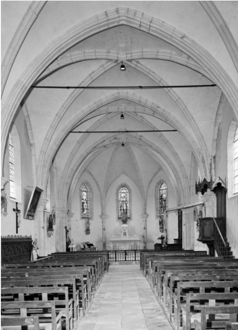
Vue intérieure prise de l'entrée.