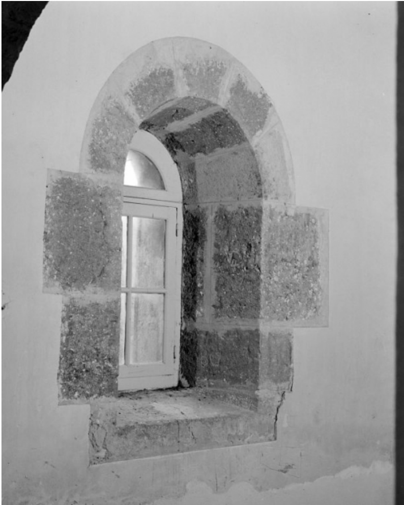
Fenêtre droite du vestibule.