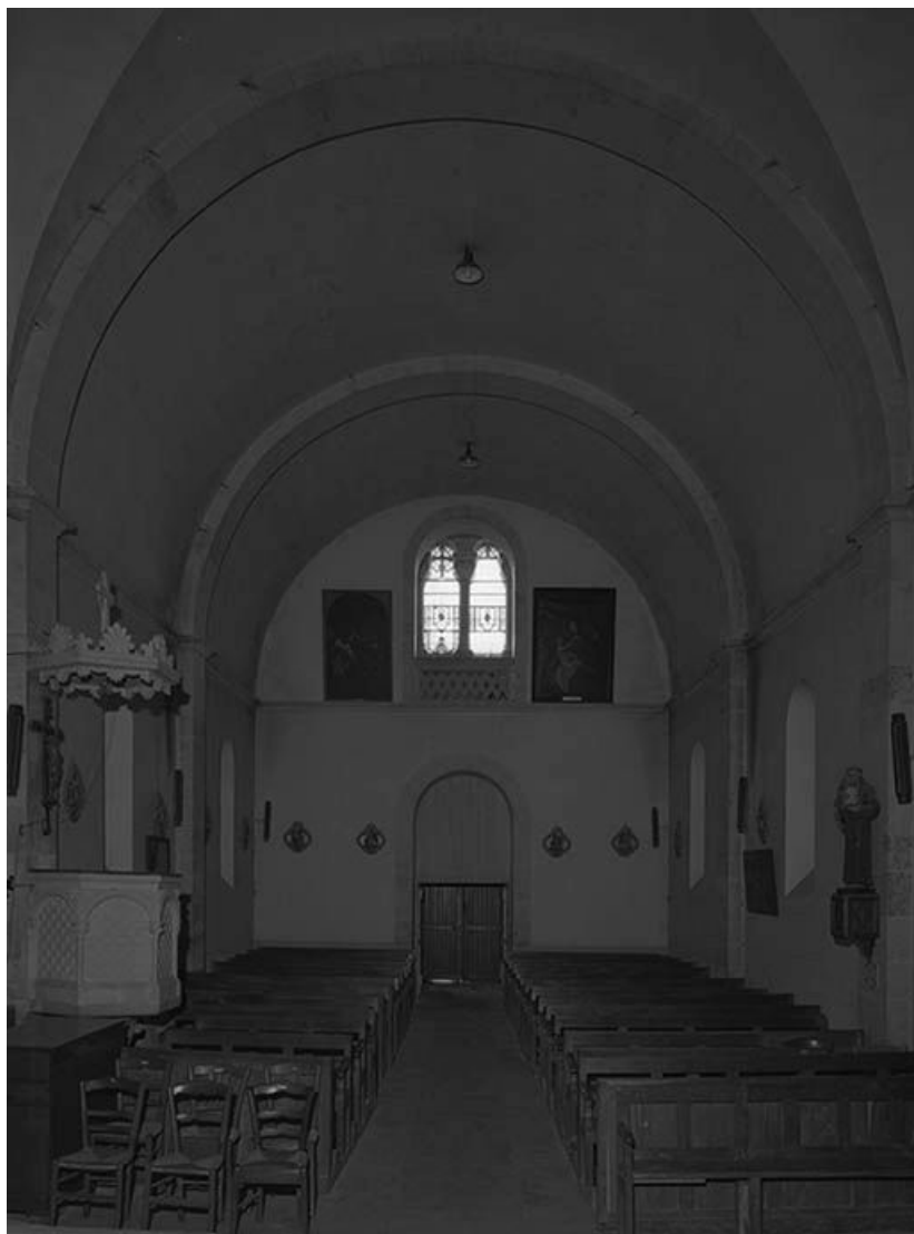
Vue intérieure prise du chœur.

58, Monceaux-le-Comte place de l' Eglise