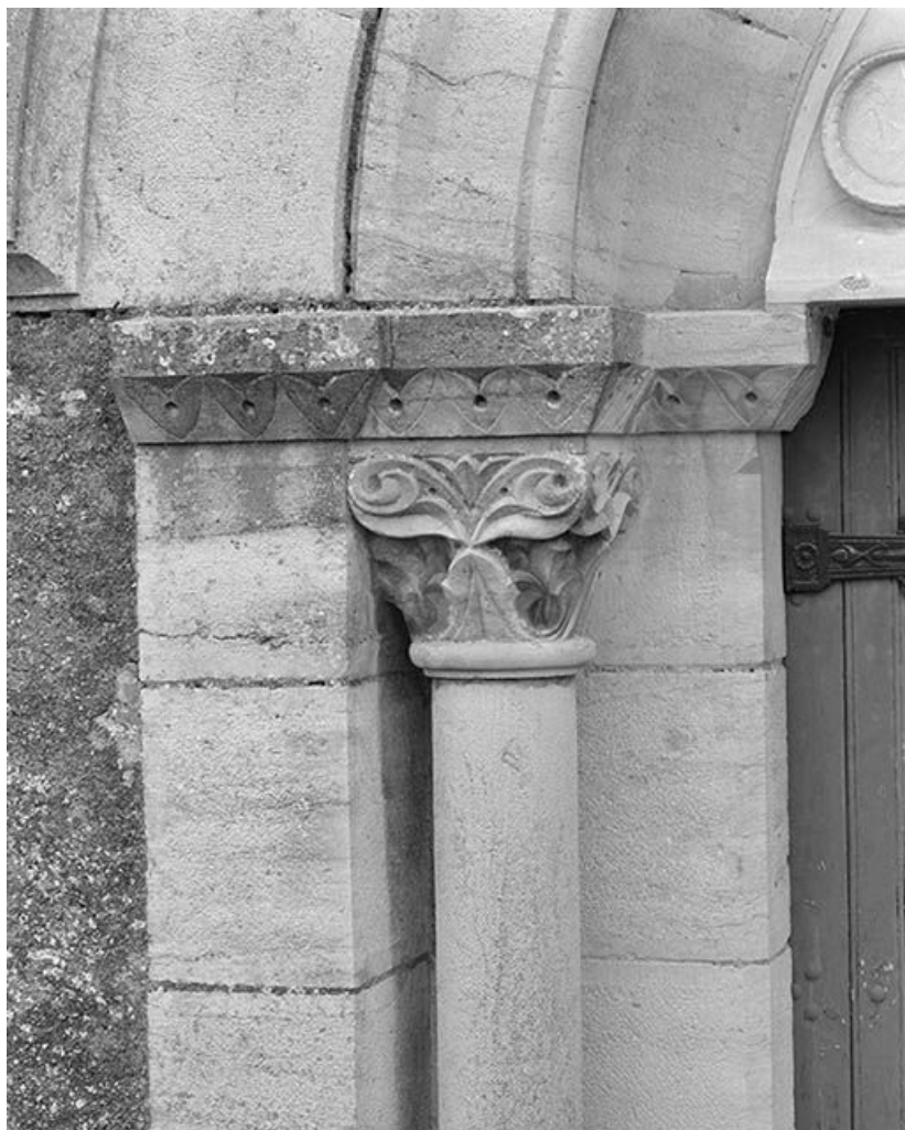
Façade, détail du chapiteau gauche du portail.

58, Monceaux-le-Comte place de l' Eglise