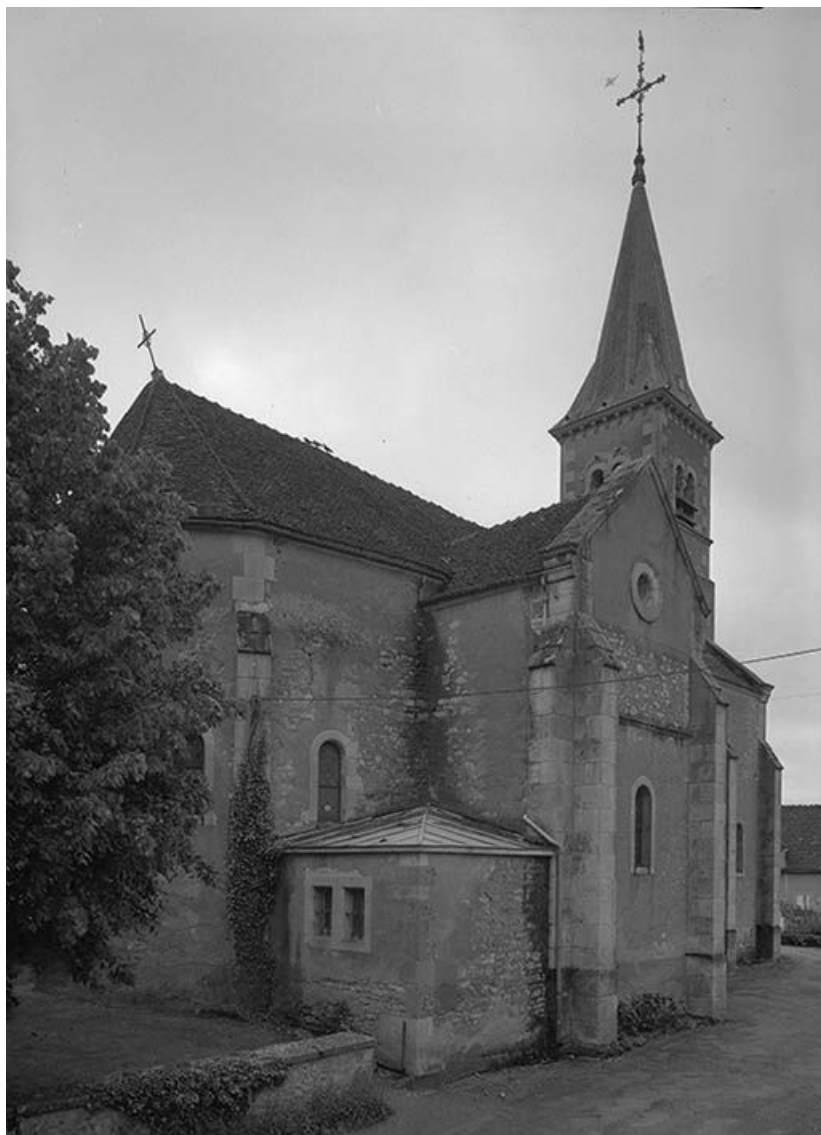
Abside et élévation gauche.

58, Monceaux-le-Comte place de l' Eglise