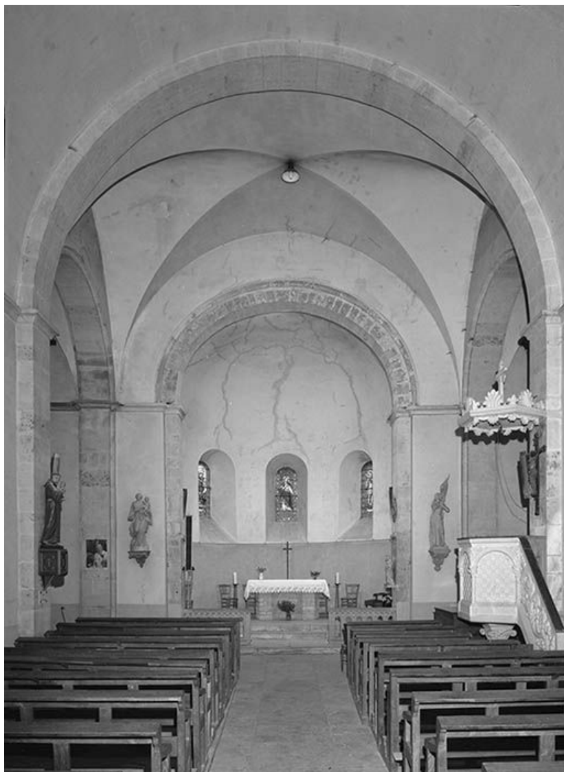
Vue intérieure prise de l'entrée.

58, Monceaux-le-Comte place de l' Eglise