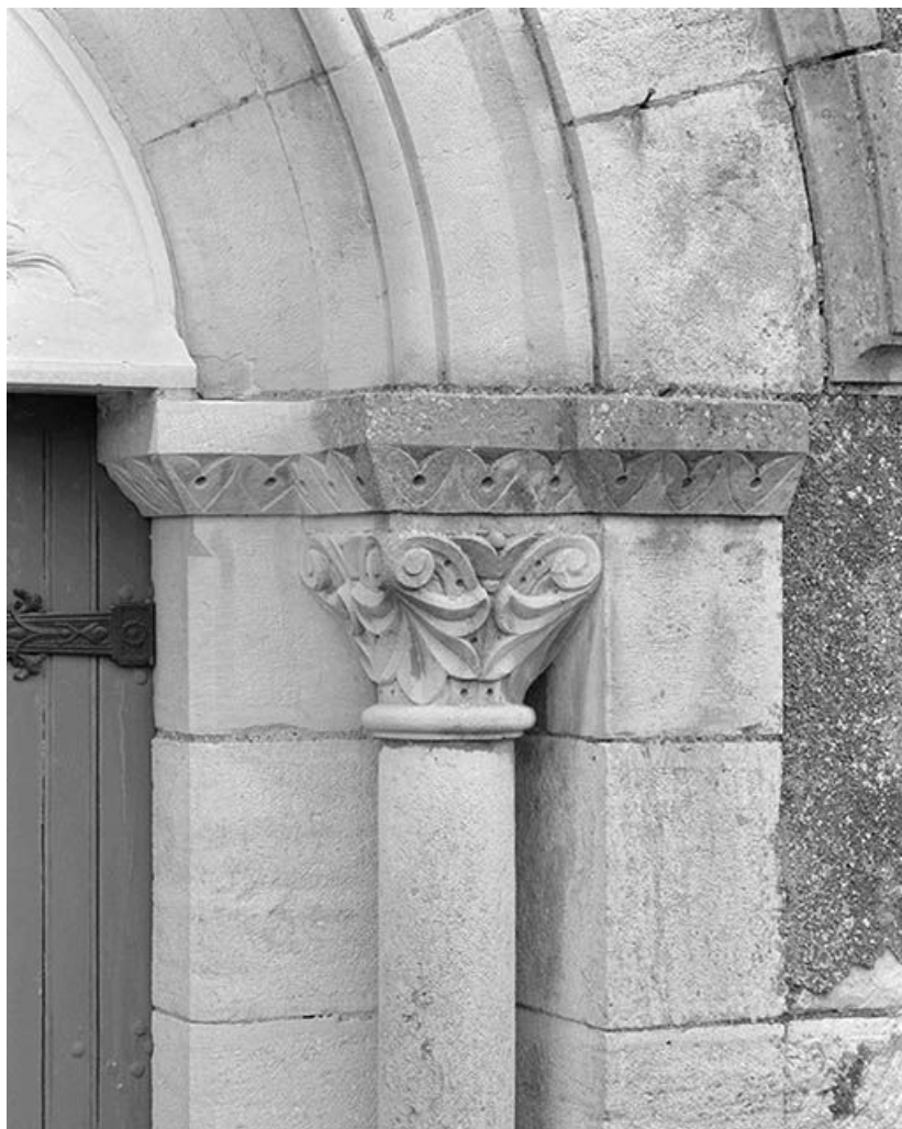
Façade, détail du chapiteau droit du portail.

58, Monceaux-le-Comte place de l' Eglise