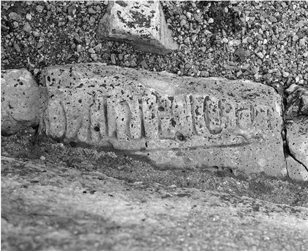
Elévation gauche : fragment de dalle funéraire remployé à la base d'un contrefort.

58, Monceaux-le-Comte place de l' Eglise