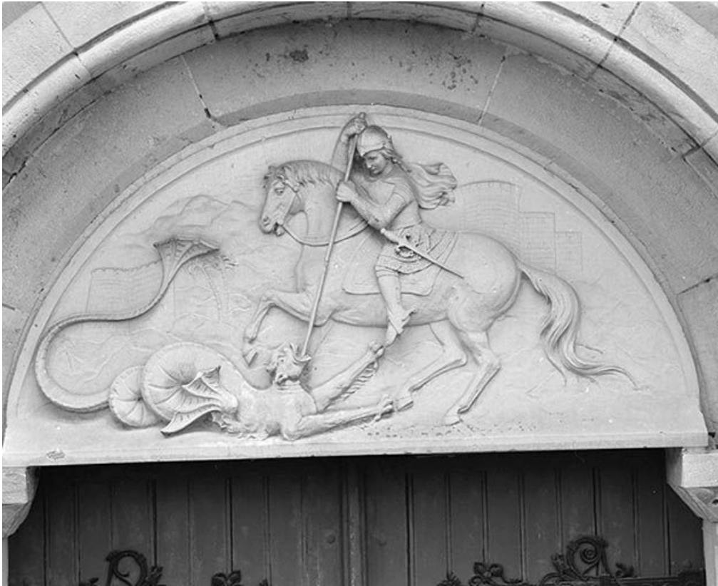
Façade, tympan du portail.

58, Monceaux-le-Comte place de l' Eglise