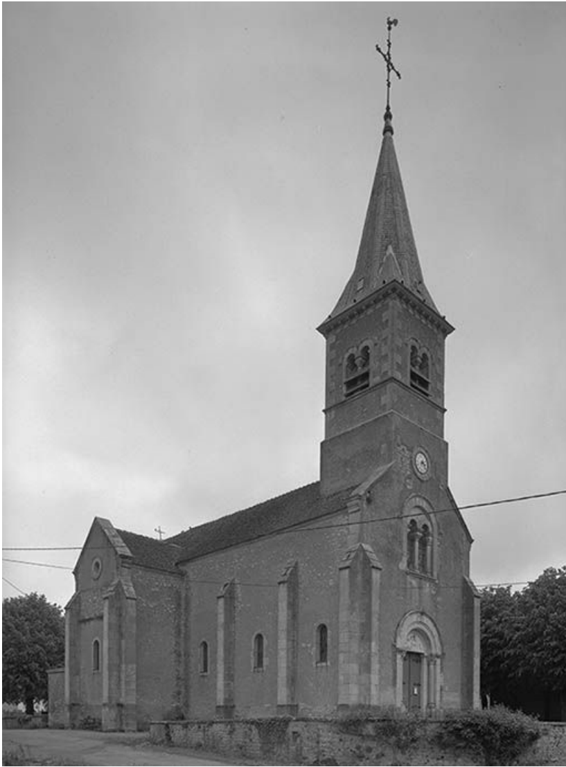
Façade et élévation gauche.

58, Monceaux-le-Comte place de l' Eglise