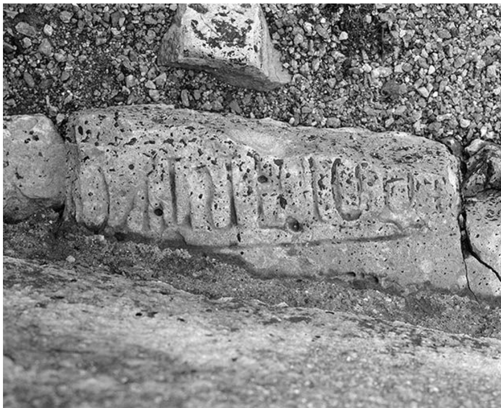
Élévation gauche : fragment de dalle funéraire employé à la base d'un contrefort. 58, Monceaux-le-Comte place de l' Eglise