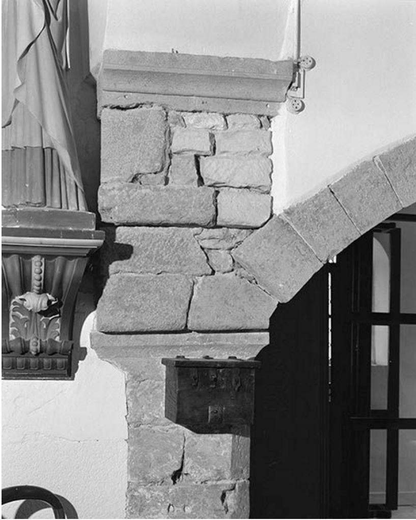
Arcade de la chapelle gauche : détail du support gauche 58, Dirol C.D. 528