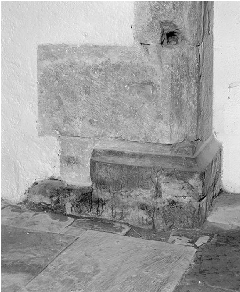
Arcade du chœur : base du support droit