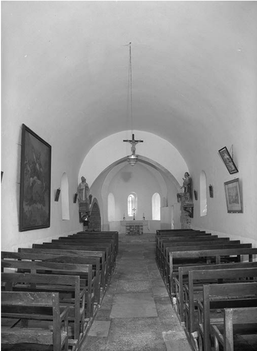
Vue intérieure prise de l'entrée