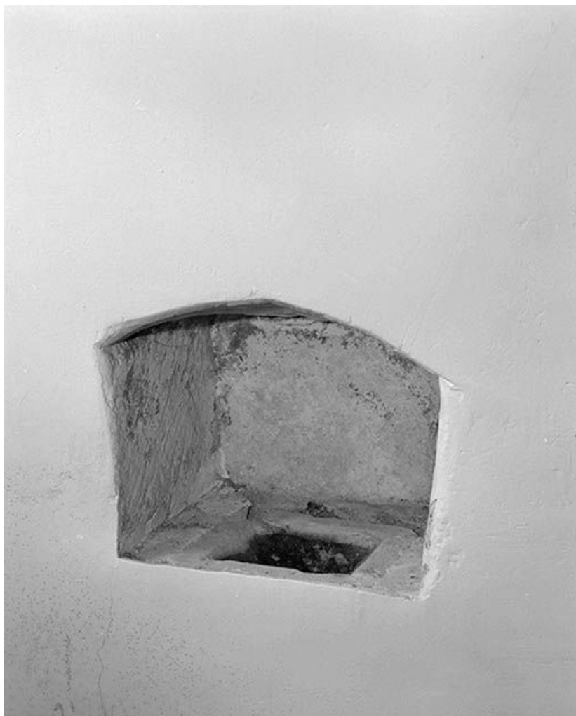
Lavabo de la chapelle gauche