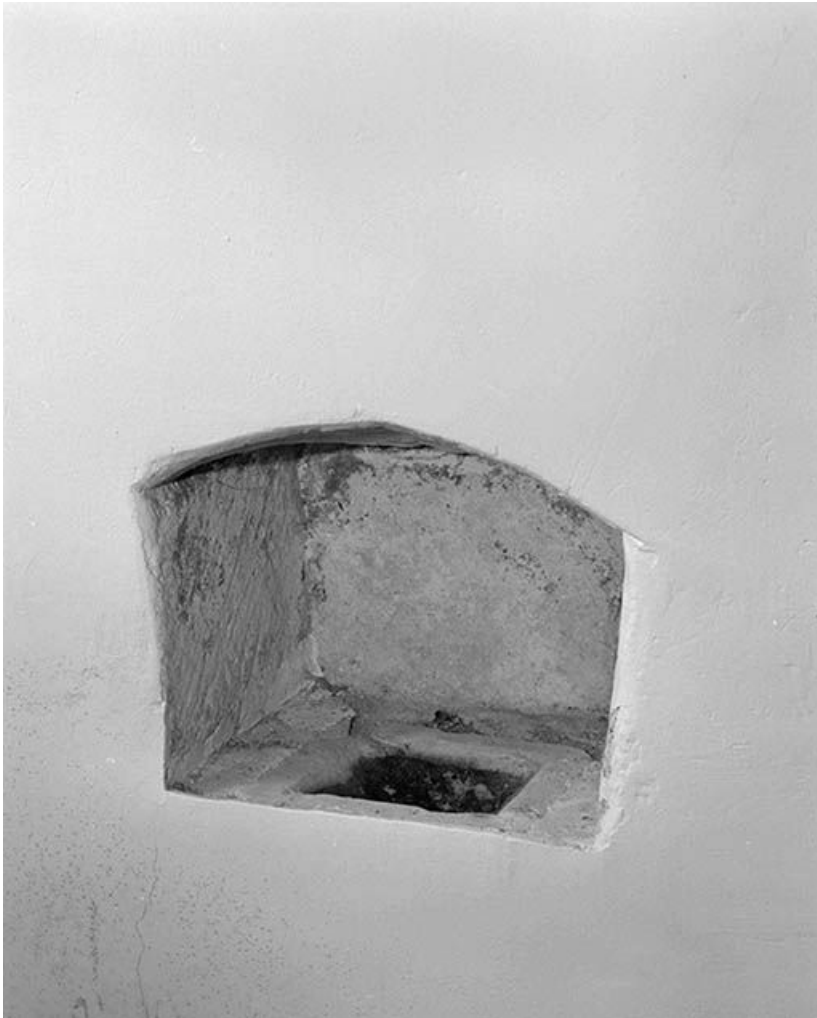
Lavabo de la chapelle gauche