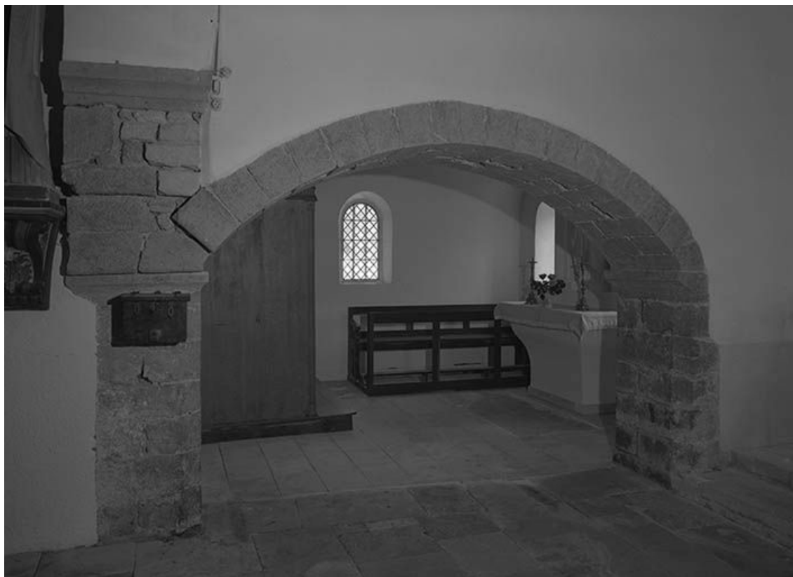
Chapelle gauche 58, Dirol C.D. 528