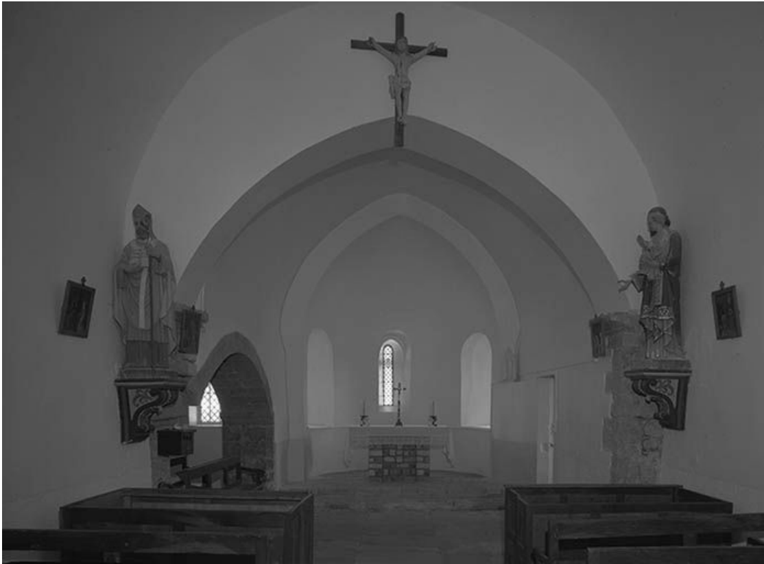
Vue rapprochée du chœur