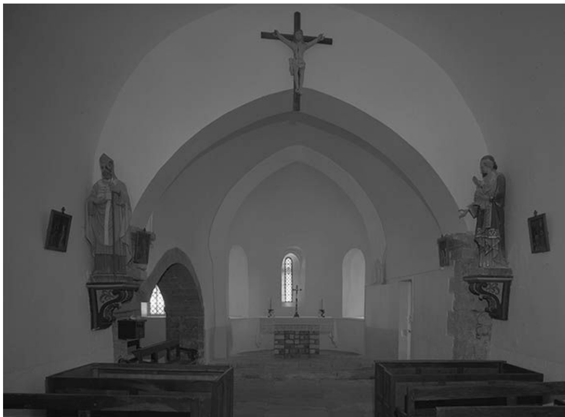
Vue rapprochée du chœur