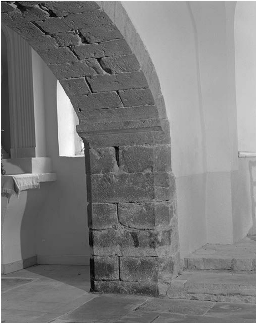
Arcade de la chapelle gauche : support droit