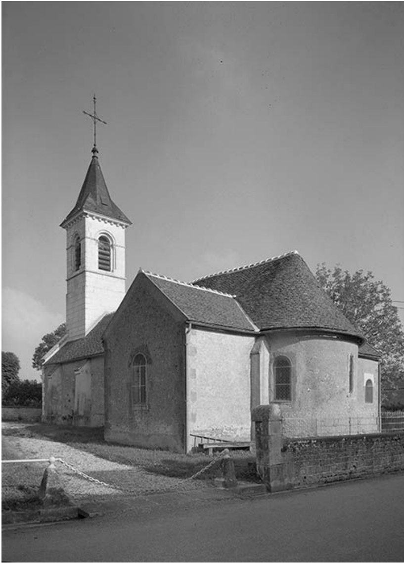
Elévation droite et abside