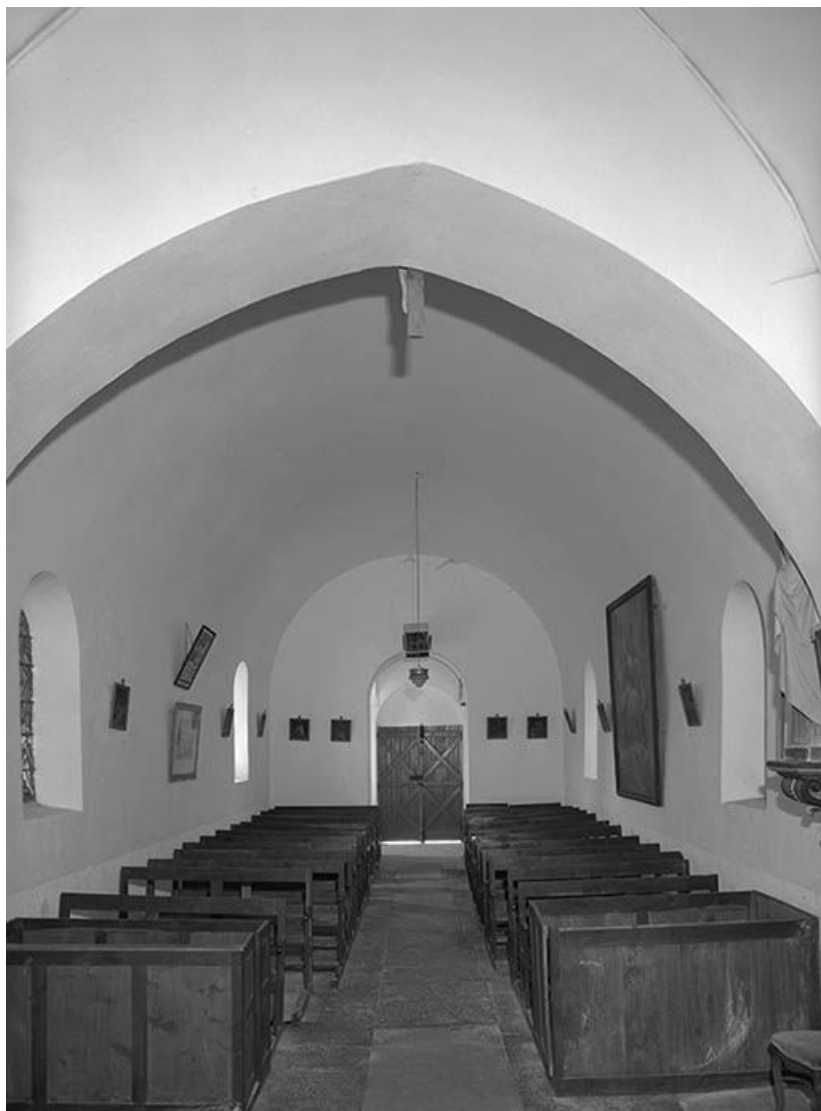
Vue intérieure prise du chœur