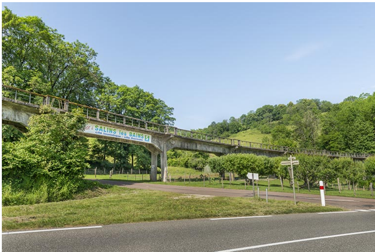
Vue d'ensemble depuis la route départementale 467. 39, Salins-les-Bains