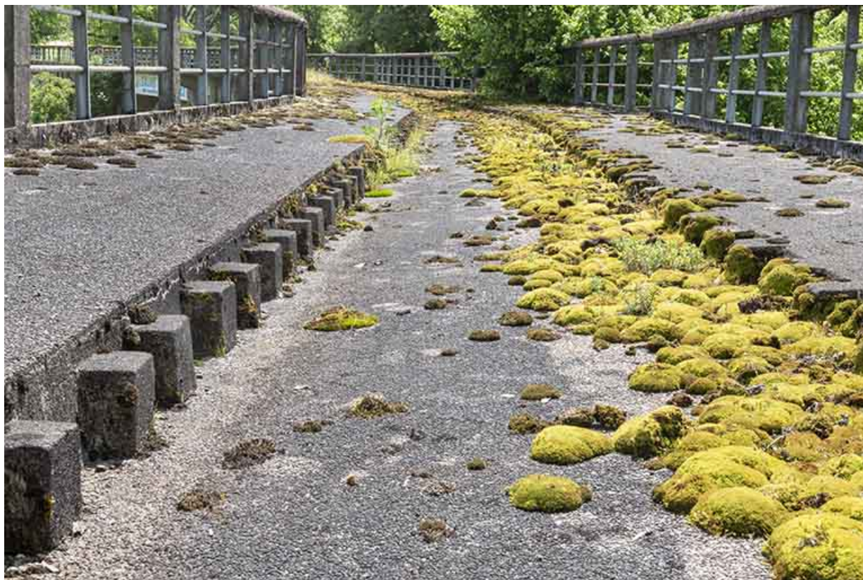
Détail de la chaussée.