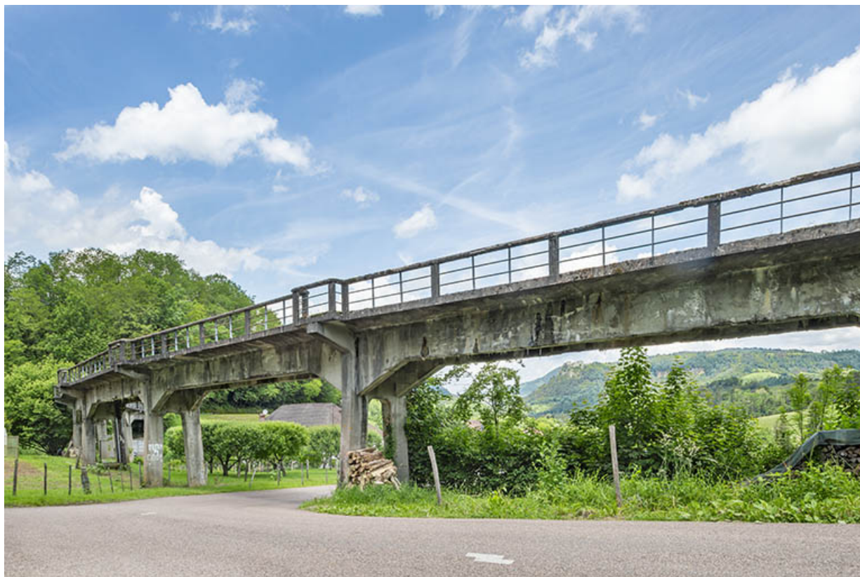
Vue d'ensemble depuis la route de Chaux-Champagny. 39, Salins-les-Bains