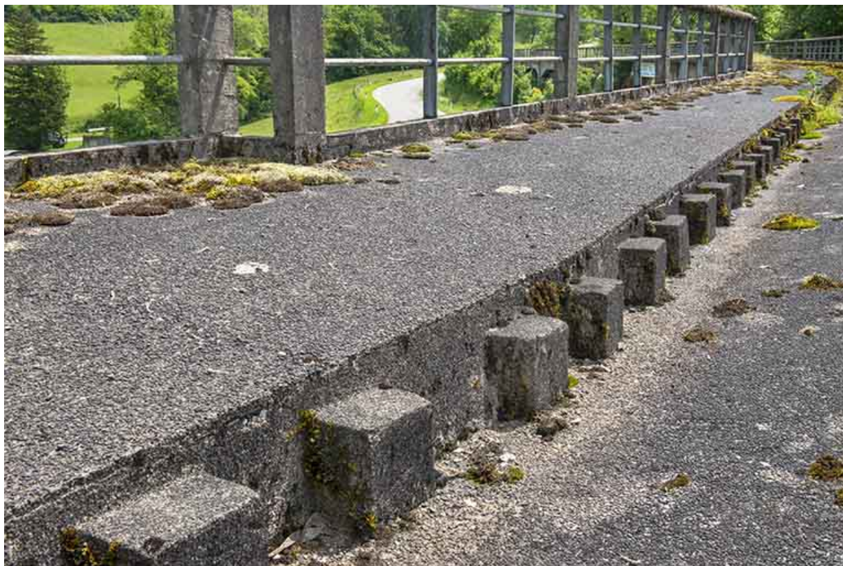
Détail du trottoir et de la chaussée.