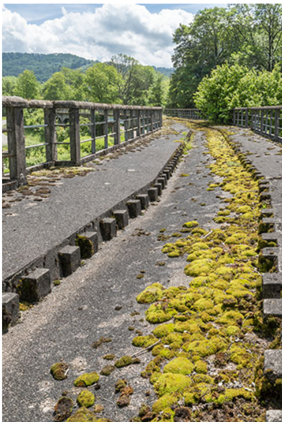
Détail de la chaussée.