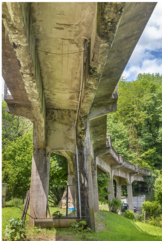
Vue prise sous le pont, depuis la route de Chaux-Champagny. 39, Salins-les-Bains