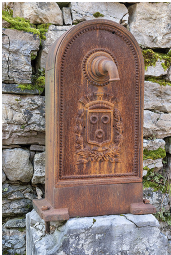
Borne-fontaine. Détail de la borne.