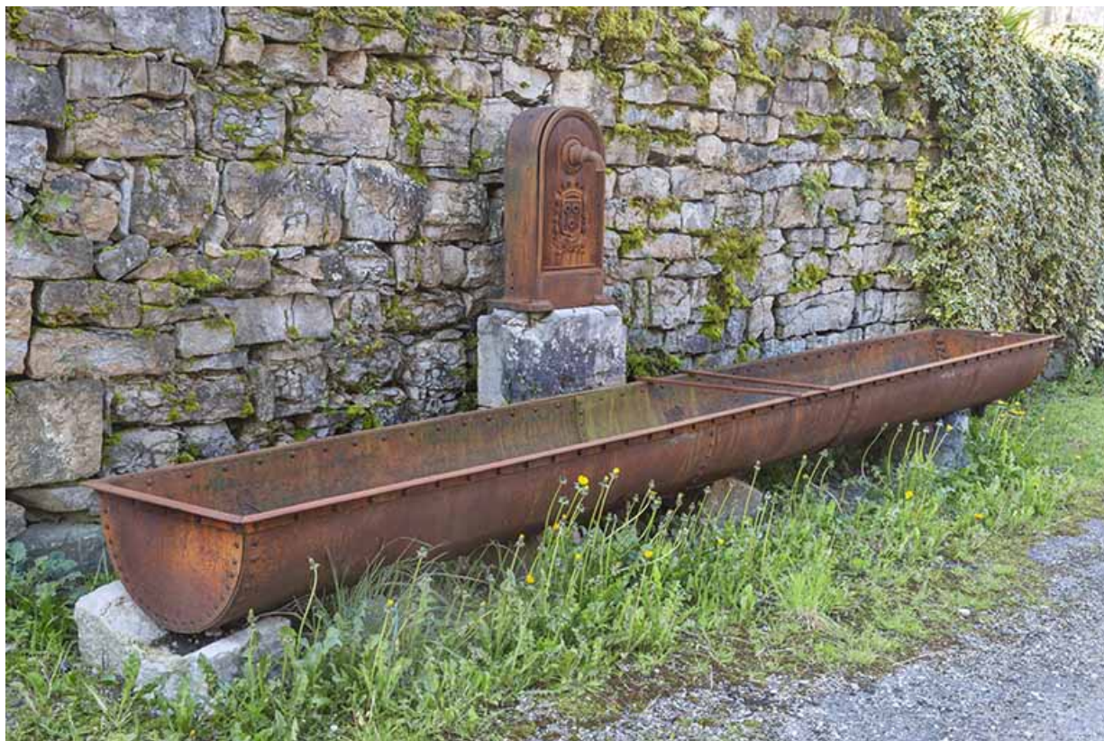
Borne-fontaine-abreuvoir, installée 80 mètres à l'est.