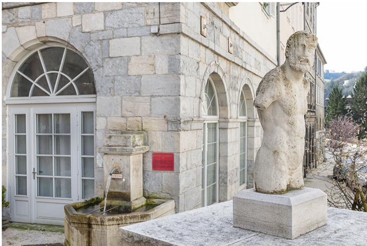
Vue de la fontaine et de la statue (déplacée).