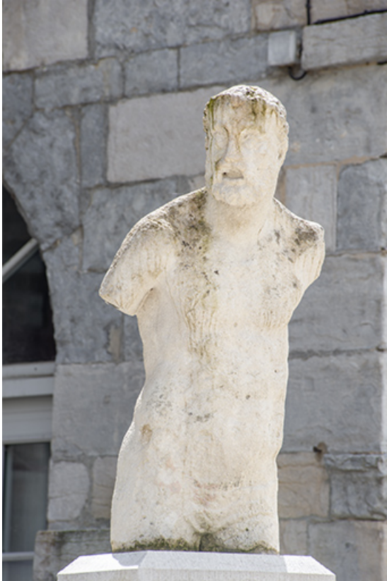
Buste vu de trois quarts.