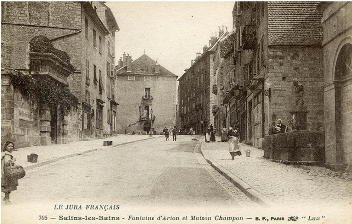
Salins-les-Bains - Fontaine d'Arion et Maison Champon, s.d. [fin 19e ou début 20e siècle]. 39, Salins-les-Bains rue de la Liberté