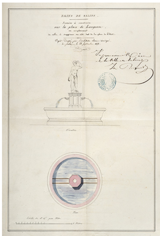
Fontaine à construire sur la place de Langonne, en remplacement de celle à supprimer au côté sud de la place de l'Islet, 1858. 39, Salins-les-Bains Place des Bains