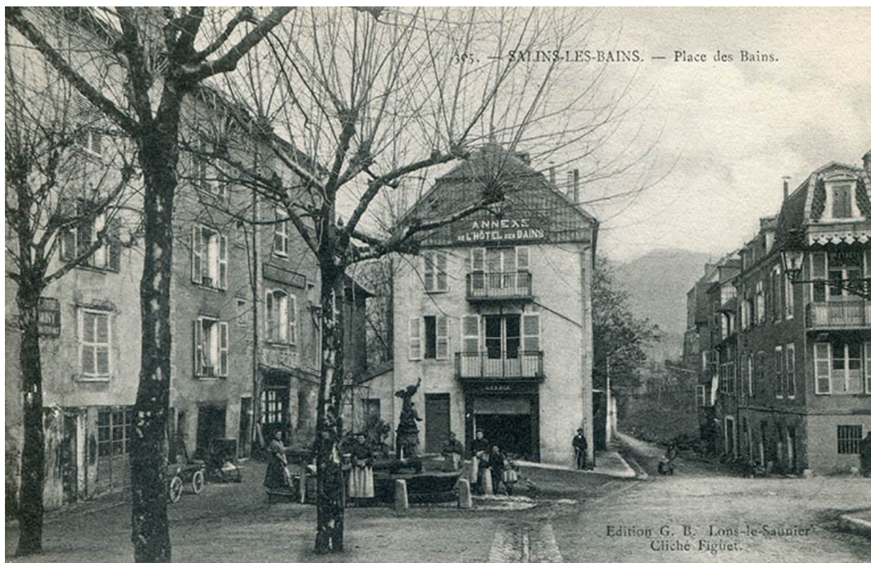
Salins-les-Bains - Place des Bains, s.d. [fin 19e ou début 20e siècle]. 39, Salins-les-Bains Place des Bains