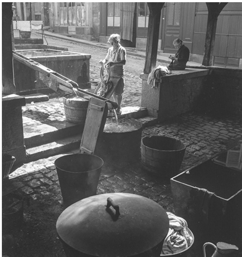
Scène de lessive au lavoir, s.d. [années 1960 ?]. 39, Salins-les-Bains rue d' Olivet