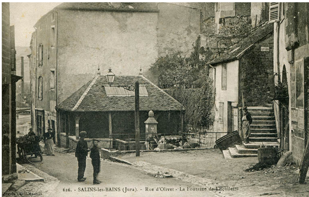
Salins-les-Bains (Jura) - Rue d'Olivet - La fontaine de l'Echilette, s.d. [fin 19e ou début 20e siècle].