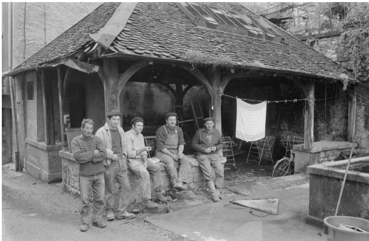
Démolition du quartier de Saint-Maurice. Des ouvriers posent devant le lavoir, s.d. [vers 1973] 39, Salins-les-Bains rue d' Olivet