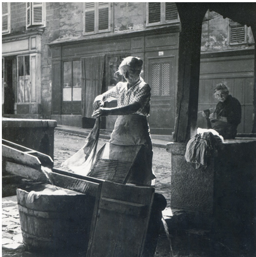
Scène de lessive au lavoir, s.d. [années 1960 ?]. 39, Salins-les-Bains rue d' Olivet