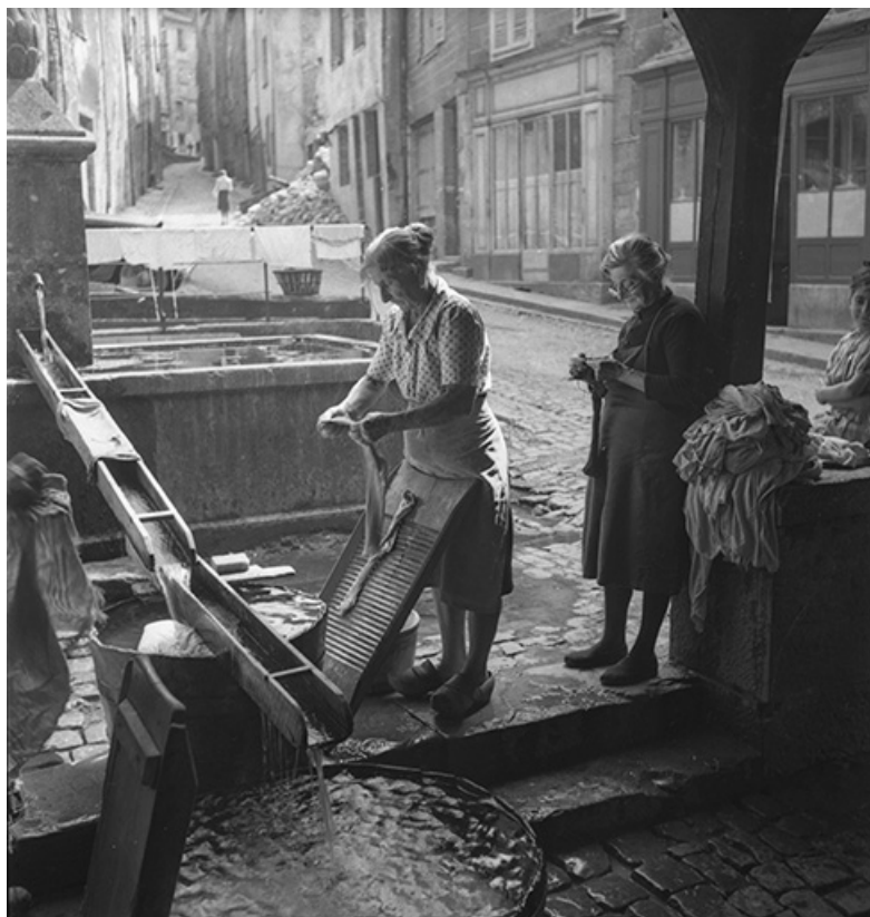
Scène de lessive au lavoir, s.d. [années 1960 ?]. 39, Salins-les-Bains rue d' Olivet