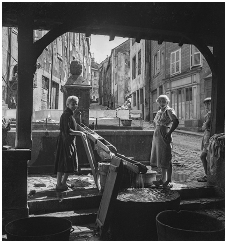
Scène de lessive au lavoir, s.d. [années 1960 ?]. 39, Salins-les-Bains rue d' Olivet