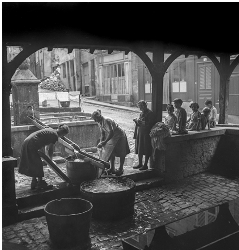
Scène de lessive au lavoir, s.d. [années 1960 ?]. 39, Salins-les-Bains rue d' Olivet