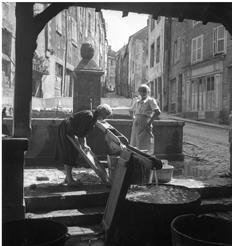
Scène de lessive au lavoir, s.d. [années 1960 ?]. 39, Salins-les-Bains rue d' Olivet