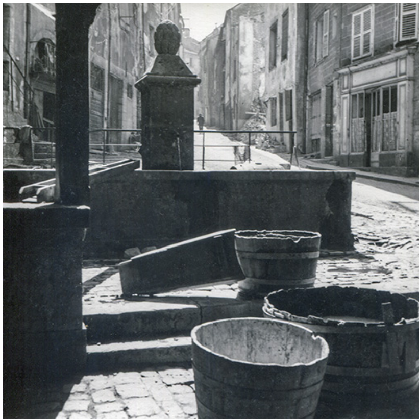
La fontaine vue depuis le lavoir, s.d. [années 1960 ?]. 39, Salins-les-Bains rue d' Olivet