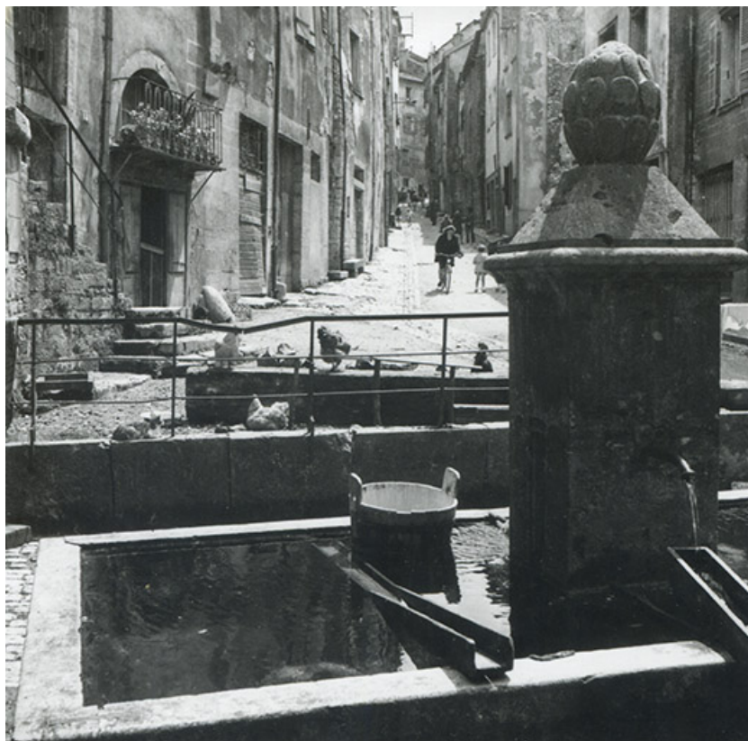
La rue d'Olivet et la fontaine au premier plan, s.d. [années 1960 ?]. 39, Salins-les-Bains rue d' Olivet